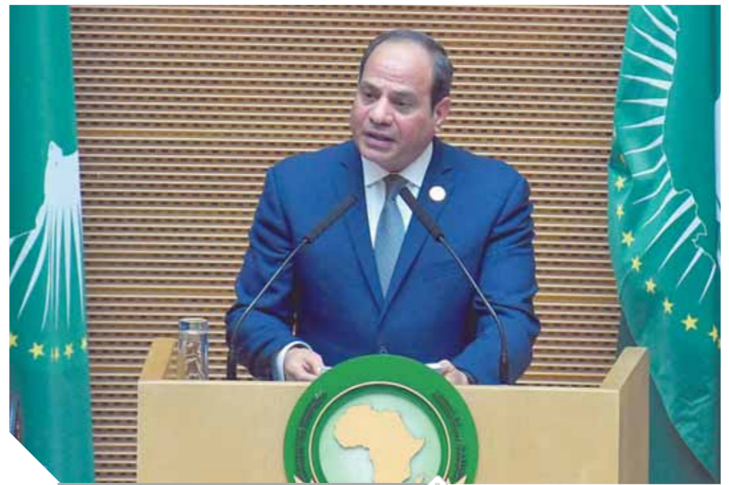
السيسي خلال إلقاء كلمته