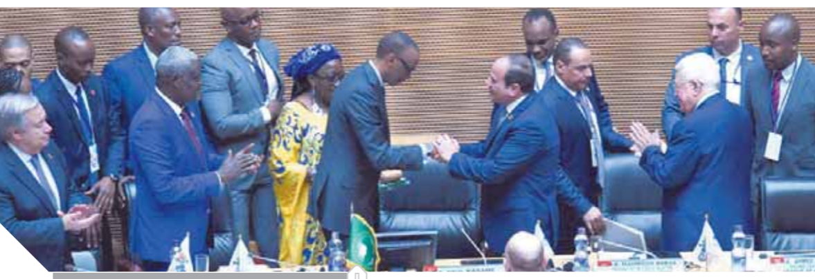
مصر تستلم الاتحاد الإفريقي