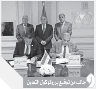
جانب من توقيع بروتوكول التعاون

التعاون مع الهيئة العربية للتصنيع إحدى قلاع الصناعة الوطنية التي تتعاون معها في تلبية مُطلبات العديد من المشروعات بالمحافظة، مُشيراً إلى أنه تم بحث مشاركة الهيئة في دعم المحافظة بالأنظمة الذكية، لتوفير المياه في إطار خطة الدولة لترشيد استهلاك المياه، ويتضمن البروتوكول التعاون، حيث تقوم الهيئة العربية للتصنيع بتدبير كل احتياجات محافظة مطروح في المشروعات الهندسية وتوريد آلات ومعدات رفع المُخلفات وتجهيز الملاعب الرياضية وأنظمة الطاقة المتجددة والنظم المُوفرة للطاقة ومحارق النفايات الطبية والإلكترونيات والآلات ومعدات أنظمة إطفاء الحريق وكاميرات المراقبة والعديد من مجالات التنمية الشاملة.