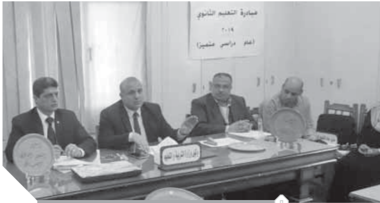
الإعلان عن انتظام العملية التعليمية للفصل الثاني

وأوضح عبدالرؤوف استداد المدارس لمبادرة رئيس الجمهورية، عبدالفتاح السيسي، 100 مليون صحة والتي تبدأ في الفصل الدراسي الثاني، أفاد وكيل التعليم بأنه تم دخول عدد 8 مدارس جديدة للخدمة خلال الفصل الثاني الدراسي الثاني، وتم افتتاح للتشغيل و4 مدارس تحت الإنشاء. وتشكل القدر أمس لمنع وقوع كارثة علي أثر سقوط سور ملاصق لمدرسة ابتدائية في الحوامدية، مما أسفر عن إصابة طالبين بجروح وكسور، كما شب حريق في ترام الرمل بالإسكندرية وتمكنت قوات الإطفاء من إنقاذ حياة مئات الطلاب.