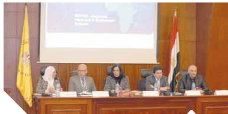
ورشة عمل لشرح فوائد المدفوعات الأفريقية

أعضاء الكوميسا كبديل متطور عن الطرق التقليدية، حيث يقلل النظام الجديد من الرسوم المصرفية الخارجية للبنوك المرسلات ويقلص الفترة الزمنية للتسوية بالإضافة إلى زيادة الثقة بين المتعاملين نتيجة لشراكة البنوك المركزية بالنظام. وأضاف أن النظام يقوم على إنشاء غرفة مقاصة لدول الكوميسا تتم من خلاله كل عمليات الدفع بين البنوك التجارية بالمنطقة ويقوم كل بنك مركزي بدور البنك المرسل للبنوك التجارية التابعة له، وتشترك كل دولة في النظام عن طريق بنوكها المركزي الذي يقوم بدور المشارك المباشر في النظام، وطبقاً لتلك الترتيبات فسيقوم البنك المركزي بتقنين عمليات الدفع واستلام التحويلات المالية التي تخص البنوك التجارية في دولته والتي تتم مع بنك تجاري أخرى باى من دول الكوميسا المشتركة بالنظام. وأوضح أن تفعيل الائتلاف جمهورية مصر العربية بالنظام هو نتاج التعاون المستمر في هذا المجال بين البنك المركزي المصري والبنوك المركزية الأفريقية، لافتاً إلى أن النظام الجديد يضم في عضويته حتى الآن، مصر، وكينيا، وأوغندا، والكونغو الديمقراطية، وزامبيا، ورواندا، وموريشيوس، وسوازيلاند ومالاوي، ومن المتوقع انضمام بقية الدول الأعضاء خلال الفترة المقبلة.