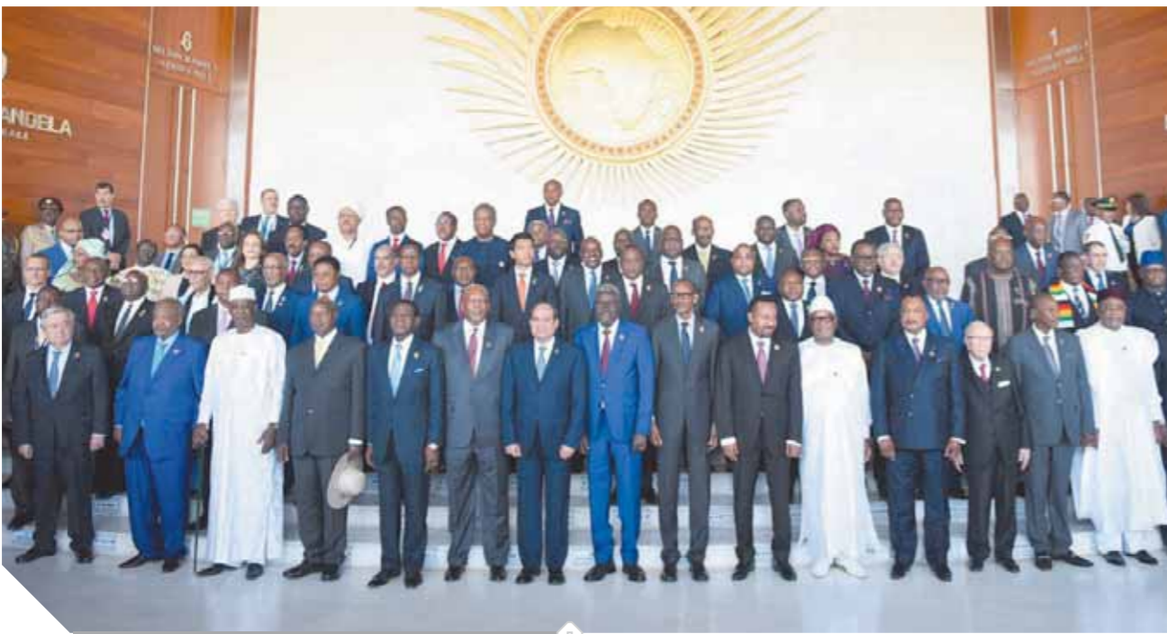
السيسي وسط زعماء ورؤساء إفريقيا