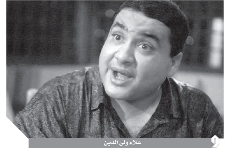
علاء ولى الدين

كتب - أمجد مصباح، يمر اليوم 16 عاماً على رحيل فنان كوميدى استطاع ترك بصمة رغم قصر عمره الفننى علاء ولى الدين، هذا الفنان صاحب الوجه والملامح البريئة الذى زرع البسمة فى كل عمل فنى شارك فيه، بدأ مشواره الفنى فى بداية حقبة التسعينات فى أدوار مساعدة فى أفلام: الإرهاب والكتاب، رسالة إلى الوالى، بخت وعديلة، وأيام الغضب، وأثبت موهبته تماماً. وفى عام 1995 شارك ليلي علوى ومحمد هنىدى ببطولة فيلم «حلق حوش» ونجح الفيلم، وواصل علاء ولى الدين رحلة الكفاح حتى عام 1999 عندما قام بالبطولة المطلقة لأول مرة فى فيلم «عبود على الحدود» وحقق الفيلم