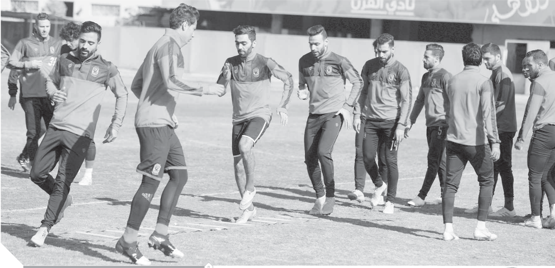
الأهلى يحتتم استعداداته لمواجهة سيمبا

بعد ترشيحه 3 ملاعب لاستضافة مباريات الفريق بالدورى