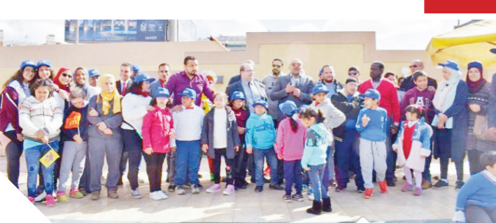
عدد كبير من الأطفال خلال مبادرة «زهو الزهور»