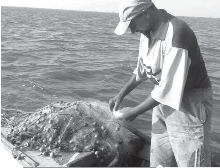
عودة الطيور المهاجرة من الصيادين إلى البحيرة مرة أخرى