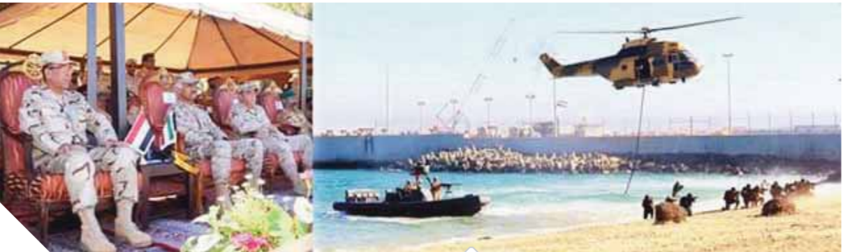
قادة الجيوش المشاركة في ختام الفعاليات

الجانبين عملية ناجحة للقضاء على بؤرة إرهابية مسلحة داخل منطقة سكنية وتطهيرها من العناصر الإرهابية وقامت القوات المشاركة بحصار وتطوير البنى الحيوية وعزل العناصر الإرهابية وتنفيذ عملية اقتحام وأسى لعناصر الصاعقة لقطع وعزل الإمدادات الخارجية ودفع مجموعات الإفتحام الرئيسية لتطهير المنطقة والسيطرة عليها والقبض على العناصر الإرهابية المتمركزة عليها ودخلها وتقديم الدعم الطبي للمصابين. ونقل اللواء أ. ح. ناصر عاصي، رئيس هيئة تدريب القوات المسلحة، تحيات وتقدير الفريق أول محمد زكى القائد العام للقوات المسلحة المصرية والكويتية.