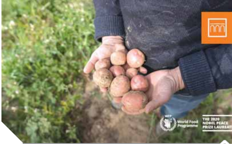
تعاون بنك الإسكندرية مع برنامج الأغذية لتحسين مستوى المعيشة للمزارعين