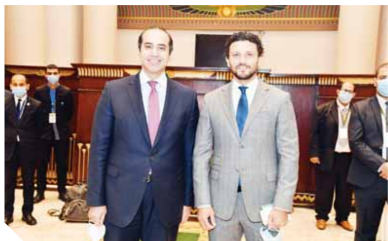
استخراج بطاقات العضوية للنواب المعينين