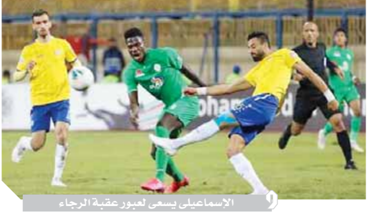
الإسماعيلي يسعى لعبور عقبة الرجاء