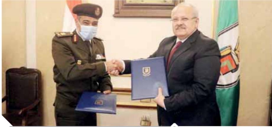
الختتم خلال توقيع البروتوكول مع القوات المسلحة

كتب- محمد صلاح وأبو زيد كمال وسامية فاروق؛ فى إطار حرص القيادة العامة للقوات المسلحة على تبادل الخبرات العلمية ودعم الأنشطة البحثية بين القوات المسلحة والجامعات المصرية وتحقيق أقصى درجات التعاون المتميز فى شتى المجالات تم توقيع بروتوكول التعاون العلمى والبحوث المشترك بين مركز البحوث الطبية والطب التجديدى وجامعة القاهرة بهدف تطوير العملية البحثية والتعليمية الشاملة، وذلك بحضور مدير مركز البحوث الطبية والطب التجديدى ورئيس جامعة القاهرة.