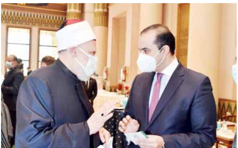
استخراج بطاقات العضوية للنواب المعينين

كتب - حازم العبيدى: ينطلق غداً قطار مجلس النواب الجديد من أولى محطاته وهى الجلسة الافتتاحية، وسط إجراءات احترازية مشددة.