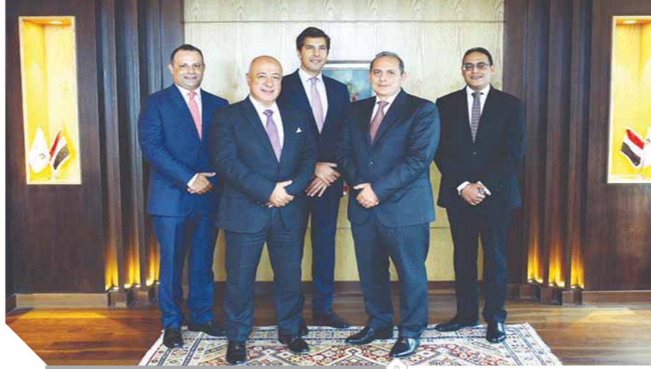
قيادات البنك مع قيادات قطاع القروض المشتركة

حصل البنك الأهلى المصرى على المركز الأول كأفضل بنك فى السوق المصرفية المصرية عن قيامه بالأدوار المختلفة وهى وكيل التمويل ومرتب رئيسى ومسوق للقروض المشتركة، وذلك بعد رصد حصاد أداء البنك طوال العام وفقاً لتقييم مؤسسة بلومبرج العالمية لعام ٢٠٢٠ وتشير النتائج إلى حصول البنك على المركز الأول على مستوى قارة أفريقيا ومنطقة الشرق الأوسط وشمال أفريقيا عن القروض المشتركة التى قام البنك فيها بدور مرتب رئيسى ومسوق للقروض المشتركة، وعلى المركز الثانى كوكيل للتمويل فى قارة أفريقيا، وفى منطقة الشرق الأوسط وشمال أفريقيا وذلك بعد العديد من بنوك ومؤسست دولية، حيث استطاع البنك الأهلى المصرى إدارة خمس وثلاثون صفقة تمويلية خلال العام بقيمة إجمالية تخطت ٣١٥ مليار جنيه مصرى.