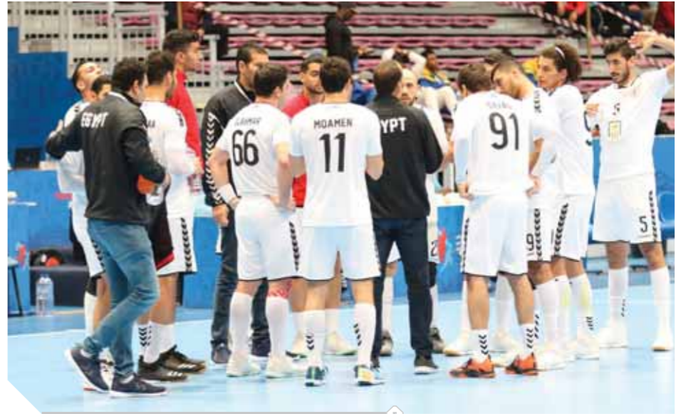
منتخب اليد يواصل استعداداته للمونديال