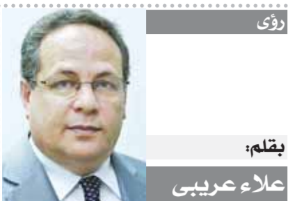
بقلم: علاء عربي

بختية عطا، والمثلية بدأم هاني» قالت إنها واجهت الأحوال لتربية ابنتها من بيع الصحف والمجلات، والذي أصبح على غير المعتاد ومقارنة بالسنوات الماضية، وتابعت: «الناس زمان كانت بتقرأ جرائد والساعة ١٠ الصبح تلاقى كل الجرائد خلصت.. دولتي نص شركة المياه في انتظار تليفون طوارئ بوجود بالوعة مغلقة تحتاج للتسليك، خاصة في وقت المطر حتى لا تتوقف حركة المرور في الشوارع. أحد الجنود المجهولين داخل شركة المياه، والملقب بصاحب الهام الصعبة» تجده كثيراً تحت الأمطار يحاول تسليك البالوعات وشفط المياه، ليالي طويلة تخلى فيها عن الإحساس بالدفع، مع الأسرة في سبيل خدمة المواطنين، «لما بيكون فيه أمطار بيبيط طالع من بيبي روي على كفي.. قالها عامل التسليك وهي يشعر بالفخر لما يقوم به، ففي الوقت الذي يسرع فيه المواطنون في الشوارع هرباً من مياه الأمطار ويحتمون بمنازلهم، يبدأ عمل «عم