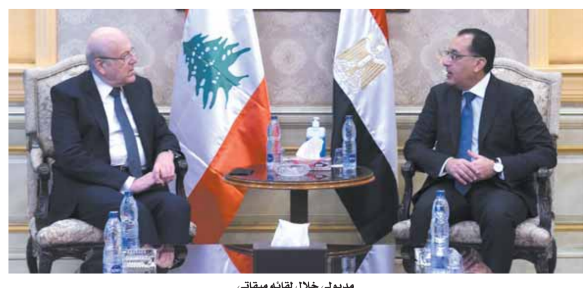
مدبولي خلال لقائه ميقاتي

كما تطرق رئيس الوزراء إلى المطالب التي عرضها رئيس الحكومة اللبنانية، مؤكداً أنها مطالب مهمة للغاية، منها ما يتعلق بمجال الطاقة، ويشكل خاص الربط الكهربائي، وتقديم الدعم في مجال الغاز الطبيعي من أجل توليد الطاقة الكهربائية بصورة عاجلة للشعب اللبناني الشقيق.