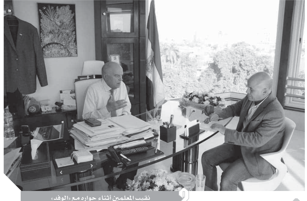
نقيب المعلمين أثناء حوار مع «الوفد»