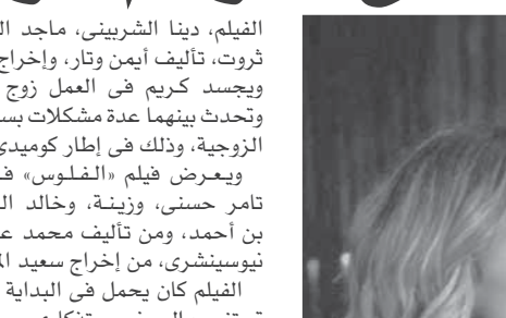
كريم عبدالعزيز ودينا الشربيني في مشهد من فيلم، البعض لا يذهب للمأذون مرتين

موسم سينمائي ساخن ينتظره الجمهور في رأس السنة، فمع بداية العام الجديد تتنافس ١٠ أفلام في قاعات العرض السينمائي، الموسم يمثل عودة قوية لكبار نجوم السينما من بينهم كريم عبدالعزيز وتامر حسنى وأحمد عز والسقا، ويعقب على معظم أفلامها الطابع الكوميدي و٢ أفلام مزيج بين «الآليات» والرومانسى وفيلمين أكثرن.