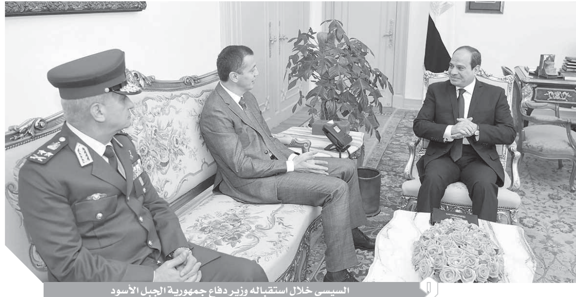
السياسي خلال استقباله وزير دفاع جمهورية الجبل الأسود