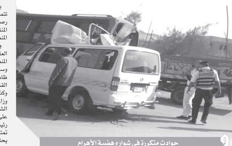
حوادث متكررة في شوارع هضبة الأهرام

وطالب أهالى المنطقة اللواء أحمد راشد محافظ الجيزة بالنظر إلى الأهالى بين الرحمة وانتشالهم من مياه الصرف الصحي التي أصبحت خطراً يهدد أرواح الكبار والصغار من الأهالى، مطالبينهم بزيارة إلى شوارع المنطقة لى يرى الوضع الذى آلت إليه الشوارع والمساة التي يعيشها الأهالى.