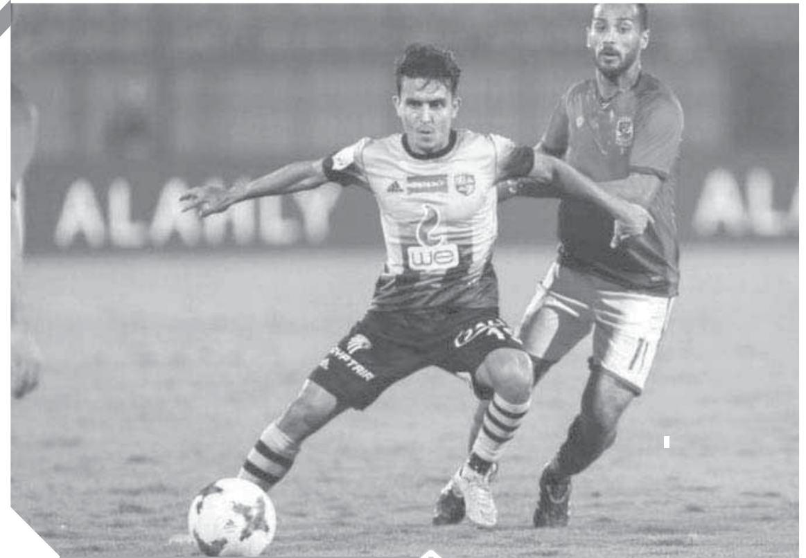
المقاولون عينه على كأس مصر

وأكد رضوان أن دور قطاع الناشئين القيام بإعداد اللاعب للفريق الأول بحيث يكون لاعبا شبيه متكامل أي لاعبا محترفا يستطيع النادي أن يستفيد به وقادرا أيضا على أن يخوض تجربة خارجية سواء معايشة أو الاحتراف، وخير مثال في النادي تجربة محمد صلاح نجم ليفربول وكذلك تجربة محمد النتي نجم أرسنال.