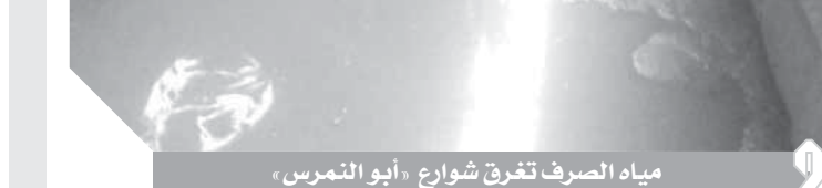
مياه الصرف تغرق شوارع أبو النمرس