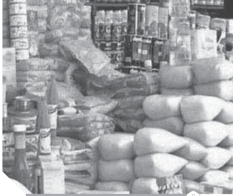
استمرار صرف السلع التموينية بالأسعار الجديدة

أضاع على الدولة مليارات الجنيهات، وبالتالي عندما عادت الأمور إلى نصابها الحقيقي، حققت الوزارة مكاسب كثيرة لصالح الدولة فقد أعطى «المصيلحى» قبلة الحياة للوزارة، كما أنه ساعد فى توافر أصناف مختلفة من السلع تصل إلى ٢٠ سلعة بعد أن كانت ٣ سلع فقط وأحياناً غير موجودة فكان القائلون كثيراً ما يضطرون لاستلام سلعة واحدة فقط من مخازن الجملة.