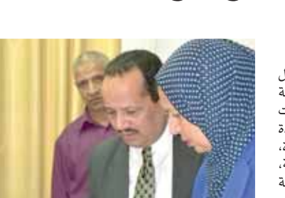
الحافظ يطمئن على المصابين

أصيب ١٧ طالباً بمدرسة طلخا الرسمية للغات خلال وجودهم بأحد ملاهى المنصورة، حيث سقطت عليهم ماكينة تستخدم فى الألعاب، ما أسفر عن العدى من الإصابات فى صفوف التلاميذ، بداية كانت يلاًغاً لشربة التجميد فبين سقطوا إحدى الألعاب بملهى براديس بالمنصورة، وانتقل عدد من ضباط المباحث وسيارات إسعاف للحديقة، على الفور تم نقل المصابين لأحد المستشفيات الخاصة حيث كان هناك ٨ تلاميذ حالتهم خطيرة، فيما تم إجراء الإسعافات اللازمة لـ ٤ حالات، وقام الأطباء بفحصهم وسمجوا لهم بالخروج من المستشفى. وقرر الدكتور أيمن مختار محافظ الدقهلية غلق مدينة الملاهى التى شهدت الواقعة، كما قرر اتخاذ كل الإجراءات القانونية تجاه صاحبها، وتم تحرير محضر بالحادث، وبدأت النيابة العامة التحقيق فى الواقعة، وكلف محافظ الدقهلية الجهات المختصة بتشكيل لجنة للمرور على مختلف الملاهى وفحصها وتقديم تقرير مفصل عن حالة كل المعدات التى تحتويها ومدى صلاحيتها للعمل وتوافر معايير السلامة والأمان فى كل منها.