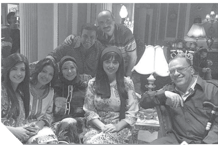
مشهد من مسلسل «عائلة الحاج نعمان»