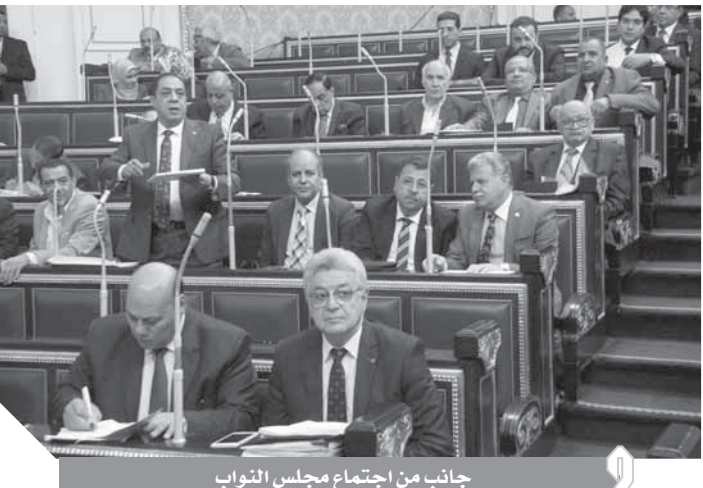
جانب من اجتماع مجلس النواب

قال المستشار عمر مروان، وزير شؤون مجلس النواب، إن استعراض مصر تقريرها أمام الآلية الدورية الشاملة بالمجلس الأسمى لحقوق الإنسان أحد أهم المكاسب التى تحققت الفترة الماضية، لاسيما أنه وضع المجتمع الدولى أمام حقيقة الأوضاع فى القاهرة، وكشف حجم زيف الآلة الإعلامية العدائية.