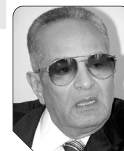
بهاء الدين أبوشقة