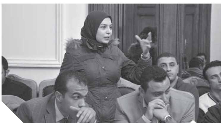
الوفد حريص على منح الفرصة للمرأة في المشاركة السياسية