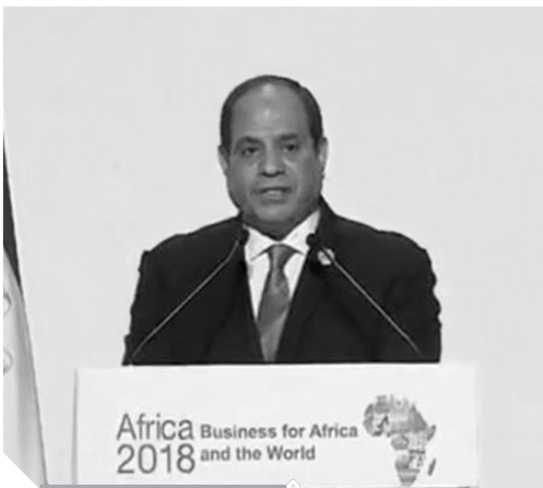
الرئيس السيسي أثناء إلقاء كلمته في منتدى إفريقيا 2018

وتابع الرئيس:«إننا نطمح لتحقيق هذه الأهداف، من خلال العمل المشترك تحت مظلة الاتحاد الإفريقي، الذي تشرف مصر