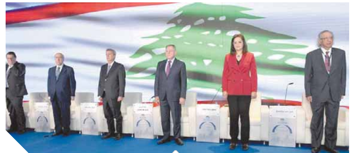
الجلسة الافتتاحية لمؤتمر المصارف العربية

و دعم المؤسسات المالية في تبني أفضل البرامج والتجارب التي أثبتت نجاحها وفعاليتها في إطار التمكين الاقتصادي للشباب والمرأة، وفتحت مشاركون إلى أهمية تمويل وتطوير البنية التحتية الاقتصادية وتوسيع وتطوير الخدمات المالية القائمة كمنصات رأس المال الاستثماري والتمويل الملائكي والتعاون الجماعي بالإضافة إلى تطوير آليات تمويلية تتوافق مع التمويل الإسلامي. وتحفيز وإطلاق العنان للإبتكار والإبداع لدى الشباب من خلال تطوير وتحديث مناهج التعليم وتشجيع الاستثمار والتعاون والشراكات بين رواد الأعمال لتحقيق النمو الاقتصادي.