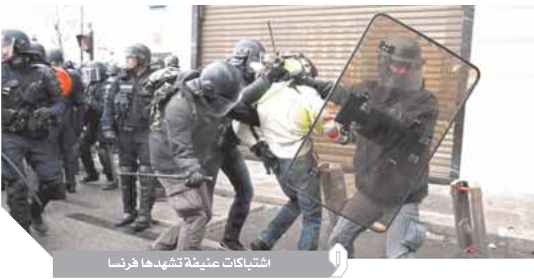
اشتبكات عنيفة تشهدها فرنسا

يوم على الحوادث. . . يأتي ذلك في الوقت الذي شهدت فيه العلاقات الأمريكية الفرنسية تجاذبات ومشاحنات رسمية تمثلت في رد نائب من حزب الرئيس الفرنسي إيمانويل ماكرون على الرئيس الأمريكي، الذي تحدث السبت عن «نهار حزين» في باريس بسبب «السترات الصفراء»، حيث كتب النائب الفرنسي على تويتر أن «دونالد (ترامب) المخرف مصاب باضطرابات دماغية»، ووجه إليه