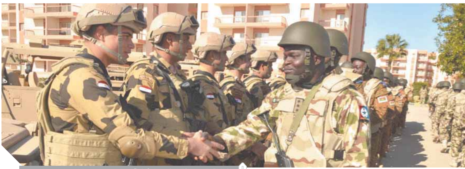
فحاليات التدريب المشترك في مجال مكافحة الإرهاب بين عناصر دول الساحل والصحراء

القوات على الأرض. وتتقسم الدول الإفريقية المشاركة في التدريبات، إلى عدة مجموعات تنفذ على مراحل زمنية مختلفة لتشمل مختلف الدول الأعضاء في تجمع الساحل والصحراء بما يساهم في دعم أمن واستقرار القارة الإفريقية، ومواجهة التهديدات والتحديات التي تتعرض لها دول القارة.