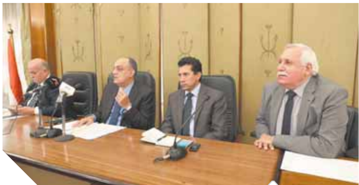
وزير الشباب أثناء حديثه أمام لجنة المشروعات بالبرلمان