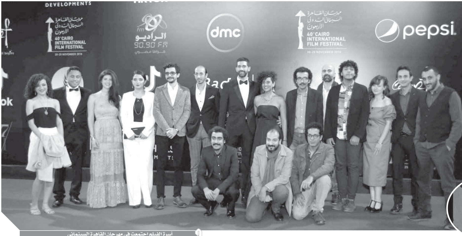
أسرة الفيلم اجتمعت في مهرجان القاهرة السينمائي

لم يحظَ فيلم «لا أحد هناك» للمخرج الشاب أحمد مجدي خلال مهرجان «القاهرة السينمائي» في نسخته الأربعين بالقدر ذاته من الاحتفاء الذي واجهه كفتان. كان هناك جمهور عريض تواق لمشاهدة الفيلم، وتقاد معجبون بفنه كممثل يتقونه كونه أولى تجاربه في ميدان الإخراج، لكن الأراء تبددت بعد عرضه الأول في مهرجان القاهرة، حيث سيطر «الغموض» على قصة الفيلم، واختلط الأمر على عدد من المشاهدين بعد اختياره لـ«الزرافة» كتيمة للفيلم. تعددت الآراء وتباينت الانطباعات، لكن في النهاية اتفق النقاد على أن الفيلم يحمل رسائل ضمنية هامة قد يصعب على المتلقي العادي فهمها، ورغم أن القصة الأساسية للفيلم هي رحلة بحث أحد الشباب عن أموال يساعد بها فتاة لا يعرفها لعمل عملية إجهاض، إلا أنه يتورط في النهاية مع مجموعة من الشباب يودون كشف سر الزرافة المحبأة في حديقة الحيوان، وإلى جانب سيطرة لغز الزرافة على اهتمامات الناس، حاولت «الوفد» صناعت العمل لفك شفرة الفيلم واتضح رؤيته ورسالته التي ما زالت تحمل بعض الغموض.