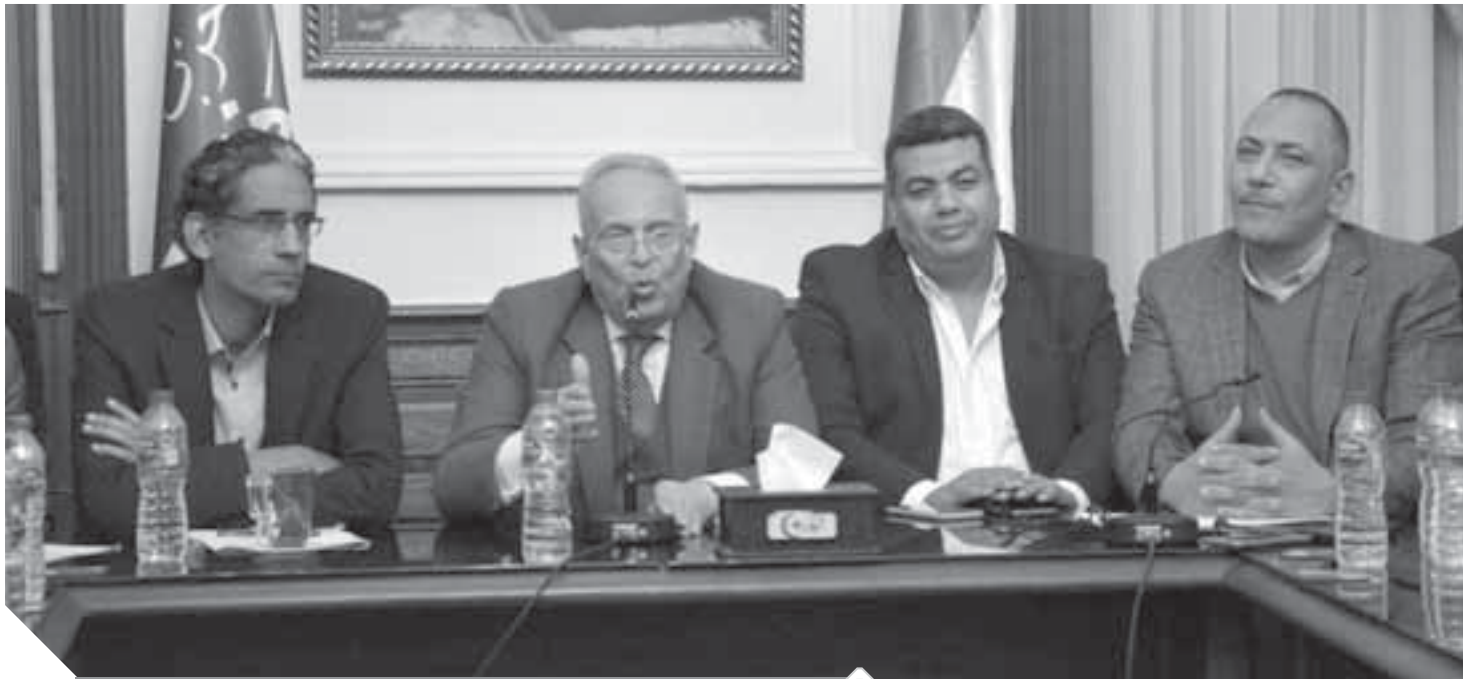
المستشار بهاء الدين أبوشقة يرأس اجتماع رؤساء لجان شباب الوفد بالمحافظات

عقدت اللجنة النوعية للشباب بحزب الوفد اجتماعاً برؤساء لجان الشباب بالمحافظات برئاسة المستشار بهاء الدين أبوشقة، رئيس حزب الوفد ورئيس اللجنة التشريعية بمجلس النواب، لتقديم المقترحات والأفكار التي سوف تنفذ الاحتفال بمئوية الوفد وثورة 1919. ومن جانبه رحب المستشار بهاء الدين أبوشقة رئيس الوفد، بالحضور قائلاً: «أرحب بكم جميعاً شباب حزب الوفد، هذا الشباب الذي أرى أن له دوراً في مستقبل مصر والوفد لاننا عندما نسترجع التاريخ نجد أن الشباب الوفدي والمرأة الوفدية كان لهما دور وطني محفور في التاريخ بأحر من نور، والذي بدأ في ثورة 1919، ومن ثم فإن دور شباب الوفد في هذه المرحلة التي نعيد فيها بناء الحزب وأنا أقصد هذه الكلمة وهي بناء الحزب حتى تثبت أن ما يريده البعض من المفرضين عبر وسائل التواصل الاجتماعي كذب واقتراء».