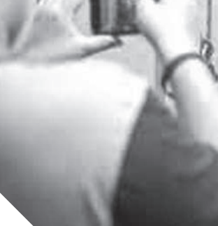
الاعتداء اللفظي والبدني على الأطفال