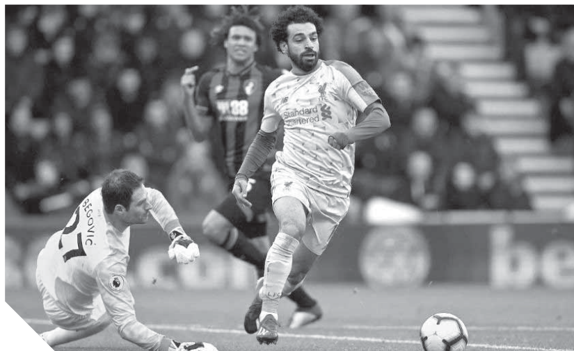
محمد صلاح تلاعب بدفاعات بورنموث وسجل هدفا رائعا