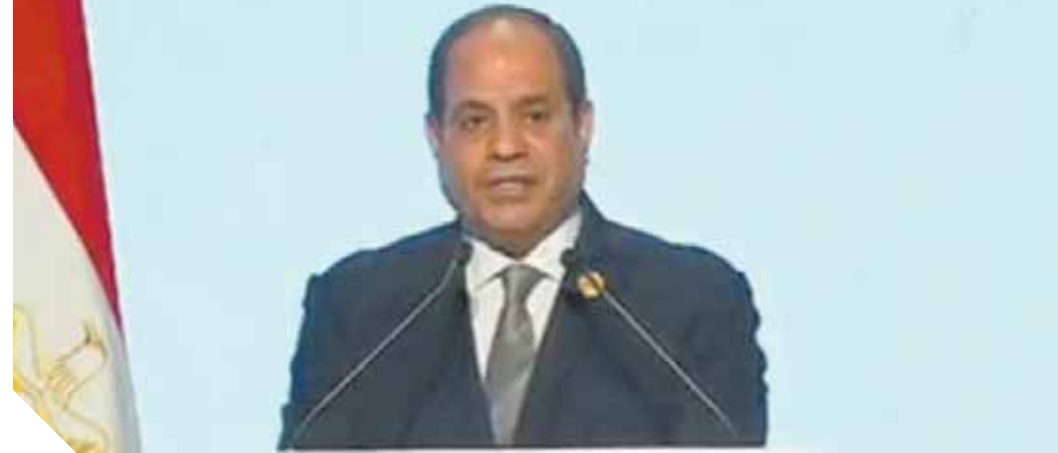
الرئيس السيسي يلقي كلمة افتتاح منتدى إفريقيا 2018

مصر حريصة على مصالح القارة السمراء وتدعم شبابها ونساءها