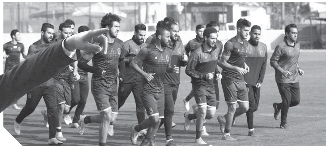
الأهلي ينتظر حسم الملفات الشائكة