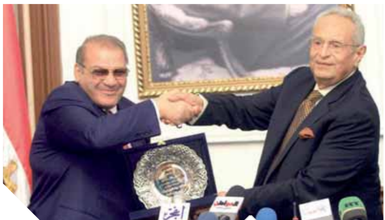
أبو شقة يمنح راتب حزب الوفد

كتب - ناصر عبدالمجيد: يشارك الرئيس عبدالفتاح السيسي اليوم في أعمال القمة الثلاثية السادسة بين مصر واليونان وقبرص التي تعقد في إيولندا بجزيرة كريت باليونان. من المقرر أن تبدأ أعمال القمة باجتماع ثنائي منفصل بين الرئيس السيسي والرئيس القبرصي نيكوس أنتاستاسيادس ورئيس الوزراء اليوناني الكسيس تسيبراس، ثم يجتمع الزعماء الثلاثة في مشاورات مطولة مع وفود الدول الثلاث، ومن المقرر أن توقع الدول الثلاث سلسلة من الاتفاقيات ومذكرات التفاهم، كما يتحدث الزعماء