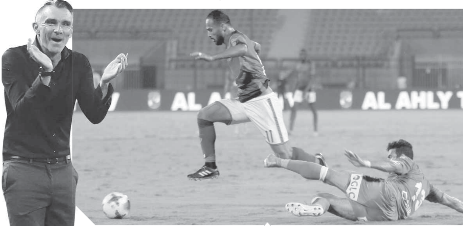
الأهلي يسعى لعبور الترسانة