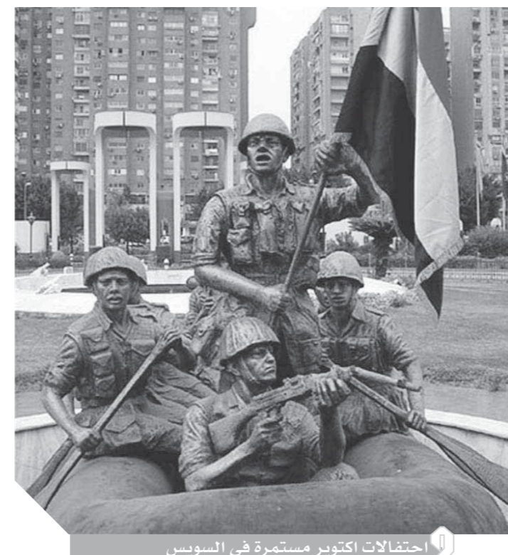
احتفالات أكتوبر مستمرة في السويس

حرصاً من القوات المسلحة على إثراء الوعي الثقافى والفكرى للأجيال الجديدة، وتعريفهم بالإمجاد والبطولات العسكرية المصرية والعربية على مر العصور، نظمت هيئة البحوث العسكرية المعرض السنوي الحادى عشر للثقافات العسكرية «ذاكرة أكتوبر 2018»، والذي يقام في الفترة من 8 وحتى 11 أكتوبر الجارى ببانوراما حرب أكتوبر، وذلك في إطار احتفالات مصر والقوات المسلحة بالذكرى الـ 45 لانتصارات أكتوبر المجيدة.