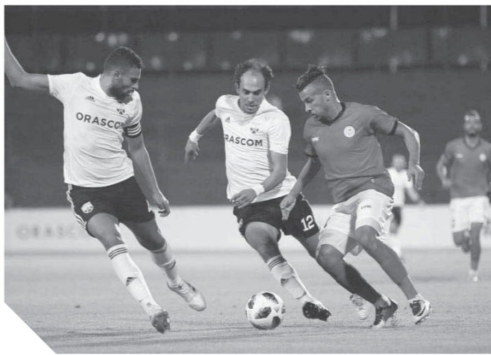
الجونة يتقدم مستوى جيداً في الدوري ويسعى للفوز في الكأس

يلتقى فريق وادي دجلة مع نظيره الجونة في الخامسة مساء، على ملعب بتروسبور، في أقوى مباريات دور الـ32 من بطولة كأس مصر وتبدو المواجهة متكافئة بينهما في ظل تقارب مستوى الفريقين، فيما يخوض فريق مصر المقاصة مواجهة سهلة أمام أبو قير للأسمدة على ملعب ستاد المقاولون العرب في الثامنة مساءً. يبحث الجونة أبرز الفرق الصاعدة للدوري في الموسم الحالي في ظل منافسته على الرمز الذهبي واحتلاله المركز السابع برصيد 13 نقطة، رغم قوة الإمكانات، عن انطلاقته قوية في بطولة الكأس بالرغم من صعوبة المواجهة أمام دجلة الطامح في اكتساب الثقة بانتصار في بطولة المفاجآت.