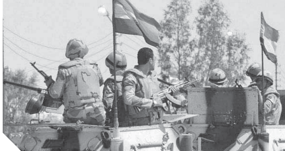
قوات انشاد القانون في سيناء تواصل جهودها في مكافحة الإرهاب