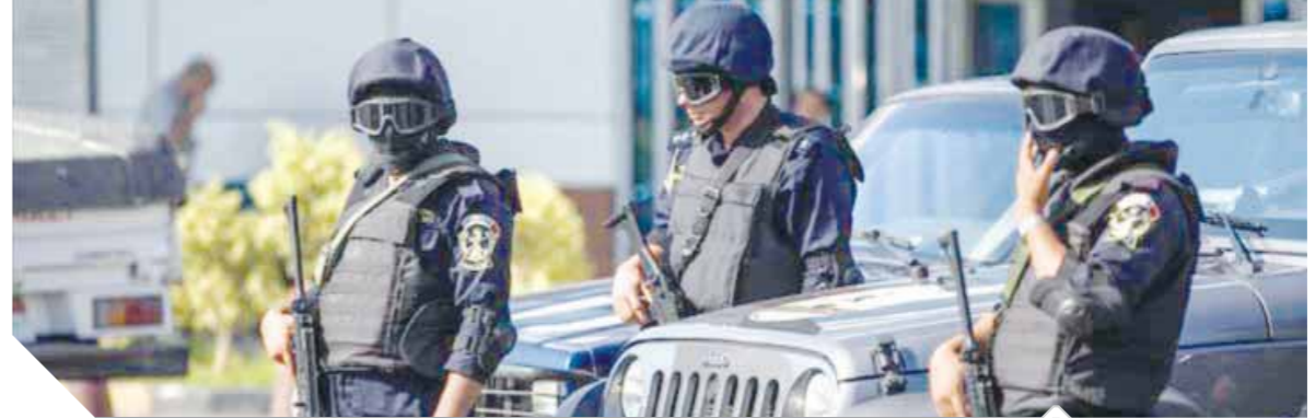
سيطرة أمنية واسعة في سيناء صورة أرشيفية

وجهت قوات الأمن ضربة استباقية جديدة للإرهاب، وردت معلومات لقطاع الأمن الوطني تفيد اتخاذ 10 عناصر إرهابية من إحدى المزارع المهجورة بمنطقة العبر بالعريش ماوي لهم .. واعتزامهم القيام ببعض العمليات العدائية، قامت قوات الأمن بمهاجمة تلك العناصر بالمزرعة، مما أسفر عن مصرعهم جميعاً عقب تبادل لإطلاق النيران وعثر بجوزيتهم على ٢ بندقية، ٢ بندقية خرطوش، ٢ عبوة ناسفة معدة للتفجير وكمية كبيرة من الذخائر.