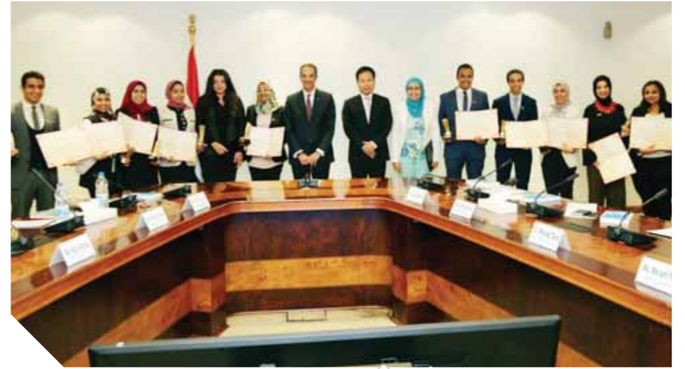
تكريم متميز لطلبة المعهد

القومى للاتصالات، يحصل المتدربون المتميزون منهم على تدريب وظيفى بالإضافة إلى أولوية التعيين بشركة هواوى العالمية والشركات المحلية شركاء هواوى فى المنطقة. كما توفر شركة هواوى وهئا للاتفاقية معملا إلكترونيًا متكاملًا للاتصال عن بُعد عبر الإنترنت وذلك للتدريب على معدات هواوى LTE فى مقر شركة هواوى، مضافةً أن المعهد سيكون مسئولًا عن اختيار متدربين متميزين للالتحاق بدورات هواوى LTE ويجب أن يكون المرشحون طلابية فى جامعات مصرية فقط أو خريجين جدد.