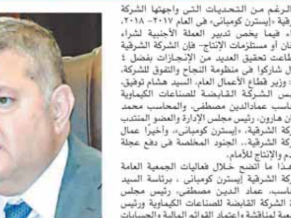
محاسب/ هشام توفيق وزير قطاع الأعمال العام