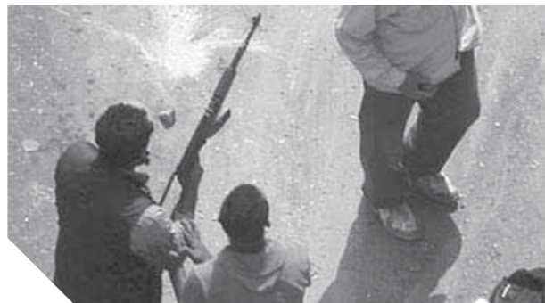
مصر حريصة على القضاء على الإرهاب

كما تواصل قوات الشرطة التى تقود جهود مكافحة الإرهاب فى محافظات الوادى الجهود الخاصة بتتبع الخلايا والعناصر الإرهابية وإحباط مخططاتهم وكشف الأوكار التى تخبئونها فيها. وتعد عملية الواحات الغربية التى وقعت فى أكتوبر 2017 مثلاً مهماً على تلك العمليات.