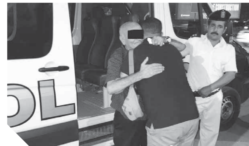
الشرطة تصطحب المسن من الشارع لتوصيله لاهله