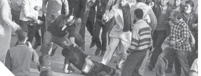
أحداث ثورة يناير 2011

ومحول كهرباء، حيث وصلت خسائر قطاع الكهرباء إلى 480 مليون جنيه، وبلغت تكلفة الإصلاحات 100 مليون جنيه، السياحة: وصلت خسائر القطاع إلى نحو 75 مليار جنيه خلال الأعوام الثلاثة بعد أن وصل حجم الاستثمار بالقطاع إلى نحو 255 مليار جنيه، سوق المال: هبط المؤشر الرئيسى «إيجى اكس 30»، الذى يقيس أداء أنشط 30 شركة، أكثر من 10.4%، نحو أدنى مستوياته منذ أواخر يناير 2015، وأشار عدد من الخبراء الاقتصاديين إلى أن خسائر مصر من إرهاب دولة قطر وصلت إلى 130 مليار دولار.