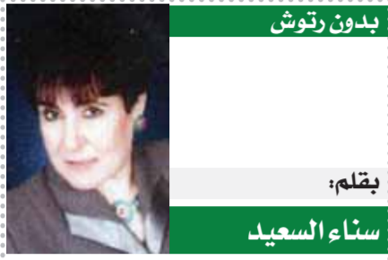
بقلم: سناء السعيد