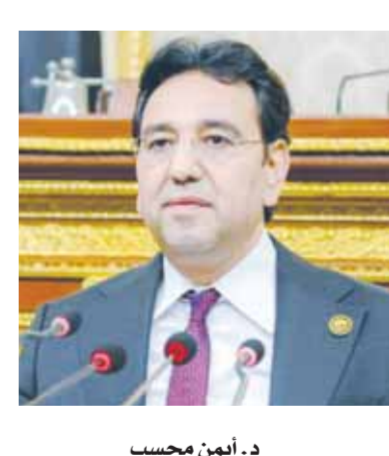
د. أيمن محسب

وأوضح «محسب»، أن مشاركة مصر في هذه القمة تكسب مكانتها كدولة محورية في منطقة الشرق الأوسط، وإفريقيا، لافتاً إلى أن مصر تلعب دوراً مهماً في الحفاظ على الاستقرار السياسي إقليمياً، وهو ما يعكس على الصعيد الاقتصادي، من خلال توفير فرص استثمارية مهمة للمستثمرين الأجانب على أراضيها، كما