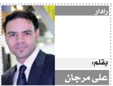
بقلم: على مرجان

وتنص المادة ٢٢٦ من قانون العقوبات على أنه يعاقب بالسجن من ٣ إلى ٧ سنوات كل من ارتكب جريمة الضرب المفضى إلى الموت، وتصل العقوبة إلى السجن المؤبد إذا عمداً إذا ثبت ارتكابها بغرض إرهابي، فلا بد من النظر في تعديل هذا القانون حتى تكون العقوبة فيه على الإعدام شتقاً، حيث إن التعذيب أشنع كثيراً من إنهاء الحياة بأى وسيلة بعيداً عن التعذيب الذي يقع على طفل بريء لا يعرف معنى كلمة تعذيب ولا يعرف ما الذنب الذي ارتكبه حتى يذوق من العذاب أشكالاً وألواناً.. وللحديث بقية.