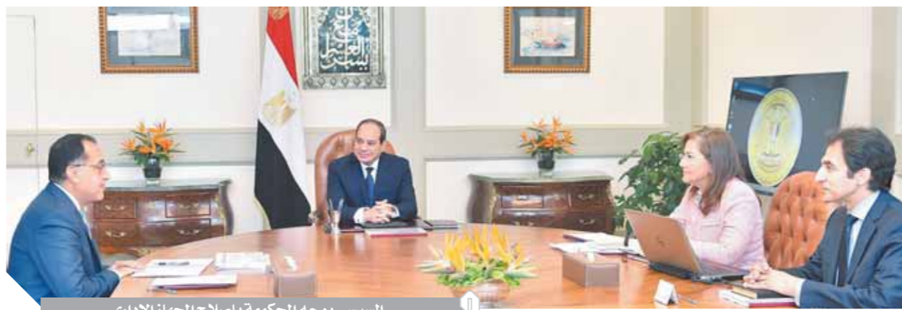
السيسي يوجه الحكومة بإصلاح الجهاز الإدارى

وجه الرئيس عبدالفتاح السيسى بتفيذ خطة الإصلاح الشامل للجهاز الإدارى للدولة على أساس رؤية شاملة تتضمن تحفيز العناصر البشرية التي تثبت كفاءة وجدارة في عملها. جاء ذلك خلال اجتماع الرئيس، أمس، مع كل من الدكتور مصطفى مدبولى رئيس مجلس الوزراء، والدكتورة هالة السعيد وزيرة التخطيط والمتابعة والإصلاح الإدارى. وصرح السفير سام راضى، المتحدث الرسمى باسم رئاسة الجمهورية، بأن الرئيس أطلع خلال الاجتماع على تطورات تنفيذ خطة الإصلاح الشامل للجهاز الإدارى للدولة، وكذا مستجدات تنفيذ خطة تطوير بنك الاستثمار القومى، وقد وجه السيسى خلال الاجتماع بأن يتم إيلاء الإصلاح الإدارى والمؤسسى لجميع جهات الدولة العناية والأولوية اللازمة في ضوء أهميته البالغة في الارتقاء بمستوى الأداء الحكومى والخدمات المقدمة للمواطنين، واعتماد معايير للجودة والتميز في تقديم الخدمات للمواطنين، بالإضافة إلى الاستفادة من تطورات التكنولوجيا الحديثة في الإدارة العامة، من خلال التوسع في تقديم الخدمات الحكومية الإلكترونية للمواطنين، وأخذاً في الاعتبار ما تسهم به في التيسير عليهم وزيادة كفاءة الأداء الحكومى، كما أكد الرئيس أهمية استغلال الانتقال إلى العاصمة الإدارية الجديدة لتعزيز جهود الإصلاح الإدارى، بحيث يمثل نقلة نوعية إلى مستقبل العمل