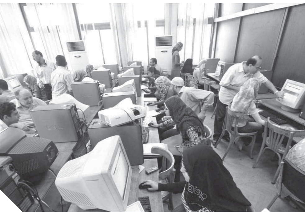
مكتب التنسيق يبدأ في إرسال ملفات الطلاب إلى الكليات والمعاهد المرشحين لها

ويتم التحويل لمرة واحدة فقط، ويشترط استيفاء الشروط الإضافية للكلفة المردد التحويل إليها (مثل اجتياز اختبار القدرات)، وتكون المفاضلة بين الطلاب على أساس مجموع درجات الطالب في شهادة الثانوية العامة، ويسمح للطلبة الذي تم ترشيحه في عملية التنسيق إلى أحد المعاهد العالية الخاصة أو المتوسطة بالتقدم للتحويل الإلكتروني فقط إلى معهد آخر في ذات التخصص أو تخصص آخر غير مناظر بشرط استيفاء الطالب للحد الأدنى المعلن للمعهد المراد التحويل إليه وفي ضوء النسبة المقررة والطاقة الاستيعابية بأسبقية المجموع.