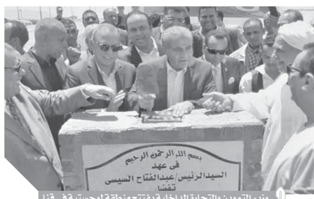
وزير التعمير والتجارة الداخلية يفتتح منطقة لوجستية في قنا

● ما الفائدة على السوق المصرى من طرح الأراضى للاستثمار؟ ● أغلب الأراضى التي تم ترسيبها على مستثمرين سوف تترى الثور بعد عامين من الآن ونحن في متابعة مستمرة مع المستثمر، لذا سوف يشهد السوق المصرى خاصة محافظات الصعيد وعلى رأسها قنا والأقصر بالإضافة إلى محافظة النوبى الجديد نقلة غير مسبوقة خاصة وان المشروعات الجديدة تتيح آلاف فرص العمل للشباب فقد تم محافظات الصعيد طاردة لأهلها كما كان من قبل.