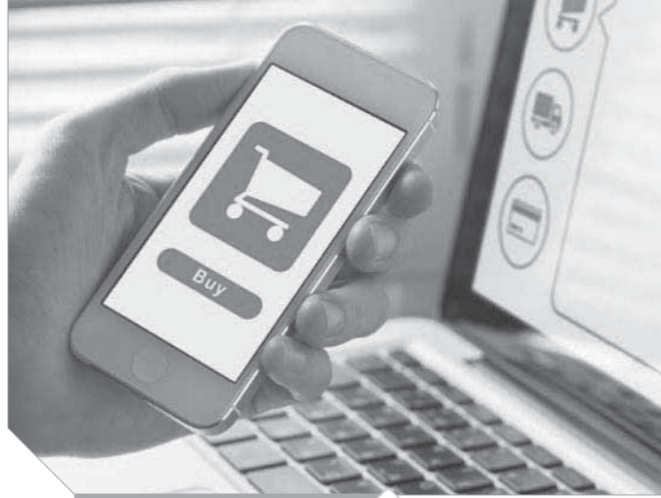
عمليات النصب عرض مستمر