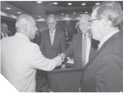
وزير النقل خلال لقائه مع وفد شركة بكتيل الأمريكية

وتمة الاتفاق على عقد مسئولى الشركة لقاءات كحفئة مع مسئولى هيئات وزارة النقل لتحديد المشروعات التي يمكن التعاون بها حسب الاحتياجات والأولويات الخاصة بكل هيئة.