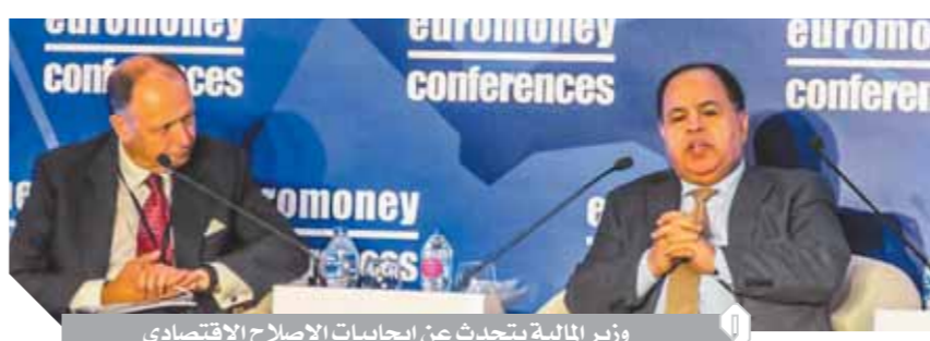
وزير المالية يتحدث عن إيجابيات الإصلاح الاقتصادي

«يورومنى» التي أقيمت في القاهرة برئاسة الدكتور مصطفى مدبولى رئيس الوزراء، «أن الحكومة تعمل جاهدة لاستدامة استقرار الاقتصاد الكلى، وإرساء الدعائم اللازمة لقطاع خاص تنافسى وديناميكي». وأوضح أنه مع انتهاء المرحلة الأولى من برنامج الإصلاح الطموح والشامل في يونيو الماضى، فإن اقتصادنا حقق معدل نمو بنسبة 5,6% خلال العام المالى 2018/2019، بما يجعل مصر من أفضل الاقتصادات نمواً بالأسواق الناشئة، لافتاً إلى أن مصر تتجه نحو نمو أكثر توازناً وتنوعاً. وأشار إلى النمو التلقائى كان غنياً بالوظائف، ما دفع معدل البطالة إلى الانخفاض ليصل 7,5% في يونيو الماضى، بعد أن تجاوز 12% قبل بضع سنوات، ونحن ملتزمون بمواصلة زيادة حجم سوق العمل وتنفيذ الإصلاحات التى تلحق ووظائف أكثر إنتاجية.