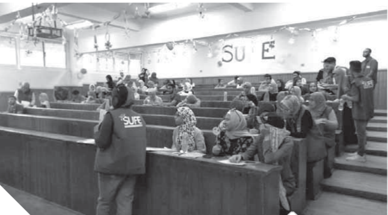
الجامعات تنهى استعداداتها لاستقبال العام الدراسي

الطلاب وإسائنتهم من أجل تحقيق التواصل بينهما ورعاية الطلاب وحل ما يعترضهم من مشكلات، وأيضاً إعداد برنامج واضح للأنشطة الطلابية على مستوى الكليات على مدار العام الجامعي ويتم إعلانه لتشجيع الطلاب للمشاركة في كافة مجالات الأنشطة الرياضية والثقافية والفنية والاجتماعية، كما أوضح ضرورة أن يتسم العام الجامعي السبت ٢١ سبتمبر.