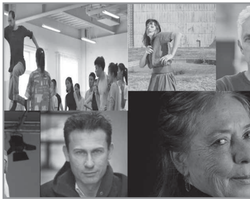
مدربى الورش المسرحية