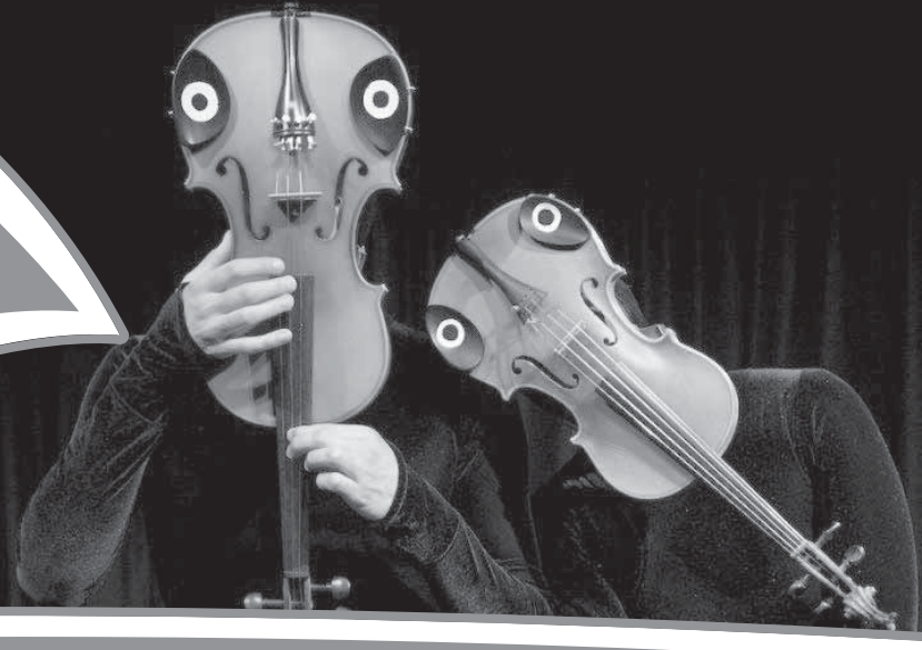
إشراف: أمجد مصطفى

ويحتفل المهرجان هذا العام بمرور 25 دورة منذ انطلاقه عام 1988 على يد وزير الثقافة الأسبق فاروق حسنى، وقررت إدارة المهرجان أن تكون دورة هذا العام استثنائية تحمل روح الاحتفال، مما جعلها مميزة، من حيث الندوات والعروض المشاركة، وإدخال أقسام جديدة على المهرجان.