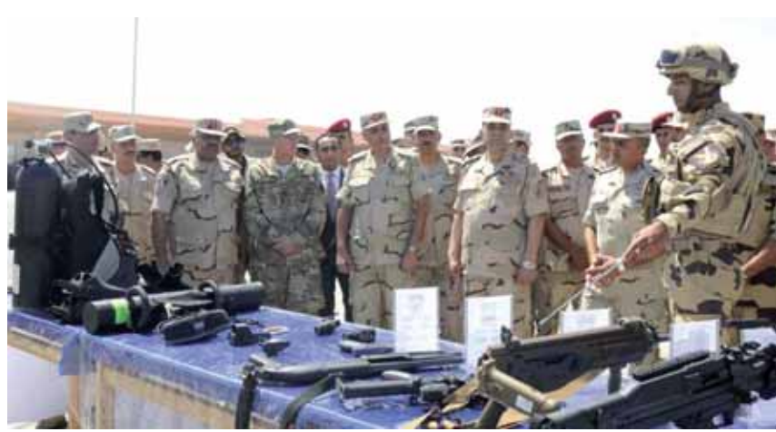
قادة القوات المشاركة فى «النجم الساطع» يتجولون فى معرض أحدث الأسلحة

الساطع هو الاستفادة من كل فرصة متاحة للتعاون المشترك لتعزيز العلاقات وتوجيه رسالة واضحة لمن يرغب فى التيل من أوطاننا، مؤكداً أن التدريبات المشتركة تسهم فى إعداد وتدريب القوات وتوضيح قيمة العمل المشترك كما أنها تمثل فرصة ذهبية