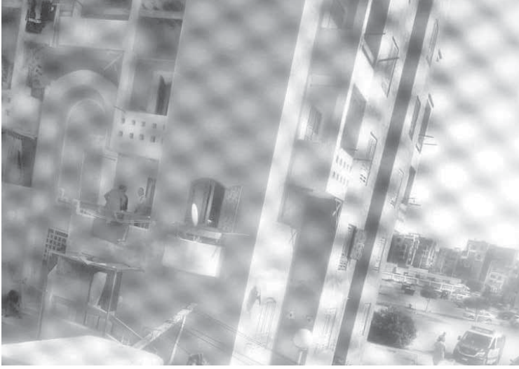
منزل الأسرة المقتولة

منوم فارغة داخل الشقة، ورجح المصدر الأمني قيام الأب بتخدير الضحايا قبل قتلهم، تواصلت «الوفد» مع أحد جيران المجنى عليهم، حيث أكد وقوع مشاجرة بين الأب وأحد الأشخاص، وصرخ خلال المشاجرة رب العائلة «انت اللي خليتي أذبحهم.. وكشفت جار العائلة أن الأسرة ذات جذور صعيدية، فيما أكد مصدر أمنى لـ«الوفد» انه تم التحفظ على عامل ديلفري بسوبر ماركت مجاور لسكن الضحايا، حيث أشار إلى أنه تلقى مكالمة من الأسرة تطلب بعض السلع وفور وصوله للشقة اكتشف الجريمة، وانتقل فريق من نيابة القاهرة الجديدة برئاسة المستشار محمد سلامة للشقة، وأجريت معاينة الجريمة، وتم انتداب الطب الشرعي لتشريح الجثث وإعداد تقرير بأسباب الوفاة، وأمرت بضيء الأب الهارب، كما تحفظت على كاميرات المراقبة الموجودة بمعيط العمارة السكنية، وانتدبت خبراء المعمل الجنائي لرفع البصمات واستدعاء أقارب الضحايا وشهود العيان لسماع أقوالهم.