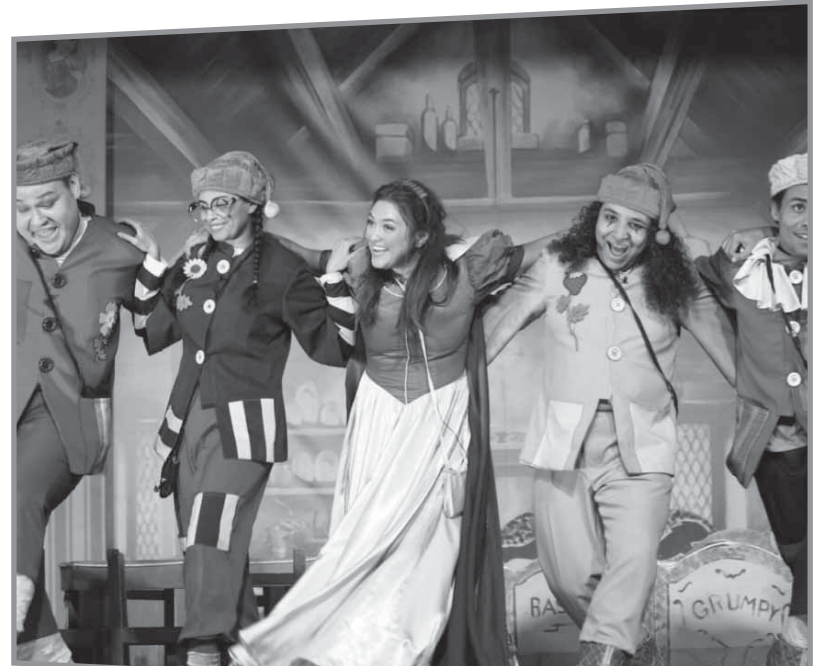
مشهد من مسرحية «ستو وايت»

دولة سويسرا، وذلك بمناسبة مرور 30 سنة على إنشاء المركز الثقافى السويسرى بالقاهرة، وتم الاستعانة بعدد من المدربين فى الورش بالفنانين السويسريين، وكذلك نوده ضيف الشرف.