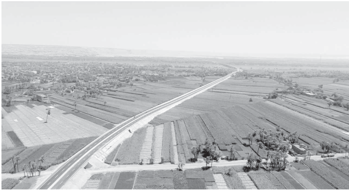
جانب من طريق الدائري الإقليمي ومحاوره

وتشمل مشروع إنشاء كوبري تقاطع الطريق الدائري الإقليمي 4.9 مليار جنيه، ومحور الخطاطبة على النيل والرياح البحري والرياح الناصري 1.3 مليار جنيه، وكوبري تقاطع طريق القاهرة - الإسكندرية الزراعى (بنيها) بتكلفة 617.5 مليون جنيه، والمرحلة الأولى من محور طما على النيل 550 مليون جنيه، وكوبري قوس العلوي بتكلفة 44 مليون جنيه، وكوبري بلطيم على الطريق الدولي الساحلى بتكلفة 45 مليون جنيه، بالإضافة إلى كوبري