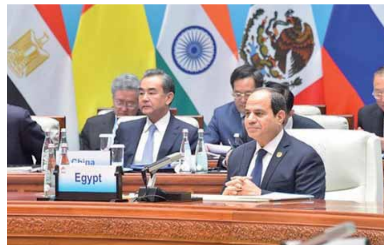
«السياسى» خلال كلمته بمنتدى التعاون «الصين - أفريقيا»

وأضاف أن القرض الذي وقعه البنك مع بنك المؤسسات الصينية يؤكد ثقة المؤسسات العالمية في الاقتصاد المصري والذي شهد إصلاحات اقتصادية واسعة خلال الأعوام الماضية أدت إلى مزيد من الاستقرار وتقديراً لقوة المركز المالي للبنك الأهلي المصري ولدوره في دعم وتقوية الاقتصاد في مصر، حيث تعود الروابط القوية والشراكة المثمرة بين البنك الأهلي المصري وبنك التنمية الصينية إلى عام 2012 في إطار تمويل مشاريع التنمية التحتية في مصر والشركات الصغيرة والمتوسطة وما كان لها من مردود إيجابي للمؤسستين بصفة خاصة وعلى الدولتين بشكل عام.