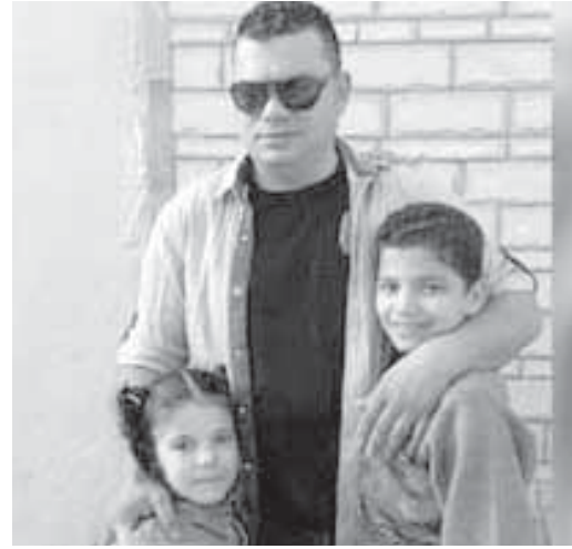
الزوج وأطفاله المقتولين

بعد مرور أسبوع على الجريمة التي راح ضحيتها أب وأولاده الأربعة في إحدى قرى القليوبية مازال الغموض يحيط بالجريمة.. الأجهزة الأمنية التي تصل الليل بالنهار أملا في فك طلاسم الحادث تراهن في الوقت الحالي على «صيد» شمين وقع في يديها عن الزوجة الثانية للأب القتل، حيث أصرت الزوجة الأولى أمام رجال المباحث على اتهام ضرتها بارتكاب الجريمة، وأحدث الخيوط التي تمثل هدفا قد يقود للجاني في جريمة قرية «الرملة»