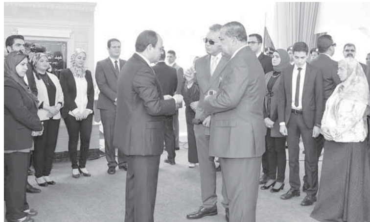
الرئيس خلال افتتاحه الطريق الإقليمي عند الخطاطبة