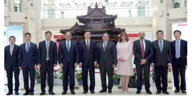
الأهلى يوقع قرض بنك التنمية الصينى