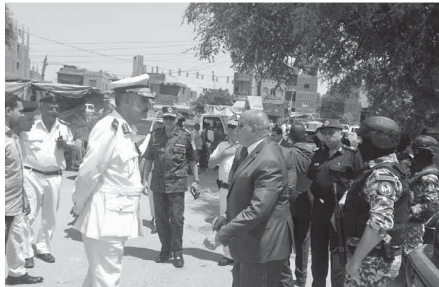
جولات أمنية بمحافظه الجيزة

عشب أخضر مخلوط بمبيد حشري وسم فئران بنسبة محددة بات الطريق لسرور أمام أعداد غفيرة من فقراء المدمنين.. كمية ضئيلة من «الأستروكس» يتم تدخينها كقبلة بأن تعزل المدمن عن العالم، وتمتعه شعورا بالنخس من معاناته، اللات في ذلك المخدر أنه يُصنع من أعشاب طبيعية، ويستخدم في الأساس لتهدئة الأسود أثناء عرض السيرك، وكذلك الأمر بالنسبة للثيران حيث تحتوي المادة الكيميائية على مواد الأتروبيين والهوسين والهوسيامين وجميعها تسيطر على الجهاز العصبي وتخدره تماما، وإثر اتساع ظاهرة استخدام المخدر أطلقت الأجهزة الأمنية بمديرية أمن الجيزة عدة حملات بمختلف القطاعات والأقسام لضبط تجار ذلك المخدر لمنع انتشاره أو تصنيه خاصة في المناطق العشوائية، انطلقت الحملات تحت إشراف اللواء الدكتور مصطفى شحاتة مدير أمن الجيزة واللواء رضا العمدة مدير الإدارة العامة لمباحث الجيزة، أسفرت الحملات عن ضبط 36 متنها بحوزته كيلو ونصف الكيلو من «الأستروكس» بالإضافة لـ80 قرصا مخدرا، وتمكن المقدم محمد ربيع رئيس مباحث قسم إماية من ضبط عاقل يدعى إيهاب، ش. أ، وعامل يدعى الحسيني، و. ش، أثناء اتجارهما في المواد المخدرة وتم العثور على 3 كيلوجرامات من الأستروكس، واعترفا بمزاولتهما تجارة المخدرات، كما نجح ضابط بمرور الجيزة من ضبط على: ز. ع- 17 عاما- مقيم بالبدرشين وعثر بحوزته على 150 جراما من الأستروكس