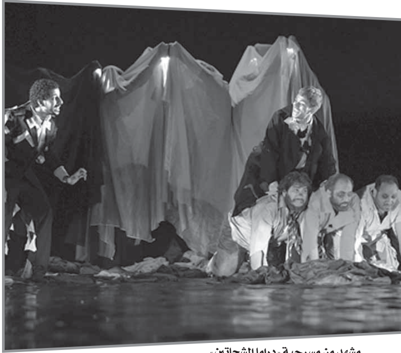
مشهد من مسرحية «دراما الشحاتين»