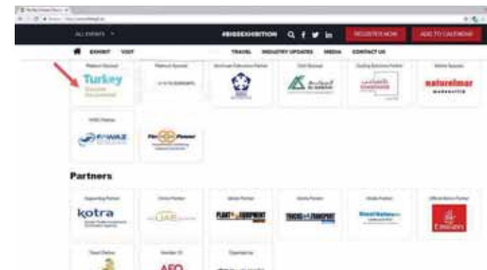
الأتراك هم الرعاة الرسميون لـ Big 5 دبي وجدة