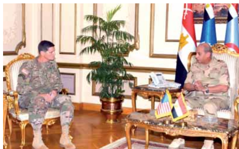
وزير الدفاع خلال لقائه بقائد القيادة المركزية الأمريكية

مكافحة على الإرهاب مؤكداً عمق علاقات الشراكة الاستراتيجية والتعاون الممتد بين مصر والولايات المتحدة الأمريكية. وفى نفس السياق التقى الفريق محمد فريد، رئيس أركان حرب القوات المسلحة الفريق أول جوزيف فويتل، وتناول اللقاء عددا من الملفات والموضوعات ذات الاهتمام المشترك فى ضوء علاقات التعاون العسكري والتدريبات المشتركة بين القوات المسلحة بالبلدين، وعلى رأسها تدريبات النجم الساطع، حضر اللقاء عدد من قادة القوات المسلحة.