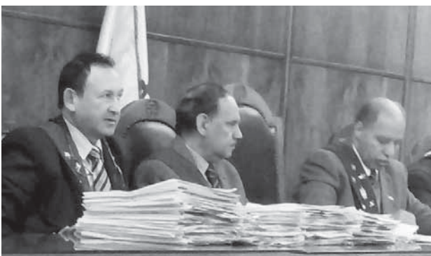
كتبت: سامية فاروق

قضت المحكمة الإدارية العليا الدائرة الثالثة برئاسة المستشار أحمد منصور نائب رئيس مجلس الدولة وعضوية المستشارين ناصر عبدالقادر ونجم الدين عبدالعظيم والدكتور محمد عبدالوهاب خفاجي وعبدالمنعم زاهر نواب رئيس مجلس الدولة بإلغاء الحكم الصادر من محكمة القضاء الإداري الصادر بإلزام محافظ الجيزة بتعويض أحد المقاولين بمبلغ 328 الف جنيه لعدم تمكنه من تنفيذ عملية بناء اثنتي عشرة عمارة سكنية بناهى مركز الضف بسبب أن الأرض كانت زراعية لا يجوز البناء عليها والقضاء مجددا بإثبات ترك المدعى للخصومة. قالت المحكمة إنه يقصد بترك الخصومة نزول المدعى عن الخصومة بنزوله عن مجموع الإجراءات التي تمت في الدعوى، ويتحقق الترك بإعلان من التارك لخصمه على يد محضر أو ببيان سريع في مذكرة موقعة من التارك أو من وكيله مع اطلاع خصمه عليها أو بإبدائه شفويا في الجلسة وإثباته في المحضر، والترك تصرف قانوني يشترط لصحته ما يشترط لصحة جميع التصرفات القانونية، فيجب أن توجه إليه إرادة من قرره والا انعدم أثره، والترك لا يجوز أن يكون مقرونا بأى شرط أو تحفظ من شأنه تمسك التارك بالخصومة أو بأى أثر من آثارها، والترك تصرف لا يجوز الرجوع فيه.