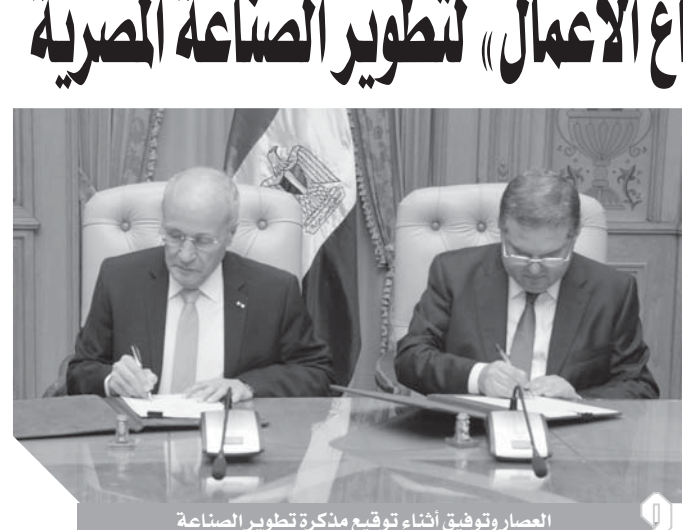
المصارتوتوقيع أثناء توقيع مذكرة تطوير الصناعة

وقد تم الاتفاق بموجب مذكرة التفاهم على تشكيل لجان فنية مشتركة لإدارة المشروعات محل الاهتمام المشترك، تقوم بإعداد الوثائق اللازمة وتنفيذ إجراءات البت فى العروض، حيث ستقوم هذه اللجنة المشتركة بإعداد دراسات الجدوى المبدئية للمشروعات ذات الاهتمام المشترك، وتقديم المعاونة والاستشارات الفنية، وعرض هذه الدراسات لتحديد الجدوى الاقتصادية لها، والتعاون فى إنتاج ألواح الطاقة الشمسية من الكوارتز المصرى «مصنع إنتاج السيلكون المعدنى»، والمقترح تنفيذه بالتعاون بين «الإنتاج الحربي»، والشركة المصرية للسبائك الحديدية، التابعة للشركة القابضة للصناعات المعدنية فى مدينة إدفو بمحافظة أسوان.