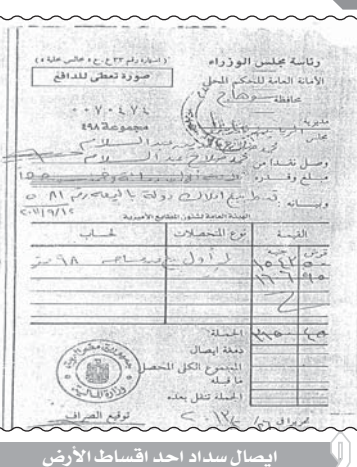
إيصال سداد احد اقساط الأرض

أقدم بان المساحة المشار اليها بالمادة الصعفية ارض املاك دولة ٩٨ متراً مربعاً وتقع ضمن منزل الأسرة وقد قدمت بالتقدم بطلب شرائها كونها مرهونة بسجلات املاك، وتم تقدير ثمنها بمعرفة لجنة مشكلة بقرار محافظ سوهاج عام ٢٠١٠ طبقاً لأحكام القانون.