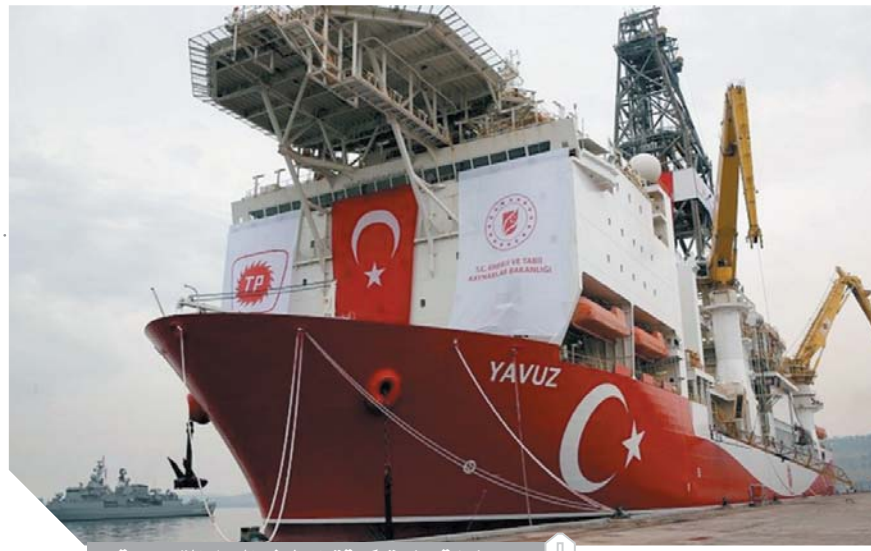
سفينة حفر تركية ترابط فى المياه القبرصية

تعليلًا على دخول سفينة تركية أخرى إلى مياه قبرص لتنفيذ أعمال تنقيب، أن موسكو «تتابع بقلق تطور الأوضاع فى المنطقة». وأكدت موسكو أنه من الواضح أن هناك ضرورة لإعادة إطلاق المفاوضات حول تسوية قضية قبرص بهدف إيجاد حلول على أساس قرارات مجلس الأمن الدولى ذات الشأن، وأكدت كذلك استعدادها، لدعم الجهود فى هذا الصدد.