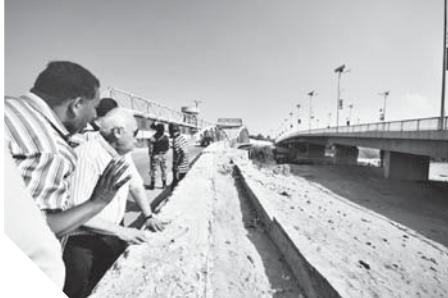
جانب من تطوير المحاور الرئيسية