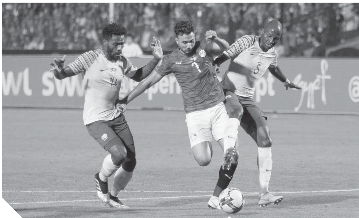
جنوب إفريقيا فحرت مفاجأة بإقصاء حامل اللقب وتسمى لإسقاط نيجيريا