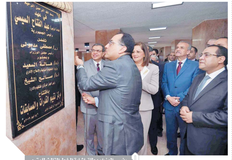
رئيس الوزراء يطلع إشارة الخط الثالث للمترو

أكد الدكتور مصطفى مدبولي رئيس الوزراء أنه لا طريق لتولى الوظائف العامة بالدولة سوى الجدارة والمهارة والتميز، وأشار خلال افتتاح مركز تقييم القدرات والمسابقات التابع للجهاز المركزي للتخطيط والإدارة إلى أن الرسالة التي تؤكد عليها أن إنشاء المركز يأتي تقييداً لالتزام الحكومة المصرية بالاستحقاقات الدستورية والقانونية المؤكدة على العدالة والمساواة وتكافؤ الفرص. وأكد أن حسن المدخلات سيكون له الدور الأكبر في تحسين أداء الجهاز الإداري للدولة في المستقبل، وسوف يتم استصدار قرار من رئيس الوزراء في شأن هذا المركز. ولفت «مدبولي» إلى أن الحكومة تولي أهمية كبيرة لملف الإصلاح الإداري، حيث يأتي على أجنحة أولوياتها، لافتاً إلى أن أهم تكليفات الرئيس له حين تولى المسؤولية، هو الارتقاء بالمعصر البشري، وهو ما يسهم في تقديم خدمة أفضل للمواطنين. وأكد رئيس الوزراء أن وجود جهاز إداري كفاءه وفعال يُعد إحدى الضمانات الأساسية لتحقيق التنمية الاقتصادية والاجتماعية وتحقيق التقدم المنشود في التعليم والصحة وبناء الإنسان والخدمات العامة والمجالات الأخرى. وأشار «مدبولي» إلى أن الحكومة قطعت أشواطاً عدة في طريق الإصلاح الإداري، وقامت ببناء