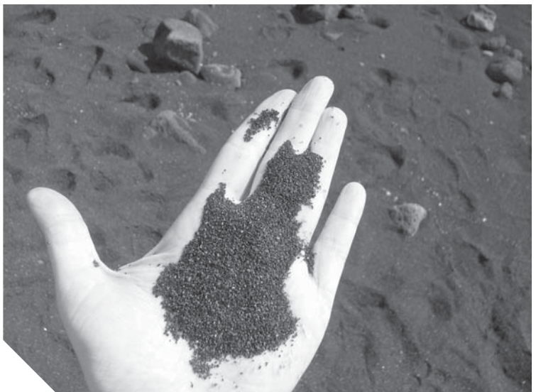
وستتم زيادة عدد العاملين ببدء العمل فى هذه المرحلة. وأضاف أن مشروع استغلال خامات الرمال السوداء يهدف إلى تعظيم أوجه الاستفادة من أحد أهم المحاور التعدينية فى زيادة معدلات الدخل القومى وتوطيد التكنولوجيا الوطنية. وسيد الفجوة القائمة ما بين احتياجنا وحجم ما يتم استيراده

من الخارج. وأوضح «ميرة» أن مصر تمتلك أحد عشر موقعاً لخامات الرمال السوداء على ساحل البحر المتوسط، هذا بالإضافة إلى ما تم اكتشافه حديثاً على طول ساحل البحر الأحمر بجنوب مصر. وأضاف «ميرة» أن هذا يأتي فى إطار سلسلة من أوجه التعاون بين الشركة المصرية للرمال السوداء وهيئة المواد النووية التى أسفرت عن تقييم احتياطي الرمال السوداء ومعادنها الاقتصادية ودراسة جدوى استغلالها بالعديد من مناطق وجودها. ومن ثم تم البدء فى إنشاء مصانع تركيز وفصل معادن الرمال السوداء بمناطق البرلس، وبركة غليون ورشيد، وادكو لفتح آفاق جديدة من التنمية التعدينية والمجتمعية بمحافظات مصر.