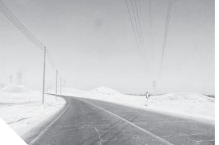
طريق قنا الصحراوي الشرقى

لكن ينهت أحدهما أمام مدرسة نجع الوحدة، ما يضطر السائقين إلى سلك طريق في الاتجاه الآخر ما يجعله طريقاً أحدى الاتجاهات تسلكه السيارات المقبلة من الشمال والجنوب ما تسبب في وقوع حوادث عدة.