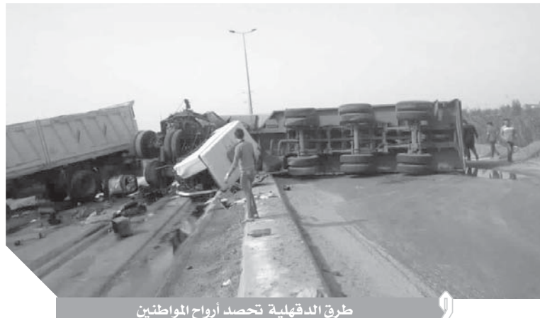
طرق الدقهلية تحصد أرواح المواطنين

أعلى نسبة معدل حوادث الطرق بسبب تهالك الطبقة الإسفلتية، وتبلغ مسافة الطريق ٥٥ كم وكان قد تقرر وقال الدكتور نهاد عمار من اهالي-جمصة