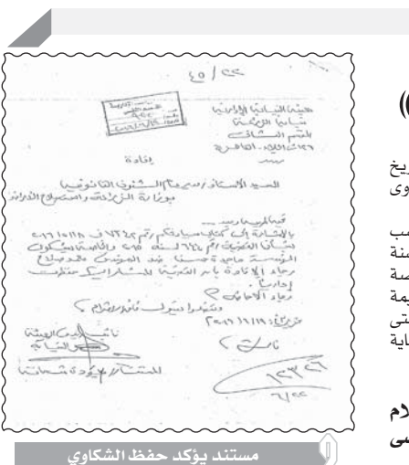
مستند يؤكد حفظ الشكاوى

رصدت عدسة الوفد بطريق مصر - أسوان الزراعى البعداى مدخل البياضية شمالاً، إضافة لانتهاه الطريق والمفترض أنه ذو