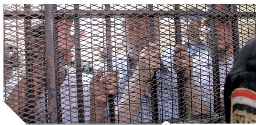
المتهمون فى القصف خلال المحاكمة أمس