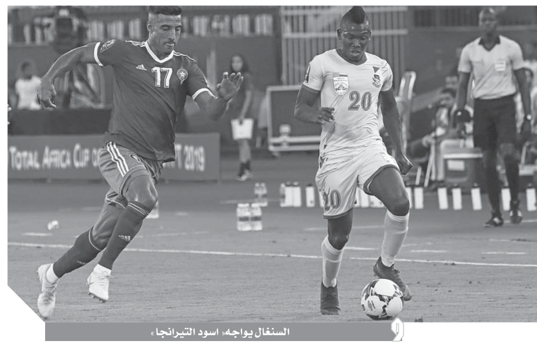
السنغال يواجه، أسود التيرانجا،

وأكد المدرب الفرنسي أنه فخور بالفريق وقال: كما أمام تحد صعب لأن المغرب فريق قوى جدا لكننا كنا على استعداد ذهنى، وحافظنا الحظ ومنتظرنا مواجهة أخرى صعبة أمام السنغال.