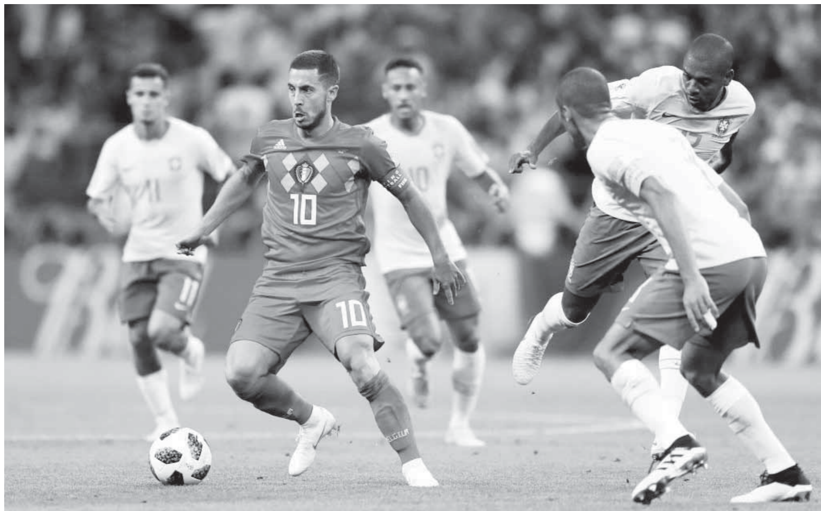
بلجيكا أطاحت بالبرازيل وتصدت بفرنسا الليلة

أعلن الاتحاد الإسباني لكرة القدم، تعيين لويس إنريكي مديراً فنياً، لمنتخب إسبانيا بدلاً من فرناندو هيريرا، الذى تولى المسؤولية قبيل انطلاق بطولة كأس العالم 2018 فى روسيا. وكان «هيريرا» قد تولى منصب المدير الفنى بشكل مؤقت، خلال بطولة كأس العالم، المقامة فى روسيا بدلاً من لوينجى الذى تمت إقالته قبل يومين من البطولة بعد إعلان ريال مدريد التعاقد معه. وكان منتخب إسبانيا ودّع بطولة كأس العالم 2018، من دور الستة عشر بعد الخسارة أمام منتخب روسيا بركلات الترجيح. وكان لويس إنريكي قد قاد فريق برشلونة الإسباني، وحقق مع الفريق الكتلونى العديد من الألقاب؛ أهمها دورى أبطال أوروبا والليجا وكأس ملك إسبانيا.