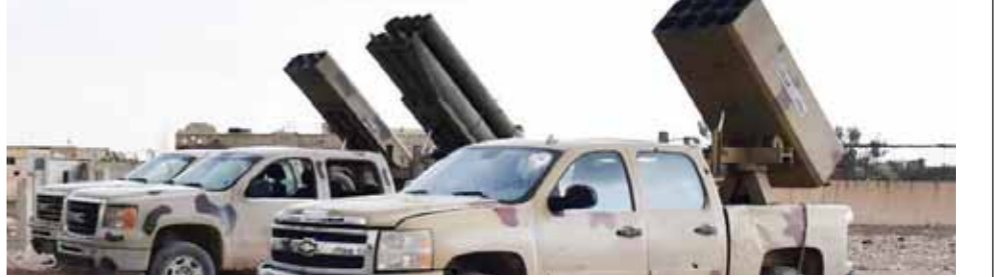
الدفاعات السورية تتصدى لهجوم الاسرائيلي

تصدت قوات الدفاع الجوي السورية لهجوم إسرائيلي، مساء أمس الأول، وأسقطت عددا من الصواريخ التي كانت تستهدف مطار التيفور وأصابت إحدى الطائرات وأرغمت البقية على مغادرة الأجواء. وأhead مصدر عسكري لوكالة «سبوتنيك» الإخبارية بأنه تم إسقاط 6 صواريخ بواسطة الدفاعات الجوية السورية بمحيط مطار التيفور. انطلقت من الجهة الجنوبية لمنطقة التنف باتجاه المطار. وأشار إلى أنه تم رصد الصواريخ لحظة الإطلاق من جنوب منطقة التنف، وأكد المصدر أنه لم يتم تسجيل أى أضرار بشرية في المطار