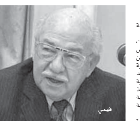
كتب - إيناس السيد

كما أكد «فهمى» على وجوب توافر قائمة تصدير بواسطة الجهات المختصة مثل الأمن القومى لتسهيل إجراءات التراخيص واختصار عدد من الجهات فى جهة أو جهتين على الأكثر، مشيراً إلى ضرورة إصدار تعليمات بالنسبة لإنهاء المنازعات الضريبية أياً كانت ضريبية الدخل أو القيمة المضافة وغيرها من الضرائب المختلفة وذلك لتقوية المركز القانونى للمستثمر، وذلك بأن يتم انتداب متخصص مع المستثمر فى كل حالة مثل انتداب محام أو متخصص فى الإسكان أو الحاسبية أو الإسكان، بالإضافة إلى توحيد اللجنتين الداخليتين واللذين تخصصان بالضرائب فى لجنة واحدة بدلاً من اللجنة الداخلية ولجنة الطعن لتكونا لجنة واحدة داخل المصلحة.