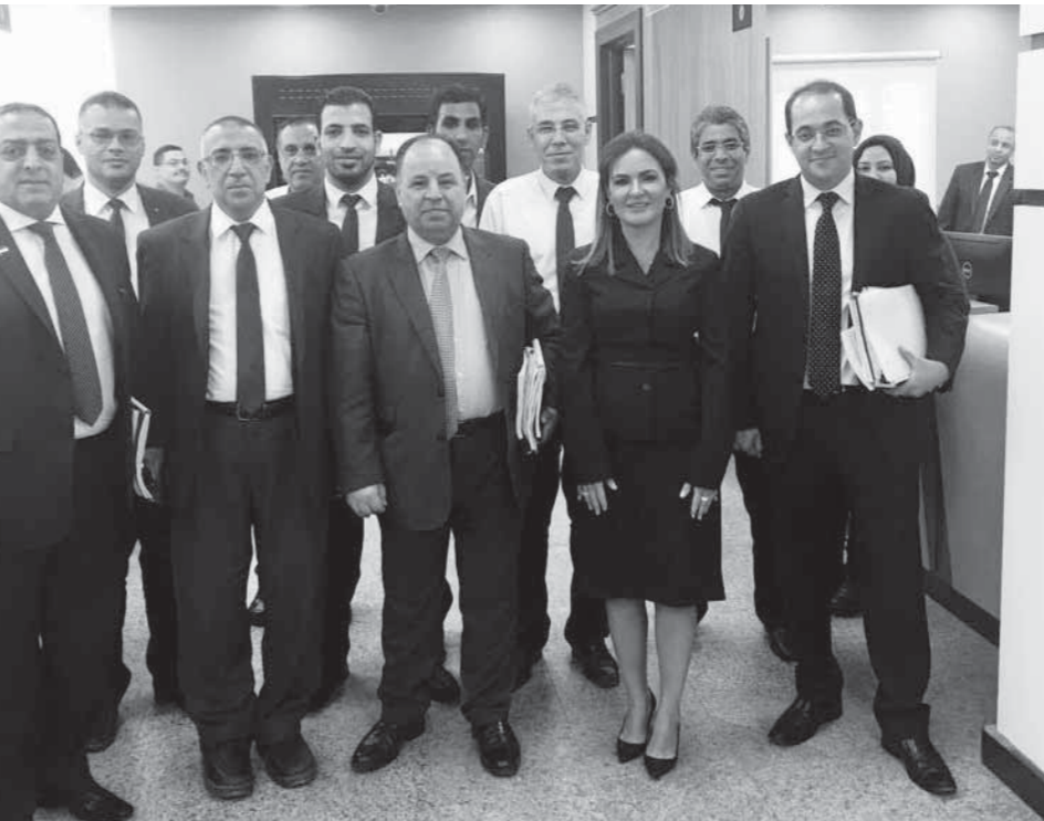
وزيرا المالية والاستثمار وقيادات الوزارتين