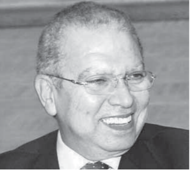
اللواء محمد يوسف

تكوين تحالف مع الشركة القابضة على النحو التالى (مجموعة موانئ دبي بحصة مساهمة تبلغ 80.1% والشركة القابضة للنقل البحرى والبرى بحصة مساهمة تبلغ 19.9%) وفى مرحلة لاحقة سيتم دخول الهيئة العامة للمنطقة الاقتصادية لقناة السويس بحصة سوف تتحدد فى حينها وتم لتفويض مجموعة موانئ دبي العالمية كقائد لهذا التحالف باعتبارها هى المشغل للمشروع فى حالة الترسية على التحالف.