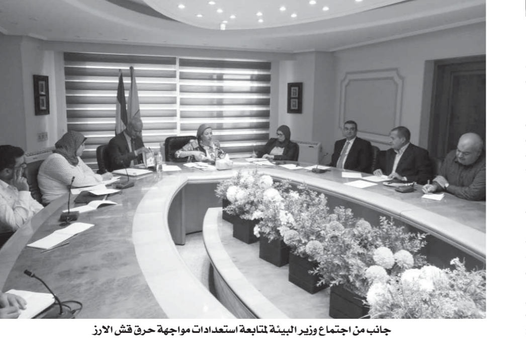
جانب من اجتماع وزير البيئة لمتابعة استعدادات مواجهة حرق قش الأرز