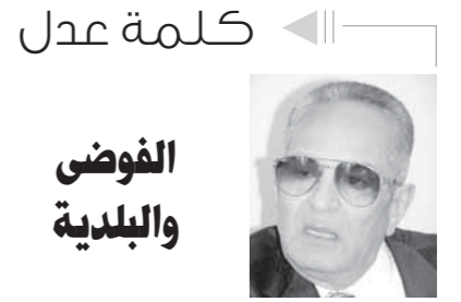
بهاء الدين أبوشقة الوفد والبلدية

الثلاثاء ٦١ شوال ١٤٣٩هـ - ١٠ يوليو ٢٠١٨ - ٢٠١٨ أيبب ١٧٢٤ق - العدد ٩٨٠١ - السنة الثانية والثلاثون