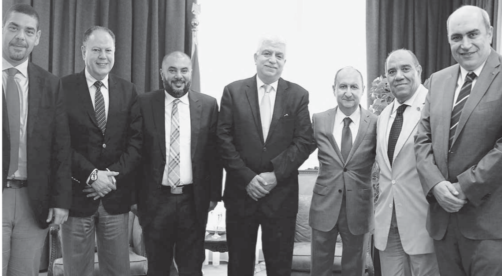
وزير الصناعة خلال لقاءه وأعضاء غرفة الصناعات الهندسية

وقد استعرض اللقاء التصور الخاص بعقد مؤتمر موسع حول تعميق التصنيع المحلى والتوجه نحو التصدير الذى يستهدف إلقاء الضوء على الإمكانيات الهائلة التي تمتلكها الصناعة المصرية فى مختلف القطاعات الإنتاجية وكذا الفرص الكبيرة المتاحة لزيادة معدلات تصدير المنتجات الصناعية.