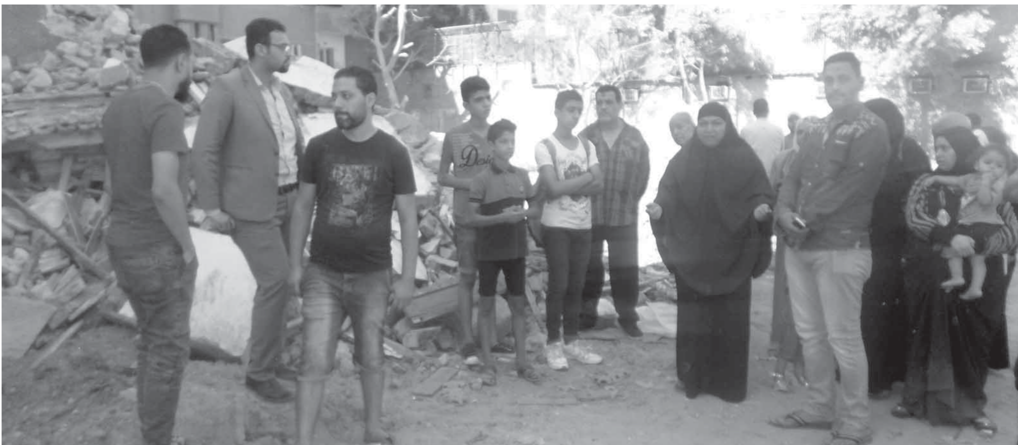
أهالى الساحل ينتظرون الفرج

سكان العمارتين المنكوبتين؛ شقق المحافظة بلا مرافق.. وتحويشة عمرنا ضاعت تحت الأنقاض