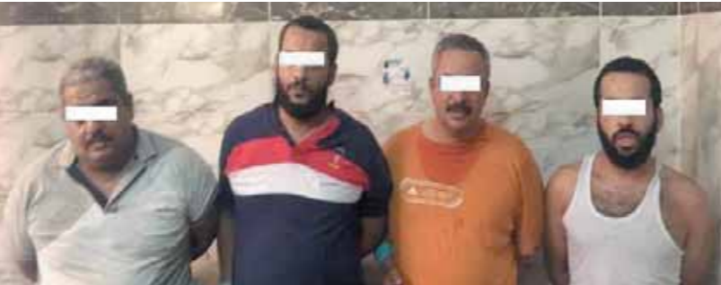
المتهمون في خطف طفل الشروق

البحث المشكل بالتنسيق مع قطاعي الأمن الوطني والأمن العام ومديرية أمن القاهرة عن تحديد مرتكبي الحادث، كما توصلت التحريات إلى تلقي جد الطفل المختطف تهديداً من الخاطفين بقتله ما لم يبادر بدفع مبلغ الفدية، وخشية على حياة الطفل، وكسب المزيد من الوقت لتحديد مكان الجناة، تم التنسيق مع جد الطفل المختطف على دفع جزء