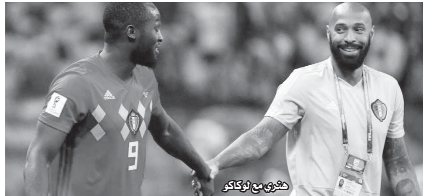
هنرى مع لوكاكو

لكن مواجهة «هنرى» لمنتخب فرنسا ستكون من العيار الثقيل؛ حيث يستعد النجم الأسمر للوقوف ضد منتخب بلاده قبل النهائى للمونديال روسيا 2018. وأصبح «هنرى»، الآن، جزءاً مهماً فى الطاقم التدريسى الذى يعمل برفقة مارتينيز؛ حيث بات الفريق على بعد انتصار وحيد من أجل التأهل لنهائى كأس العالم للمرة الأولى فى تاريخه. وانسحب «هنرى»، من ملعب كازان، يوم الجمعة الماضى، متجنباً مواجهة الصحفيين الذين انتظروه لسؤاله عن