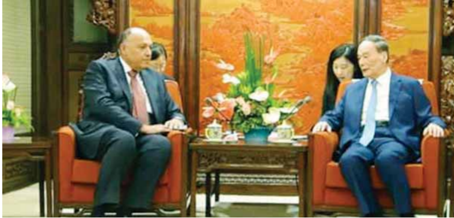
«شكري» أثناء مشاركته في ندوة معهد الصين للعلاقات الدولية

وأضاف «أبوزيد»، أن «شكري» أشار في كلمته إلى أهمية مكافحة الإرهاب، مؤكداً أن بعض الجهات الفاعلة في منطقة الشرق الأوسط استغلت الدعم للتغيير كذريعة لتوفير ملاذات آمنة وكذلك الدعم العسكري والمالي للعديد من المنظمات الإرهابية المتطرفة بما في ذلك تنظيمي «الدولة الإسلامية» و«القاعدة»، كما أكد وزير الخارجية موقف مصر وغيرها من الدول العربية الكبرى الناطق الذي