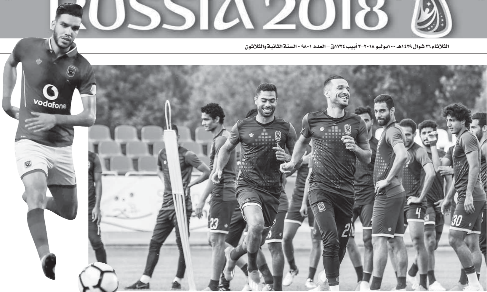
الأهلي اختتمت معسكره في كرواتيا أمس