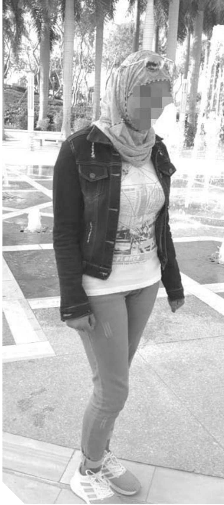
تحقيق - حسام أبوالمكارم