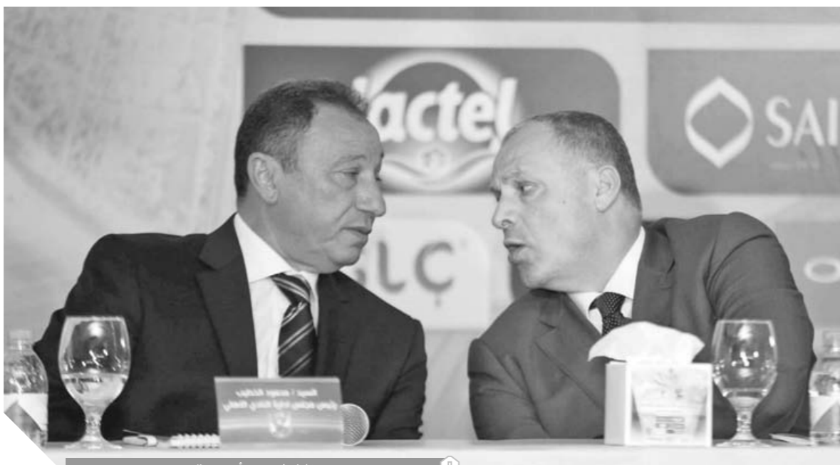
الخطيب مع أبويردة

والعلاقات الشخصية. وطلب الأهلى تحديد موعد واضح، يلتزم به اتحاد الكرة، ويعلمه لتطبيق تقنية الفيديو؛ لإيقاف مسلسل الأخطاء التحكيمية التي أثارت جدلاً كبيراً، وتسببت في استعانة الأندية بالحكام الأجانب في العديد من المباريات هذا الموسم؛ علماً بأن النادي الأهلى سبق أن خاطب الاتحاد في ٢٠١٨/٩/٣، وطلب تطبيق تقنية VAR بعدما شهدت مبارياته أخطاء تحكيمية فجة. وجاء تعهد اتحاد الكرة الكتابي والذي تسلمه النادي بتاريخ ٤ أكتوبر الماضى أنه سوف يقوم بتطبيق تقنية VAR في يناير الماضى وهو ما لم يحدث.