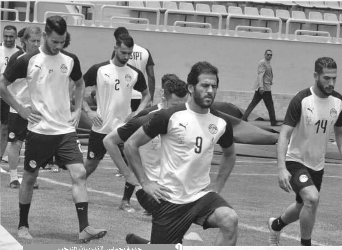
جدية وحماس في تدريبات المنتخب

وتطرق لهيطة للحديث عن أزمة غياب محمد صلاح قائلاً: «المعسكر أصبح يضم ٢٤ لاعباً، ويتبقى فقط انضمام محمد صلاح، حتى الآن لا نعلم موعد انضمامه، وسنبعث الأمر مع اللاعب». وأوضح لهيطة أن المنتخب سيشهد معسكره بالإسكندرية بعد ودية غينيا يوم ١٦ يونيو الجاري، وسيخوض تدريباته على ملعب الكلية الحربية بالقاهرة، استعداداً لمواجهة زيمبابوي