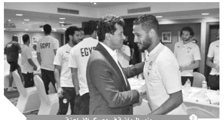
وزير الرياضة في معسكر الفراعنة