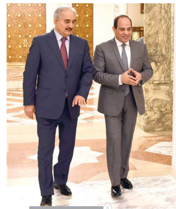
الرئيس خلال لقائه حفتر

تمكنت قوات الجيش الوطني الليبي، من صد هجوم لحكومة الوفاق المدعومة من الجماعات الإرهابية على مطار طرابلس الدولي جنوب العاصمة الليبية. وأعلن مسئول المركز الإعلامي للواء ٧٣ مشاة المنذر الخرطوش، التابع للقيادة العامة للجيش الليبي بقيادة المشير خليفة حفتر، أن قوات حكومة الوفاق كانت تحاول الوصول إلى مطار طرابلس الدولي جنوب العاصمة، مشيراً إلى أن غرفة عمليات