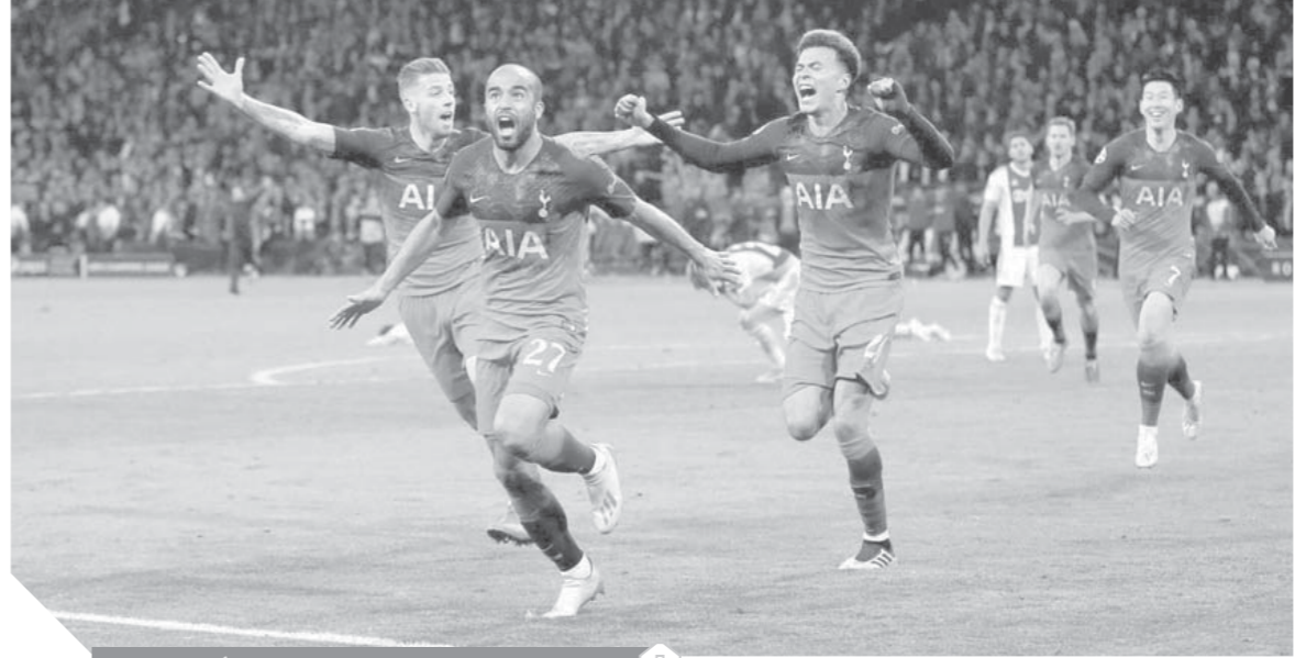
فرحة كبيرة للاعبين توتنهام بعد التأهل للنهائي