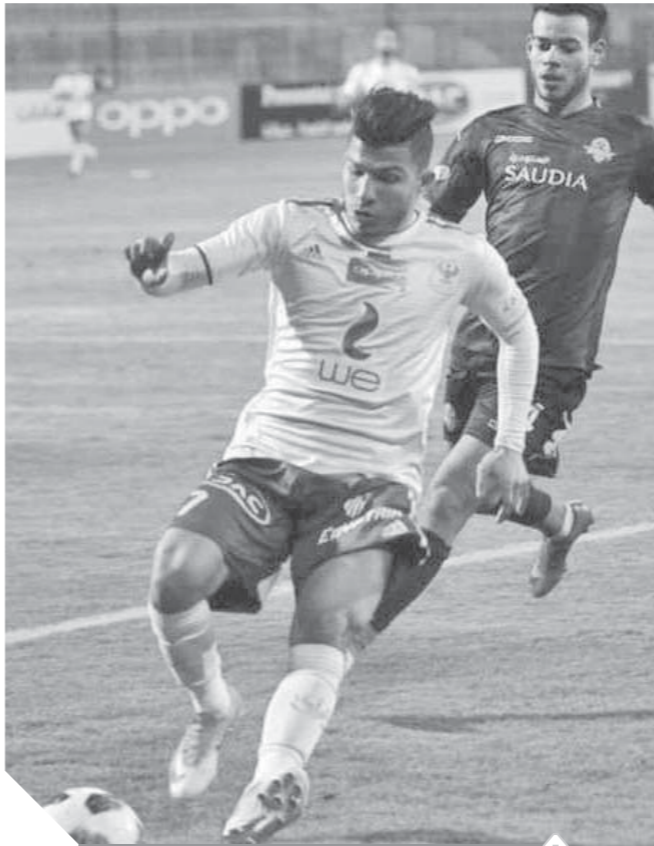
المصرى يسعى للحفاظ على المركز الرابع فى الدورى

ويبحث على ماهر المدير الفني للفريق البترولى، من حصد النقاط الثلاث للخروج من دوامة الهبوط، خصوصاً أنه يتبقى له مباراة مؤجلة أمام النادي الأهلى لتصد المسابقة.