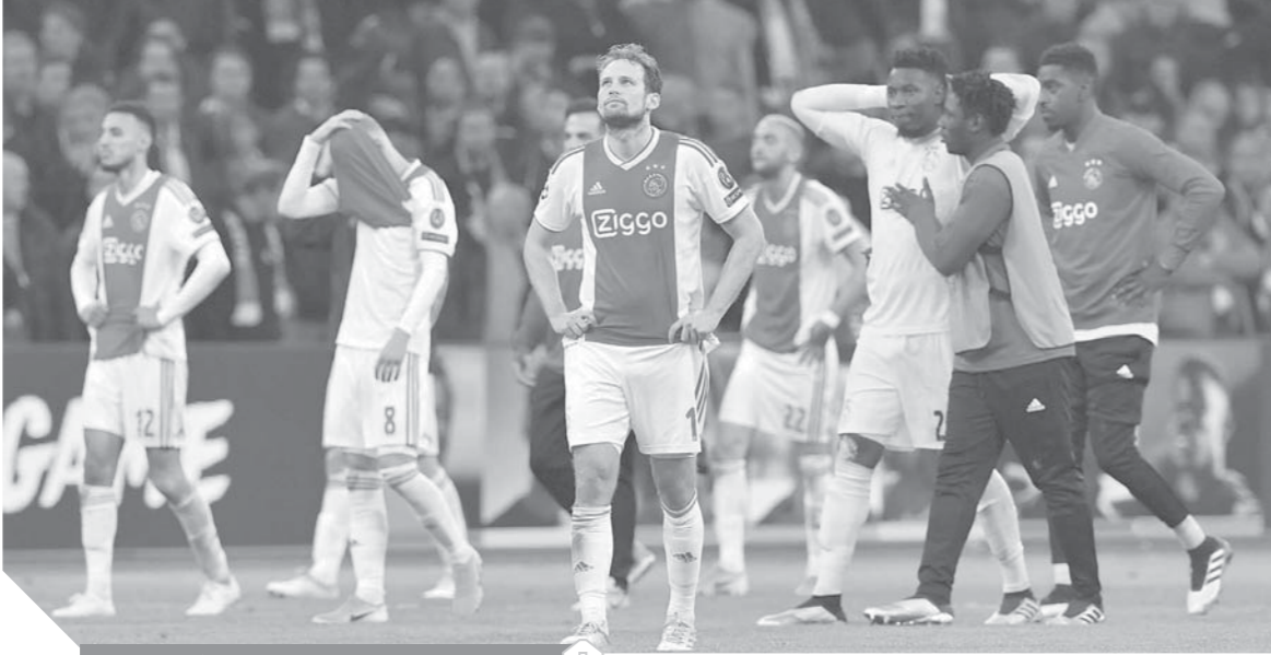
الحزن يسيطر على لاعبي أياكس