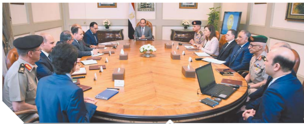
الرئيس خلال الاجتماع الوزاري المصغر أمس

وأضاف أن «السيسي» وجه خلال الاجتماع بمواصلة التنسيق التام بين الجهات المعنية في الدولة في ذلك الصدد، مشدداً على أهمية إتاحة الخدمات الرقمية بطرق بسيطة وتكلفة ملائمة لجميع المؤسسات والمواطنين، وذلك من خلال تطوير منظومة رقمية متكاملة مؤمنة على المستوى القومي، وكذلك توثيق وتحفيز الصناعات الرقمية من خلال جذب الاستثمارات الأجنبية وتوفير فرص عمل، عن طريق دعم وتنمية الصناعة الرقمية والإبداع التكنولوجي، بالإضافة إلى جهود تحويل مصر لمر رقمي عالمي لضمان تعظيم الاستفادة من المقومات الأساسية التي تمتلكها مصر، لتصبح مركزاً رقمياً لخدمات الاتصالات وتكنولوجيا المعلومات في العالم.