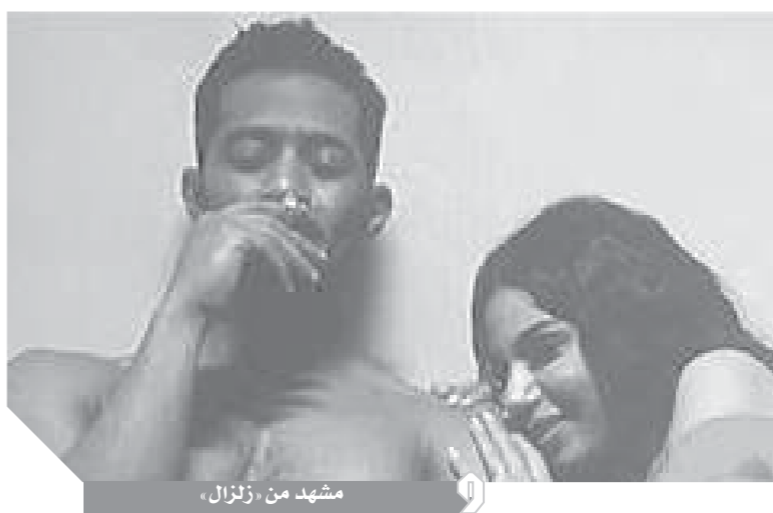
مشهد من زلزال

منى الحديدى: الدراما والإعلانات سبب انتشار العنف ضد المرأة حسن عماد: «الأعلى للإعلام» تنظيمى وليس رقابياً