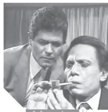
دموع فى عيون رفحة