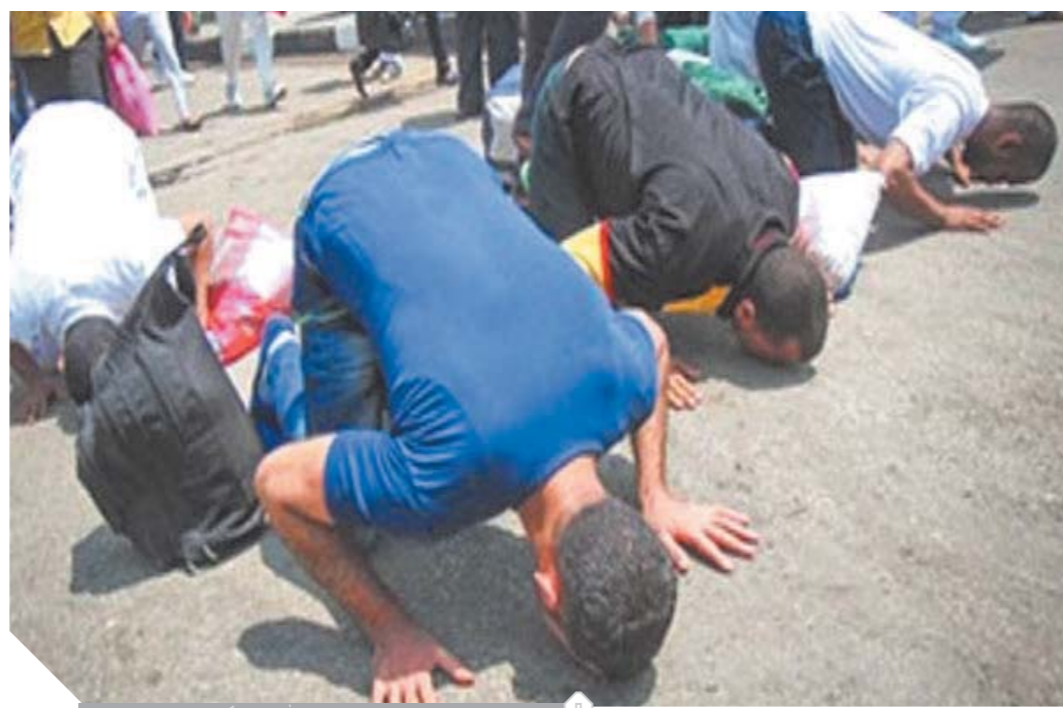
بعض المفرج عنهم يسجدون لله شكراً عقب خروجهم

كان قطاع السجون قد عقد لجانا لفحص ملفات نزلاء السجون على مستوى الجمهورية لتحديد مستحقي الإفراج بالعفو عن باقي مدة العقوبة، حيث انتهت أعمال اللجان إلى انطباق القرار على ١٧٠ نزائاً ممن يستحقون الإفراج عنهم بالعفو.