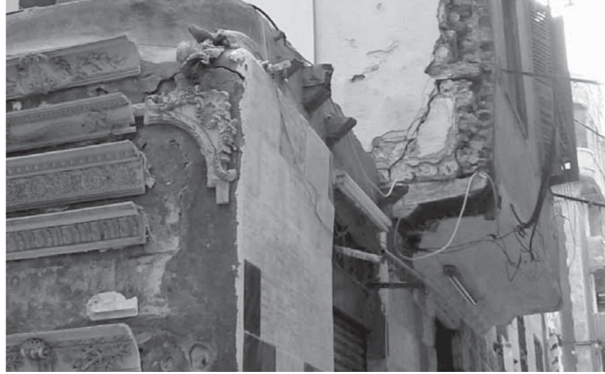
العقار آثار الضرر بين المواطنين