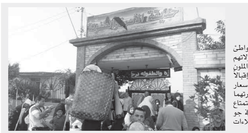
فرحة الأطفال في حدائق بلطيم

وأصر المواطنون والأطفال على التقاط صور تذكارية وسيلفي مع المحافظ، وكان محافظ الشرقية قد قرر فتح الحدائق العامة والمتنزهات ومراكز الشباب والملاعب أمام المواطنين بالمجان منذ فجر أمس، فضلاً عن ضرورة التواجد الأمني بأماكن الاحتفال ضماناً لاستمتاع المواطنين بالمناسية.