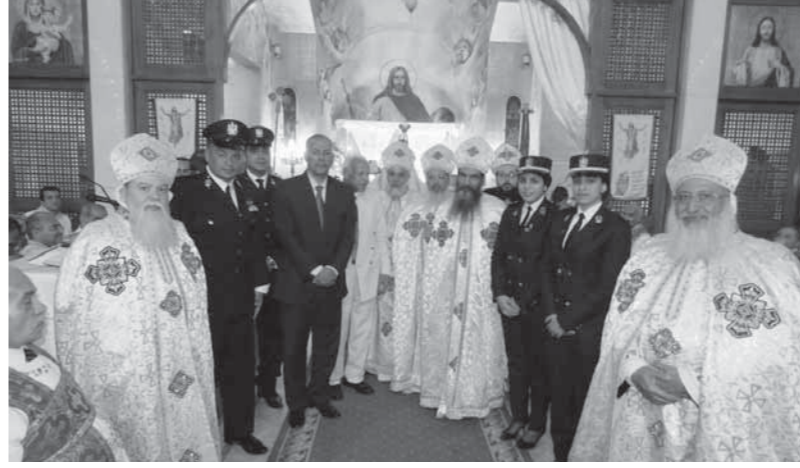
وفد الداخلية خلال زيارته لإحدى الكنائس