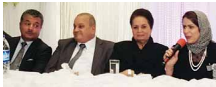
محافظ البحيرة في حفل جمعية رجال الأعمال بكفر الدوار

أحيا الفنان اللبناني عاصي الحلاني، احتفالات الربيع في مدينة شرم الشيخ بمحافظة جنوب سيناء، حيث غنى وسط حشد كبير من السائحين من مختلف الدول العربية، وفي حضور محافظ جنوب سيناء اللواء خالد فودة، صعد الحلاني على نغمات أغنية «بالعربي» ثم استكمل الحفل بأغنيات: «عندك بحرية، وجن جنوتي، ومالي صبر، وانى مارت، وميت، ويا طير، ويا ناكر المعروف»، وقدم تهنئته الشخصية وتهنئة الشعب اللبناني للشعب المصري، بمناسبة