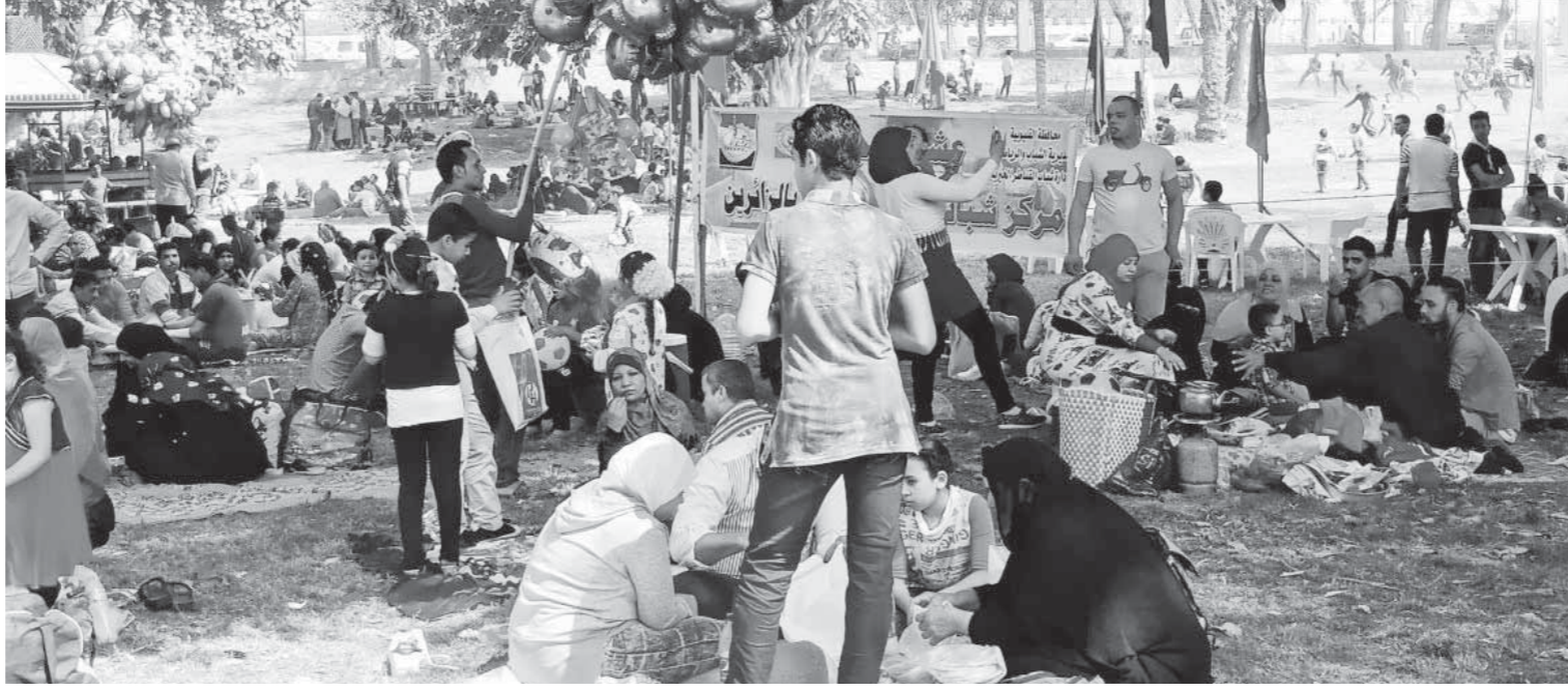
زحام في حدائق المنيا في أول أيام العيد

خرج أمس، الآلاف من أهالي محافظة المنيا بمركزها التسعة، إلى الحدائق والمتنزهات، احتفالاً بعيد شم النسيم بالمنيا، وسط تواجد أمني مكثف للتصدي لأي محاولات خبيثة لإفساد فرحة المواطنين في العيد، وخرج المواطنين من القري والمدن والمراكز، مصطحبين أطفالهم لحدائق كورنيش النيل، والحدائق المنتشرة بالمراكز على ضفاف النيل، للاستمتاع بعيد شم النسيم وسط الزهور والورود، وارتاد الشباب والفتيات القوارب والمراكب الشراعية في جولات نيلية، على أنغام الأغاني وسط حراسات أمنية مكثفة.