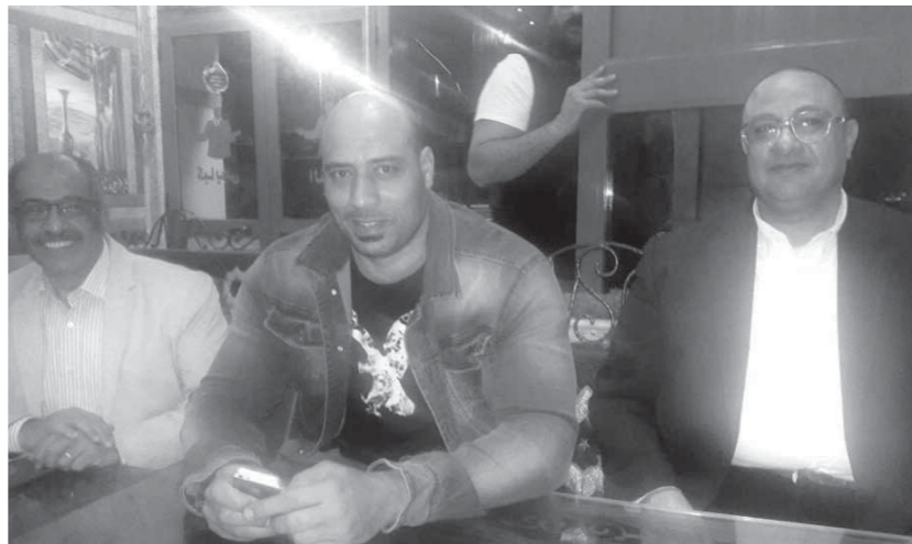
كمال الأجسام ضحية الفساد