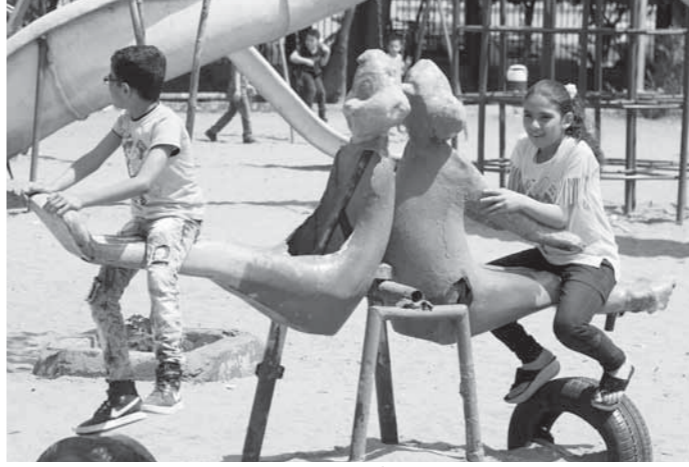
فرحة الأطفال في الملاهي