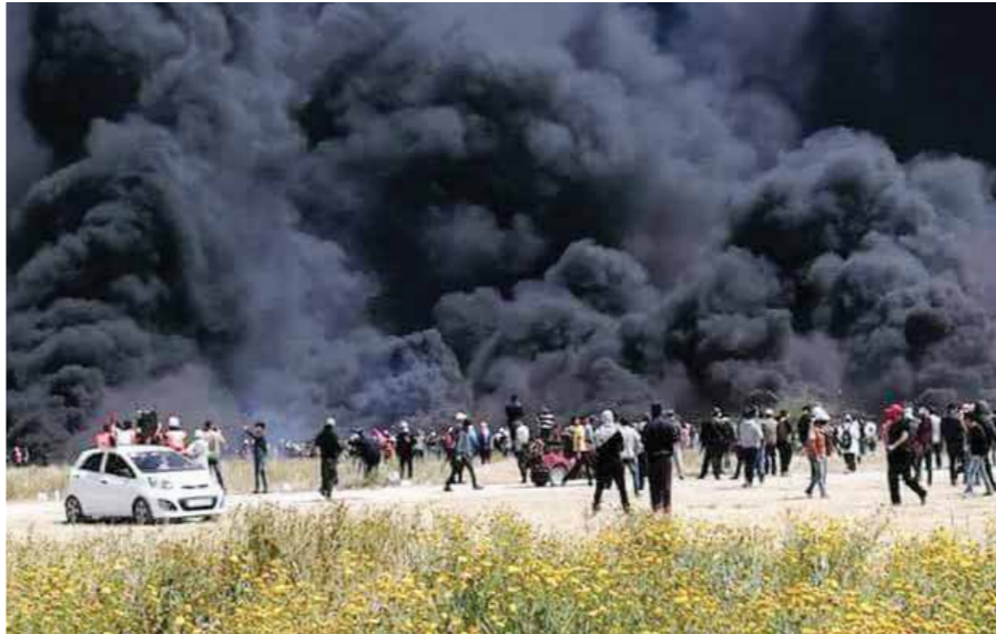
استمرار مسيرات العودة داخل الأراضي المحتلة

قصف، أمس، القوات الجوية الإسرائيلية هدفاً تابعاً لحماس في قطاع غزة، وزعمت قوات الاحتلال أن الاستهداف جاء بعد تجاوز 3 فلسطينيين الحاجز الحدودي الفاصل بين غزة وإسرائيل، ووزعوا متفجرات. وقد قصفت دبابات باتجاه غزة بعد قطع ثلاثة رجال الحاجز الحدودي، قبل عودتهم إلى القطاع، وبعد فترة قصيرة، عثر على جهازين متفجرين على طول الحاجز، وفقاً لما زعمته قوات الاحتلال، التي اتهمت الفلسطينيين بزرعهما. وجدت السلطات الإسرائيلية موقعها بتحميل حركة حماس مسؤولية ما يحدث على الحاجز الحدودي، وقالت في بيان لها «قوات الدفاع الإسرائيلية لن تسمح بالتسخير المعيب للمدنيين للتكر باسم النشاطات الإرهابية الجارية ضد المواطنين الإسرائيليين وقوات الدفاع الإسرائيلية، وستستمر بالاستجابة الصارمة لكافة المحاولات الإرهابية من هذا النوع». وأعلنت وكالة «وفا» الرسمية الفلسطينية، أن القوات الإسرائيلية قصفت بعدة صواريخ موقنين شمال غزة، وأوقعت أضراراً مادية جسيمة دون إصابات في صفوف المواطنين. كما استهدفت الزوارق الحربية الإسرائيلية