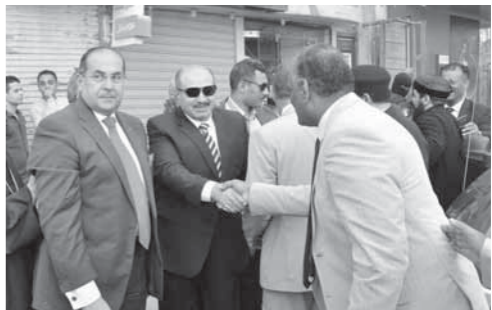
محافظ سوهاج يهنئ الأقباط بالعيد

توافد أهالي مركز ومدينة بسيون بمحافظة الغربية، أمس الاثنين، على حدائق المدينة احتفالاً بشم النسيم، حيث توافد عدد من أهالي المدينة، والقري المجاورة، على حديقة بسيون بمنطقة التنظيم، وعلى نهر النيل فرع رشيد بالقضاية، وخرجت العائلات لقضاء يوم سعيد للتمتع، بعيد شم النسيم.