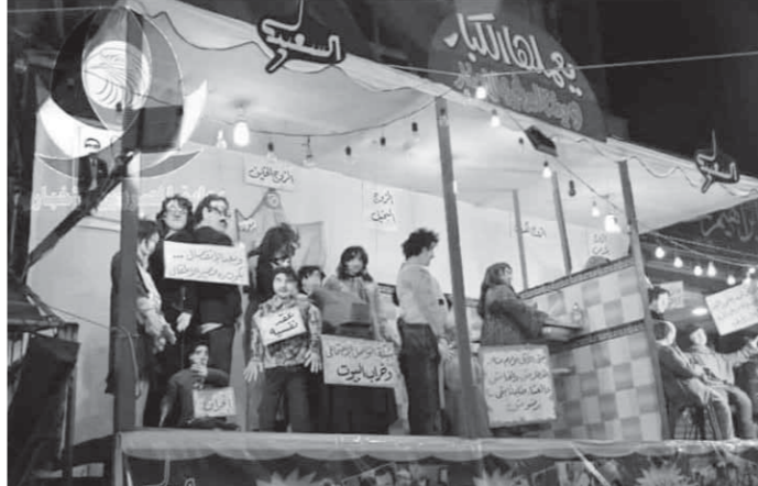
احتفالات واسعة في بورسعيد

شهدت بورسعيد إقبالاً شديداً على الحدائق والمتنزهات وعلى شواطئها ببورشيد وبورفؤاد احتفالاً بأعياد الربيع، كما ازدحمت القرى السياحية بروادها وعلى حمامات السباحة، وقضى أهالي المدينة الباسلة ليلة شم النسيم في الشوارع للاحتفال على أنغام السمسسية وسط دعوات «النبي» التي تشتهر بها بورسعيد، وقد شارك اللواء عادل الغضبان محافظ بورسعيد المواطنين للاحتفال بليلة شم النسيم بعد من الحدائق والمتنزهات وأماكن تجمعات المواطنين في الشوارع والميادين، وشملت الجولة مسرح «النبي» للفنان التشكيلي محسن خضير وعائلته التي تشتهر بها كل عام وتجول محسن «الغضبان» بحدائق الشهداء وسعد زغلول والأمل وشارع طرح البحر، وكانت المحافظة قد نظمت 3 احتفالات أحيיתה فرق صوت البحر للفن الثقافي والسمسية ونجوم الأغنية الشبابية وقصر ثقافة بورسعيد للفنون الشعبية للأطفال، وفي الصباح شهدت الشواطئ والأندية ومراكز الشباب إقبالاً وازدحاماً شديداً وسط حفلات ومسابقات وجوائز بكافة الاحتفالات.