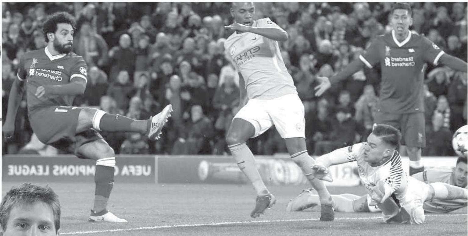
محمد صلاح يقود هجوم ليفربول أمام مانشستر سيتي