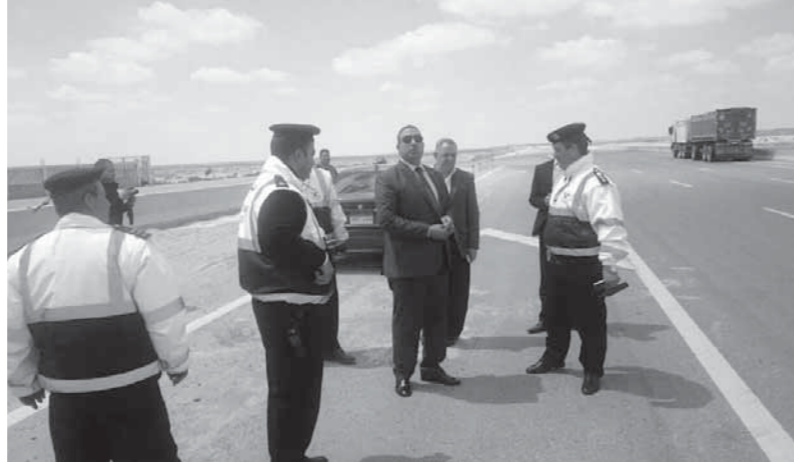
تأمين كامل على جميع الطرق