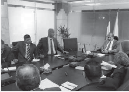
وزير البيئة خلال الاجتماع

كما استعرض الاجتماع آخر ما تم من أعمال تطوير بمحمية وادي الريان وجبل قطرانى، وتوجيه الدعوة لمحافظة الفيوم وأعضاء مجلس النواب بالمحافظة لتفقد أعمال التطوير التي تتم بالمحمية التي تشمل منطقة (الشلالات، ومراكز الزوار). وناقش الاجتماع الاستعدادات التي تم تنفيذها لاستقبال زائري المحمية خلال احتفالات المصريين بأعياد شم النسيم والإجراءات التي تم اتخاذها لحماية الأرواح ومنع السباحة بمنطقة الشلالات ومواجهة أى حادث طارئ.