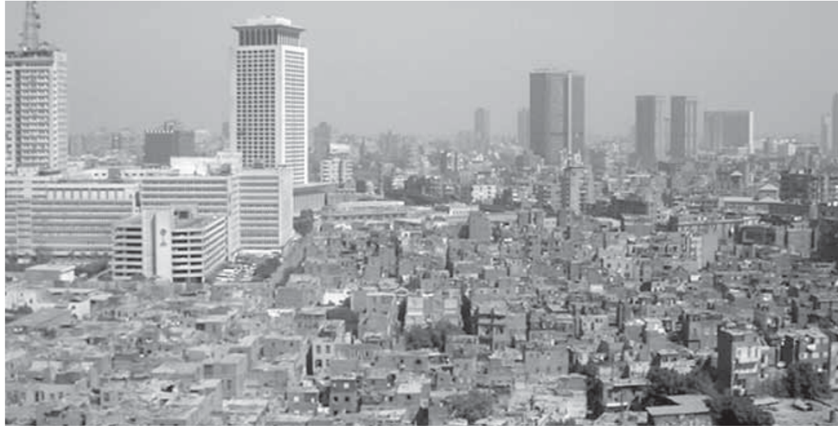
عمارات مثلث ماسيرو