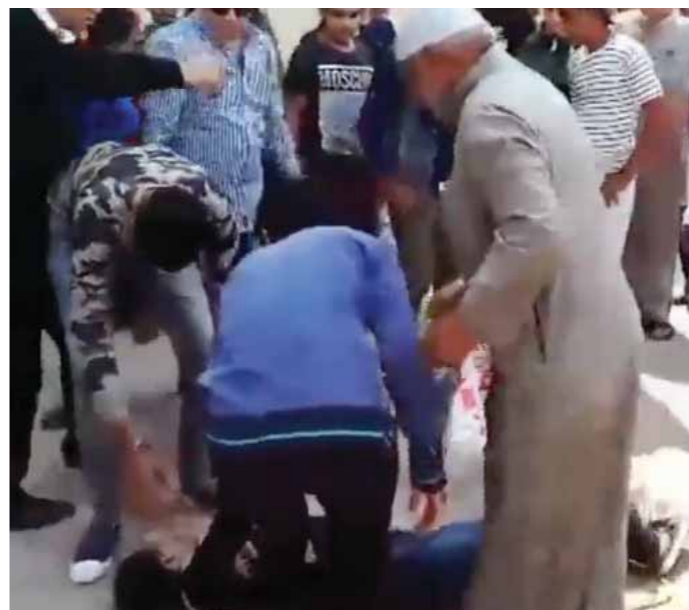
انتحار زوجة من أعلى كوبري قصر النيل في أول أيام شم التسميم

كتبت: أحمد الزيات وسيد الشورة ومحمد التهامي ومحمد علام: