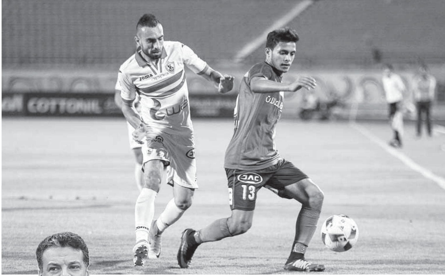
هزيمة المقاصة فجرت أزمات جديدة في الزمالك