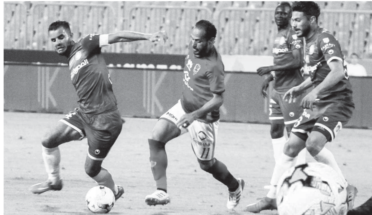
الأهلى فشل فى هز شبك سموحة

إرضاء كوبر والإعداد للمونديال يعد الرحيل إلى فنلندا حلاً مثالياً بالنسبة