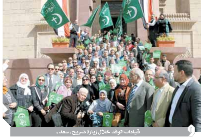
قيادات الوفد خلال زيارة ضريح سعد