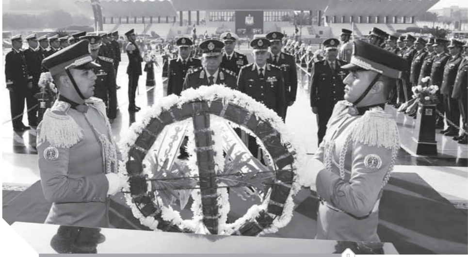
إكليل الزهور على النصب التذكاري للشهداء

وتوجه الفريق أول محمد زكي، القائد العام للقوات المسلحة، لزيارة الفاتحة على قبر الزعيم الراحل محمد أنور السادات، وقام القائد العام بمصافحة عدد من قدامى القادة السابقين وكبار قادة القوات المسلحة. وفي سياق متصل، أناب الفريق أول محمد زكي القائد العام للقوات المسلحة، وقادة الأفرع الرئيسية العسكرية في وضع إكليل الزهور على النصب التذكاري للجندى المجهول بهذه المناسبة ورافقه خلال المراسم المحافظون ومديرو الأمن.