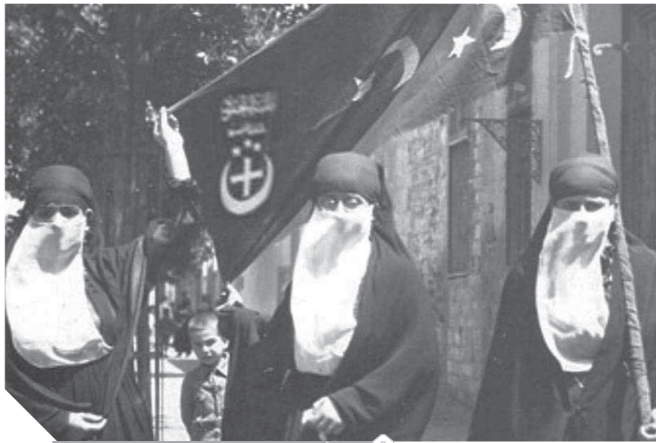
لاول مرة تخرج النساء في المظاهرات

ثم انضم إلى الوفد سينوت حنا عضو الجمعية التشريعية، وجورج خياط من كبار أعيان أسبوط، وحظا اليمين يوم ٢ من ديسمبر ١٩١٨. وسأل جورج خياط، سعد زغلول عن مصير ومركز الأقباط بعد انضمامهم للوفد. فجاب سعد: «اطمن إن لاقباط ما لنا من الحقوق وعليهم ما علينا من الواجبات على قدم المساواة».