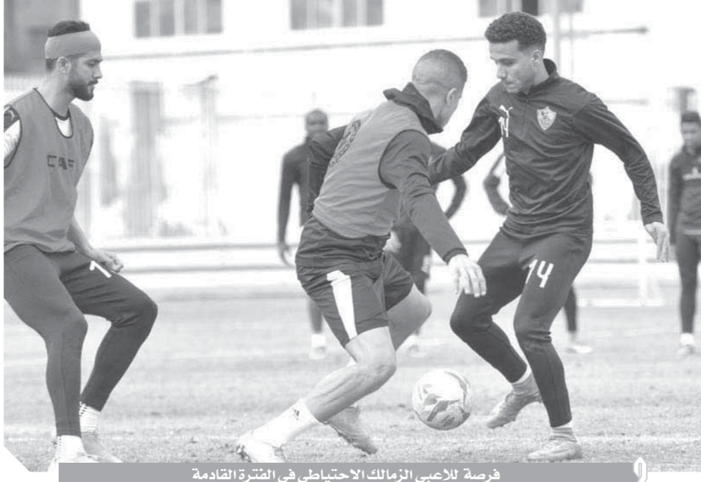
فرصة للاعبى الزمالك الاحتياطي فى الضربة القادمة

يواصل فريق الزمالك لكرة القدم تدريباته في الحادية عشرة صباح اليوم الثلاثاء على ملعب عبداللطيف أبو رجيلة استعداداً لمواجهة الاتحاد السكندري بعد غد الخميس باستاد الماكس بالاسكندرية في الجولة الأولى من الدور الثاني لبطولة الدوري. ويدير المدير الفني الفرنسي كارتيرون سياسة التدوير في الفترة القادمة من بطولة بداية من لقاء الاتحاد السكندري بهدف إراحة عدد من اللاعبين الأساسيين الذين دفع بهم في البطولة الإفريقية مع منع الفرصة لباقي زملائهم الذين يقاتلون في التدريبات والتخفيف من حدة أزمة دكة الاحتياطي في ظل الصراع القوى بين اللاعبين لحجز مكان في التشكيلة الأساسية، وأبرز هؤلاء محمود جنش ومحمد عواد ومحمد صبحي في حراسه المرمى ومحمد عبدالسلام ومحمد عبدالغنى وعبدالله جمعة وأحمد عيد في خط الدفاع والوسط والهجوم، من ناحية أخرى يعود اليوم فرجاني ساسى بعد انتهاء الإجازة التي حصل عليها بإذن من الجهاز الفني.