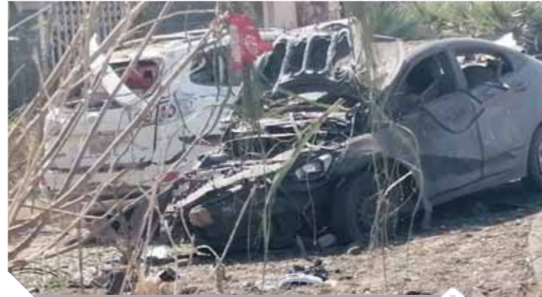
أثار الانفجار ومحاولة الاغتيال الفاشلة

وأظهرت لقطات بثتها محطات تلفزيون إقليمية وبعض وسائل التواصل الاجتماعي موكبا به عدد من السيارات الرياضية التي لحقت بها أضواء، وتصادف وجودهم بالقرب من موكب حمدوك أثناء الانفجار، بالإضافة إلى تعرض سيارة أخرى لأضرار جسيمة. ويعتقد أن الانفجار جرى بعبوة ناسفة، فيما لم يتعرض أحد لإصابات من جراء الحادث. وبعث رئيس الوزراء السوداني، عبدالله