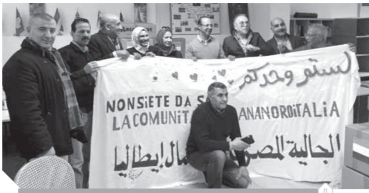
مساعداً غذائية للمصريين المحاصرين في مدينة لودي بإيطاليا

يدرس مجلس الوزراء برئاسة الدكتور مصطفى مدبولي، رئيس مجلس الوزراء، إيجاد حلول عاجلة لمشكلة التكدس أمام المعامل المركزية لوزارة الصحة من الراغبين في إجراء تحليل فيروس كورونا للسفر إلى الخارج. وأوضح وزير الصحة أنه يتم عمل الاختبار في مستشفى حميات العباسية بالقاهرة ومستشفى حميات إمبابة بالجيزة، وأن رئيس الوزراء قام بالتنسيق مع وزارة الخارجية لإرسال فريق عمل للمعامل المركزية لتوثيق الشهادات، وتولى وزارة الصحة إرسالها إلى السفارة المختصة مباشرة، وأعلنت الوزارة أن المواطن الألماني الذي توفي بفيروس كورونا يبلغ من العمر ٦٠ عاماً، وكان يعاني ارتفاعاً في درجة الحرارة عند وصوله إلى الفرقة قادمة من الأقصر، وتم وضعه في الرعاية المركزية لمماناته من قبل تنقسي ناتج عن التهاب رئوي حاد، ورفض النقل إلى مستشفى العزل، وساعات حالته حدث اضطراب في درجة وعيه، وتوفي أمس الأول، وأكد الدكتور خالد مجاهد، المتحدث الرسمي باسم وزارة الصحة، أن الحالة لم تمكث في مصر سوى ٧ أيام، من ناحية أخرى، أعلنت وزارة النقل أن وزير النقل