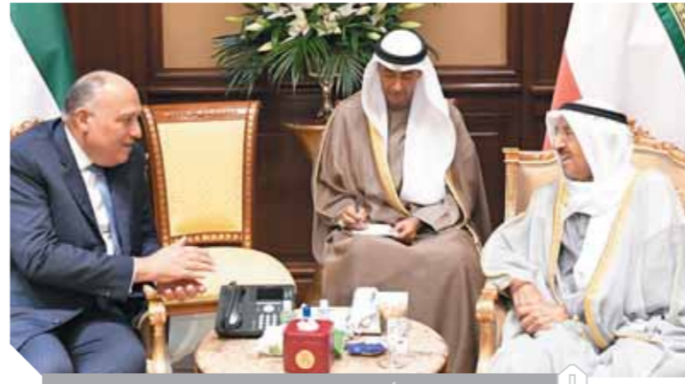
أمير الكويت خلال استقباله شكري

إلى الرئيس عبدالفتاح السيسي مثمناً على التنسيق والتشاور القائم بين البلدين على كافة المستويات، وبما يعكس أواصر العلاقات المتميزة والأخوية بين البلدين والشعبين الشقيقين.