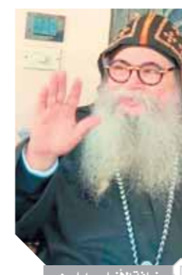
نبأقة الأنبا صرابامون

ورئيس دير الأنبا بيشوى بوادى التطرون، طالبين من الله عز وجل أن يمنحكم صبراً وسلواناً، وأن يعزى كل القلوب المتألمة، وأن يحافظ على مصر والمصريين جميعاً.