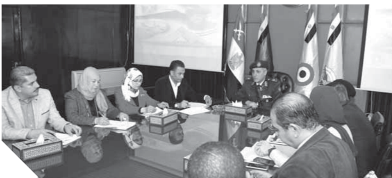
رئيس جمعية المحاربين القدماء خلال الحوار مع الإعلاميين

● لقد تعودنا دائماً أن التخطيط الجيد لا عمل