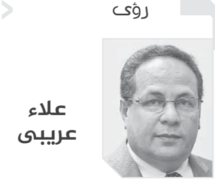
الشيخ خالد الجندي ورفاقه

وهذه الأمومة أذكروها من مذكرات فخري بك عبدالنور، وهي جزء لا يتجزأ من تاريخ مصر، أحد الأمراء الذين جاهدوا وضحاوا وبذلوا الجهد الكبير في القائلين بالحركة الوطنية خاصة في أثناء ثورة ١٩١٩، كان اسمه الأمير عزيز حسن، حفيد الخديو إسماعيل، كثر نشاطه في الحركة الوطنية، واشترك في كثير من الأعمال الوطنية والندمج في الشعب وتضيق الإنجليزي منه، فأسرلت إليه السلطة العسكرية الإنجليزية، يوم ٢ يوليو سنة ١٩٢١، تليها مع أحد الضباط الإنجليزي و مندوب من وزارة الداخلية، بأن يسافر إلى الخارج قبل يوم ١٠ يوليو، وقد قوبل هذا الإجراء بالاستعجاب، وأعاد الأمير بياناً على الأمة يقول فيه: