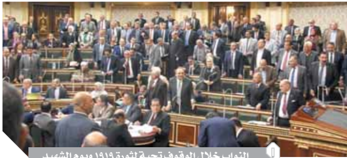
النواب خلال الوقوف تحية لثورة ١٩١٩ ويوم الشهيد