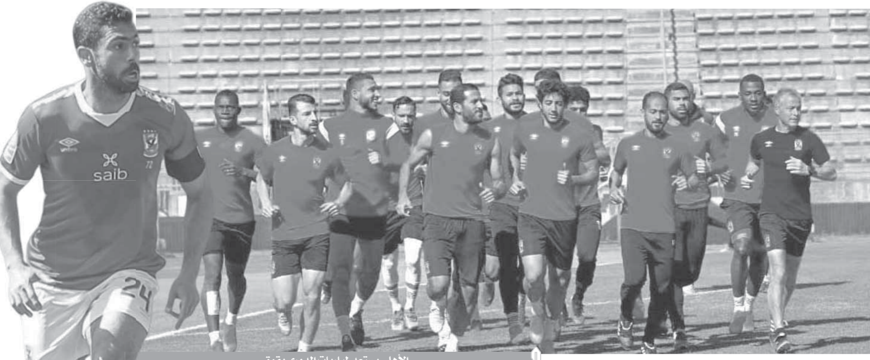
الأهلي يستعد لمباريات الدوري بقوة