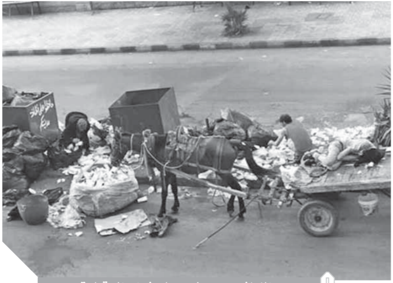
النباشون يسيطرون على شوارع الدقهلية