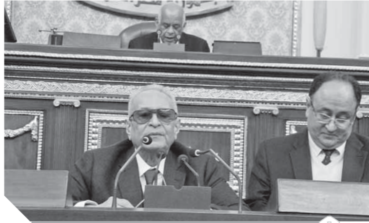
المستشار بهاء الدين أبوشقة يستعرض قانون حماية الآثار