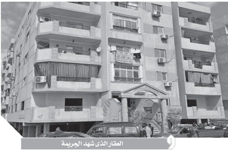
العقار الذي شهد الجريمة