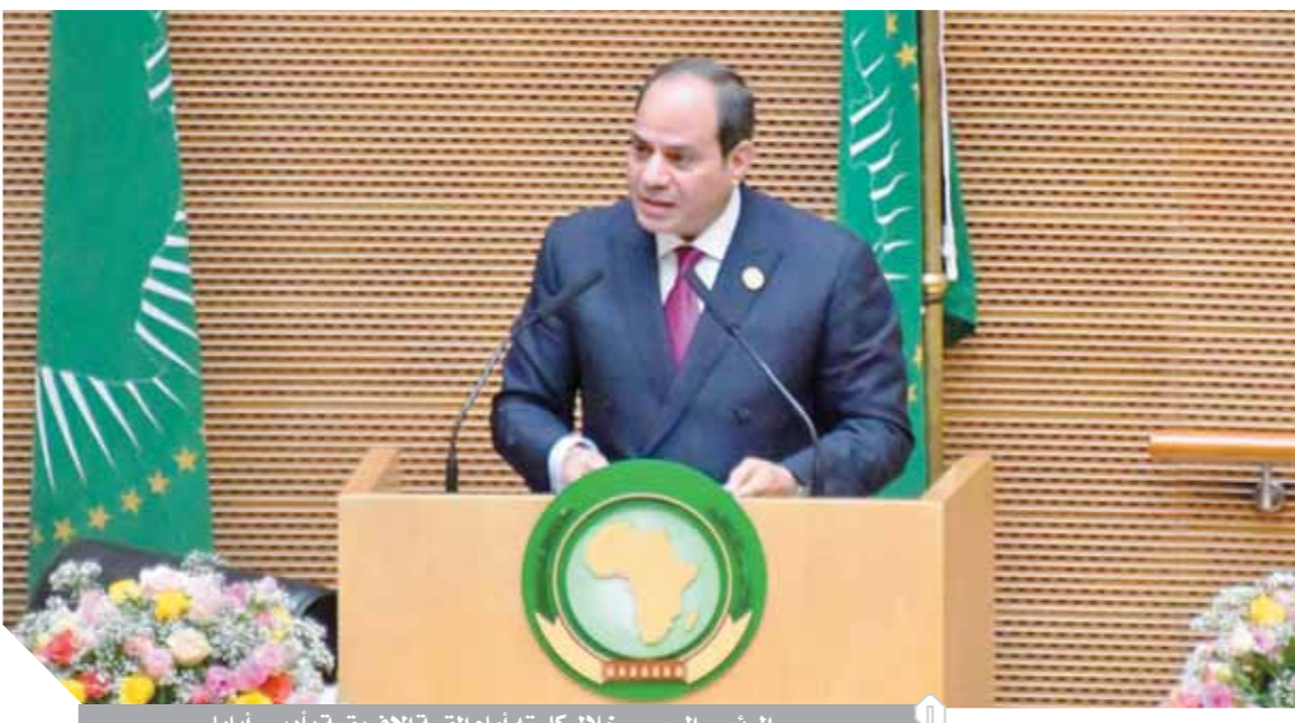
الرئيس السيسي خلال كلمته أمام القمة الإفريقية بأديس أبابا

هدفنا تعزيز السلم والأمن وترسيخ مبدأ الحلول الإفريقية لمشاكل إفريقيا