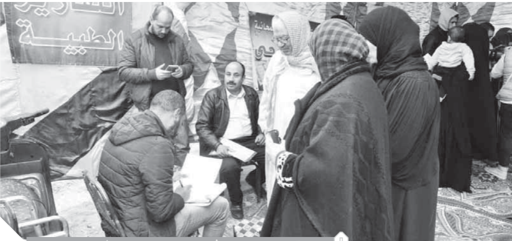
قافلة طبية شاملة لأهالي عزبة الهجانة لمدة ٣ أيام متتالية

سيارتى إسعاف لنقل المواطنين لمستشفى منشية البكري لعمل أشعة الرنين والديولار والمقطعية، وإعادةهم مرة أخرى بالمجان. ومن ناحية أخرى أكدت وزيرة الصحة عدم اكتشاف أي حالات مصابة بفيروس كورونا المستجد بمصر. جاء ذلك خلال تقديمها الجرحى الصحي بمطار الأقصر الدولي لمتابعة خطة التأمين الطبي الاحترازية لمنع دخول