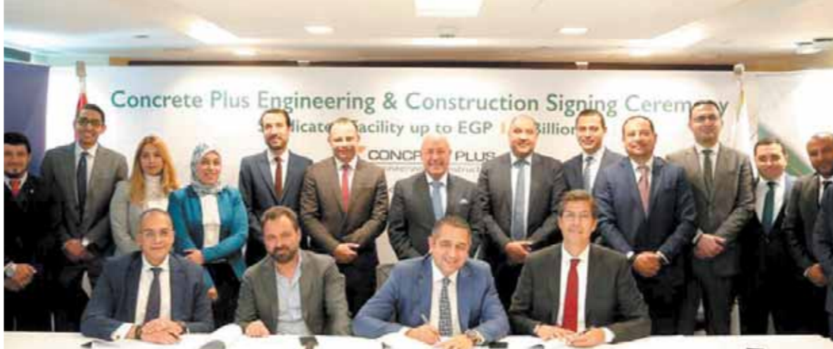
قيادات الأهلى وقطر وكونكريت خلال توقيع العقد

وقع بنكا «البنك الأهلى المصرى» كوكيل لتمويل مشترك مع بنك قطر الوطنى «الأهلى» عقد تمويل مشترك متوسط الأجل بقيمة تصل إلى ١,٨ مليار جنيه لصالح شركة كونكريت بس للهندسة والأشغال بغرض تنفيذ عملية المقاولات المسندة للشركة من جانب جهاز تنمية مدينة العلمين الجديدة التابع لهيئة المجتمعات العمرانية الجديدة والخاصة بالمرحلة الأولى من المرحلة الأولى الخاصة بالمرحلة الأولى الشاطئية بمدينة العلمين الجديدة.