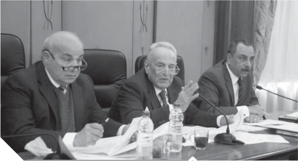
أبوشققة، خلال اجتماع اللجنة التشريعية بمجلس النواب