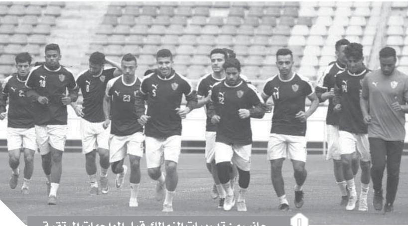
جانب من تدريبات الزمالك قبل المواجهات المرتقبة