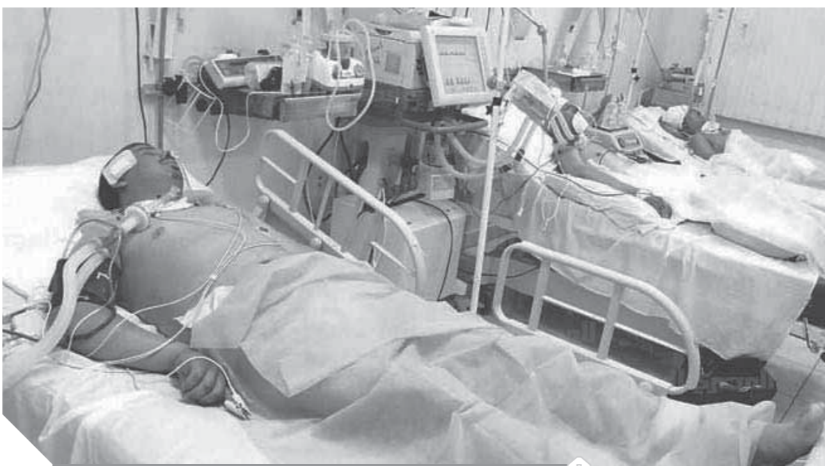
نقص حاد في أسرة الرعاية المركزة

مؤسس وحدة أورام الكبد بالمعهد القومي للكبد، والمستشار الطبي للمركز المصري للحق في الدواء هناك احصائية أننا نحن ١٤,٥٠٠ سرير رعاية مركزة والواقع أن الموجود أقل من ١٠ آلاف سرير وهذا بخلاف أسرة الرعاية الموجودة على الورق وهي خارج الخدمة ويوجد نقص حاد في عدد الأسرة وأي مواطن يجد صعوبة في الحصول على سرير رعاية لأقاربه وهذه مشكلة كبيرة وليس المشكلة في توفير سرير رعاية فقط ولكن الأهم توفير التجهيزات الطبية اللازمة له فتكلفتها عالية جدا وهناك نقص في الأطقم الطبية من تمريض وأطباء في أقسام الطوارئ والرعاية المركزة. واستطرد بأن هذا القرار خطوة تصحيحية نحو تحسين الخدمة الصحية وتوفيراً للاستحقاق الدستوري بالنسبة لموازنة الصحة وهي ٣٪ وكانت العام الماضي ٧٢ مليار أى أقل من ٧٢٪.