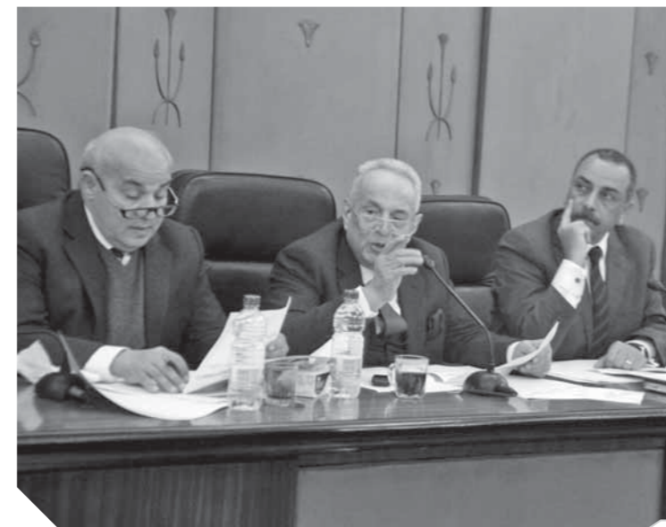
المستشار أبوشقة رئيس اللجنة التشريعية يناقش قانون الكهرباء

عدم الإخلال بأى نصوص عقابية أشد ومعناه أننا نعرف أن هناك نصاً عقابياً أشد وأصدرنا نصاً آخر». وتضمن مشروع القانون الحبس مدة لا تقل عن ستة أشهر وبغرامة لا تقل عن عشرة آلاف جنيه ولا تزيد على مائة ألف جنيه أو بإحدى هاتين العقوبتين، لكل من قام أثناء تادية أعمال وظيفته فى مجال أنشطة الكهرباء أو بسببها بارتكاب أحد أفعال توصيل الكهرباء لى من الأفراد أو الجهات دون سند قانونى بالمخالفة لأحكام هذا القانون والقرارات المنفذة له أو علم بارتكاب أى مخالفة لتوصيل الكهرباء ولم يبادر بإبلاغ السلطات المختصة، وكذلك إذا امتنع عمداً عن تقديم أى من الخدمات المرخص بها دون عذر أو سند من القانون، وكانت العقوبة الحالية الحبس مدة لا تزيد على ستة أشهر وبغرامة لا تزيد على خمسين ألف جنيه.