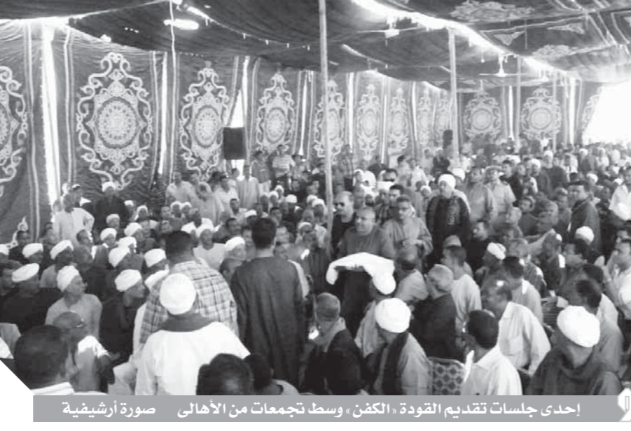
إحدى جلسات تقديم القودة «الكفن» وسط تجمعات من الأهالى صورة أرضيشية

رغم أننا في القرن الواحد والعشرين ودخول التكنولوجيا الحديثة جميع المنازل وارتفاع نسب التعليم وانتشار المدارس بالتنوع والقرى والمراكز بكثافة عالية، فإن مشاكل التآر لا تنتهى ولم تقلع معها كل وسائل الزرع القانونية، التآر تلك العادة الجاهلية المترسخة بقوة في الثقافة الجمعية لأهل الصعيد ولم تفلح كل وسائل التحديث أن تقاوم أو تحاصر ثقافة التآر فرغم ازدياد أعداد المتعلمين وارتفاع نسبة الحاصلين على أعلى الشهادات الجامعية وزيادة عدد الجامعات والمدارس، فإن عادة التآر لا تزال موجودة بقوة لا يمكن مقاومتها. صعيد مصر منطقة وعرة حاكمة الظلام فبين سواد الفقر وهوان الجهل والمرض الذي يتبع فيه أكثر القرى في جنوب مصر تنفجر الأوضاع من أن لآخر لنفتح أعيننا على حادث غدر يسمونه التآر وأخطر مكان زائر الموت الذي يأتي من حيث لا تحسب ويقتل من لا يستحق القتل ومن أن لآخر تتعدد جلسات صلح هنا وهناك لتصفية الخصومات الثأرية لكنها غالباً ما تكون عبارة عن «فض مجالس» بحسب التعبير المصري الدارج وتشير المعلومات إلى تربع محافظة سوهاج على رأس محافظات الوجه القبلى بل وعلى محافظات الجمهورية كافة في حوادث التآر.