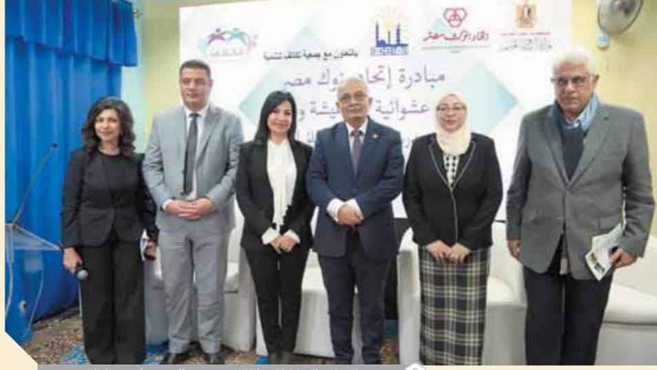
القيادات خلال افتتاح مدرسة عرب كفر العلو

وطالب الدكتور حجازى بضرورة العمل على تقييم المهارات الهندسية للطلاب فى المراحل التعليمية المختلفة التى تتكفل توفير فرص للطلاب للتعليم والتفكير فى تعلمهم، مشيراً إلى أن الوزارة مستعدة بالتعاون مع اتحاد بنوك مصر وجمعية تكاتف للتنمية لتقديم الكوادر القادرة على تقييم المهارات الحياتية للطلاب لإعداد جيل جديد