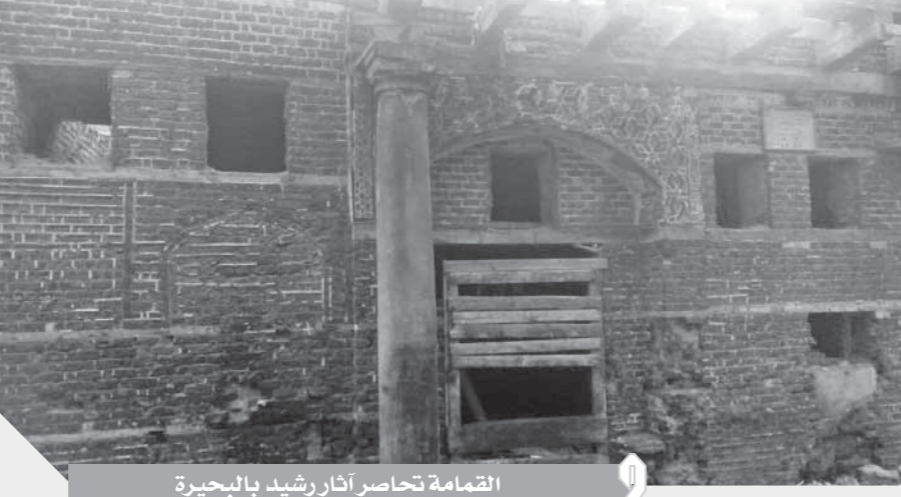
القمامة تحاصر آثار رشيد بالبحيرة

ولم يقتصر الإهمال على شارع دهليز الملك الشهير بل تحولت واجهات العديد من المنازل الأثرية بوسط المدينة إلى معارض لبيع الملابس الشعبية وسط صمت تام لمجلس المدينة الذي لم يتدخل لإيقاف تلك المأساة. كما أصبح منزل المناديل آيلا للسقوط فوق رؤوس المارة بعد أن تعرضت أجزاء كبيرة من المنزل للسقوط الذي تحول إلى مقلب للقمامة ومرتعاً للقطط والفئران بعد اختفاء باب المنزل. وفى النهاية طالب أهالى رشيد بسرعة تدخل الأجهزة المحلية لوقف تلك المأساة التي تهدد بسقوط العديد من المنازل الأثرية وضياح ثروات هامة يمكن استغلالها في جذب السياح من جميع أنحاء العالم لهذه المدينة التي منحها الله السحر والجمال لوقوفها عند التقاء نهر النيل بالساحل المتوسط ولكن أهملها المسئولون على مدار السنوات الطويلة الماضية.