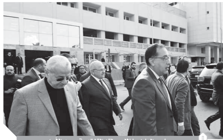
رئيس الوزراء خلال جولته التقديرية بمعهد الأورام

واستحداث دورين لعلاج الألم والكشف المبكر واستراحات الأطباء، مع ربط منطقة الكشف المبكر وعلاج الألم بالدور الإداري، إلى جانب استحداث صالة انتظار خاصة بالمرضى وذويهم بسعة ١٥٠ فرداً تقريباً وإضافة دورات مياه جديدة، بالإضافة إلى استحداث مدخل منفصل على مسار الكورنيش ومخرج هروب.