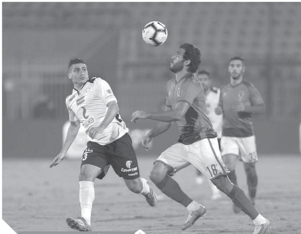
مواجهة الأهلي والطلائع تتسم بالندية