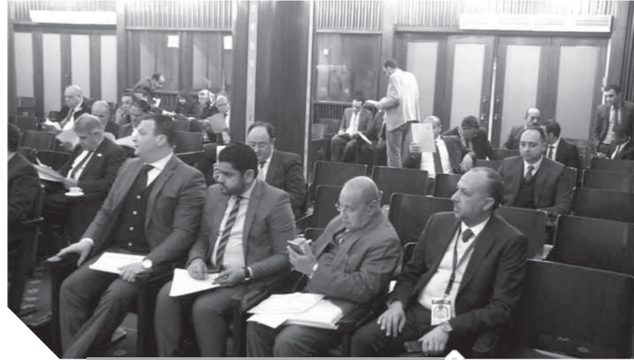
اللجنة التشريعية بمجلس النواب خلال اجتماعها أمس