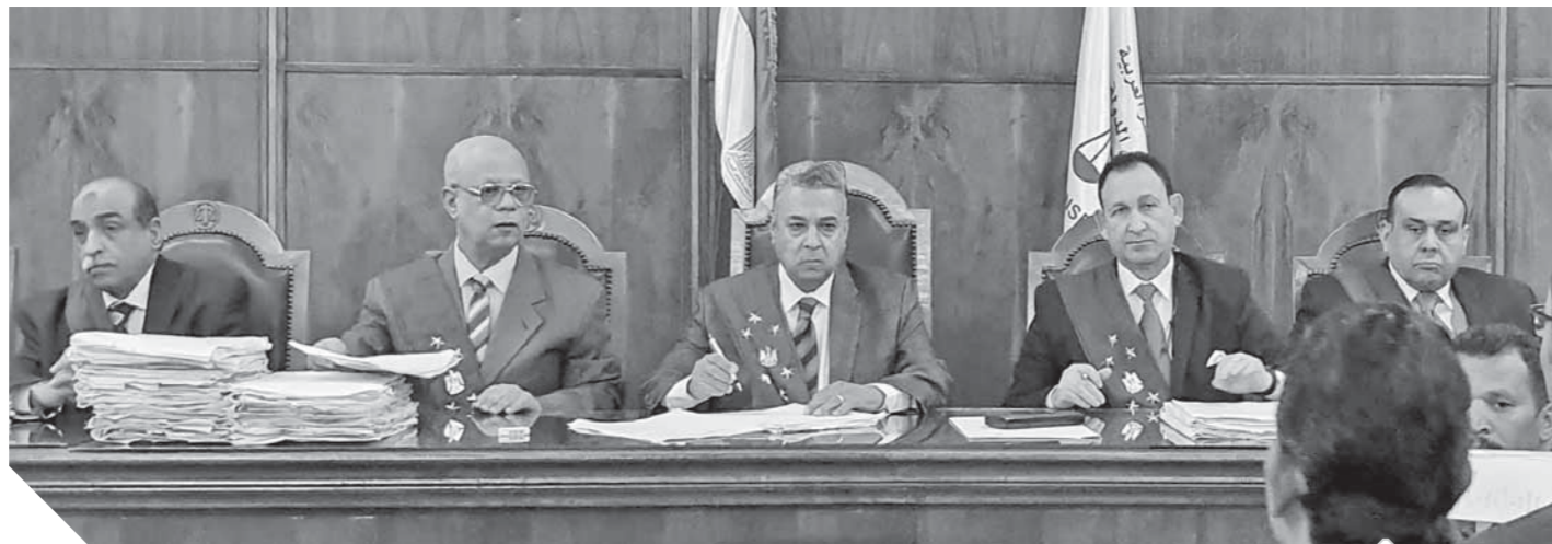
هيئة الحكمة الإدارية العليا برئاسة المستشار عادل بريك وعضوية المستشارين سيد سلطان ومحمد فخاخي وحسن محمود ونبيل عصا الله

أوراق بتأييد جميع الطالبات اللاتي سمعت أقوالهن وما أدلى به باقي الشهود من أن الشكاوى التي تم التحقيق فيها تلك سمعة الطاعن المتحرف بما يشكل في حقه إخلالاً جسيماً بكرامة وظيفته وانحداراً بمسلكه إلى الدرك الأسفل، وإثماً ناديباً يستوجب بتره من المؤسسة التعليمية، لمخالفته الالتزامات القانونية الواجبة عليه فضلاً عن مخالفته تعاليم الشرائع السماوية وما يوجبه الدين من كسائهن بكساء العفة والوقار ويؤكد على عدم صلاحيته لشغل تلك الوظيفة. وذكرت المحكمة أن الطعن المائل كشف عن آفة خطيرة وداء عضال وهي تحرش المعلمين بتلميذات المدارس في محراب العلم، الذي انتشر في هذا الزمان، وهي الحلقة الأولى في حياة الطفل، حيث ظن كثير من أهل الشهوات أنهم أحرار في عقولهم وأجسادهم يتصرفون فيها بما تمليه عليهم شهواتهم فانطلقت شهواتهم من أعنتها تيجت عن فرائسها متحرشة بالفتيات والأولاد على السواء، إن التحرش الجنسي ظاهرة إنسانية عانت منها البشرية وإلازالت بالرغم من التعاليم الإلهية بتأثير هذه الظاهرة وأفعالها، وبالرغم من التطور الحضاري الذي بلغته الإنسانية وتجرىم الدول لظاهرة التحرش ضد المرأة إلا أنها لازالت متفشية وفي ازدياد. وأوضحت المحكمة الأمم المتحدة خصصت يوم ٢٥ نوفمبر من كل عام باعتباره اليوم الدولي للضحايا على العنف ضد المرأة، ولقد بادر المشرع المصري إلى ذلك في نص في المادة ٢٠٦ مكرر ١ من قانون العقوبات على الحبس مدة لا تقل عن ستة أشهر وبغرامة لا تقل عن ثلاثة آلاف جنيه ولا تزيد على خمسة آلاف أو بإحدى هاتين العقوبتين لكل من تعرض للغير في مكان عام أو خاص أو مطروق باتيان أمور أو إيهابات أو تلميحات جنسية