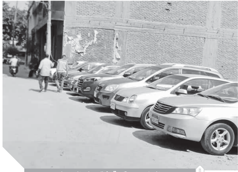
السائيس يحكم قبضته على الرصيف

رغم حملات الانضباط بمدن ومراكز المحافظة لردع المخالفين