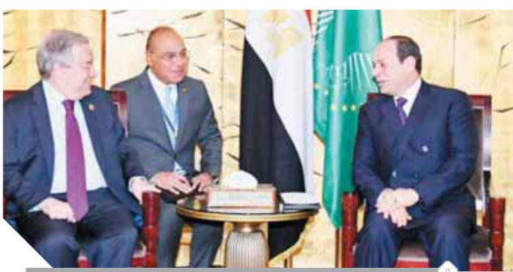
السيسي، خلال لقائه سكرتير عام الأمم المتحدة

كما استعرض السيسي في هذا الإطار الأولويات الموضوعية التي دفعت بها مصر خلال رئاستها للاتحاد الإفريقي، واستهدفت بالأساس مواصلة التقدم المحرز في تنفيذ أجندتي التنمية القارية والأممية في إفريقيا، وتعزيز مشروعات التكامل والاندماج الإقليمي، فضلاً عن تحقيق خطوات ملموسة على مسار تنسيوية النزاعات والوقاية منها في مختلف ربوع القارة، وكذلك استكمال