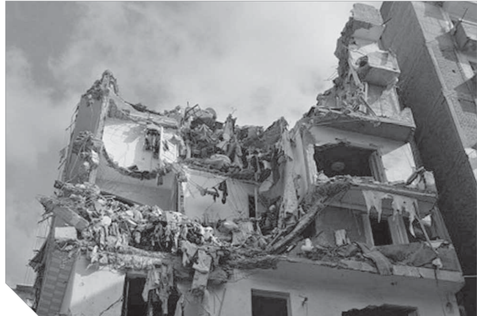
المباني المخالفة تهدد حياة المصريين

هدم المباني والمنشآت غير الآيلة للسقوط والحفاظ على التراث المعماري، موضوعاً أن الهدف من التعديل هو إعادة حصر جميع المباني القديمة الآيلة للسقوط لإعادة هدم شديد الخطورة منها والحفاظ على ما يتدرج تحت التراث المعماري ووجوده لا يشكل خطورة على حياة المواطنين، مشدداً على ضرورة وضع معايير وأسس واشتراطات جديدة للمباني التي من المفترض اعتبارها تراثاً معمارياً، مطالباً أيضاً بسهولة إصدار تراخيص الهدم والبناء لتشجيع المواطنين والتخفيف عنهم للإقبال على هذه الخطورة، وللحفاظ على الثروة العقارية في مصر، وهذا لن يتم سوى بتعديل قانون 144 لسنة 2006، بالإضافة إلى ضرورة وجود قاعدة بيانات دقيقة وحصر شامل لجميع المنازل الآيلة للسقوط وشديدة الخطورة.