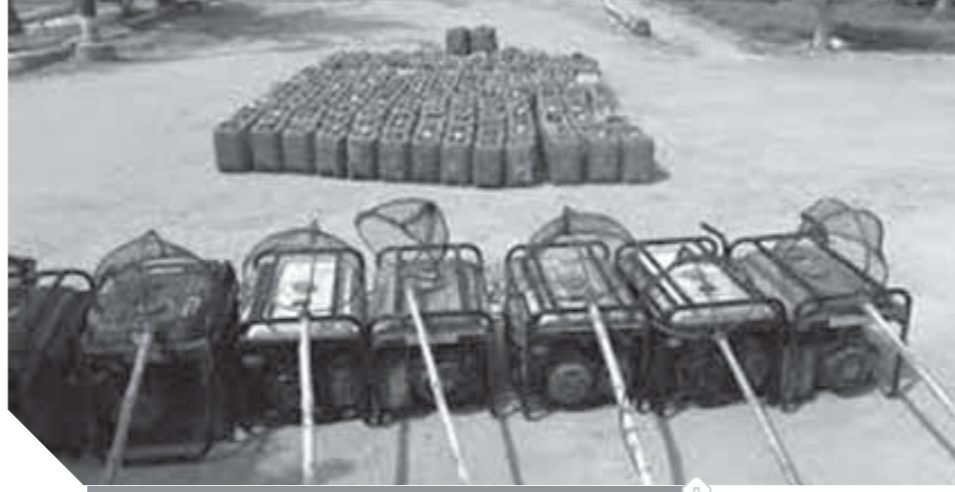
المعدات المستخدمة في الصيد بالكهرباء