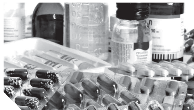
أدوية بير السلم تهدد صحة المواطنين