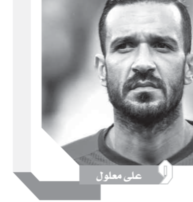
كتب: محمد اللاهوتى

جدد النادي الأهلى عقدي الثنائي التونسي على معلول وكريم وليد «نيفيد» لاعبي الفريق ليبدأ مسلسل الحفاظ على نجوم الفريق الذين تنتهي عقودهما خلال الموسم القادمين. وأعلن عبد الحفيظ توقيع معلول لمدة موسمين آخرين لينتهي عقده الجديد مع الفريق فى صيف 2022 كما تم تجديد عقد نيفيد لمدة 3 مواسم أخرى لينتهي فى 2024. وأشاد عبد الحفيظ بموقف الثنائي وترحيبهما بالاستمرار مع الأهلى وتوقيعهما دون الدخول فى مزايدات مالية.