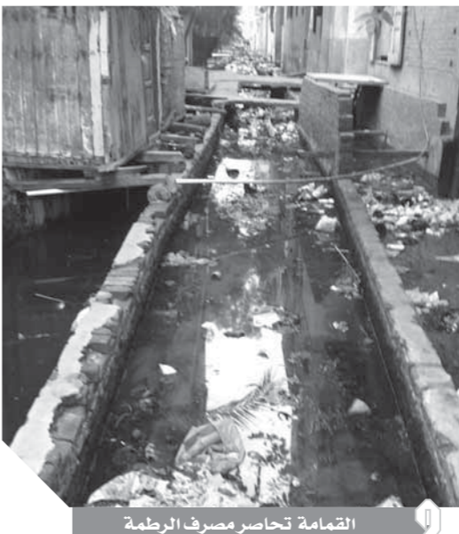
القمامة تحاصر مصرف الرطمة