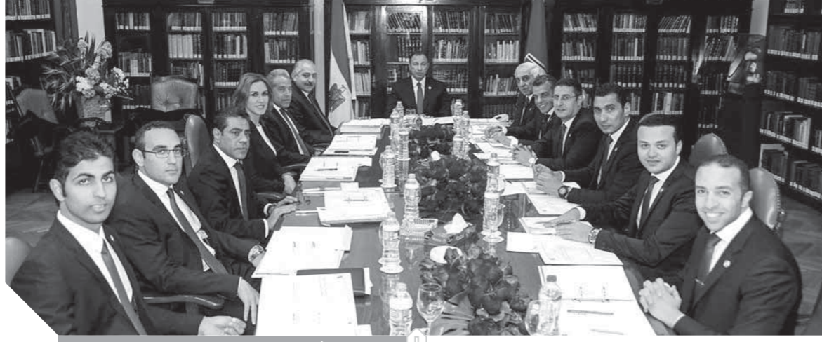
مجلس الأهلي رفض أي تعديلات في جدول الدوري

لن يخوض أية مباراة قادمة إلا بحضور جماهيره وفقاً للشروط التي تم الاتفاق عليها في السابق ويتم تطبيقها الآن.. وحال قيام اتحاد الكرة باختيار ملاعب بديلة غير مسموح فيها بالحضور الجماهيري للملاعب التي سيتم إغلاقها استعداداً لكأس الأمم الإفريقية يكون الاتحاد هو المسئول عن الحصول على الموافقات المطلوبة ومن بينها الموافقة الأمنية لحضور الجماهير. وقرر المجلس مقاطعة البطولات العربية القادمة بسبب الإساءات المتكررة من الرئيس الحالي للاتحاد العربي لكرة القدم بحق مجلس إدارة الأهلي الممثل الشرعي للنادي وأعضائه وجماهيره الأمر الذي يسلب الاتحاد العربي مظلة التي من المفترض أن تجمع الأندية العربية على الحب والاحترام المتبادل.