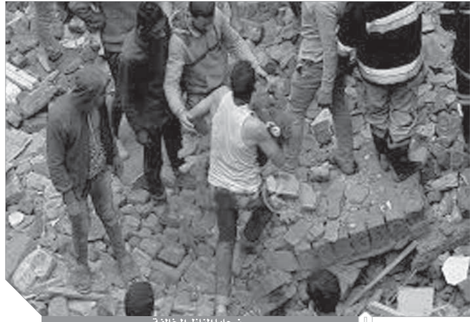
ضحايا المنازل المخالفة