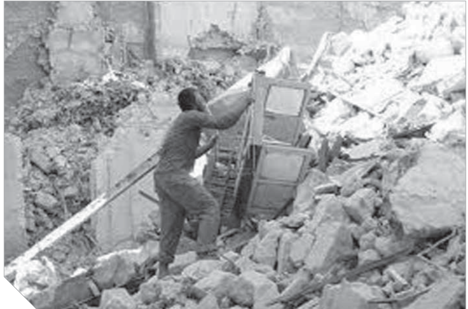
٩٠ ألف تنتظر الإزالة