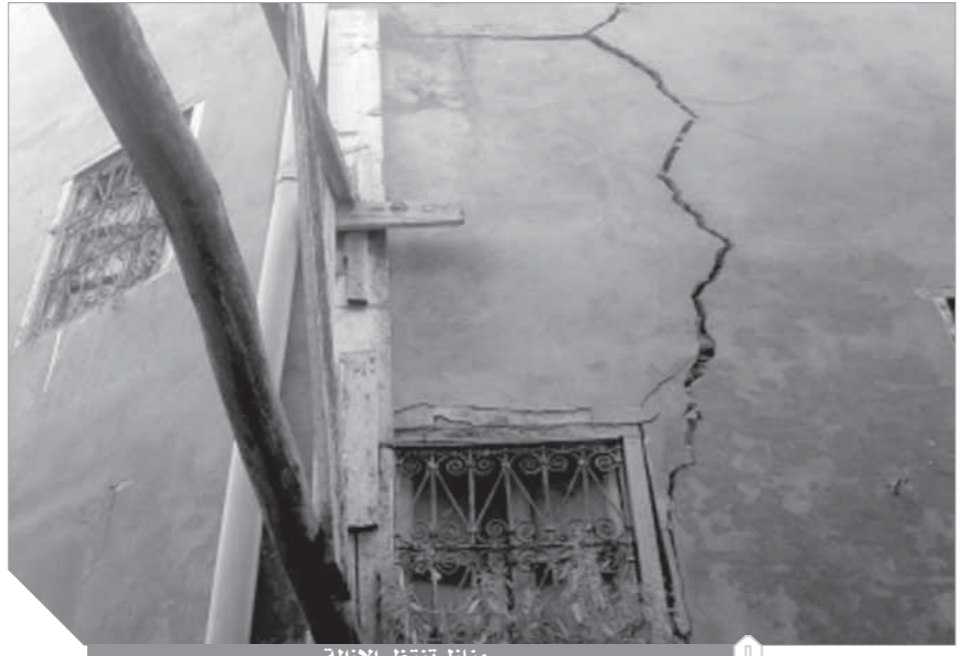
منازل تنتظر الإزالة

هذه التعليمات لو دخلت حيز التنفيذ ستخضع على واحدة من أكبر المشكلات التي يواجهها المصريون، فعدد هذه المساكن الآيلة للسقوط يصل في المتوسط إلى مليون مسكن ويصل في بعض التقديرات إلى 3 ملايين، تضم أكثر من خمسة ملايين أسرة، يعيشون على كف عزرائيل، ينتظرون الموت في كل لحظة.