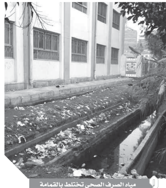
مياه الصرف الصحي تختلط بالقمامة

تريد تغطية المصرف بالكامل، حيث إن تغطية المصرف حماية لأهل القرية وللأطفال والقضاء على التلوث.