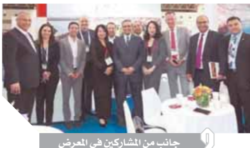
جانب من المشاركين في المعرض

الذي يدعو معظم الشركات السياحية الصينية وكبرى الشركات العاملة والمتخصصة في السياحة الخارجية من الصين (outbound). ويقول مستر مات إن المعرض في هذا العام يحظى على أجنحة لساحة المؤتمرات والمراسم والحواجز Luxury show بجانب السياحة العادية. وقد اشتركت هذا العام كبرى الشركات السياحية من كينيا والبوسنا ودولسورف بألمانيا. وتقوم إدارة المعرض بتحديد مواعيد مسبقاً للشركات السياحية لزيادة إيراداتها العارضة بعد معرفة رغبتهم في السفر إلى أي منطقة في العالم.