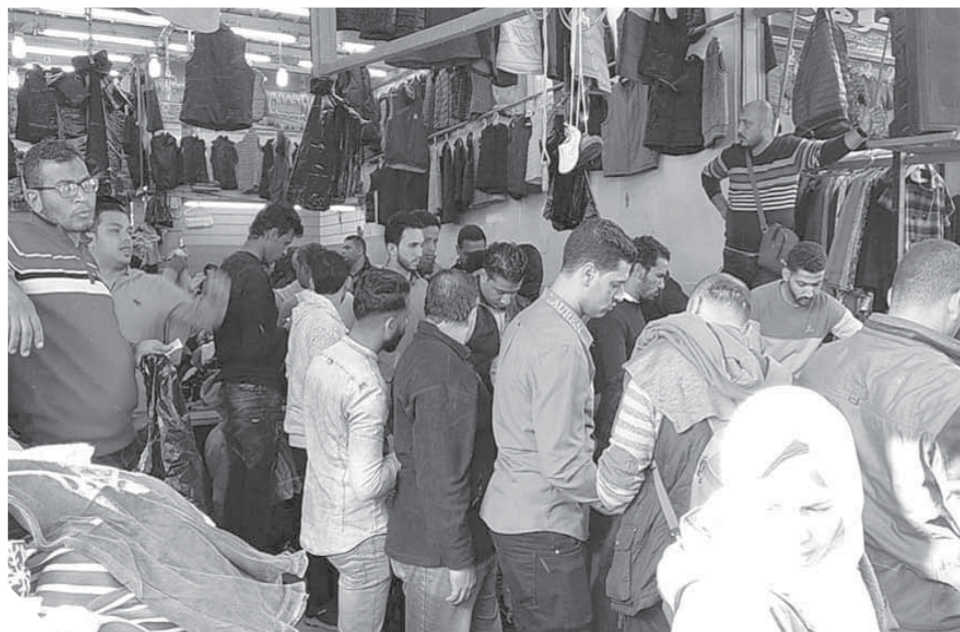
أسواق بورسعيد التجارية