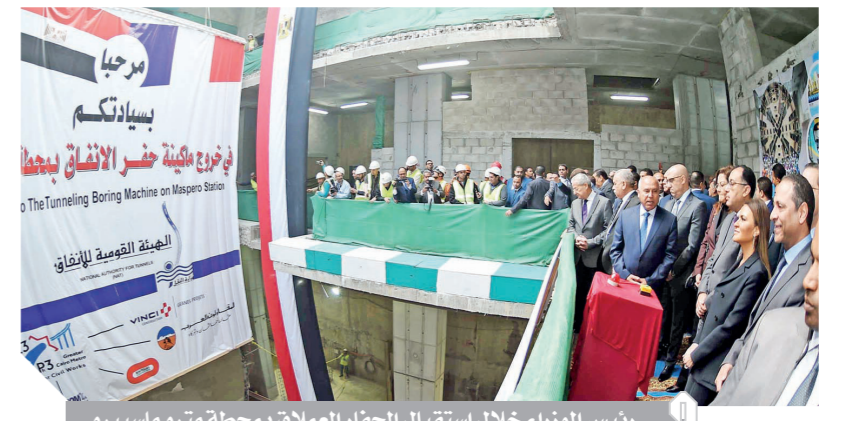
رئيس الوزراء خلال استقبال الحظار العملاق بمحطة مترو ماسبيرو

«عبدالعال» يتهم بعض الوزراء بتصدير المشكلات للدولة «النواب» ينتقد الإهمال في الشهر العقاري