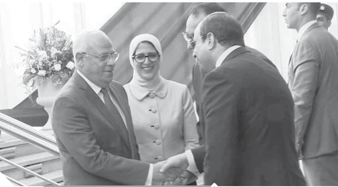
الرئيس السيسي، خلال زيارته لبورسعيد

• يتكلم البعض بأنك تسعى لإلغاء المنطقة الحرة، وبالتالي البطاقات الاستيرادية.. ما ردك؟ • هذا الكلام عار تماماً من الصحة، والمنطقة الحرة قائمة ولم تلغ ولم نسع لإلغائها، والمنطقة الحرة موجودة ونسعى لتطويرها وتحويل بورسعيد لجلالات أخرى في الصناعة والسياحة والزراعة، بجانب