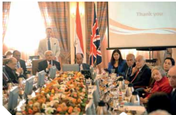
مجلس أمناء الجامعة البريطانية

وأوضح السفير البريطاني بالقاهرة، السير جيفرى آدمز أهمية التطوير والاستثمار في رأس المال البشري والإنسان المصري، من حيث التعليم والصحة وريادة الأعمال، لما لذلك من أثر في رفع وتيرة التقدم والنهوض، مؤكداً أن الجامعة البريطانية في مصر تدعم الدولة المصرية بخريجين لديهم القدرة على تحقيق التفارق.