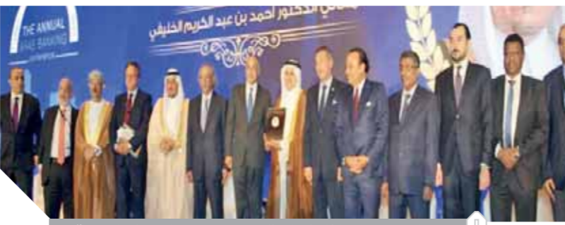
طارق عامر خلال فعاليات مؤتمر اتحاد المصارف العربية

المصرفي العربي أضحت متماسكاً بشكل كبير بمساندة البنوك المركزية العربية، وتأمينها. وقال محمود محيي الدين، نائب رئيس البنك الدولي: إن هناك بعض التطورات الإيجابية للغاية في بعض الدول العربية، بينما هناك دول أخرى تعاني من تطورات سلبية للغاية. وأوضح أن المؤسسات الدولية تتوقع نمو الدول العربية بما لا يتجاوز ٠.٦٪ خلال العام الجاري وهي نسبة ضئيلة للغاية مقابل ٠.٦٪ العام الماضي، متوقع وصوله لنحو ٠.٢٪ العام المقبل بدعم التطورات الإيجابية على مستوى قطاع الطاقة والبنزين. وأكد أن النمو الاقتصادي العربي لا يلي تطورات واحتياجات المواطنين على الإطلاق، مشدداً على ضرورة زيادة الاستثمار في رأس المال البشري والوقاية من المخاطر بزيادة النمو الاقتصادي، مشيراً إلى أن التنمية المستدامة عالمياً ليست في وضع جيد على الإطلاق، وأن الأمم المتحدة طالبت الدول بتبني رؤية ملهمة لتحقيق مستهدفات ٠.٢٠٣٠.