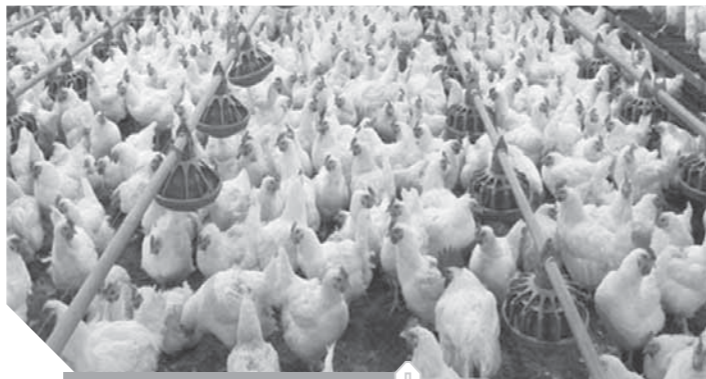
مزرعة دواجن صورة أرشيفية