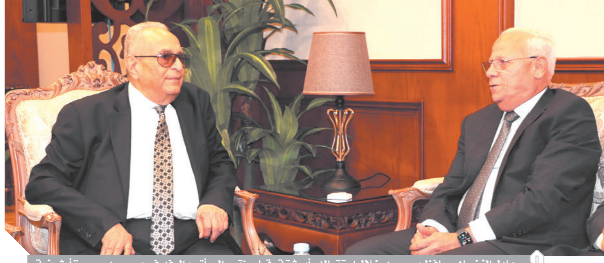
عادل الغضبان محافظ بورسعيد خلال استقباله «أبوشقة» قبل مؤتمر المرأة مع الوفد في بورسعيد - صورة أرشيفية

الوفد أقدم الأحزاب السياسية وعلاقتي بقياداته وثيقة