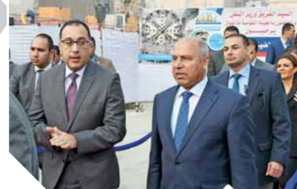
مدبولي ووزراء النقل والتخطيط والاستثمار خلال إطلاق إشارة دخول ماكينة الحفر محطة ماسبيرو

أكد الدكتور مصطفى مدبولي، رئيس مجلس الوزراء، أن جهود الدولة من أجل النهوض بكافة مرافق قطاع النقل تستهدف تحقيق الربح بين مختلف أنحاء الجمهورية، بما يخدم أهداف التنمية ويسهم في التيسير على المواطنين، مشيراً إلى أن مرفق مترو الأنفاق شريان حيوي مهم ينقل ملايين الركاب يومياً، لافتاً إلى أن هناك تكاليفات من الرئيس عبدالفتاح السيسي رئيس الجمهورية بالعمل على استكمال كافة مراحل والارتقاء بالخدمات التي يقدمها. جاء ذلك خلال إطلاق إشارة دخول ماكينة