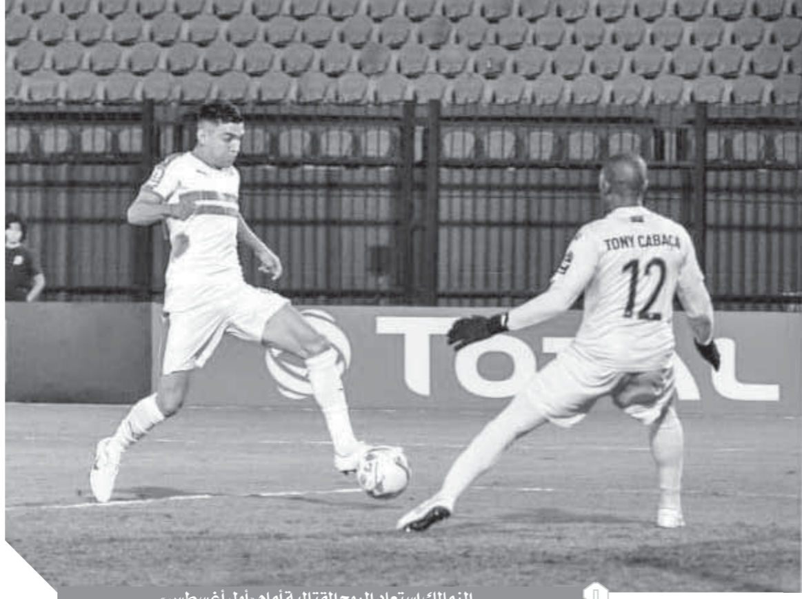
الزمالك استعاد الروح القتالية أمام أول أغسطس،