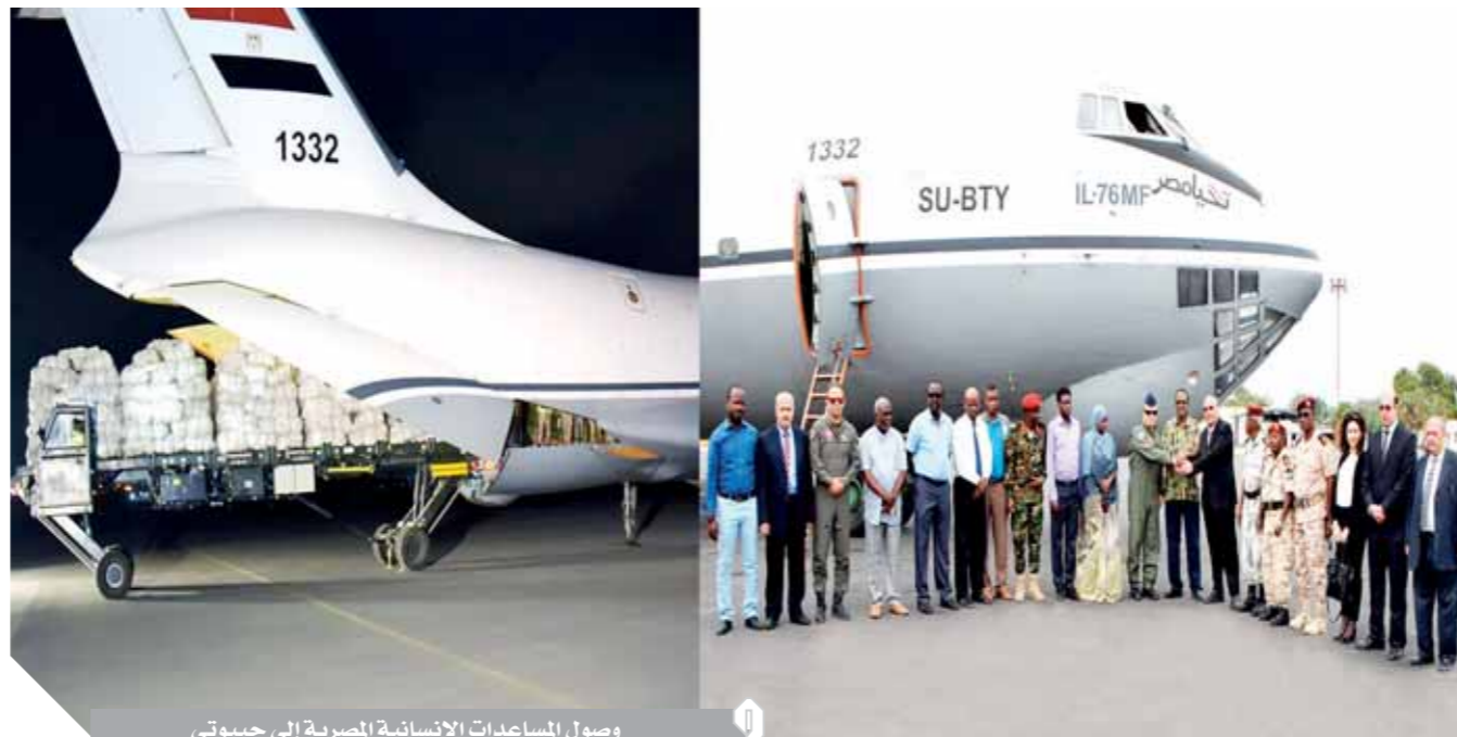
وصول المساعدات الإنسانية المصرية إلى جيبوتي

بتوجيهات من السيد الرئيس عبدالفتاح السيسي رئيس الجمهورية القائد الأعلى للقوات المسلحة للمعاونة في دعم الأشقاء بدولة جيبوتي، أصدر الفريق أول محمد زكي القائد العام للقوات المسلحة وزير الدفاع والإنتاج الحربي أوامره بإفلاح طائرة نقل عسكرية وعلى متنها مساعدات إنسانية عاجلة للأشقاء في دولة جيبوتي تضمنت كميات من الخيام والبطاطين والمواد الغذائية لمساعدة دولة جيبوتي الشقيقة لمواجهة آثار السيول والفيضانات التي اجتاحت البلاد مؤخراً. يأتى ذلك انطلاقاً من الدور المصري الفاعل تجاه الدول الشقيقة والصديقة وتقديم الدعم والتضامن معهم في أوقات الأزمات.