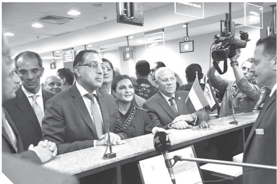
مديولى في افتتاح أحد المشروعات في بورسعيد