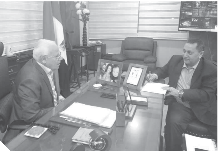
محافظ بورسعيد خلال حوار مع الوفد

المرافق والخدمات، وليس لنا علاقة من قريب أو بعيد بالمشروعات الإسكانية سواء المشروع التعاوني الذي سيتم تسليم ٣٠٠٠ وحدة منه نهاية العام القادم، وتجري له إعادة لأعمال البحث مرة أخرى لاستبعاد غير المستحقين، والمشروع الاجتماعي يتم تسليم وحداته وفقاً للمخطط المعد له وتخصيص وتسكين المستحقين، أما مشروع الشباب الـ ٩٠٠٠ وحدة فهو مشروع قومي أيضاً جار بناؤه وتسليم وحداته طبقاً للمخطط أيضاً، والمواطن يتعامل مع المشروعات الثلاثة من خلال الهيئة العامة لتعاونيات البناء والإسكان وصندوق التمويل العقاري، والإسكان والتعمير وصندوق التمويل العقاري، وفقنا بروتوكولات بين المحافظة والجهات المختصة بذلك، أما فيما يخص العشوائيات فقد نجحنا في إزالة عزبة أبوعوف وزرارة والانتهاج من تسكين نسبة ٧٠٪ من قري هاجوج والإصلاح بمدخل بورسعيد الجنوبي بالتنسيق مع صندوق تطوير العشوائيات وبورسعيد أصبحت أول محافظة مصرية خالية من العشوائيات الإسكانية، وهو إنجاز بكل المقاييس.