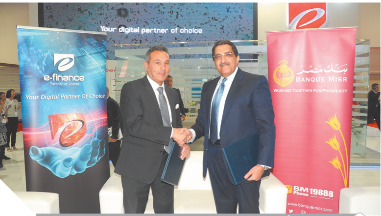
الأتريبي يصافح سرحان خلال توقيع الاتفاقية

قال محمد الأتريبي رئيس بنك مصر أن البروتوكول خطوة في تطبيق إستراتيجية البنك نحو التحول الرقمي ودعم الأنشطة الاقتصادية الخاصة بالدولة والذي يمثل القطاع الزراعي أحد أهم أولوياته. وأضاف أن بنك مصر قام باتخاذ خطوات عدة لتطبيق تلك الاستراتيجية منها: تحديث وتطوير خدمة الإنترنت البنكي Online BM، إتاحة باقة جديدة من الخدمات المصرفية التي يمكن للعملاء الحصول عليها من خلال خدمة الإنترنت البنكي، هذا كما أطلق البنك لعملائه الخدمات البنكية الإلكترونية عبر الهاتف المحمول من خلال تطبيق الموبايل البنكي، ويُعد البنك من أوائل البنوك المقدمة لخدمة الدفع عن طريق الهاتف المحمول من خلال تطبيق محفظة بنك مصر «WALLET BM» التي تتبع للعملاء تحويل الأموال من محفظة بنك مصر لأي محفظة أخرى في مصر، السحب من والإيداع