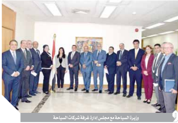
وزيرة السياحة مع مجلس إدارة غرفة شركات السياحة