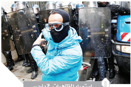
استمرار المظاهرات في باريس