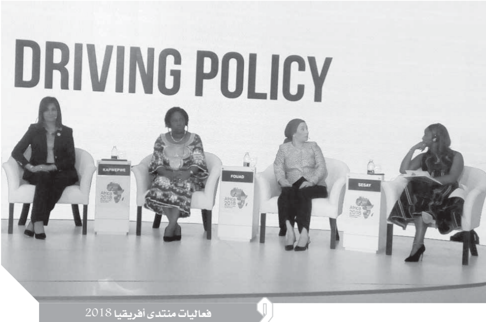
فعاليات منتدى أفريقيا 2018