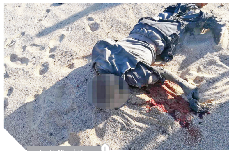
جثة أحد الإرهابيين