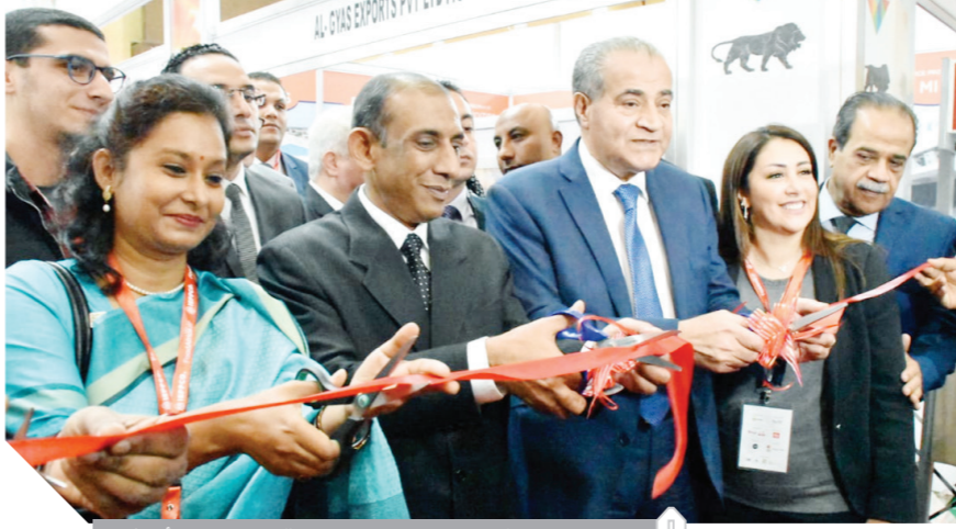
وزير التموين يفتتح فعاليات الدورة الرابعة لمعرض «فود أفريقيا»

كتبت - جيهان موهوب وتهاني شعبان ونغم هلال؛ افتتح الدكتور على مصيلحي، وزير التموين والتجارة الداخلية، أمس، فعاليات الدورة الرابعة لمعرض «فود أفريقيا» للأغذية بمركز القاهرة الدولي للمؤتمرات بمدينة نصر، والذي يستمر لمدة 3 أيام. ويعد المعرض أهم وأكبر معرض متخصص للأغذية يقام في مصر، بالتعاون مع المجلس التصديري للصناعات الغذائية، وغرفة الصناعات الغذائية، وهيئة تنمية الصادرات، والمجلس التصديري للحاصلات الزراعية. ويشارك بالدورة الحالية للمعرض 320 شركة محلية وأجنبية تمثل نحو 32 دولة من مختلف أنحاء العالم، ويتضمن هيكل المعرض مئات الأصناف من المنتجات المختلفة التي تنتجها الشركات، كما يشهد معرض العام الحالي مشاركة نحو 500 مشتر أجبن من خلال بعثة المشترين الدوليين لعقد لقاءات عمل ثنائية B2B خلال أيام المعرض، بالإضافة إلى زيارات المصانع والزراعة. ويشارك في المعرض، الملكة العربية السعودية، الإمارات، الصين، فرنسا، جنوب أفريقيا، بيلاروسيا، بولندا، أوكرانيا، الهند، باكستان.