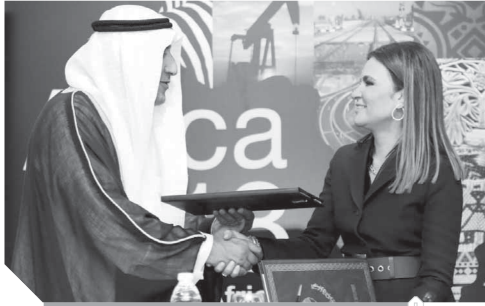
وزيرة الاستثمار والتعاون الدولي خلال توقيع الاتفاق مع مدير الصندوق الكويتي