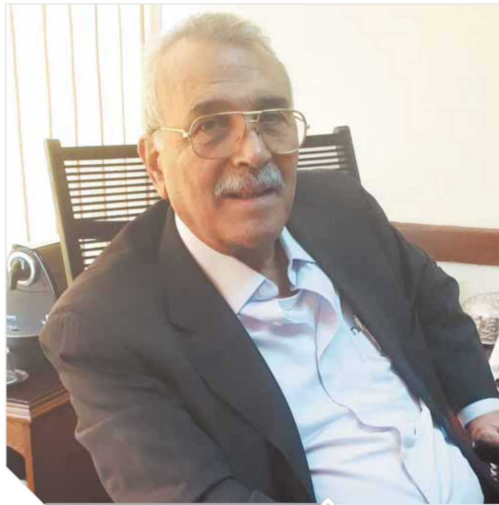
اللواء عمر قناوى

العمل والجهد والتفانى فلسفة لا غنى عنها في مسيرة رحلته العملية الطويلة، ونفس الأمر عندما يحلل الضغوط التي واجهها الاقتصاد، ودور الأموال السريعة في بداية الإصلاح الاقتصادى، وقدرتها على تحقيق الثقة بين المستثمر الأجنبى والدولة، في قدرة المستثمر على التخارج والدخول للسوق، بما يوفى دون مواجهة أزمات، وهي مرحلة ضرورية، كي يتمكن المستثمر من تحويل أمواله إلى الإستثمارات مباشرة. ربما كانت السياسة المالية الشغل الشاغل للرجل، لما تمثله من عبود فقري للإيرادات ومصروفات الدولة، لكن يظل التعامل مع الملف يتطلب احترافية، له