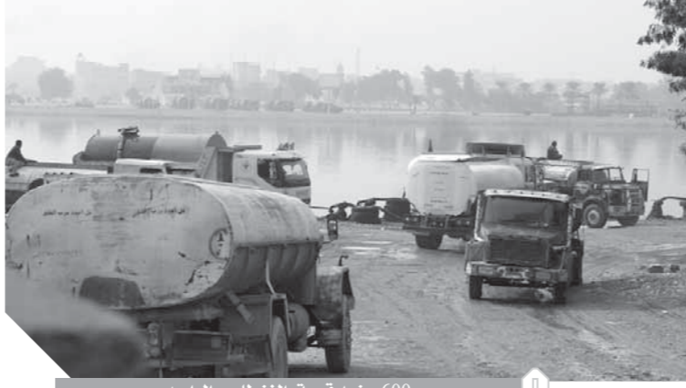
600 جنيه قيمة، الفنطاس، الواحد

تواصلت مع يسرى خفاجى، المتحدث الرسمى لوزارة الرى والموارد المائية، فأكد أن تعبئة مياه النيل وبيعها يمثل مخالفة للقوانين بجميع المقاييس وقانون الموارد المائية يمنع