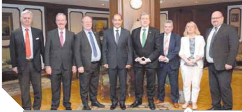
الفريق يونس المصري ولقائه وزير التجارة الأيرلندي