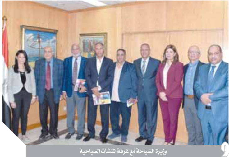
وزيرة السياحة مع غرفة المنشآت السياحية