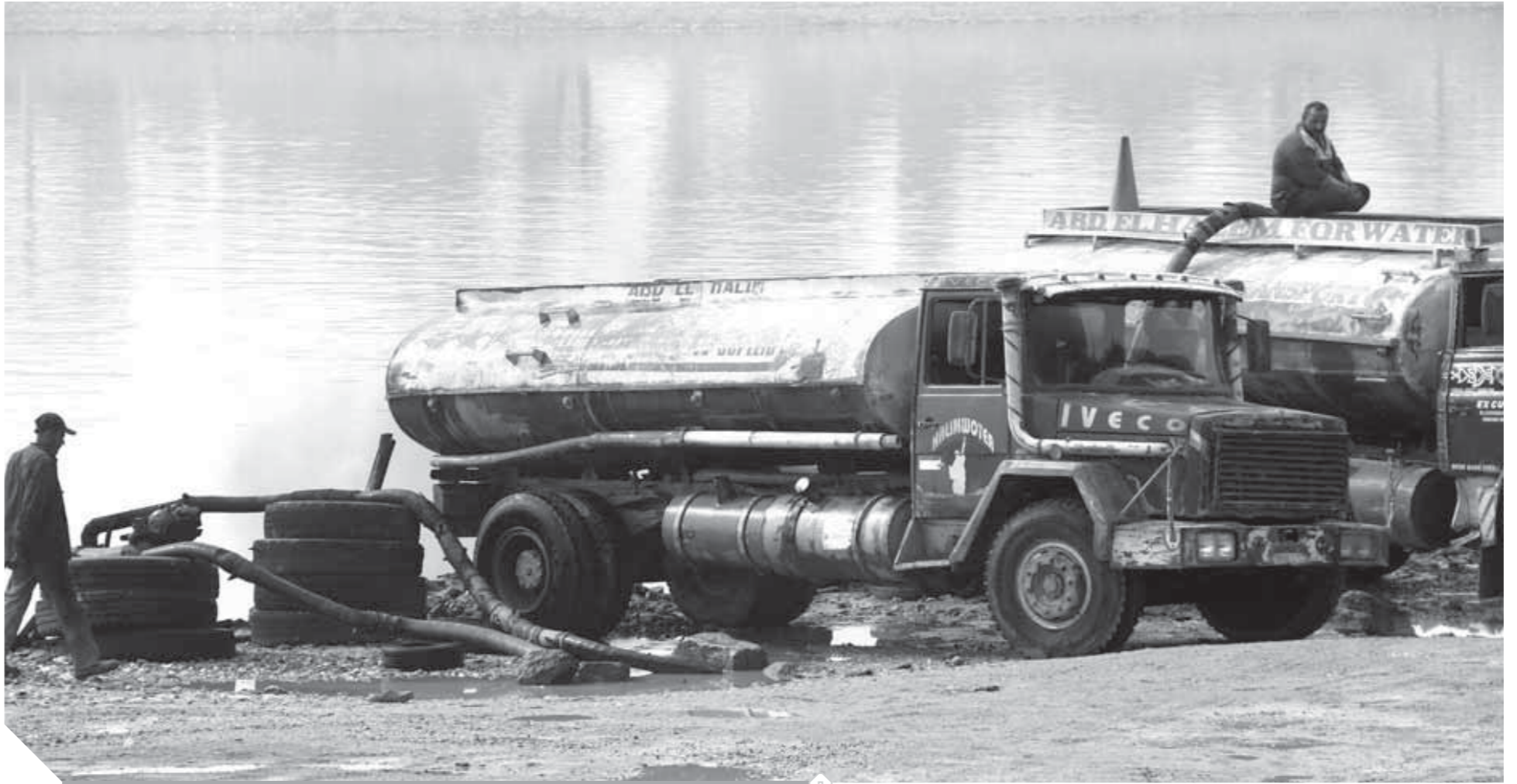
مافيا سرقة النيل

تسرق مياه النيل أمام أعين الجميع! يحدث ذلك فى ذات الوقت الذى أعلن فيه مجلس النواب الحرب على المسرفين فى المياه وغلظ عقوبة رش الشوارع وغسيل السيارات إلى 20 ألف جنيه والحبس 6 أشهر!