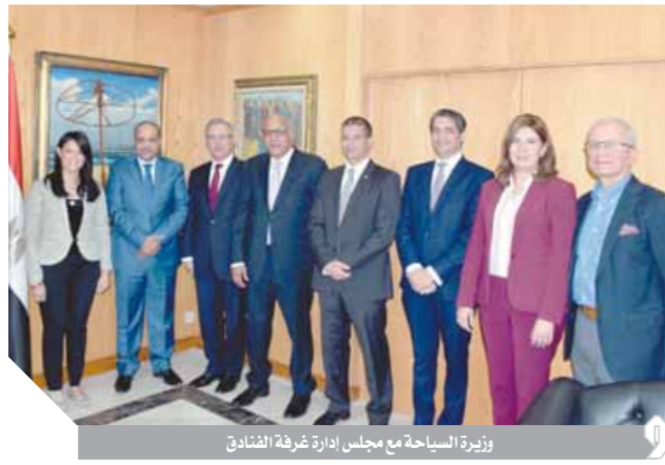
وزيرة السياحة مع مجلس إدارة غرفة الفنادق

ومن جانبهم قدم جميع رؤساء وأعضاء الغرف السياحية الشكر والتقدير للجهود التي بذلتها وزارة السياحة للانتهاء من ملف الانتخابات وإنجاح العملية الانتخابية بشفاافية، بداية من الإجراءات القانونية التي اتخذتها الوزارة لتعديل اللائحة الأساسية المشتركة للغرف السياحية واتخاذها وذلك لتيسير إجراءات العملية الانتخابية والتي تمت بالتنسيق التام مع الغرف والاتحاد السياحي. وأشارت إلى أهمية استعانة المطاعم السياحية المختلفة بخبري الكليات والمدارس السياحية والفندقية، والتعاون مع وزارة التربية والتعليم لتدريب هؤلاء الخريجين على أرض الواقع، وتطرقت للحديث عن