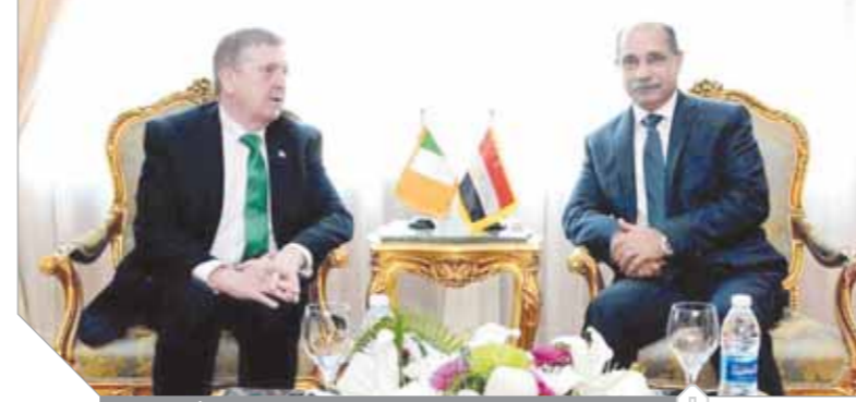
وزير الطيران المصري خلال لقائه وزير التجارة الأيرلندي

بين البلدين في الفترة القادمة لبحث مشروعات التعاون وزيادة فرص الاستثمار بين مصر وأيرلندا وبخاصة في مجال الطيران المدني.