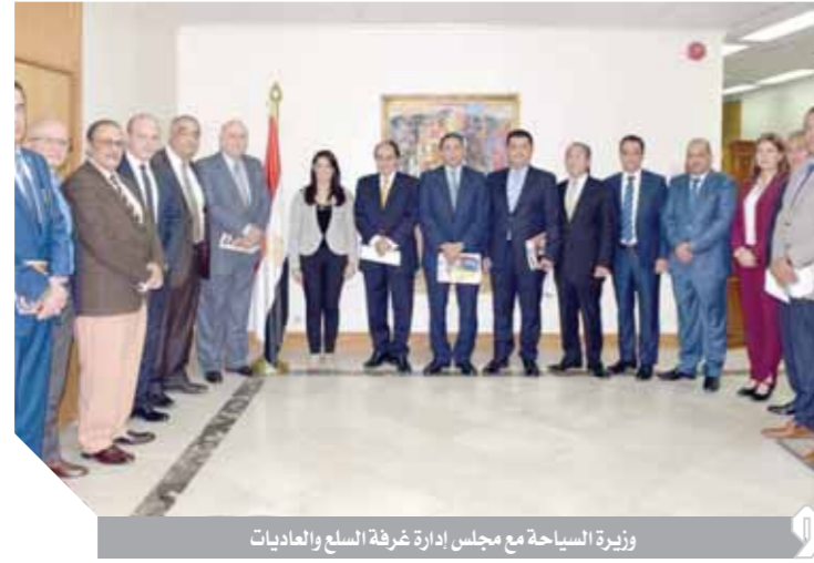
وزيرة السياحة مع مجلس إدارة غرفة السلع والعدايات