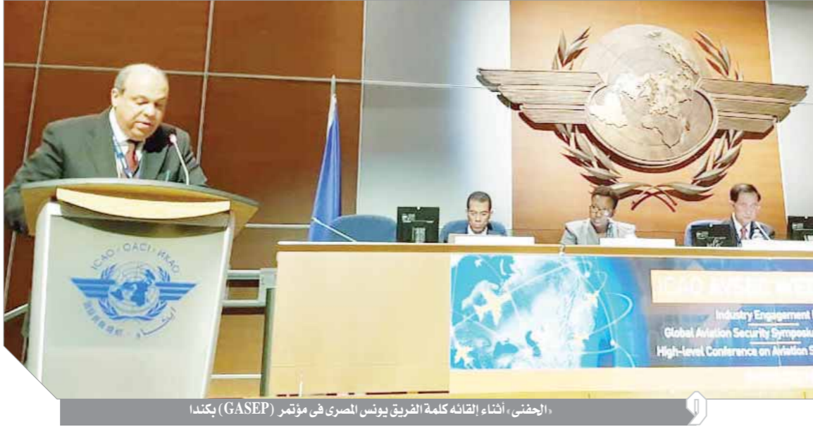
الحفنى، أثناء لقائه كلمة الفريق يونس المصري في مؤتمر (GASEP) بكندا

الحفنى: مصر تقدم دعماً كاملاً لتطبيق البرنامج وتنفيذ خارطة الطريق الإقليمية للأمن