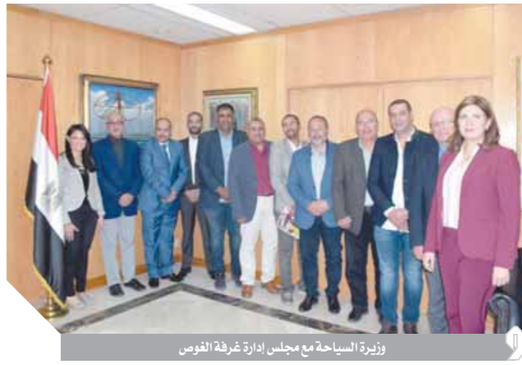
وزيرة السياحة مع مجلس إدارة غرفة الفوس

القومي وكيفية التعامل مع السائحين. وفي لقاءها مع غرفة الفنادق أكدت الوزيرة أهمية العمل على رفع كفاءة الفنادق وتحديث معايير تصنيفها وأنه بعد التوافق على المعايير الجديدة مع الفنادق سيتم عقد دورات تدريبية للمفتشين من الوزارة للرقابة على الفنادق طبقاً للمعايير الجديدة. كما أكدت أهمية وجود عمالة مدربة، مشيرة إلى أهمية زيادة أعداد الإناث العاملات في القطاع، وتوفير أماكن عمل لائقة لهن، وربط المناهج التعليمية باحتياجات السوق، وأكدت ضرورة وجود قاعدة بيانات للعاملين في قطاع السياحة. وأشارت إلى أهمية استعانة المطاعم السياحية المختلفة بخبري الكليات والمدارس السياحية والفندقية، والتعاون مع وزارة التربية والتعليم لتدريب هؤلاء الخريجين على أرض الواقع، وتطرقت للحديث عن