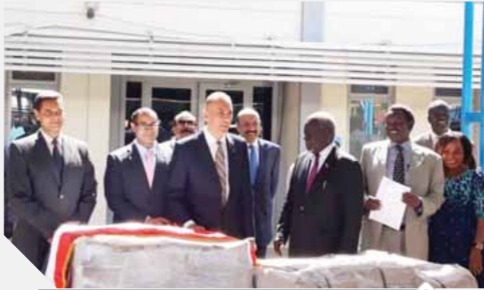
نجل عاشور يتسلم درع تكريم والده

أكد الدكتور أحمد بهاء الدين، سفير مصر في جنوب السودان، أن وزارة الخارجية قامت عبر الوكالة المصرية للشراكة من أجل التنمية بتقديم شحنة من المساعدات الدوائية للأشقاء في جنوب السودان. وأضاف السفير أن مراسم التسليم شهدت عقد مؤتمر صحفي في مقر وزارة الصحة بمشاركة د. ريك جاي كوك وزير الصحة في جنوب السودان، وبحضور أعضاء السفارة المصرية في جنوب السودان. وأشار السفير المصري في كلمته إلى أن تلك المساعدات تأتي انطلاقاً من إيمان مصر الثابت بالروابط التاريخية والصائفة المشتركة التي تربط شعبي البلدين، وأن هذه المساعدات هدية من شعب مصر لشعب جنوب السودان، موضعاً اهتمام بدعم قطاع الصحة في جنوب السودان في إطار استراتيجية متكاملة باعتبار أن هذا القطاع إحدى أهم ركائز التنمية في جنوب السودان. وتتم وزير الصحة الجنوبي ما تقدمه مصر لجنوب السودان على المستويين الحكومي والشعبي في كافة المجالات، لا سيما القطاع الصحي، مشيداً بدور مصر في دعم السلام في جنوب السودان.