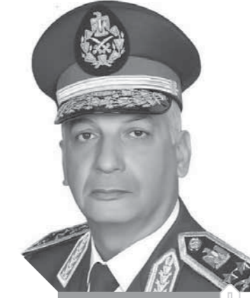
الفريق محمد زكي

وأصدر الفريق أول محمد زكي، وزير الدفاع، قراراً بمشاركة 4 طائرات هليكوبتر، في عمليات إطفاء الحريق بجانب 50 سيارة إسعاف تم استدعاؤها بأوامر من محافظ الوادي الجديد، وتوزيعها على النقاط