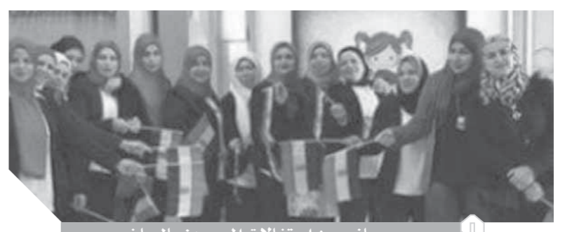
جانب من احتفالات المصريين بالرياض

السعودية - ليندا سليم، زغال فى جيبى، محمود ياسين ونجوى إبراهيم، و«العمد لحظة»، ماجدة ومحمد خيرى، و«بدور» محمود ياسين ونجلاء فتحي، وحتى فيلم «الطريق إلى إيلا»، شعرت بمدى تعلق المصريين بالوطن وذكرى النصر العظيم من خلال مشاهدة هذه الأفلام، حتى تلاميذ المدارس فى الرياض احتفلوا بذكرى النصر، وانتشرت الأعلام المصرية فى العاصمة السعودية الرياض، خلال الأيام الماضية ليؤكد المصريين فى السعودية أنهم يعيشون فى رحاب ذكرى نصر أكتوبر العظيم، ويؤكدوا أنهم متعلقون بالوطن الأم وهم فى بلدهم الثانى.