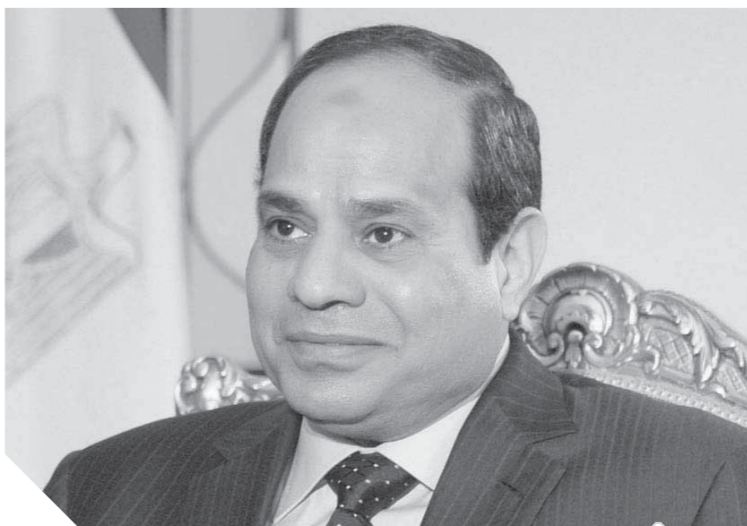
الرئيس عبدالفتاح السيسى

إنشاء فروع أفضل الجامعات العالمية فى العاصمة الإدارية الجديدة