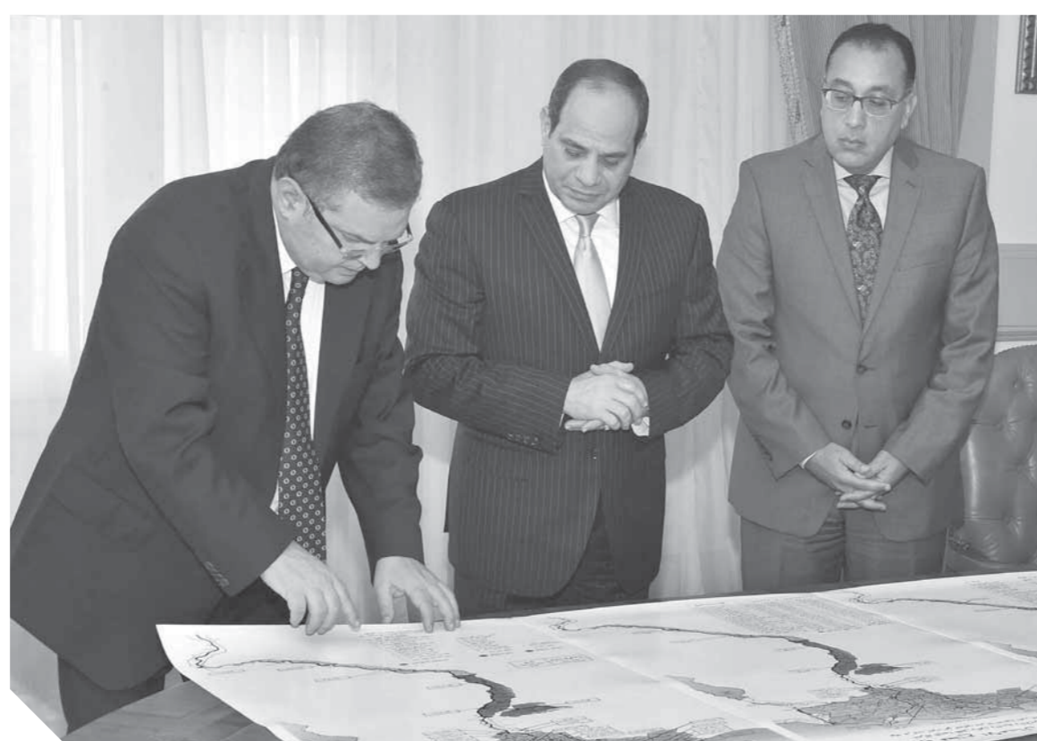
السيدي يستمع إلى شرح وزير قطاع الأعمال حول تطوير الشركات

لنك الشركات بمختلف قطاعاتها بدقة سواء تلك المتعثرة أو التي تحقق أرباحاً، بهدف الاستقرار على استراتيجيات مناسبة للتعامل معها وفقاً لظروف كل شركة على حدة، وذلك بدعم التاج منها، وتحديث أو إعادة الهيكلة أو إغلاق تلك التي تحقق خسائر منها، مشيراً في هذا الإطار إلى عدد من الشركات القاضية، لا سيما الصناعية، التي تحتاج إلى إجراء تدقيق فني لها لضمان تحديثها على نحو يعظم العائد من استثماراتها على المدى الطويل.