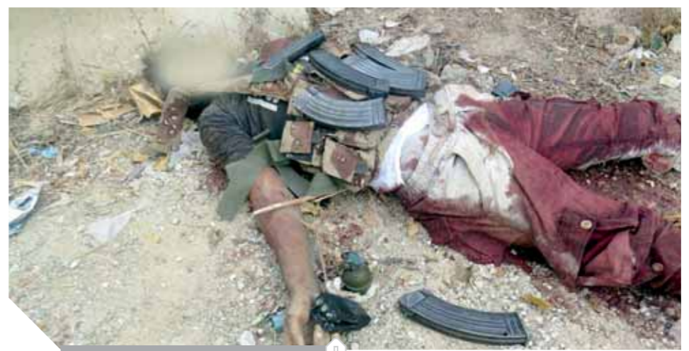
جثة أحد الإرهابيين الذين تم تصفيتهم

نحو 1000 كجم من جوهر الحشيش المخدر و3 ملايين قرص مخدر وضبط 2227 فرداً أثناء محاولتهم الهجرة غير الشرعية. وعلى الاتجاه الجنوبي تم ضبط 102 فرد هجرة غير شرعية و31 عربة وجهازي اتصال عبر الأقمار الصناعية وجهاز للكشف عن المعادن و7 أطنان من الأحجار الصخرية من خام الذهب. ويأتى ذلك بالتزامن مع قيام القوات البحرية فى أعمال التأمين البحرى وحماية الأهداف الاستراتيجية وقطع خطوط إمداد العناصر الإرهابية عن طريق البحر وتأمين الأهداف الاقتصادية فى المسرح البحرى. ونتيجة تلك الأعمال القتالية والمهام المقدسة تم استشهاده ضابط وضابط صف وجندي.