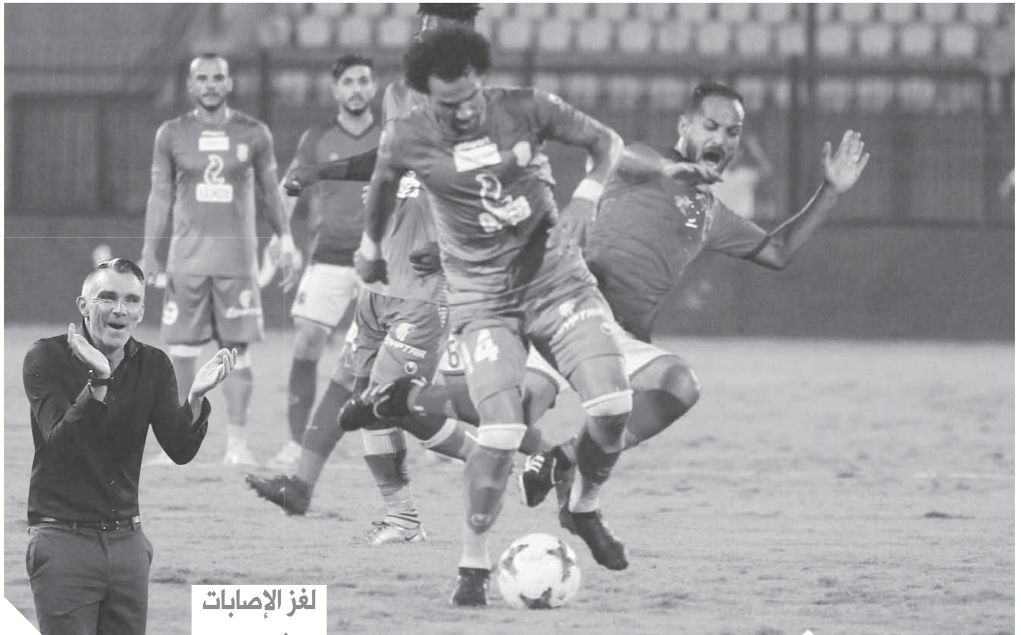
خسارة الأهلي القاسية فتحت باب الانتقادات