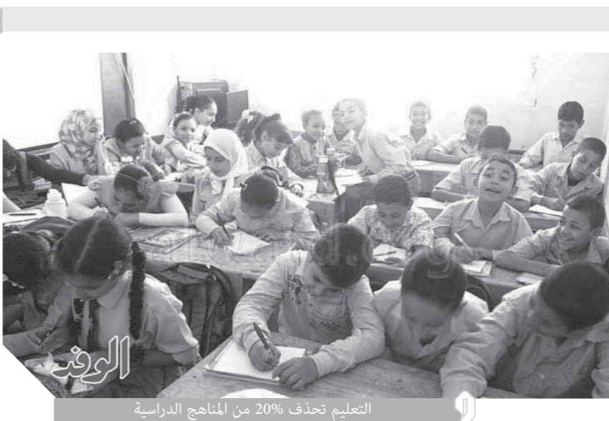
التعليم تحذف 20% من المناهج الدراسية

الجامعة تتكفل بجمع المصروفات الدراسية للطلاب غير القادرين ومصروفات المدينة الجامعية، بجانب اشتراكات المترو، وقام بالتأكد على جميع العمداء بضرورة متابعة بيع جميع الكتب الدراسية لجميع المراحل بجميع كليات الجامعة بالسوق الريادى للجامعة. ويخصوس موضوع تسليم الكارنيهات فقد بدأت الجامعة بالفعل فى تحويل نظام تسديد المصروفات ليصبح إلكترونياً لتسهيل استخراج الكارنيهات بصورة مركزية وقد تم تسليمها بالفعل لعدد كبير من الكليات وسيتم تسليم باقى الكليات فى القريب العاجل، وشدد سيادته على ضرورة متابعة أصحاب المحلات التجارية بالسوق التجارى للجامعة على تنفيذ التعليمات بتخفيض أسعار الوجبات الغذائية للطلاب، وأشار سيادته أنه سيتم تنظيم العديد من الجولات لمتابعة الانتهاء من أعمال الإصلاحات بالكليات، وأضاف سيادته أن التواصل مستمر مع ابن جامعة حلوان البار أ/ أشرف صبحى وزير الشباب والرياضة لإزالة كافة العقبات أمام طلاب كليات التربية الرياضية وتسهيل تدريبهم بجمع الأندية المصرية، بجانب استمرار العمل فى تطوير جميع الملاعب الرياضية بالجامعة.