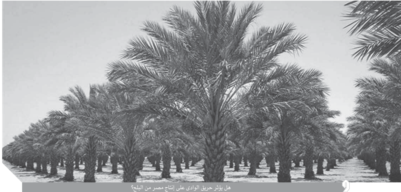
هل يؤثر حريق الوادي على إنتاج مصر من البلح؟

مشهد النيران تلتهم خير الأرض نخيلها مؤسف ومحزن، تلك ثروة طبيعية أعم الله بها على مصر، حيث تجود بأغلى وأجود الأنواع. الدكتور خليل المالكي، أستاذ المبيدات بمركز البحوث الزراعية أكد أن حادث حريق أفدنة النخيل بالوادي الجديد، كارثة ولهذا يجب فحص المكان جيداً من قبل وزارة الزراعة والأجهزة الأمنية.