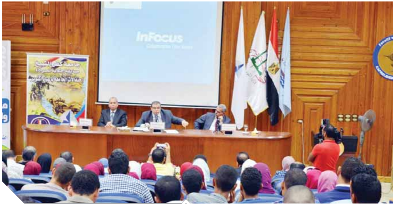
وزير القوى العاملة خلال لقائه بطلاب جامعة كفر الشيخ

أكد وزير القوى العاملة محمد سعفان أن قانون العمل الجديد تم الانتهاء من إعداد مشروع وهو الآن في طور العرض على مجلس النواب في دور الانعقاد الحالي، تحقيقًا للتوازن المطلوب بين طرفي العلاقة الإنتاجية من عمال وأصحاب أعمال. وشدد الوزير على ضرورة تغيير الفكر والثقافة السائدة لدى الشباب من ضرورة العمل لدى الحكومة كموظف حكومي، وبعدم التام عن القطاع الخاص الذي يعتبر أساس الاقتصاد المصري، ويمثل الجزء الأكبر منه، كونه يمثل نحو 80٪ من الاقتصاد القومي للبلاد. وأضاف: «يجب على الشباب أن يقوم بالتعليم والتدريب الدائم ووصفة مستمرة لإحداث التطور اللازم لنفسه كي يواكب متطلبات الحياة ثقافيًا وعلميًّا ومهنيًّا، الأمر الذي لن يأتي إلا بالتعليم الذاتي والتعليم المستمر.