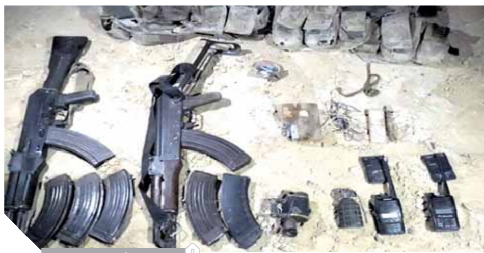
جانب من الأسلحة المضبوطة

عبد الفتاح «السييسى» يعيد الجامعات إلى العالمية P.7