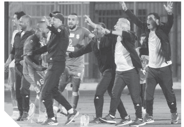
فرحة الاتحاد بالفوز على الأهلي

واستأنف الفريق تدريباته أمس الاثنين استعداداً لمباراة الترسانة في دور الـ32 ببطولة كأس مصر بدون راحة، وخضع أحمد فتحي الظهير الأيمن لأشعة على الركبة أمس الاثنين لتحديد حجم إصابته ومدّة غيابه عن التدريبات الجماعية خلال الفترة المقبلة بعد تعرضه للإصابة بكدمة في الركبة والساق وسيغيب عن الأراج عن مباراة الترسانة. ويخضع المهاجم مؤمن زكريا لاختبار طبي لإصابته بخلع في الكتف ومن المنتظر أن يتحدد موقفه خلال مران اليوم لحسم