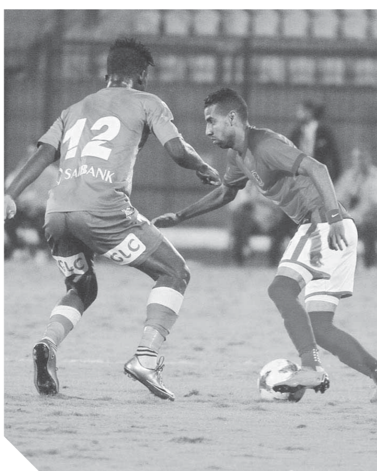
مؤمن زكريا مهدد بإيقاف شريف إكرامي

أكد رضا شحاتة نائب رئيس التعاقدات بالنادي الأهلي أنه يملك طموحاً كبيراً في منصبه الجديد في المرحلة القادمة. وأوضح أنه قبل المنصب الجديد من أجل خدمة النادي الأهلي وضم لاعبين صغار تحت السن في المرحلة القادمة.