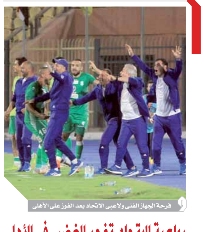
فرحة الجهاز الفنى ولاعبى الاتحاد بعد الفوز على الأهلى