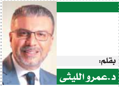
بقلم: د. عمرو الليثي

كتبت- هدير وجدى: في ليلة استثنائية بحضور سيدة المسرح العربى الفنانة القديرة سميحة أيوب، وبحضور جماهيري كامل العدد، انطلقت أولى ليلي مسرحية «فوتوغرافيا»، وهي عرض تخرج الدفعة الثانية لورشة تروكاز كاستنج دايركتور لإعداد الممثل الشامل (دفعة سميحة أيوب) على مسرح جراند طيبة بمدينة نصر..