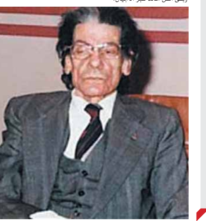
طبع بمطابع الأخبار

كتبت- أمجد مصباح: يمر اليوم ٤٢ عاماً على رحيل صوت النغم الرصين العملاق رياض السنباطى، وهو فى حد ذاته قمة قائمة بذاتها فى عالم التلحين. مشواره فى عالم التلحين يقترن بنصف قرن من الزمان، حيث بدأ مشواره فى منتصف الثلاثينيات. وكانت بداية مع كوكب الشرق بأغنية «على بلد المحبوب»، حدث ولا حرج عن الحانته لكوكب الشرق وهى كثيرة للغاية تذكر منها: أغنيات، قصة الأمس أروح لى، عودت عيني، الحب كده، يا طمانى، ذكريات أهل الهوى، هجرتك، والرائعة الخالدة: الأطلال، ومن أجل عيني، ورباعيات الخيام. وكان الختام المسك بين أم كلثوم والسنباطى بالأغنية التحضر «القلب يعشق كل جميل» عام ١٩٧٢.