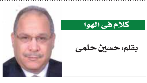
كلام فى الهوا