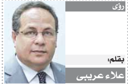
بقلم: علاء عريبي

أوضح د. مختار جمعة وزير الأوقاف أن الوزارة أعدت سلسلة من الكتب والمؤلفات، من أبرزها كتاب «كيف نفهم السنة النبوية»، والذي يفكك الجمود عند ظاهر النص ويرسخ لمشروعية الدولة الوطنية والحفاظ على الوطن، والعلاقة بين الدين والدولة، لافتاً إلى أن الجماعات المتطرفة حاولت أن تخلق عداء بين الدين والدولة كأن تكون مع الوطن مع أن الوطن مع الكليات التي يجب أن يحميها الإنسان بل في مقدمة الكليات الخمسة (الدين والنفس والمال والعقل والعرض)، وأيضاً كتاب «تنظيم النسل» تلك القضية التي تعد من المفترقات التي يختلف الحكم فيها من زمان إلى زمان، ومن مكان إلى مكان، ومن دولة إلى أخرى، وليست من الثوابت الدينية ولا تتضمن حكماً قاطعاً واحداً، ولا يستطيع أي عالم أن يعطي فيها حكماً قاطعاً أو عاماً، مؤكداً أن تنظيم النسل واجب الوقت وضرورة دينية ووطنية في ظروفنا الراهنة