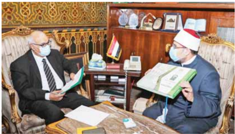
د. مختار جمعة في حوار مع الزميل على حسن

نحو (٣٩٤,٠٥) جنيه، ليصبح الإجمالي (٦٦٩٢,٢٢) زيادة بدلاً من (٢٧٤٩,١٧) جنيه، فيما بلغت أقل زيادة لأحدت إمام معين على الدرجة الثالثة من حملة الليسانس نحو (٢١٥٨,٤٤) جنيه، ليصبح الإجمالي (٤٠٧٥,٥٤) جنيه بدلاً من (١٤١٧,١) جنيه. وأشار إلى أنه تم توفير الزى الأزهرى الجانبي، حيث تم توفير أكثر من (١٣٠) ألف زى أزهرى مجاني خلال السنوات السبع الماضية، منها (٥٠) ألف زى أزهرى تم توزيعها خلال عام ٢٠٢١ فقط، وتم التعاون مع أفضل الشركات المنتجة للزى، وفي مقدمتها مصنع المحلة للغزل والنسيج، ومكاتب تحفيظ القرآن الكريم، وأعضاء المجلس، ومكاتب تحفيظ القرآن الكريم، وذلك بإجمالي تكلفة تقدر بنحو (٧٠٠) مليون جنيه سنوياً من الموارد الذاتية للوزارة.