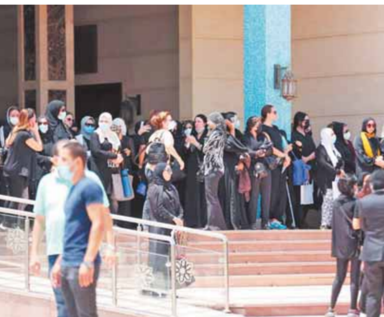
المشيعون يتوافدون على المسجد لتوديع الراحلة