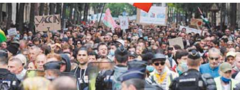
مظاهرات رافضة للإجراءات الصحية الجديدة

تقدم المستشار بهاء الدين أبو شقة رئيس حزب الوفد، وباسم الهيئة العليا وقيادات الحزب والوفديين، بخالص التهئة إلى الرئيس عبدالفتاح السيسي، وجموع الشعب المصري بمناسبة العام الهجري الجديد.