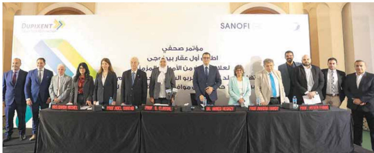
الأطباء يناقشون علاج التهاب الجلد التأتبي والربو الشديد

الجمعية المصرية العلمية للشعب الهوائية «أنه وفقاً لمنظمة الصحة العالمية، فقد أثر الربو على ما يقدر بنحو ٢٢٢ مليون شخص في عام ٢٠١٩ وتسبب في وفاة ٤٦١٠٠٠ شخص. ولا يزال الأشخاص الذين يعانون الربو الشديد غير المتحكم فيه بشكل كافٍ بالعلاجات الحالية يعانون مشاكل في التنفس تهدد حياتهم، وبشكل هذا المرض عبئاً يومياً على المرضى، كما أن انعدام القدرة على التنبؤ بمسار المرض يمكن أن تقلب بشكل كبير من نوعية وجودة الحياة، مما يتسبب في توقف بعض العناصر الحياتية مثل التغيب عن المدرسة أو العمل والأنشطة الاجتماعية، ونحن كأطباء، نرحب بإضافة علاجات جديدة متطورة مثل دوبيكست، المعصمة لمساعدة المصابين بالربو الحاد على السيطرة على أعراضهم ومتابعة حياتهم اليومية