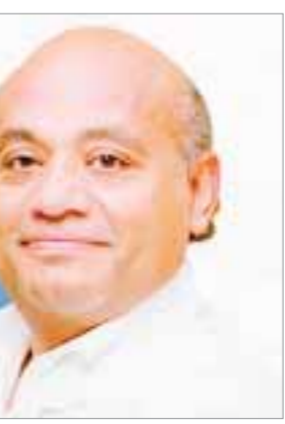
د خالد وهبة

بالمستشفى. ويضيف الدكتور خالد وهبة: إذا شعر المريض بالأعراض يقوم بعمل رسم قلب وموجات صوتية على القلب وعمل أنزيمات قلب وإذا لم يذهب الألم مع الراحة في المنزل أول شيء الاستعداد للذهاب للمستشفى وتناول أربعة أقراص أسبرين مرة واحدة والعلاج أما علاج طبي أو عمل قسطرة على شرايين القلب وفي حالة استمرار الألم لفترة طويلة من الأفضل عمل قسطرة لأن خلايا القلب تظل حية لمدة ٩٠ دقيقة وفي حالة عدم عمل قسطرة خلال ٩٠ دقيقة مع وجود ذبحة صدرية غير مستقرة يمتنع الدم عن أجزاء معينة من القلب أو يكون العلاج بأدوية مسيلة للدم ومذيبة للجلطات.