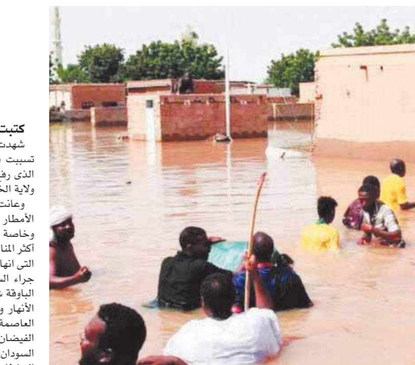
المياه تغرق الشوارع وتهاجم المنازل

كتبت - سحر رمضان، شهدت أمس المدن السودانية أمطاراً وسيولاً غزيرة، تسببت فى شلل العاصمة الخرطوم بسبب الفيضان، الذى رفع المياه إلى منسوب قياسي «١٦,٧٨ متر» عند ولاية الخرطوم. وعانت الشوارع صعوبة فى حركة السيارات، كما أدت الأمطار والسيول إلى أضرار كبيرة فى ممتلكات عامة وخاصة خارج العاصمة. وقالت هيئة الدفاع المدنى: إن أكثر المناطق تضرراً هى مدينة الفاو وولاية القضارف، التى انهارت فيها عشرات المنازل ودمر الكثير من المزارع جراء السيول. كما تضررت مناطق واسعة فى منطقة الباوقة شمالاً، ويتواصل الارتفاع فى مناسيب المياه فى الأنهار وسط مخاوف من فيضانات مدمرة خاصة فى العاصمة الخرطوم، بعد أن تجاوزت مياه النيل منسوب الفيضان. وتوقعت وزارة الرى أن تشهد جميع الأنهار فى السودان ارتفاعات متفاوتة خلال الأيام المقبلة، ودعت السلطات السودانية مواطنيها الذين يقطنون فى جزر الأنهار وفى المناطق القريبة من ضفافها إلى توخي