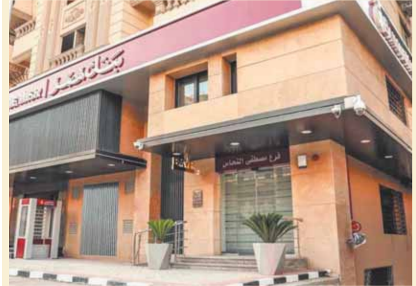
فرع مصطفى النحاس

حاز فرع بنك مصر «مصطفى النحاس» على شهادة ترشيح الفضية، الصديق للبيئة من الجمعية المصرية للأبنية الخضراء. وتعكس هذه الشهادة التزام البنك بالمسؤولية المجتمعية تجاه الحفاظ على البيئة ومبادئ التنمية المستدامة. يعتمد الحصول على هذه الشهادة على اتباع البنك للممارسات صديقة للبيئة بهدف التخفيف من الآثار الضارة للبيئة بالإضافة إلى توفير بيئة صحية للعملاء والموظفين. وتعتبر جائزة ترشيح بمثابة نواة لأسلوب منهجى متطور يستهدف رفع كفاءة فروعنا المستقبلية. ومعايير الحصول على الشهادة تشمل ثلاثة جوانب أولاً: ترشيح مصادر الطاقة من خلال التصميم والمعدات الفعالة، ثانياً: ترشيح استهلاك المياه بما يتناسب مع محيط المبنى واستخدام الصنابير الحساسة / الموفرة للمياه وحث المستخدمين على ترشيح استهلاك المياه وموارد الطاقة، ثالثاً: تعزيز بيئة عمل صحية من خلال تقليل استخدام الخامات والموارد المستوردة غير الضرورية وتعظيم استخدام مواد البناء المعاد تدويرها والصديقة للبيئة. وقال البنك إنه يعد أكبر البنوك التى لها باع فى مجال المسؤولية المجتمعية ومن أكثر المؤسسات إدراكاً للمسئوليات البيئية والاجتماعية وقواعد الحوكمة التى تقع على عاتق المؤسسة وتتكامل مع معايير أدائها واستدامة أعمالها على المدى الطويل، موضحاً أنه أول بنك مصرى مملوك للدولة يحصل على موافقة منظمة المعايير الدولية لتقارير الاستدامة (GRI) ويقوم بتقرير الأعمال بالتوافق مع مبادئ الاستدامة من خلال مراعاة الحوكمة وحقوق الإنسان، ومكافحة الفساد، والمشاركة المجتمعية، مع مراعاة معايير السلامة البيئية.