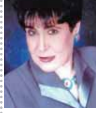
بقلم: سناء السيد