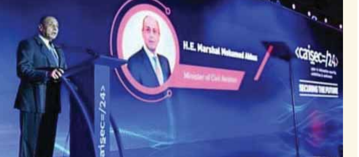
وزير الطيران خلال إلقاء كلمته فى افتتاح جلسات مؤتمر أمن المعلومات والأمن السيبرانى

شارك الفريق محمد عباس حلمى وزير الطيران المدني في مؤتمر أمن المعلومات والأمن السيبرانى Caisec'24 في نسخته الثالثة، والذي عقد تحت رعاية رئيس مجلس الوزراء الدكتور مصطفى مدبولي، تحت شعار «تأمين المستقبل»، وتنظمه كل من شركة ميركورى كوميونيكيشنز والشركة المتحدة للخدمات الإعلامية على مدار يومين. وناقشت فعاليات المؤتمر التأكيد على أهمية التطبيق العملى لروية الدولة لقضايا تكنولوجيا المعلومات والأمن السيبرانى، حيث انطلق المؤتمر بدعم من المجلس الأعلى للأمن السيبرانى التابع لمجلس الوزراء بمشاركة العديد من الوزارات والهيئات ومؤسسات الدولة وعدد من الشركات العالمية المتخصصة فى هذا المجال. وفي كلمته التي ألقاها الفريق محمد عباس حلمى وزير الطيران المدني خلال افتتاح فعاليات المؤتمر والتي أكد فيها أهمية المؤتمر والذي يسهم في تعزيز التعاون لمحاربة الهجمات السيبرانية، كما أنه يأتي في سياق التطور في مجال التحول الرقى، مع الأخذ بعين الاعتبار كافة التحديات التي تواجه العالم في مختلف القطاعات ومن بينها قطاع الطيران في عصر الرقمنة. مشيراً إلى ضرورة متابعة الإجراءات الاحترازية الخاصة بالأمن السيبرانى في ظل الهجمات السيبرانية المتعددة، والاهتمام بتأمين جميع الأنظمة ضد الهجمات الإلكترونية من خلال عمل اللجنة التحديدات الخاصة بها، ومتابعتها باستخدام الأدوات المناسبة، فضلاً