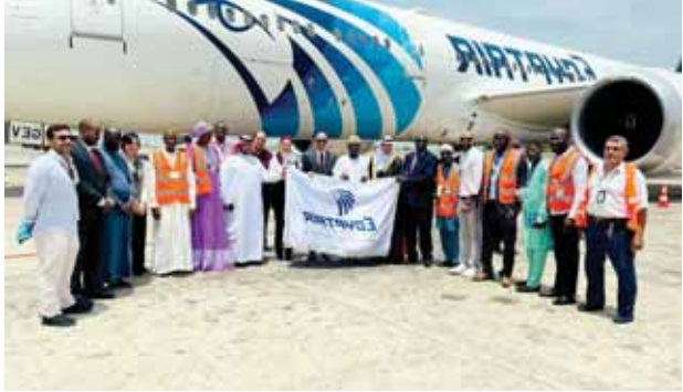
حجاج كوناكرى يشيدون بمصر للطيران خلال مغادرتهم إلى الأراضى المقدسة