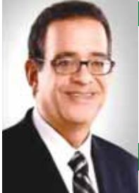
بقلم: طارق عبد العزيز