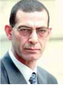
بقلم: د. وجدى زين الدين