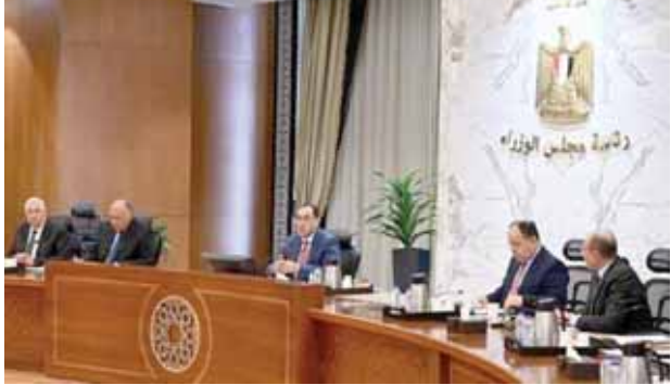
وزير الطيران خلال استعراض خطة الوزارة لزيادة خطوطها الجوية إلى أفريقيا