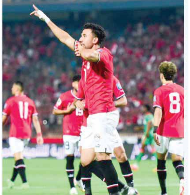
المنتخب يسعى لتكرار الفرجة أمام غينيا غداً

ثم غادر القاهرة في الرابعة عصراً متوجهاً إلى غينيا، ويخوض مرانته الأساسي اليوم استعداداً لمباراة الغد.