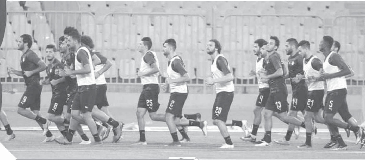
جديدة فى تدريبات المنتخب استعدادا لامم افريقيا