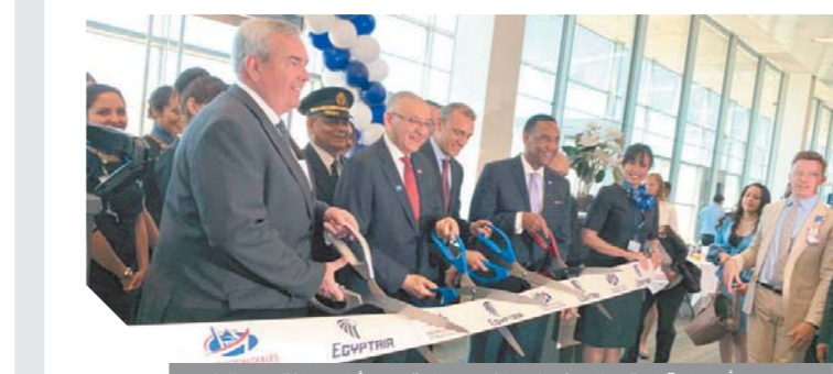
سفير مصر بأمريكا وقيادات مطار واشتطن خلال احتفالية وصول أولى رحلات مصر للطيران

القاهرة واشتطن. وفي السياق ذاته صرح Jerome I. Da- نائب المدير التنفيذي للسلطة المطارات بواشنطن: «يسعدنا تواجد مصر للطيران لتتضم قائمة شركات الطيران العالمية التي تعمل بطيران بين القاهرة والعااصمة الأمريكية واشتطن يأتي في إطار العلاقات الاستراتيجية والتاريخية المتميزة بين البلدين. وسينشط هذا الخط السياحي بين البلدين والقطاع الاقتصادي بشكل عام، وهو الدور الذي تلعبه مصر للطيران دائماً كونها الشركة الوطنية.