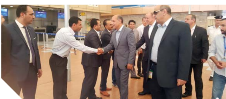
وزير الطيران خلال تفقده مطار شرم الشيخ

وخلال الجولة تابع انسيابية حركة السفر والوصول داخل المطار وتأكد من انتظام التشغيل في ظل الكثافة التي يشهدها المطار، وتفقد المصري جميع الإجراءات الأمنية داخل وخارج المطار والأسوار الخارجية وكاميرات المراقبة، وأشد وزير الطيران بجميع الإجراءات الأمنية المطبقة بالمطار، كما تفقد كاونترات مصر للطيران والجوازات والأسواق الحرة وذلك للاطمئنان على سير العمل كما تفقد المهبط وجمع مواقع الطائرات والترتك واستمع إلى آخر المستجدات والتطورات الخاصة بمشروع توسعة مبنى الركاب رقم (٢) لزيادة الطاقة الاستيعابية الكلية للمطار من ٧ ملايين راكب إلى ٩ ملايين راكب سنوياً، ووجه بسرعة الانتهاء من عمليات التطوير بالمطار وفقاً للجدول الزمني المحدد.