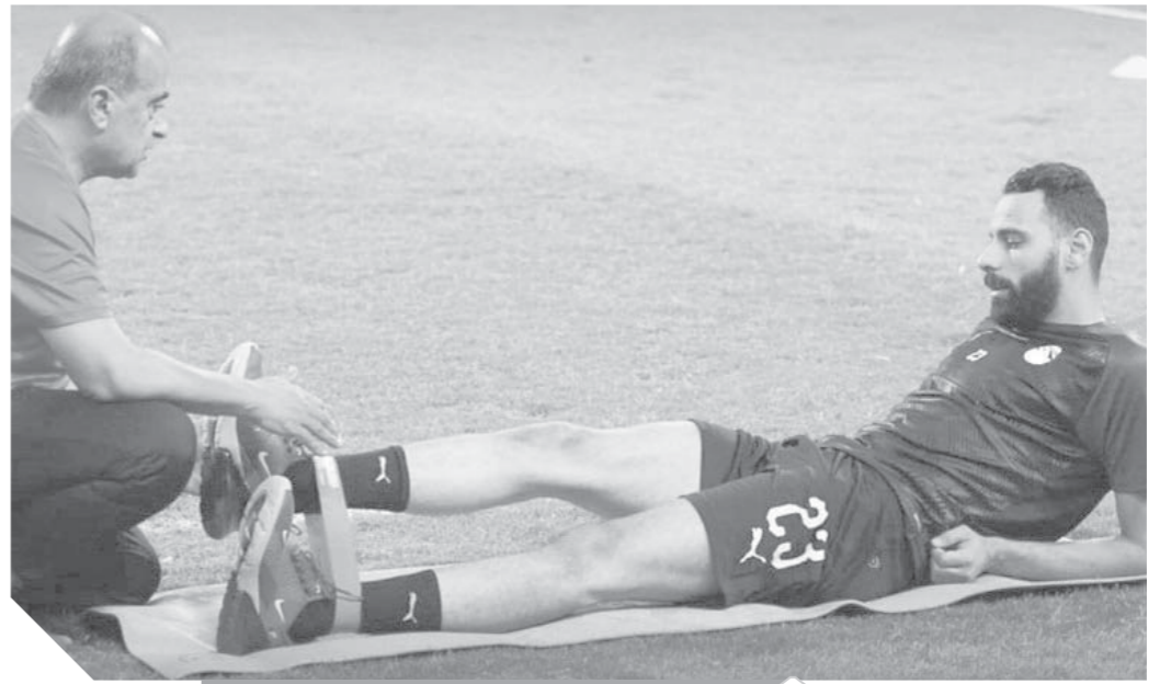
جنش تعافى من الإصابة وشارك فى التدريبات الجماعية

شهدت التدريبات الأخيرة للمنتخب الوطنى خلال معسكره المغلق بمدينة برج العرب، محاولات من جانب أجبرى، كسر حدة التدريبات على فترتين وقام بنقل المران الصباحى إلى الملعب الفرعى ببرج العرب، لتغيير الأجواء أمام اللاعبين، وكسر حدة التدريبات على فترتين لليوم الثالث على التوالى، حيث قام التدريبات المسائية على الملعب الرئيسى، وحرص أجبرى على عمل تجهيزات خاصة باللقاء الودى لمباراة تنزانيا الودية، التى يخوضها الفراعنة يوم الخميس المقبل، ويواصل الفريق تدريباته اليوم الأحد بالملعب الفرعى، وفضل أجبرى أن تكون التدريبات البدنية والحصص الفنية فى فندق الإقامة الذى تم تجهيزه بصالة جيمنازيوم تضم أحدث الأجهزة للتأهيل والاستشفاء، وشارك أغلب اللاعبين فى تلك الحصص البدنية تحت إشراف المعد البدنى وطبيب الفريق، واتخذ الجهاز الفنى