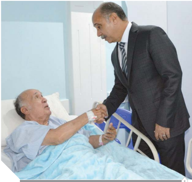
وزير الطيران خلال زيارته مرضى مستشفى مصر للطيران

وزيادة عدد الأسر، حيث زار غرف المرضى والتي تم رفع كفاءتها لتوفير كافة سبل الراحة لهم، كما افتتح قسم الأطفال الجديد والخاص بوحدة الرعاية والمضخن وقام بتفقد وحدة الزرع «الكل والكبد» ووحدة علاج الأورام والحقن الكيماوي وقسم القسطرة القلبية والرعاية المركزة، وقام بزيارة لغرف المرضى للاطمئنان