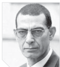
وجدى زين الدين يكتب: