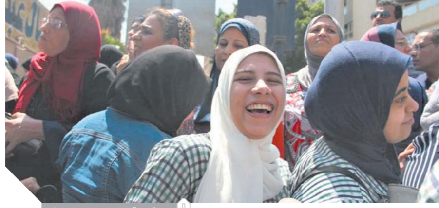
الضحة تعلق وجوه الطالبات

التربية والتعليم تعلن تسريب إجابات الامتحان بعد نصف ساعة.. وجرعة مهدئ تقتل طالبة بالشرقية