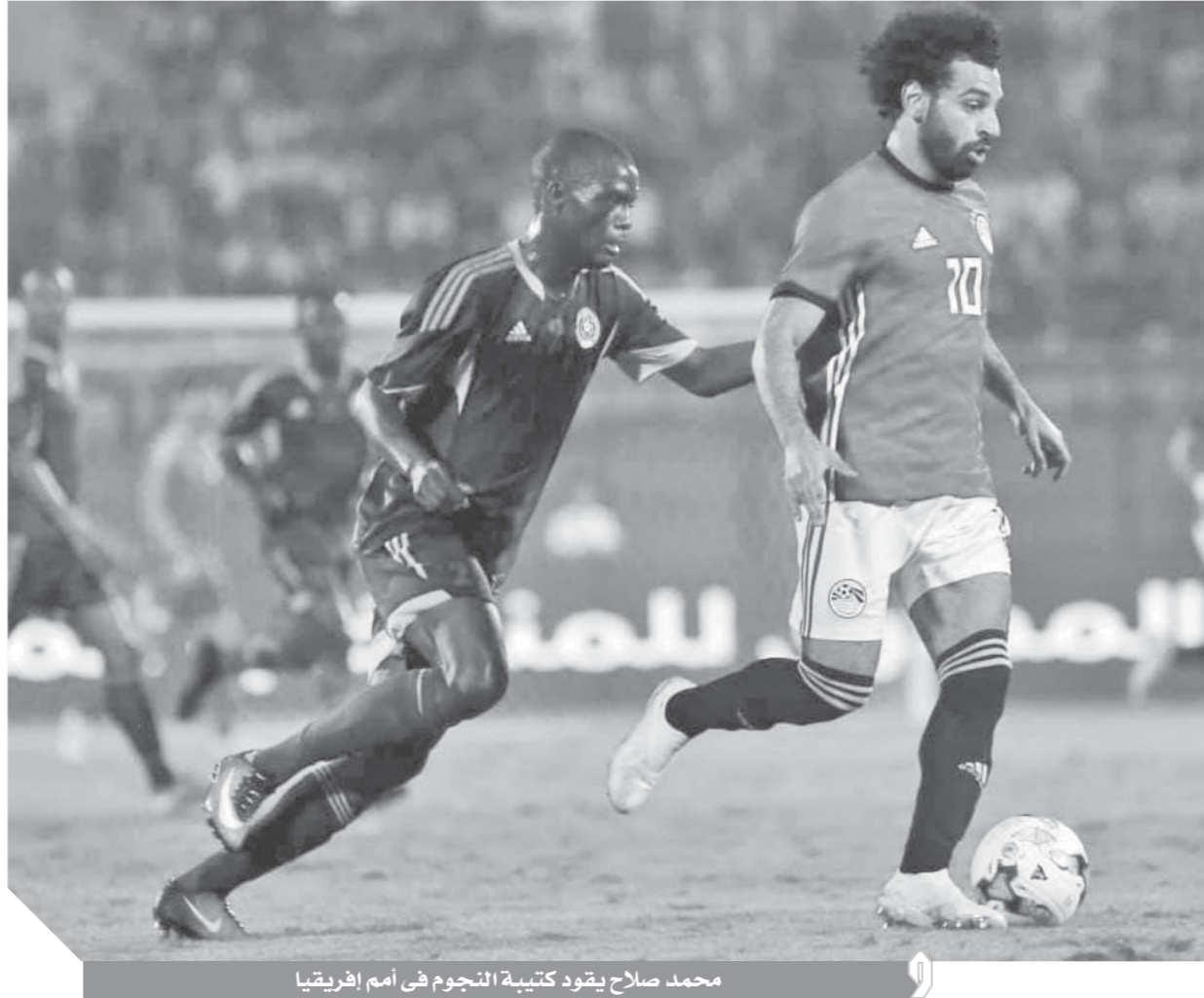
محمد صلاح يقود كتيبة النجوم في أمم افريقيا