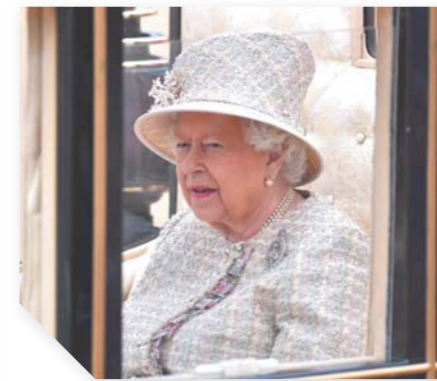
كتبت - منار السويضى:

بمشاركة أكثر من ١٤٠٠ جندي ٣٠٠ حصان ٤٠٠ موسيقى، احتفلت العائلة المالكة بعيد الميلاد الرسمى لملكة بريطانيا الملكة إليزابيث الثانية، فى عرض عسكري ملون، وهو الاحتفال الـ٧٠ الذى يقام لها، للاحتفال بعيد ميلادها الرسمى.