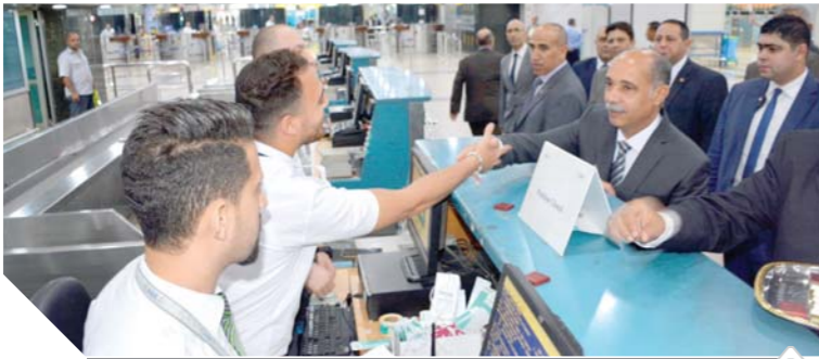
.. ويصافح العاملين بمبنى الركاب ٢