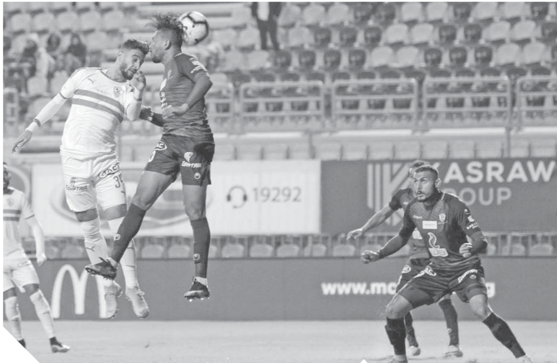
بتروجت يواجه أزمة بعد الهبوط للقسم الثاني

الوقت الذي تم فيه تلبية مطالب الأندية الأخرى بجانب اللعب على وتر الوطنية ومصصلحة البلد الذي يستعد لمهمة وطنية لخوض نهائيات الأمم الإفريقية.