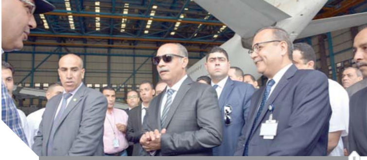
.. ويتفقد هنجر ٨٠٠٠ بشركة مصر للطيران للصيانة

عليهم والتعرف على حالتهم الصحية والخدمات الطبية المقدمة لهم وهنأهم وذويهم بعيد الفطر المبارك وتمنى لهم الشفاء العاجل، حيث أتوا على الخدمات الطبية المقدمة من أطعم الأطباء بتوفير كافة الرعاية الطبية المميزة لجميع العاملين بقطاع الطيران المدني.