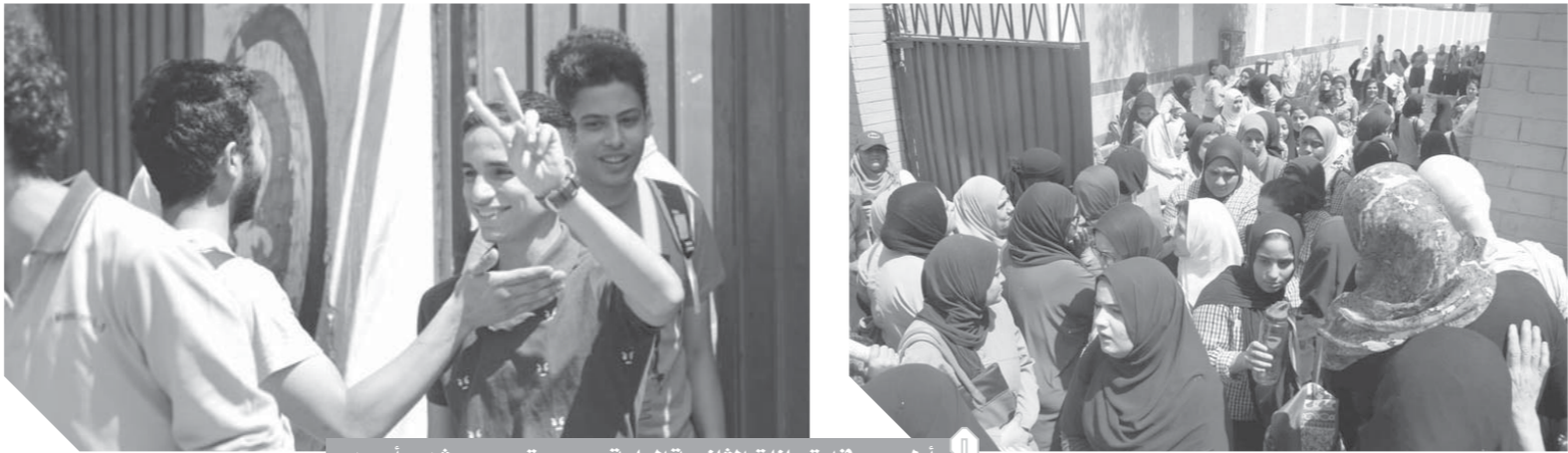
أول يوم في امتحانات الثانوية العامة