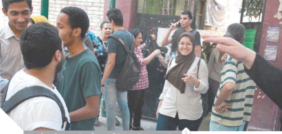
ارتياح بعد امتحان اللغة العربية