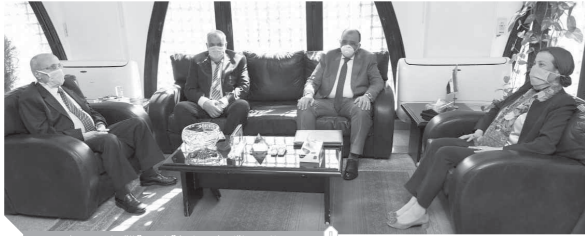
جانب من لقاء رئيس الهيئة العربية للتصنيع مع ٣ وزراء

كتب: محمد صلاح وأبو زيد كمال وسامية فاروق: