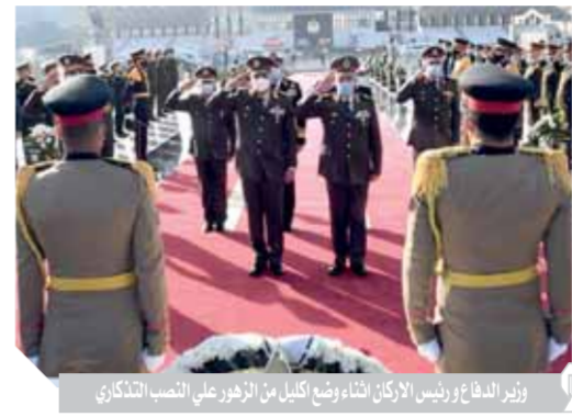
وزير الدفاع ورئيس الأركان الشاه وضع أكليلى من الزهور على النصب التذكارى