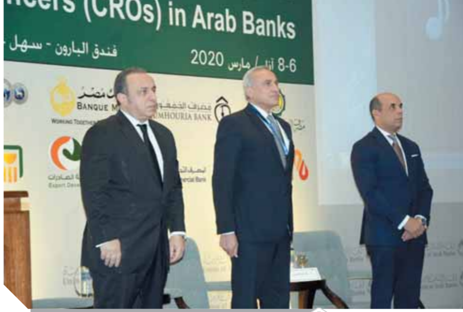
تجم وقياد ووسام خلال السلام الجمهورى مصر

وقال الأمين العام: إن استمرار الاقتصاد العالمي والإقليمي بالتراجع على ضوء تبعات الأزمات المتلاحقة، اقتصادية كانت أم جيوسياسية، إضافة إلى الحروب التجارية كل حذب وصوب، وما يشهده العالم اليوم من هلع متتمثل بعاصفة فيروس كورونا التي بدأت تهدد الاقتصاد العالمي، وخطوط التجارة والسياحة والخدمات وغيرها من القطاعات الاقتصادية العالمية، وطالت مؤخراً الصين وأوروبا ودولاً اقتصادية كبرى، مشيراً إلى أن كورونا عرقل حركة النفط العالمية وحُضض الطلب على مصافي التكرير الصينية، وأدى هذا الوباء إلى ضرر كبير في صناعة السيارات في الصين وحول العالم، حيث قررت شركات تصنيع سيارات عالمية وقف الإنتاج بمصانعها في الصين بسبب تقيس هذا الفيروس.