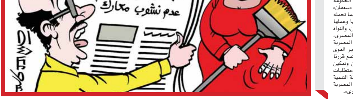
قبضت المرتب ولا لسه؟ حظك اليوم تجاهل الرد حرصاً على عدم نشوب مارك

كتب: رضا سلامة، في إطار احتمالات محافظة الجيزة بعيدها القومي 101، نظمت المحافظة حفل زفاف جماعياً لـ 30 عروسة يتيمة من غير القادرين من أبناء المحافظة، حيث حرصت المحافظة بالتعاون مع الجمعيات الأهلية في تجهيز العرائس بالأجهزة الكهربائية والمنزلية والمفروشات والعديد من مستلزمات المنزل دعماً لهم ولإعانتهم. وقام اللواء أحمد راشد، محافظ الجيزة، بتسليم العرائس الأدوات الكهربائية والهدايا في جو عائلي بهيج بحضور الأهالي، حيث أعرب محافظ الجيزة عن سعادته بالمشاركات المجتمعية ومساعدة أبناء المحافظة من قبل الجمعيات الأهلية، خاصة مع بدء غير القادرين، موجهاً الشكر للقائمين على تلك المؤسسات الجادة. وأشاد المحافظ بدور منظمات المجتمع المدني التي تسعى لتقديم خدمات مجتمعية للمواطنين وتساعد الشباب في ظل توجيهات الرئيس عبدالفتاح السيسي، رئيس الجمهورية، بتقديم كل الدعم والتسهيلات لهم. أشار راشد إلى أنه تم التنسيق مع مديرية التضامن الاجتماعي والجمعيات الأهلية لاختيار العرائس والمناطق التي وقع عليها الاختيار بأحياء ومراكز ومدن المحافظة من الفتيات اليتيمات، وذلك في إطار التعاون الجيد بين المحافظة والجمعيات الأهلية وحرص المحافظ على حضور