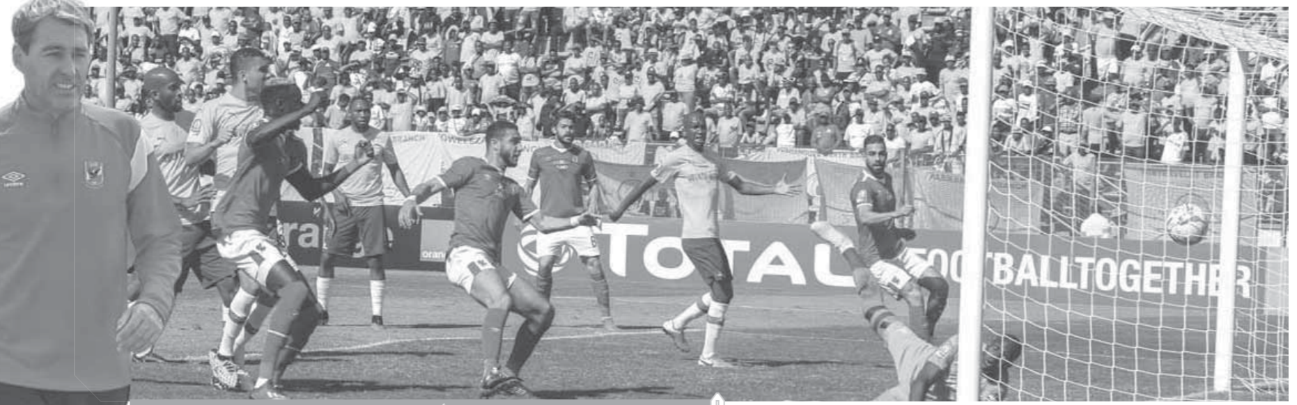
خلال مباراة الأهلى، و صن داونز.

تمنى سيد عبدالحفيظ، مدير الكرة بالنادى الأهلى، مواجهة الوداد باستاد القاهرة، كما أن مواجهة المدرب الأسبق للأهلى الإسباني خوان جاريديو لا تمثل أزمة بالنسبة للأهلى، فقد حدث نفس الأمر بدور المجموعات حين كان جاريديو مدرباً للنجم الساحلى. وتعود بعثة الأهلى اليوم الاثنتين قادمة من جنوب إفريقيا، وبدأ الفريق أمس الأحد استعداداته لمواجهة سموحة السكندرية المقررة بعد غزو الأربعا بعدما خاض الأهلى تدريبات خفيفة قبل العودة للقاهرة. ويسابق الأهلى الزمن لتجهيز الرباعي المصاب على معلول وحسين الشحات ومحمود متولى والأنجولى جيرالدو للحاق بمباراة سموحة، كما يخضع رمضان صبحي صانع الألعاب لفحص طبي لتحديد إمكانية لحاقه بقاء سموحة من عدمه.