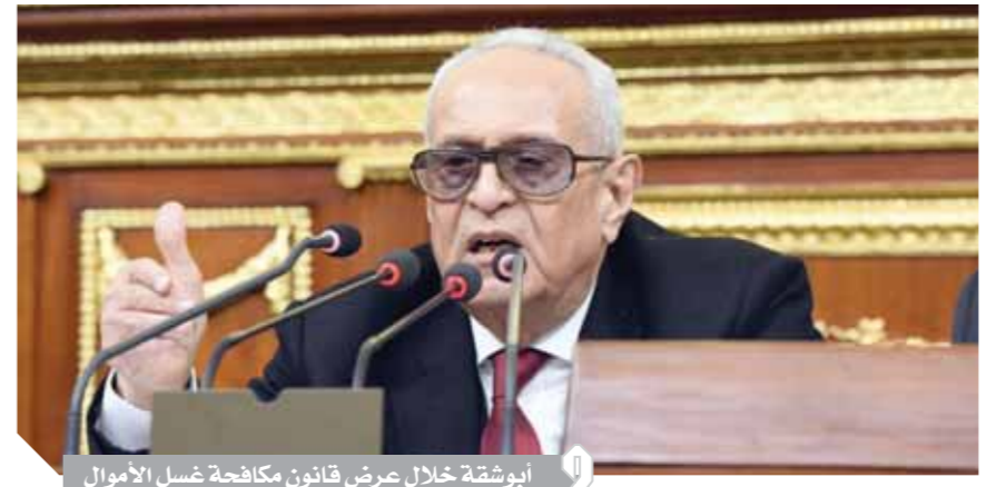
أبوشقة خلال عرض قانون مكافحة غسل الأموال

مكتوباً لإزالة الخلافات وأوجه التعارض P.5.4