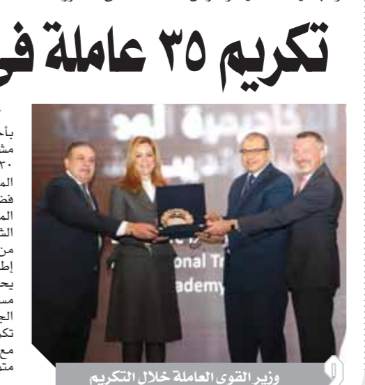
وزير القوى العاملة خلال التكريم

كرم محمد سعفان، وزير القوى العاملة 35 عاملة، بأحد الفنادق بمنح 37 منهن شهادة التخرج من برنامج مشروع تمكين المرأة في إطار التنمية المستدامة 2030، فضلاً عن 8 دروع وشهادات تقدير للمناج المشرفة للمعاملات المثاليات تكريماً لهن لما بذلوه، فضلاً عن منح دروع الشكر للكونتور رشا عياد راعب، المدير التنفيذي للأكاديمية الوطنية لتدريب وتأهيل الشباب. أكد وزير القوى العاملة أن تكريم الخريجات من مشروع مبادرة تمكين المرأة المصرية يأتي في إطار الاهتمام بالتطوير الوطني وتقديم الدعم الذي يحتاجونه لتحقيق طموحاتهم في اتخاذ خطوات مستقبلية في حياتهم المهنية بهدف زيادة التوازن بين الجنسين في صناعة الفنادق والسياحة، فضلاً عن تكريم العاملات بالفندق حرصاً الوزارة على التواصل مع جميع عمال مصر في مختلف مواقع العمل المختلفة، متمنياً للجميع التوفيق على المجهودات التي بذلوها