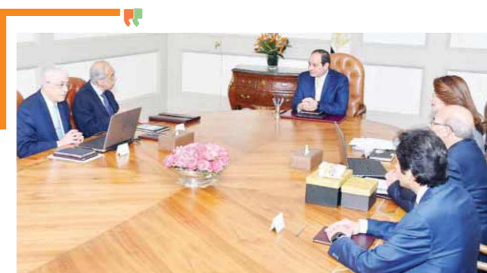
السيسي، خلال لقائه مع رئيس الوزراء ووزير التربية والتعليم