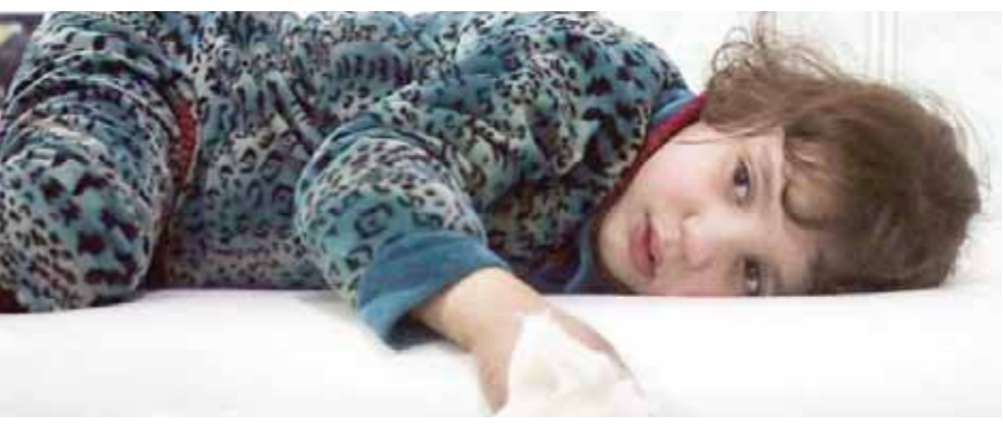
الأطفال ضحايا الحرب فى سوريا

أولها «جبهة النصرة»، وسط تقدم ملحوظ للجيش السوري. من جانبه قال وزير الخارجية الفرنسى جان إيف لودريان، إن بلاده سترد إذا ثبت استخدام أسلحة كيميائية أدت لسقوط قتلى فى سوريا.