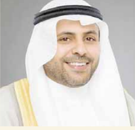
محمد ناصر الجبرى

يصل اليوم الجمعة وزير الإعلام الكويتى محمد ناصر الجبرى؛ للمشاركة فى الملتقى الإعلامى إبعاد الفلسطينيين من سكان القدس عن مدينتهم، فى أحدث القوانين التى تستهدف الوجود الفلسطينى فى المدينة المقدسة. وينص القانون الذى صادق عليه الكنيست بالقراءتين الثانية والثالثة، على منح صلاحية سحب هويات المقدسيين بحجة «خرق الأمانة لدولة إسرائيل»، أو فى حال أنهموا بالمساس بالأمن، أو الانتماء إلى أى من الفصائل الفلسطينية.