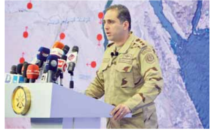
العقيد تامر الرفاعي خلال المؤتمر الصحفي

تصفية 105 إرهابيين وضبط 2829 وتدمير 471 عبوة ناسفة ودك 1907 أوكار ومخازن و41 سيارة دفع رباع محملة بالأسلحة