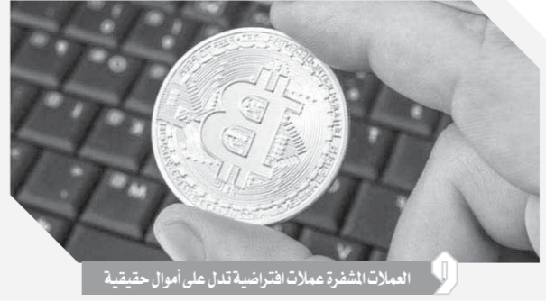
العملات المشفرة عملة افتراضية تدل على أموال حقيقية

لدى بعض شركات التداول المالية الأخرى. وقدمت شركة طلب حماية قانونية في مواجهة الدائنين، إذ تشير تقاريرها إلى أنها فقدت ما قيمته 180 مليون دولار كندى (137 مليون دولار) من العملات المشفرة، فيما يقض أصحاب الأموال في حيرة من أمرهم، فلم تتمكن الشركة لأن من الوصول إلى احتياطي العملة المشفرة منذ وفاة صاحب الشركة في ديسمبر الماضي أثناء زيارته للهند.