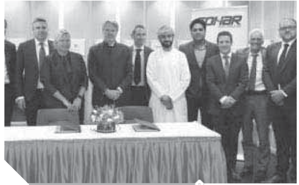
الدكتور عبد المنعم بن منصور وزير الإعلام

تسلم الجائزة الدكتور عبد المنعم بن منصور الحسني وزير الإعلام، في احتفالية كبيرة أقيمت في شهر ديسمبر الماضي، وتم خلالها تكريم الجهات الفائزة. حماية أمن المعلومات