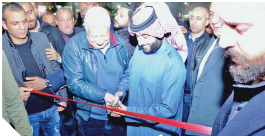
تركي يفتتح المبنى الاجتماعى ويصحبته مرتضى منصور

افتتح المستشار مرتضى منصور رئيس نادى الزمالك وبصحبته المستشار تركى آل شيخ رئيس الهيئة العامة للترفيه بالملكة العربية السعودية ومالك نادى بيراميدز المبنى الاجتماعى الجديد بالنادى الذى أطلق عليه مجلس إدارة النادي اسم تركى آل الشيخ. وتفتقد الشيخ منشآت النادي والمسجد الجديد وسط استقبال حافل من أعضاء النادي الذين اصطفوا فى جميع جنبات النادي لتحميته والتقائم الصور التذكارية معه فى حضور عدد من أعضاء مجلس النواب.