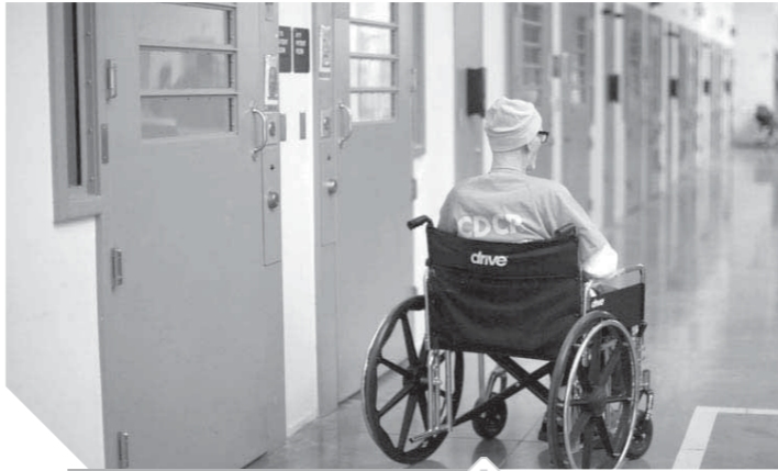
المريض قبل وفاته

هذا الطبيب يحاكم ليس بتهمة الإهمال، ولا بسبب تعريضه حياة مريض للموت أو حتى تسببه في وفاة أحدهم، بل بتهمة هي الأغرب من نوعها، يحاكم لأنه أنقذ حياة مريض من الموت، وتسبب بالأدوية العلاجية في مد عمر المريض عن الفترة التي حددها له أطباء آخرون، وهو ما أثار حفيظة أسرة المريض التي توقعت له الموت وفقاً لتاريخ حدده لها الأطباء، إلا أن هذا الطبيب تسبب في إنقاذ المريض من الموت ليعيش لمدة شهر بدلاً من أربعة أيام.