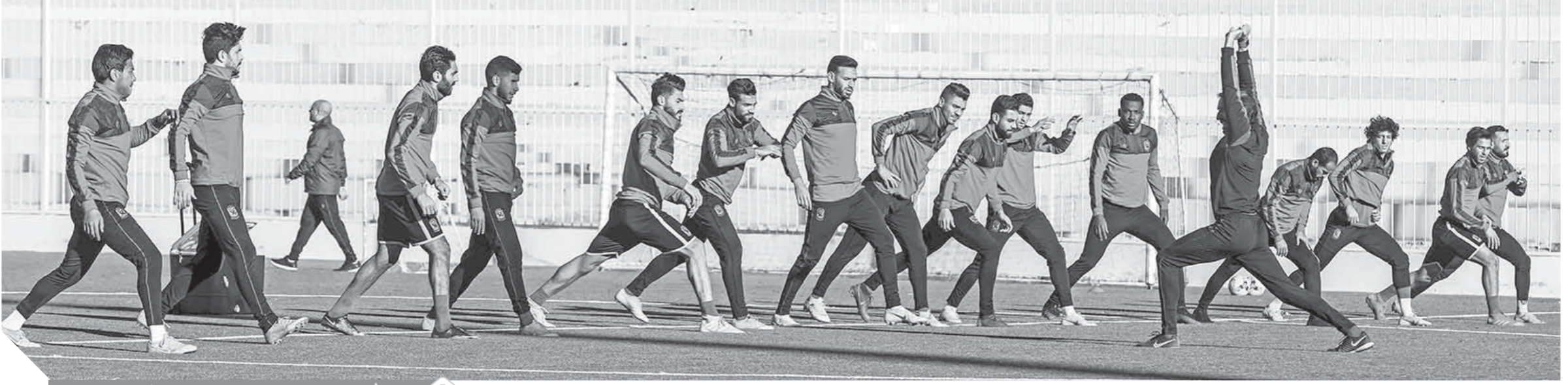
الأهلي يسافر إلى تنزانيا اليوم استعداداً لمباراة سيمبا