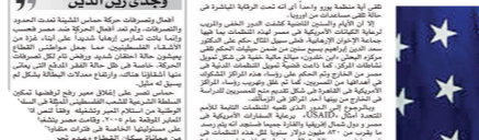
صورة مما تم تشرد ب الوفد في 12 مارس 2016

زهد عمرو التوبيلات الخارجية وعمع المنظمات المشبوهة شهدياً فتره علمه سفيرا لبلاده في مصر