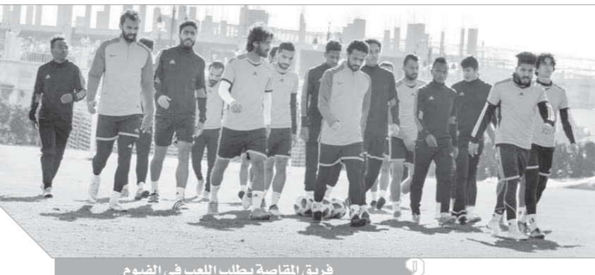
فريق المقاصة يطالب اللعب فى الفيوم

لديه استعداد المشاركة بأى شيء لإنجاح بطولة كأس الأمم الأفريقية لأنها فى النهاية صورة مصر بكلها وليس اتحاد الكرة قائلاً: إن الدورى هذا الموسم طويل والمنافسة قوية والفرق فى النقاط بين الفرق قليل وثلاث نقاط مكسب من الممكن ترفع رصيد فريق 5 مراكز وخسارته تهيئ بالفارق إلى 4 مراكز، لكن المقاصة يحاول أن يجتهد.