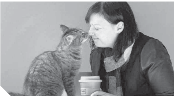
التقطط تسبب في الفصام والأمراض العقلية

القطط من أكثر الحيوانات الأليفة التي نجحها وتكثر تربيته في منازلنا، ولكن هل تعلم أنها تحمل الخطر لك ولطفلك، وأن أقل المخاطر هي الإصابة بالالتهاب، وتدرج المخاطر التي تسببها في إصابة أصحابها بالفصام أو التخلف العقلي، وذلك وفقاً لأحدث دراسة علمية أجراها الباحث «سولفستين بيرغدورف» وفريقه العلمي في جامعة كوبنهاغن. فقد توصل العلماء، إلى وجود بكتيريا طفيلية في القطة، يمكن أن تزيد من فرص تطور مرض انفصام الشخصية عند الإنسان، بنسبة 50%، ويطلق على هذه البكتيريا الطفيلية اسم «غونديا غونديا» أو «التوكسوبلازما غوندي»، وهي كائن طفيلي يتواجد أساساً في القطة، وينتقل وينتشر بواسطة «مخلفاتها»، وتؤكد أن هذا الكائن الطفيلي يسبب في إصابة الإنسان بأمراض نفسية مثل الكآبة، والتخلف العقلي لدى الأطفال، وأن هذا الطفيل أصبح موجوداً في مليارات من البشر في أنحاء العالم، وتم العثور عليه وأصفاً في نسبة 25% من العينة التي أجريت عليها الدراسة، بسبب وجود قطط في