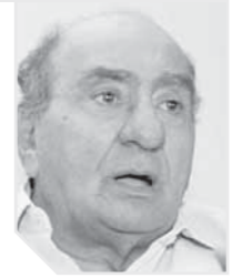
المستشار محمد حامد الجميل