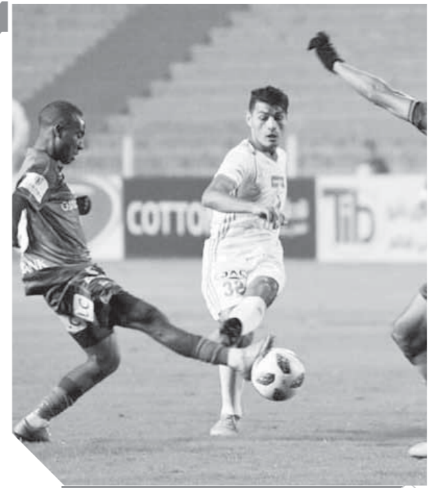
الإسماعيلي خرج بنقطة وحيدة أمام المقاصة

مارسيلو وفي الوسط كاسيميرو، مودريتش، كروس، وفي الهجوم: بيل، بنزيما، فاسكيز. بينما من المتوقع أن يبدأ الأرجنتيني دييجو سيميوني المدير الفني لأتلتيكو في حراسة المرمى بأوبلاان، وفي الدفاع أرياس، خيمينيز، هيرنانديز، خوانفران، وفي الوسط توماس ليما، رودري، بارتي، أنجيل كوربا، وفي الهجوم الفارو موراتا.