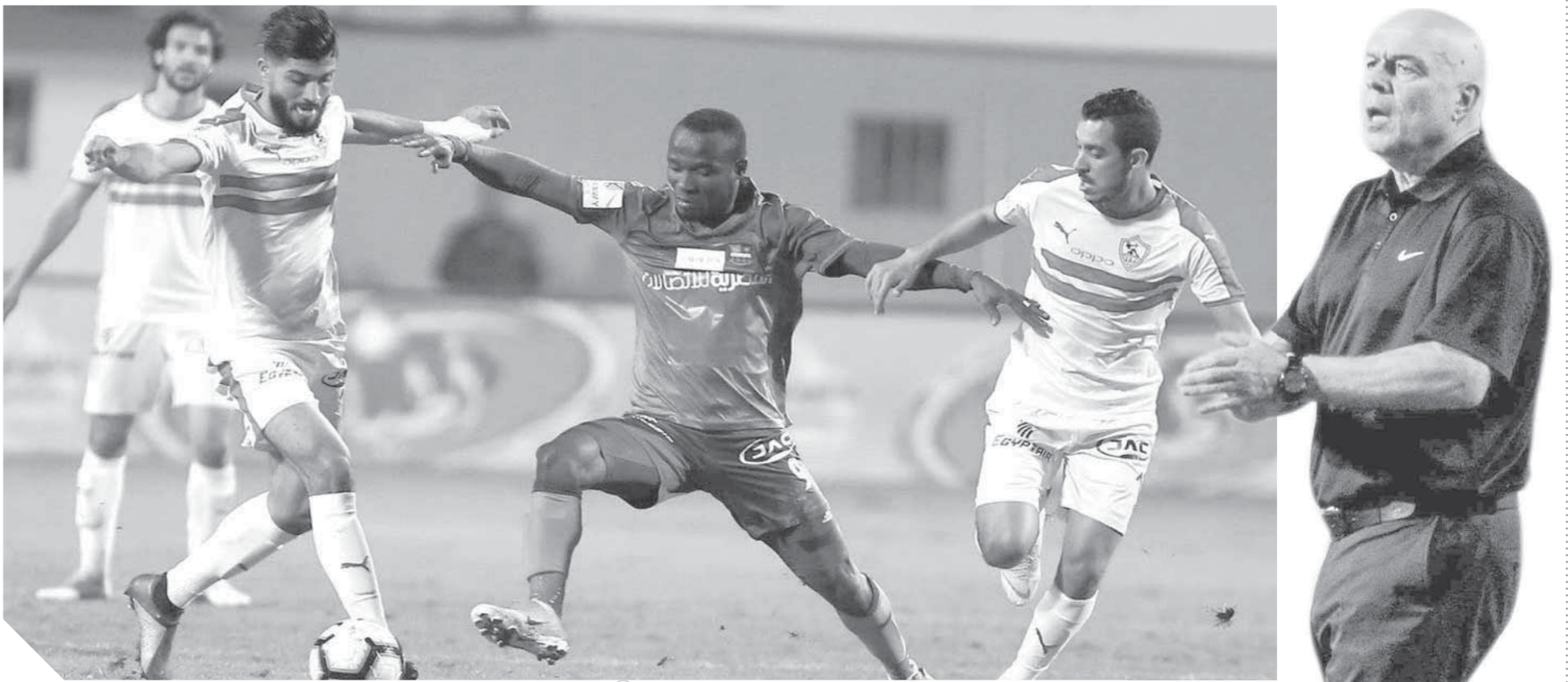
الزمالك أغلق ملف الكونفيدرالية وعاد ل مباريات الدورى