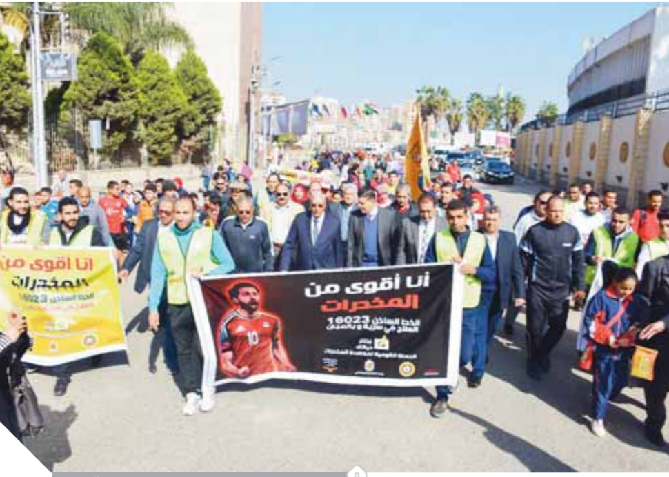
ماراثون لا للإدمان يتقدمه محافظ الدقهلية