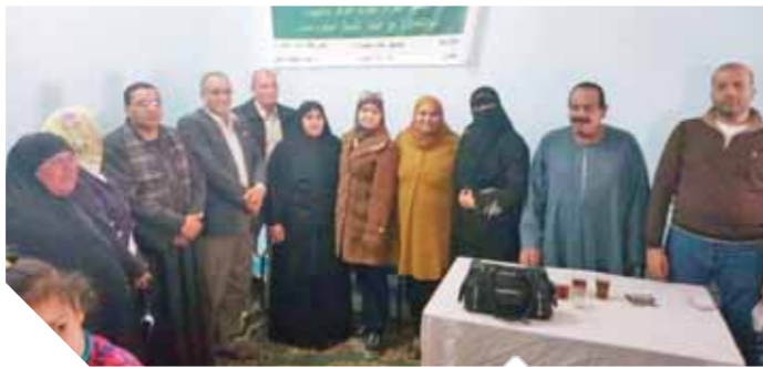
لجنة المرأة بإطسا