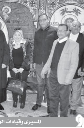
السيرى وقيادات الوفد يقدمون التهنية

مازلنا في رحاب الفيلسوف العلامة «ابن القيم» الجوزي. ويقول عنه «ابن كثير»: كان حسن القراءة والخلق كثير التودد، لا يحسد أحداً ولا يؤذي، ولا يستعيبه ولا يحقد أحداً وبالجملة كان قليل النظر في مجموعه وأموره وأحواله، والغالب عليه الخير والأخلاق والفضيلة. ويقول أيضاً معترفاً بصحته ومحبه له: «وكنث من أصحاب الناس له وأحب الناس إليه». ويقول ابن رجب «وكان رحمه الله تعالى ذا عبادة وتهدج وطول صلاة إلى الغاية القصوى، وتلاه ونهج الذكر. وشغف بالحجة والاتباع والاستغفار والافتقار إلى الله والانتكاس له، والإطراح بين يديه على عتبة عبوديته لم أشاهد مثله في ذلك، ولا رأيت أوسع منه علماً ولا أعرف بمعاني القرآن والسنة وحقائق الإيمان أعلم منه وليس هو المعصوم ولكن لم أر في معناه مثله. وذكر أقرانه من العلماء أنه كان كثير العبادة شديد الورع، فقال ابن كثير: «لا أعرف في هذا العالم في زماننا أكثر عبادة منه، وكان له طريقة في الصلاة يطيلها جداً، ويمد ركوعها وسجودها، ويلوم كثير من أصحابه في بعض الأحيان فلا يرجع، ولا ينزع عن ذلك رحمه الله تعالى». وتحدثت مصادر ترجمة ابن القيم عن شهرته بحب الكتب وجمعها، حتى تكونت لديه مكتبة كبيرة، يقول ابن كثير: «واقفتي من الكتب ما لا يتفها لغيره تحصل عشرين، من كتب السلف والخلف»، وقال ابن رجب: «وكان شديد المحبة للعلم... واقفاته الكتب، واقفتي من الكتب ما لم يحصل لغيره... ويقول ابن حجر السقلاطي: «وكان مغرراً بجمع الكتب، فحصل منها ما لا يُحصى». وقد خلف ابن القيم مكتبة كبيرة جداً، فيذكر ابن حجر أن أولاده ظلوا دهرًا يبيعون منها بعد موته، سوى ما اصطوفوه لأنفسهم». وقد اقتنى ابن أخيه «عماد الدين أبو الفداء إسماعيل بن زين الدين عبد الرحمن» أكثر كتبه.