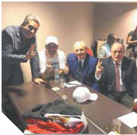
فرحة المكتب التنفيذي لكاف