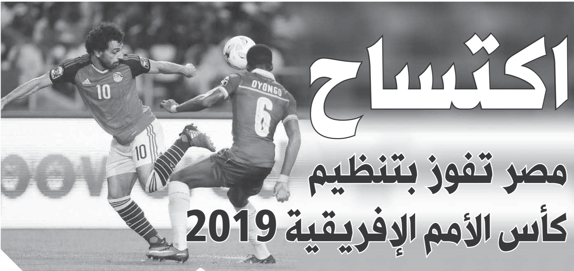
استضافة البطولة تقرب منتخب مصر من الفوز باللقب