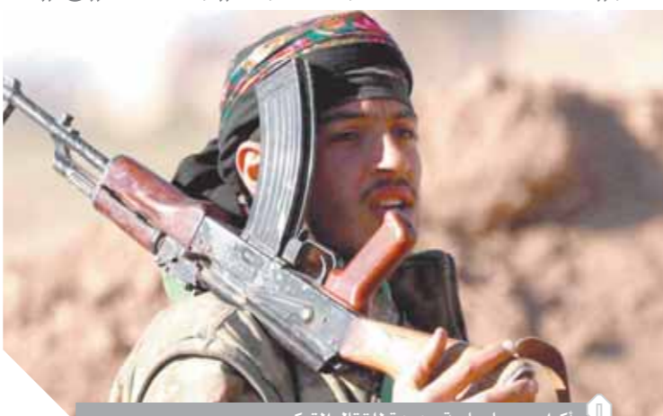
أكراد سوريا ساحة جديدة للقتال التركى

«أردوغان» يخذع «ترامب» ويخطط لدفن الأكراد.. وطيران الخليج يستأنف رحلاته إلى دمشق