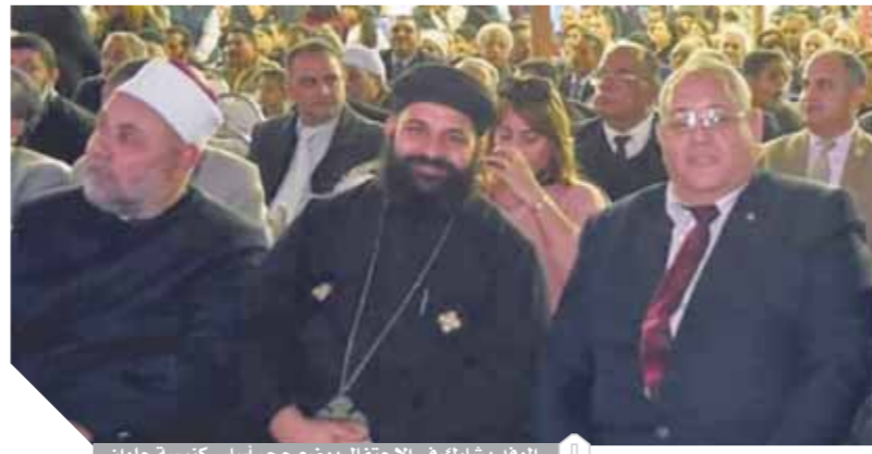
الوفد يشارك في الاحتفال بوضع حجر أساس كنيسة حلوان