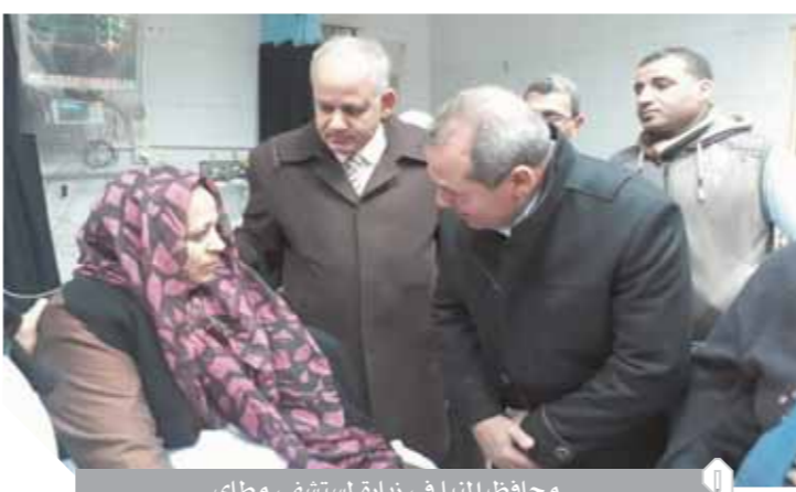
محافظ المنيا في زيارة لمستشفى مطاى

إصابة 5 في انفجار غلاية تعقيم بطوارئ المنصورة.. و«نصر النوبة» بأسوان خارج الخدمة