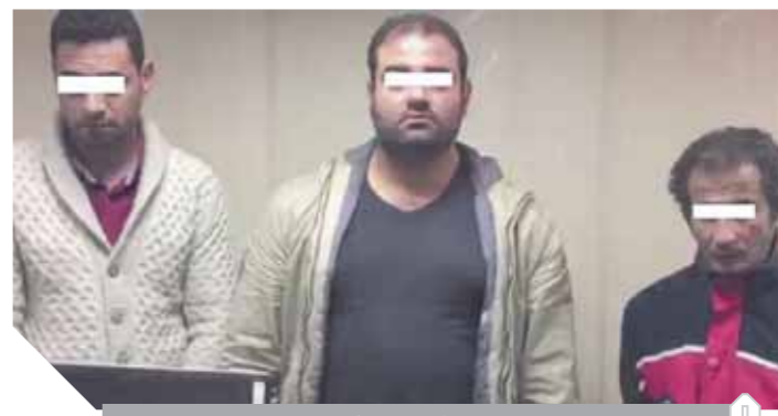
٣ من المقبوض عليهم

واصلت القوات البحرية تنفيذ مهامها في تأمين وحماية السواحل البحرية المصرية ودعم أعمال البحث والإنقاذ على كافة الاتجاهات الاستراتيجية، حيث نجحت إحدى الوحدات البحرية في إحباط محاولة هجرة غير شرعية في اتجاه السواحل المصرية قرب السلوم، وذلك بعد اكتشاف عائمة سريعة قادمة من الجانب الليبي تحمل عدداً من الأفراد، وعلى الفور صدرت الأوامر من القيادة العامة للقوات المسلحة بالتعامل مع المركب، وتم دفع وحدة بحرية سريعة لمطاردة العائمة والتضييق عليها، حيث وجد على متنها ٢٩ فرداً من جنسيات مختلفة أثناء محاولتهم الهجرة غير الشرعية، حيث تم اقتيادهم لمرسى السلوم لاتخاذ الإجراءات القانونية حيالهم.