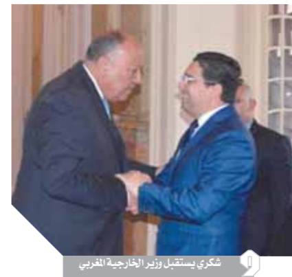
شكري يستقبل وزير الخارجية المغربي

العلاقات بين البلدين. كما أشار إلى أن القاهرة والرباط اتفقتا على أن تكون وزارة الخارجية نقطة اتصال وتنسيق خلال الفترة المقبلة لتنسيق وتعزيز التعاون، موضحاً أنه يجري التحضير للجنة العليا المشتركة بين البلدين.