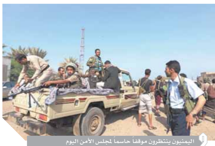
اليمنيون ينتظرون موقفاً حاسماً لمجلس الأمن اليوم

السوفيت والتعطيل والتلاعب، والهروب عبر المطالب والشروط الجديدة لن يتفق الحوثى هذه المرة، ومن الضروري التنفيذ الكامل للانسحاب من ميناء ومدنية الجديدة للاستمرار في المرحلة القادمة العملية السياسية، ويقضى اتفاق السويد بانسحاب ميليشيات الحوثي من المدينة والمعينة خلال 14 يوماً، وإزالة أي عوائق أو عقبات تحول دون قيام المؤسسات المحلية بأداء وظائفها، وانسحابهم من موانئ الجديدة والصليف ورأس عيسى إلى شمال طريق صنعاء، في مرحلة أولى خلال أسبوعين. ونص كذلك على إشراف لجنة تنسيق إعادة الانتشار على عمليات إعادة الانتشار بمدينة الجديدة.