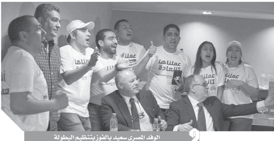
الوفد المصري سعيد بالفوز بتنظيم البطولة

ووجه رئيس الكاف الشكر إلى كل من مثلى مصر وجنوب إفريقيا على التقدم بعد سحب التنظيم من الكاميرون التي حرص أيضاً على تقديم الشكر لرئيسها لتفهمه الموقف بسحب التنظيم لعدم الجاهزية الكاملة للبلد. وأتم أحمد تصريحاته قائلًا: «أعلن لكم فوز مصر بشرط تنظيم أمم أفريقيا 2019، كما أننا سنسعى لعمل شراكة بناء مع مصر كما سنطلب المساعدة من جانب الاتحاد الدولي «فيفا» للخروج بالبطولة بشكل مرضي للجميع».