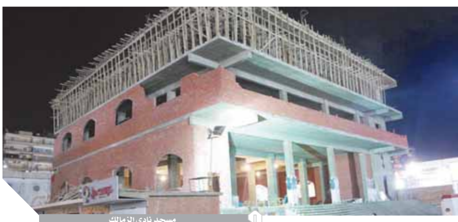
مسجد نادي الزمالك

تحرس إدارة النادي على بنائه مساهمة في تربية نثره صالح في إطار مرحلة البناء التي يشهدها الوطن كله في جميع المجالات. جدير بالذكر أن المسجد الذي يطالب حي العجوزة بإزالته، تم بناؤه على نفس مساحة الأرض التي كان مبنياً عليها المسجد القديم، ورغم ذلك يصير الحي على الاستجابة لمجموعة من الشكاوى الكيدية التي يسعى بعض المعارضين لمجلس إدارة الزمالك بمحاربه وتشويه أي إنجاز يقومون به، وكان من الأولى أن يفكر مسئولو الحي في توفيق أوضاع هذا المسجد بدلاً من التفكير في إزالته.