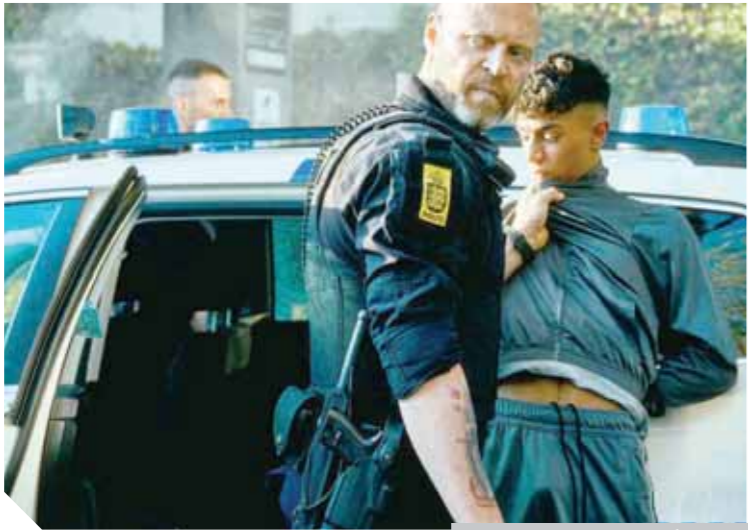
مشاهد من فيلم Shorta