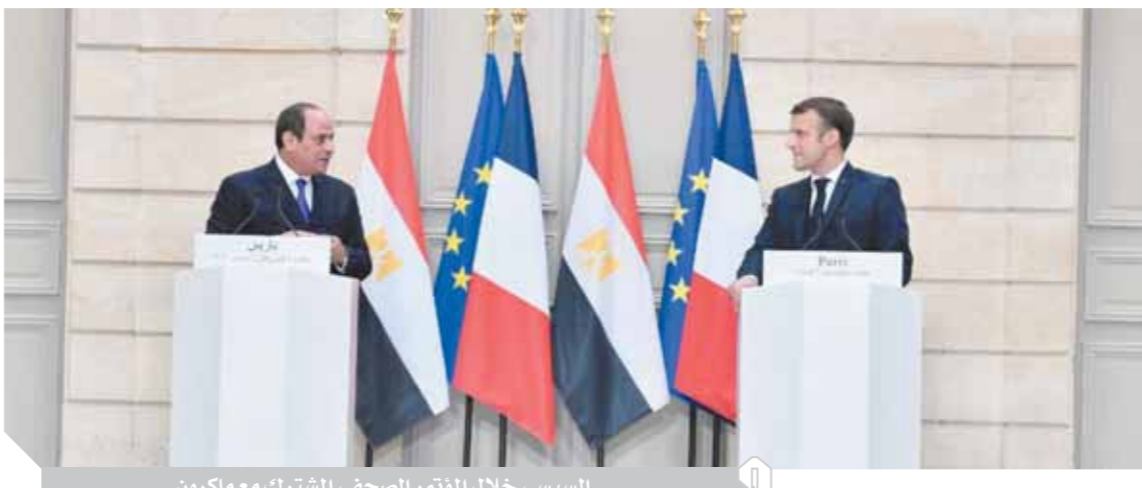
السيسي خلال المؤتمر الصحفي المشترك مع ماكرون