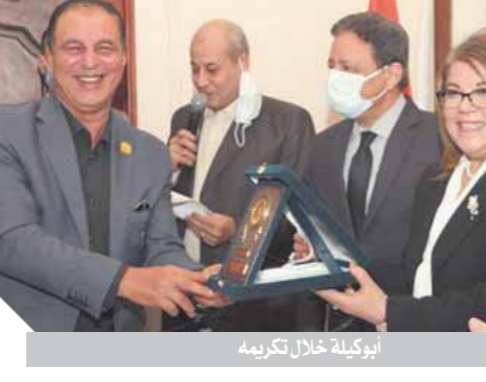
أبوينة خلال تكريمه

داخل غرفة الشيوخ. وأكد «جبر» على ضرورة السعي الدائم لخلق منظومة جديدة، وأنه يتعين أن يكون هناك تكاتف وتضامن بين كل المؤسسات الإعلامية، منوهاً بأن الإعلام المصري سواء الخاص أو القومي أو الحزبي أدى دوره في القضايا المهمة، وكان خط دفاع قويا للغاية للدفاع عن المواطنين. وأضاف «جبر» أنه يجب عدم الخلط بين الإعلام التقليدي والحديث الذي ظهر مؤخراً، كما يجب خلق قنوات اتصال وحوارات مباشرة مع الرأي العام، مقترحاً الدعوة إلى مؤتمر لخلق قنوات تواصل مع وسائل التواصل الاجتماعي، حتى لا نترك المجال لهذا الفضاء الفسيح، ووجه الكاتب الصحفي عماد الدين حسين، عضو مجلس الشيوخ، الشكر للرئيس عبدالفتاح السيسي على تعيينه بمجلس الشيوخ، والهيئة الوطنية للصحافة على ترشيحها إياه، قائلاً: «ما أتمناه في مجلس الشيوخ أن يسحب الصراح السياسي من السوشيال ميديا إلى ساحته وروافه، ومجلس الشيوخ سعيد السيادة الوطنية، وسيحاول الرد على الترميزين بالأمن القومي».