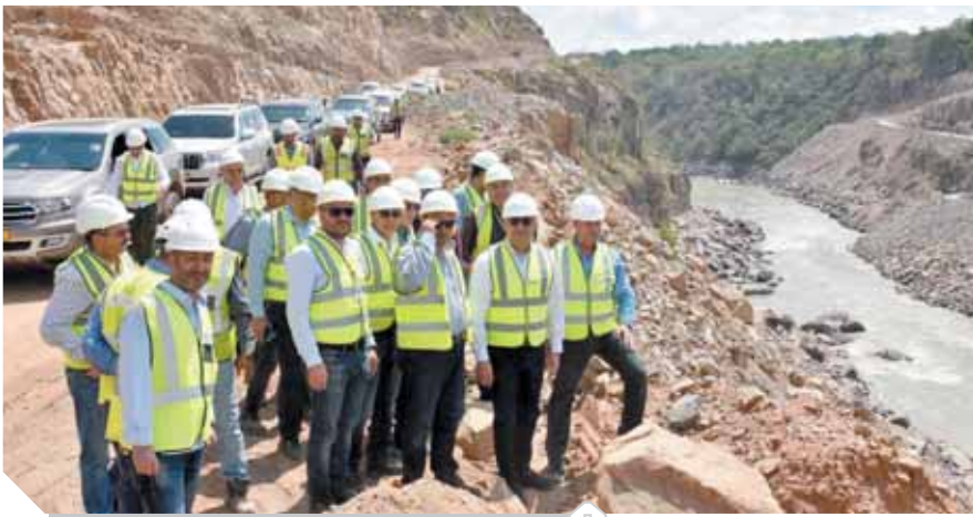
الجزر، يزور سد تنزانيا

وأشار وزير الإسكان بمستوى تنفيذ مشروع إنشاء سد ومحطة جوليوس نيريري لتوليد الطاقة الكهرومائية، منذ بدايته في ديسمبر ٢٠١٨ والتعاون المستمر بين الجانبين المصري والتنزاني لحل أي معوقات تواجه التنفيذ، موضحاً أن المشروع يتولى تنفيذه تحالف مصري مكون من شركتي المقاولون العرب والسويدي إلكتريك، بتكلفة تبلغ ٢,٩ مليار دولار.