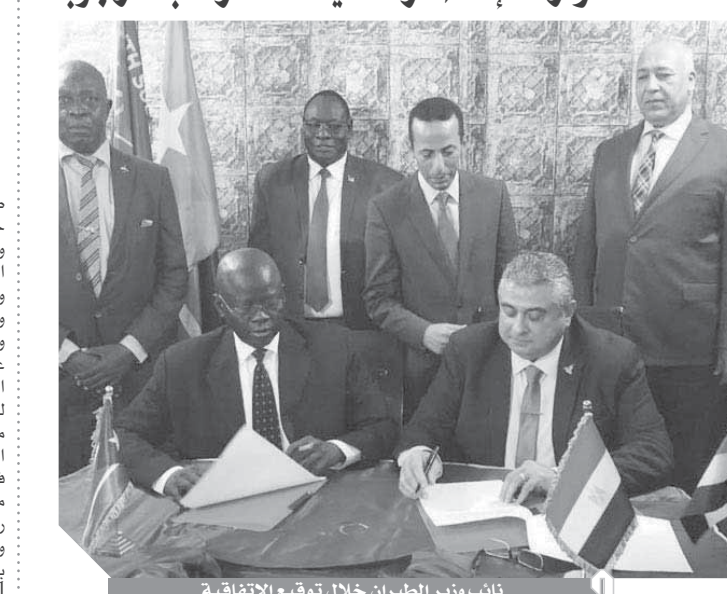
نائب وزير الطيران خلال توقيع الاتفاقية