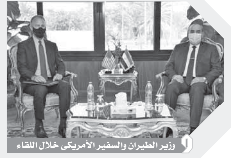
وزير الطيران والسفير الأمريكي خلال اللقاء

سقبل الطيار محمد منار وزير الطيران المدني بمكتبه سفير جوناثان كوهين سفير الولايات المتحدة الأمريكية بالقاهرة وذلك لبحث العلاقات الثنائية واتفاقيات النقل الجوي بين البلدين، بحضور المهندس الدكتور أشرف نوير رئيس سلطة الطيران المدني واللواء طارق نصير مساعد وزير الطيران للأمن.