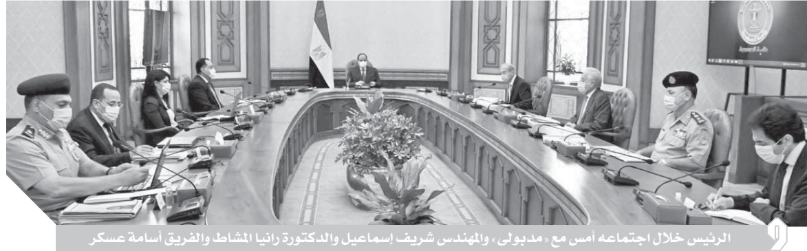
الرئيس خلال اجتماعه أمس مع مديولى، والمهندس شريف إسماعيل والدكتورة رانيا المشاط والفريق أسامة صسكر