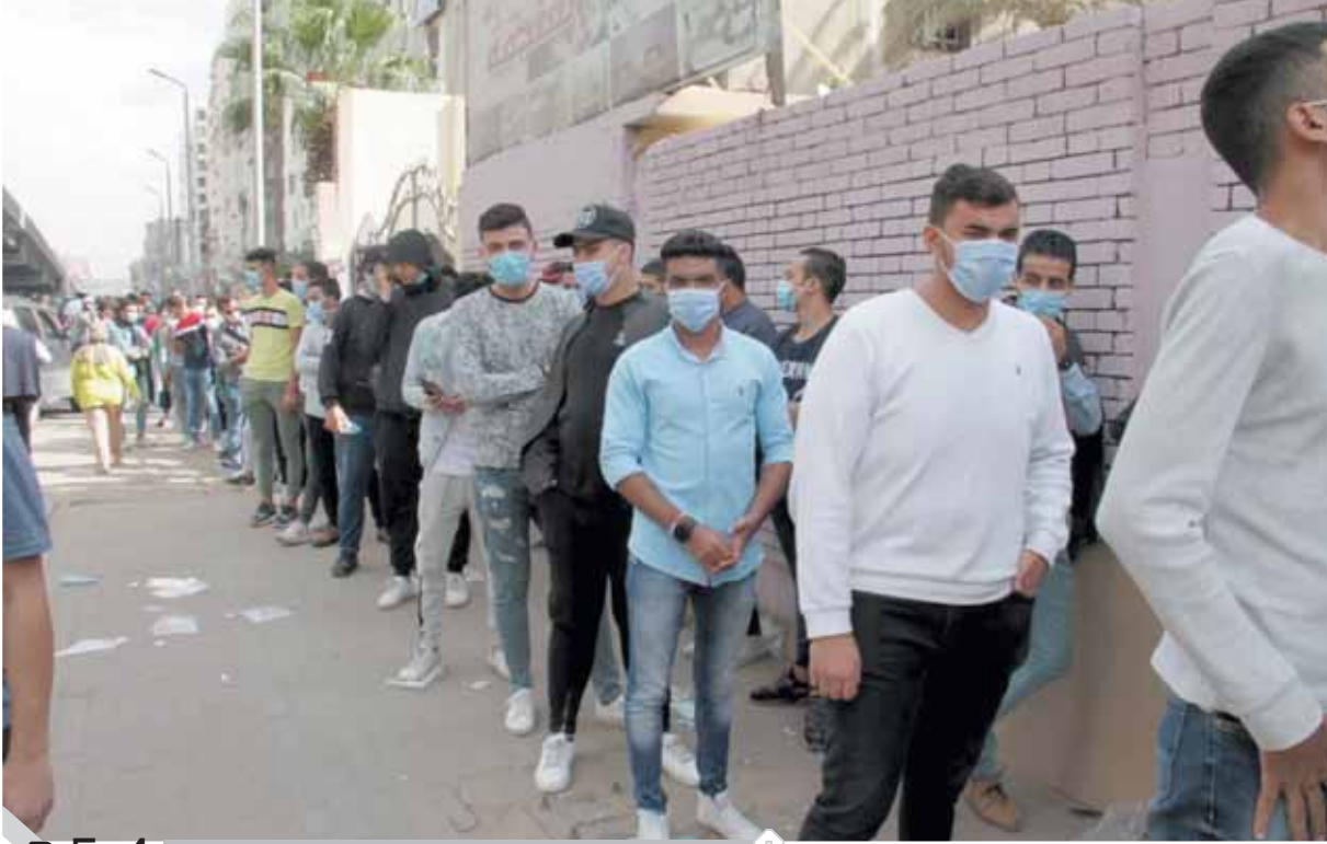
P.5-4 الشباب يتقدمون الصفوف للأداء بأصواتهم في الانتخابات