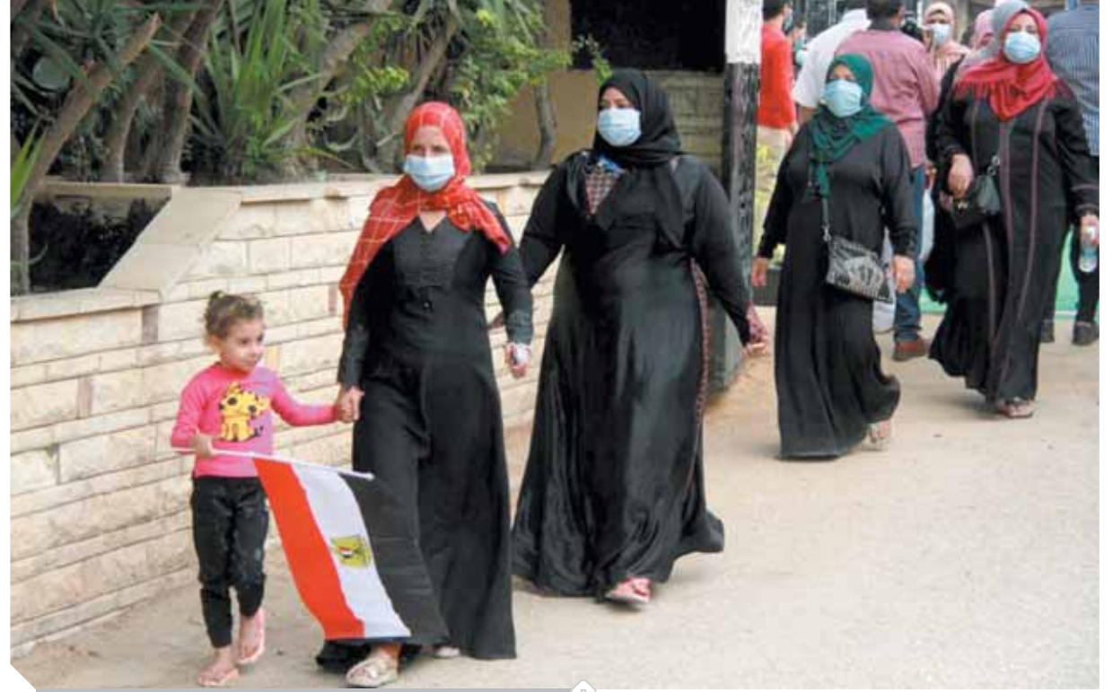
حرص شديد من السيدات على المشاركة في العرس الديمقراطي