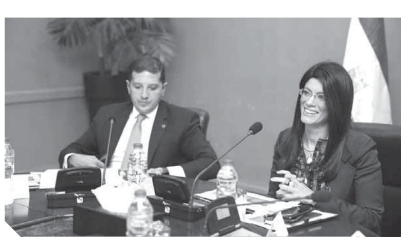
المشاط خلال اجتماعها أمس

Chai, Qasatli, Fatura, Liwwa, و Pay وغيرها. ولقت إلى الزيارة التي تمت خلال أكتوبر الماضى، مع جون بارسا، رئيس الوكالة الأمريكية للتنمية الدولية لمسرعة الأعمال FlatLabs، والتي تعتبر إحدى النماذج الناجحة فى مجال ريادة الأعمال وحصلت على دعم من مؤسسات التمويل الدولية، كما أنها إحدى الشركات المستفيدة من استثمارات شركة مصر لريادة الأعمال.