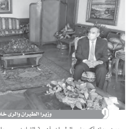
وزيرى الطيران والرئ خلال المباحثات

والتعاون في اعداد نشرات موحدة مشتركة بين المؤسسات التابعة للوزارتين، كتحديرات وتنبؤات وتبنيهات تتعلق بالمزارعين والمواطنين على حد سواء لتلافي أي تأخيرات سلبية للتبليغات في الطقس. وقطاع المياه وفي سياق متصل بحث الدكتور محمد عبدالعاطي وزير الموارد المائية والري والطيار محمد منار عنية وزير الطيران المدني والتعاون في مجالات دراسات التغيرات المناخية، حيث تمت مناقشة سبل التعاون في إتمام الدراسات اللازمة لتحديد آثار التغيرات المناخية على قطاع المياه وتضمن تلك الدراسات خلال الإعداد للمشروعات التنموية الكبرى، وكذلك دعم تلك الدراسات بالخرائط المناخية المتفاعلة والتي تقوم بإعدادها الهيئة العامة للأرصاد الجوية المصرية وتمت مناقشة آلية التعاون في إعداد الدراسات اللازمة لتحديد تأثير تغير استخدامات الأراضي على معدلات الرطوبة والحرارة والأمطار.