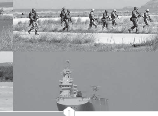
جانب من التدريب المشترك - ميدوزا - ٩