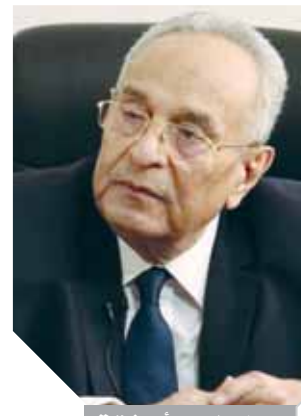
بهاء الدين أبو شقة

تكون قادرة على مواجهة الشائعات والأزمات، ويمكن الاستعانة بشباب من البرنامج الرئاسي، والأكاديمية الوطنية للتدريب، وأن على الحكومة دراسة مقترح أوشقة وإعلان الوزارة في أول تشكيل وزاري جديد. وأكد النائب الوفدي هاني أباطة أن وزارة الأزمات مقترح عصري يتماشى مع متطلبات العصر الحديث لمواجهة حروب الجيل الرابع، وتلافى الأزمات التي تحدث نتيجة تقصير أو مخططات من شأنها الأضرار بالصالح العام.