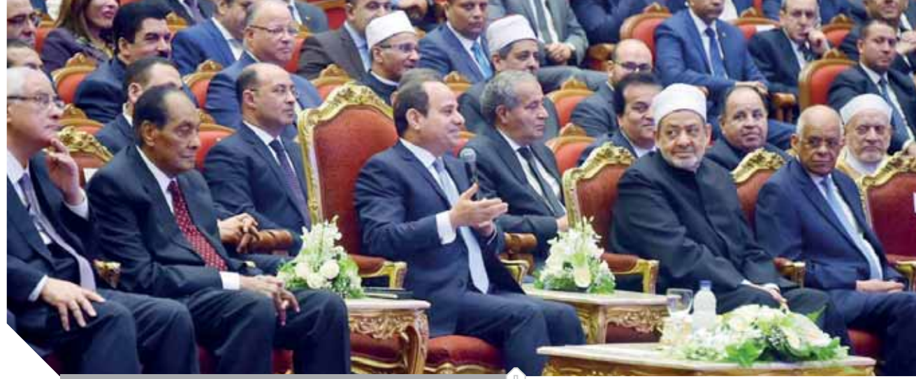
الرئيس وكبار رجال الدولة في الاحتفال بذكرى المولد النبوي الشريف

وزير الأوقاف: البدء فوراً في التحضير لمؤتمر الشأن العام بشراكة وطنية واسعة