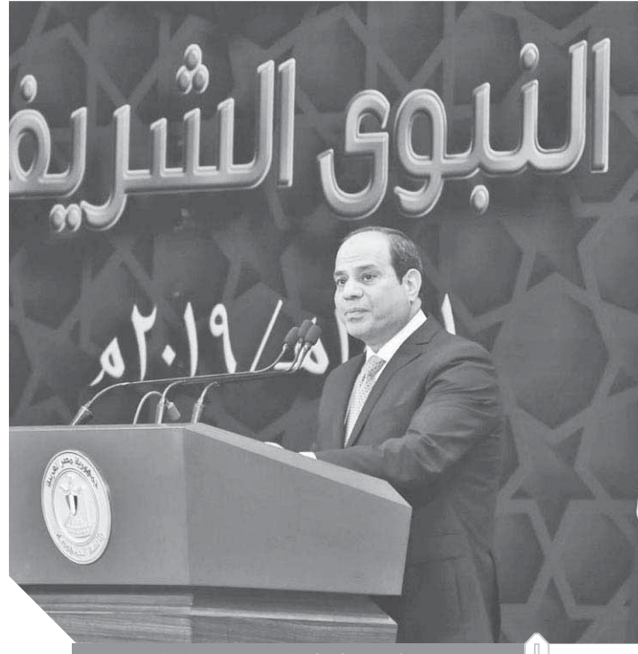
السياسي خلال حديثه في الاحتفال بالمولد النبوي

أكد الرئيس عبد الفتاح السيسي أنه يمتلك إرادة من حديد ولا تلين في مجابهة الإرهابيين، مشددا على أن التطرف والإرهاب والتشكيك والافتراء على الحق والتخريب والإرادة الحديدية عن المضي في طريقه نحو المستقبل الأفضل.. وقال السياسي: عندي إرادة لا تلين في مجابهتهم.. طبعاً ومن حديد، وأنا أواجه في إطار مواجهة لأجل خاطر الدين.. كل الدين، لأن ما حدث كان له تأثير سلبي على فكرة الأديان والاعتقاد في الله سبحانه وتعالى.. الناس تشككت إبه الأديان التي يتطلع تقتل وتدمر في الناس بالشكل ده..