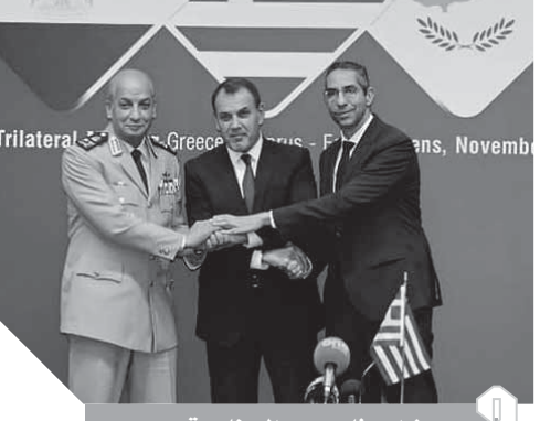
وزراء دفاع مصر واليونان وقبرص