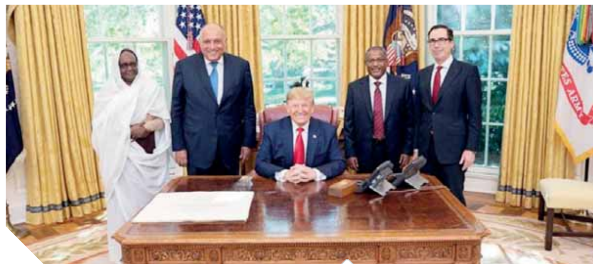
ترامب، خلال استقباله ممثل مصر والسودان وأثيوبيا

الذي اضطلع به الوفد الفني من قبل وزارة الخارجية ووزارة الموارد المائية والري في عقد سلسلة اجتماعات مكثفة لإطلاع دوائر الإدارة الأمريكية والبنك الدولي على مجمل الموقف الفني والقانوني المصري، وبما يؤكد على عدالته في إطار التسوية من قبل مؤسسات الدولة وما توليه من أولوية لهذا الملف الحيوي.