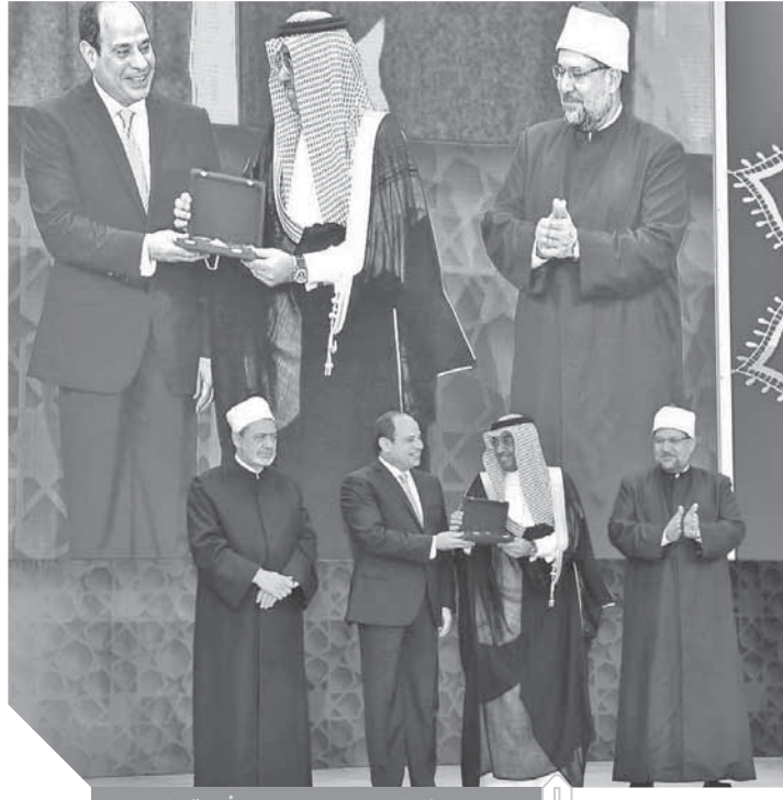
الرئيس خلال تكريمه عددا من الأئمة والدعاة