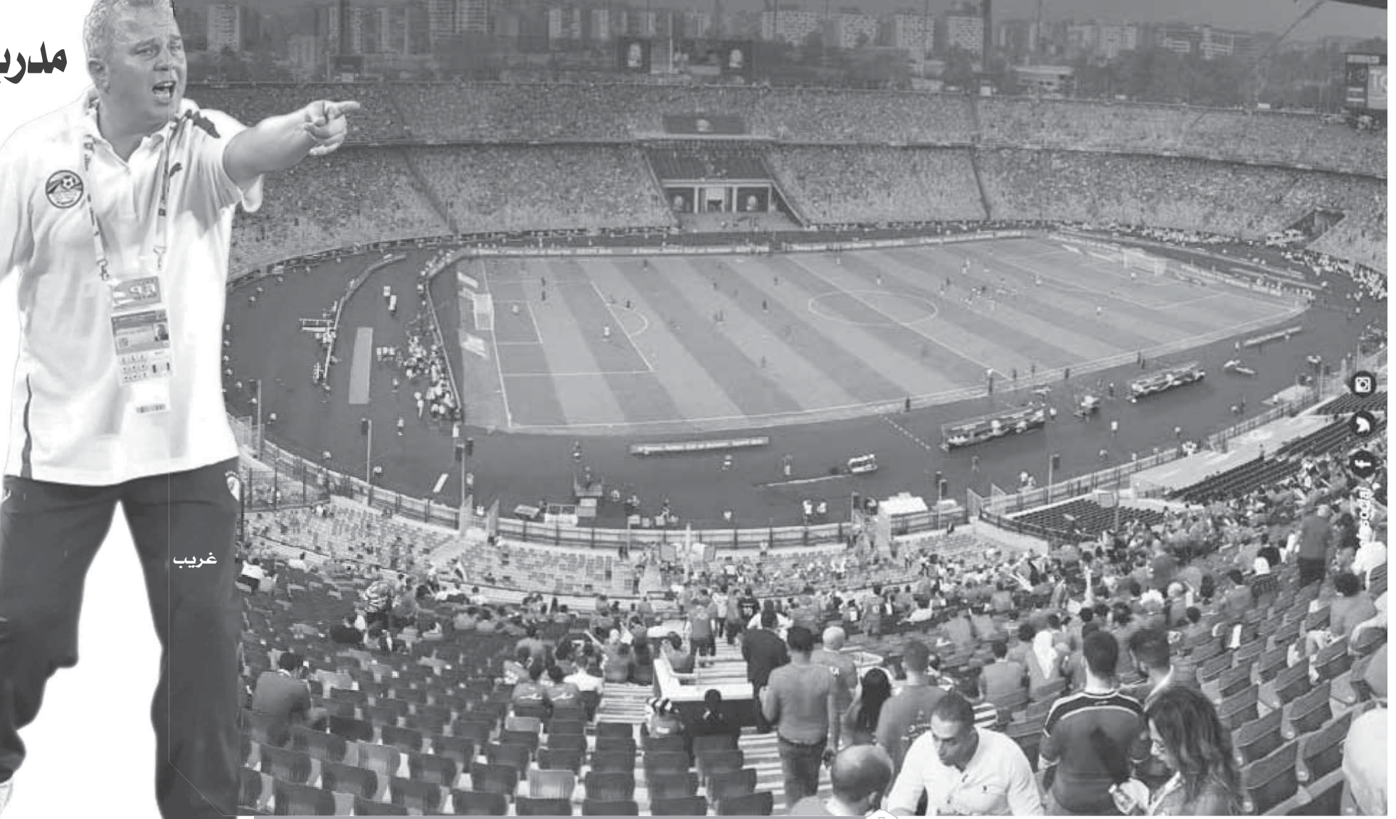
الجماهير متحمزة للاحتشاد بstad القاهرة