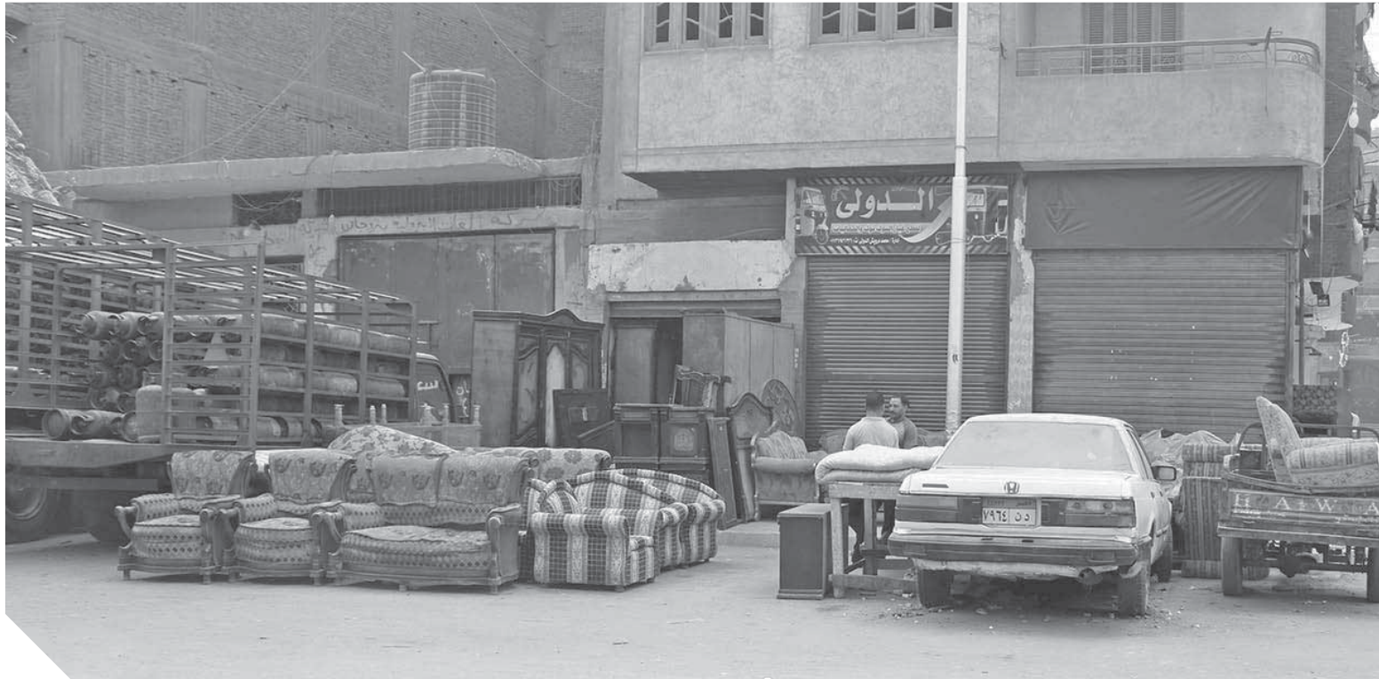
أحد المواطنين يستعلم عن أسعار الفرش المستعمل

٧ آلاف جنيه.. تلك هي القيمة التي يمكنك أن تبدأ بها فرش شقتك بالكامل، حتى تصل لـ ٣٠ ألفاً، ويرجع ذلك لنوع الفرش المُستعمل المعروض، ولكن هل سألت نفسك كيف يحيا «الصحايا» مع تلك المفروشات صحياً؟ لكونها مستخدمة من أناس لا نعلم هويتهم، وما الضمانات التي تتوافر لتأكد من مصدر الفرش المعروض إذا كان لصاحب المحل أو تم الحصول عليه