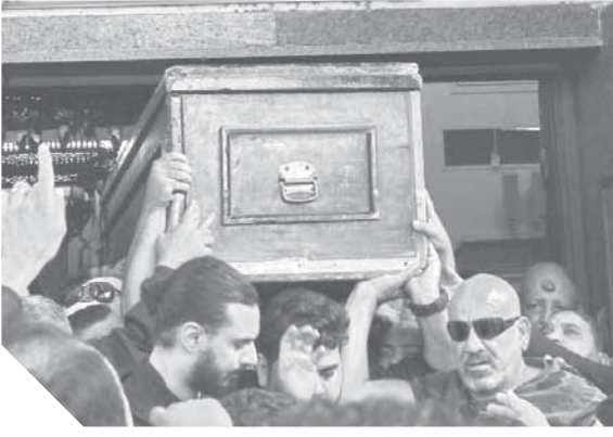
أشرف زكي ونجوم الفن يودعون هيثم أحمد زكي إلى مثواه الأخير