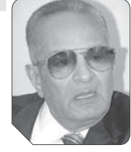
بهاء الدين أبو شققة