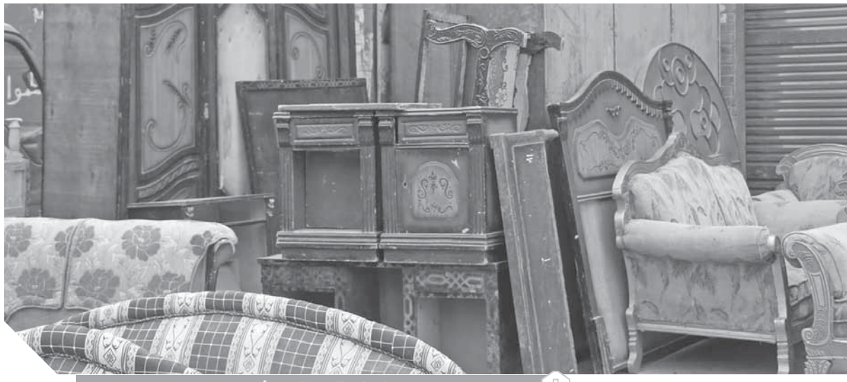
عش شقة كاملة بـ ٣٠ ألف جنيه

بترق غير مشروعة؟ داخل تلك الأسواق قصص وروايات لأسر كافحت على مدار سنوات طويلة