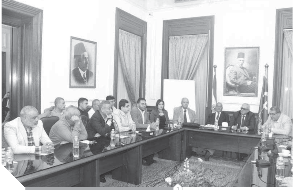
جانب من حضور الندوة