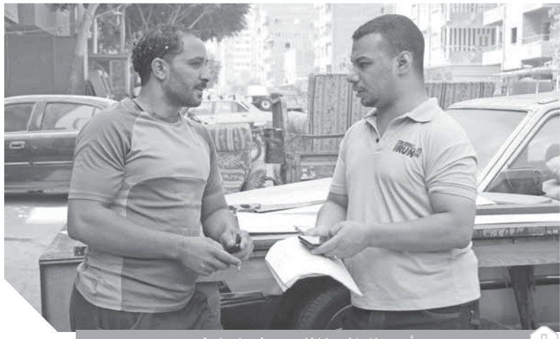
أحد الزبائن خلال حديثه لـ الوفد،

تحملوا والأغلى سعرا ولهذا نجد سعر حجرة النوم جنية، في حين يمكن للشباب تجهيز شقته بـ ٢٠ إلى ٣٠ ألف جنيه. وتابع: «طبعاً اللي بيشتري بياخد معاه الورق اللازم لضمان سلامة الفرش والتأكد من مصدره وأنه ليس مسروق أو مجهول الهوية»، مشيراً إلى أن ذلك الشرط من أهم حقوق المشتري والبائع حفاظاً على سمعته في المنطقة.