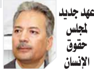
عهد جديد لمجلس حقوق الإنسان

مطلوب استراتيجية جديدة ينتهجها المجلس القومي لحقوق الإنسان لترجمتها برنامج عمل دقيق يتسلمهم جوهر الاستراتيجية الوطنية لحقوق الإنسان في ضوء ما تفرضه مركزية حقوق الإنسان في النظام العالمى.