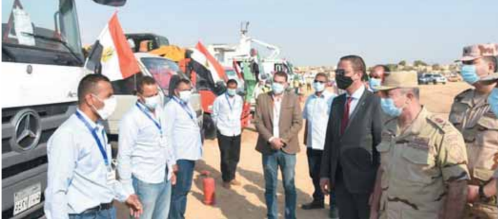
جانب من فعاليات قوات الدفاع الشعبى والعسكرى بمشاركة الشباب

كتب - محمد صلاح وأبو زيد كمال وسامية فاروق: نفذت قوات الدفاع الشعبى والعسكرى عددا من الفعاليات المميزة خلال شهر سبتمبر الماضى، حيث تم تنظيم مشروع إدارة الأزمات والكوارث لمخلفات الجيزة والبحر الأحمر والفيوم بكافة أجهزتها التنفيذية ومديريات الأمن للوقوف على مدى جاهزيتها واستعداداتها لمواجهة المواقف الطارئة وفرض بعض السيناريوهات الطارئة.