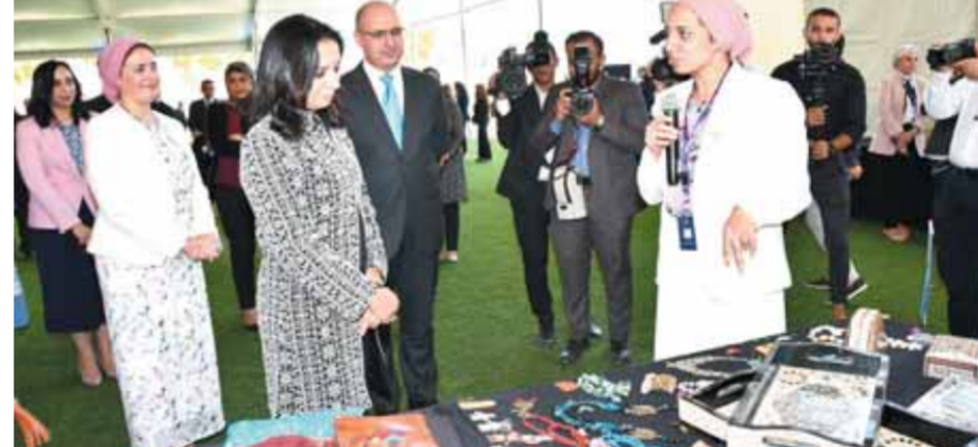
محاكاة لأحد المعارض التى تقوم بها زوجات الضباط بالتمثيل العسكرى بالخارج