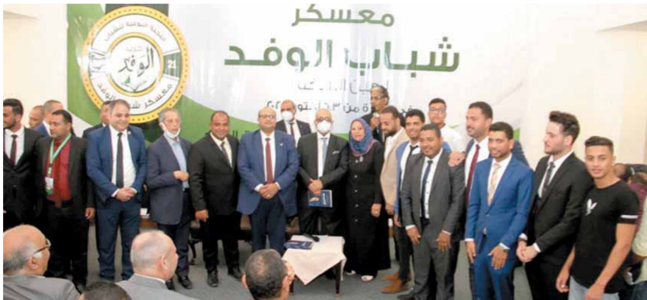
أبو شقة وقيادات الحزب مع شباب الوفد فى العين السخنة