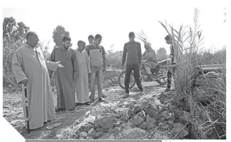
قرى وعزب المحلة أصبحت معزولة بعد انهيار الكوبري

يستطيع السير عليه في أمان ويانهياره أصبحنا نعاين يومياً من أزمة المواصلات.. كانت السيارات التي تمر على الطريق المتواجد داخل الزراعات تتأرجح ميمناً ويساراً، وكثيراً ما تتقابل سياراتنا وجهاً لوجه فيحدث الأزمة المزمنة للركاب نتيجة الاصطدام التي حدثت بين السيارتين.