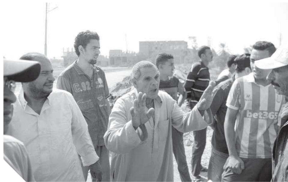
أهالي القرية خلال حديثهم لـ «الوفد»