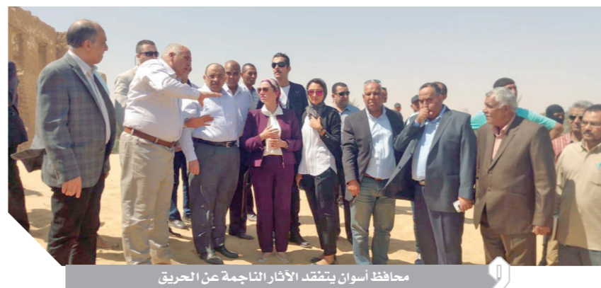
محافظ أسوان يتفقد الأضرار الناجمة عن الحريق

كتب - ترمين حسن وناصر فياض وعبد الرحيم أبوشامة ونغم هلال وأحمد الزيات: