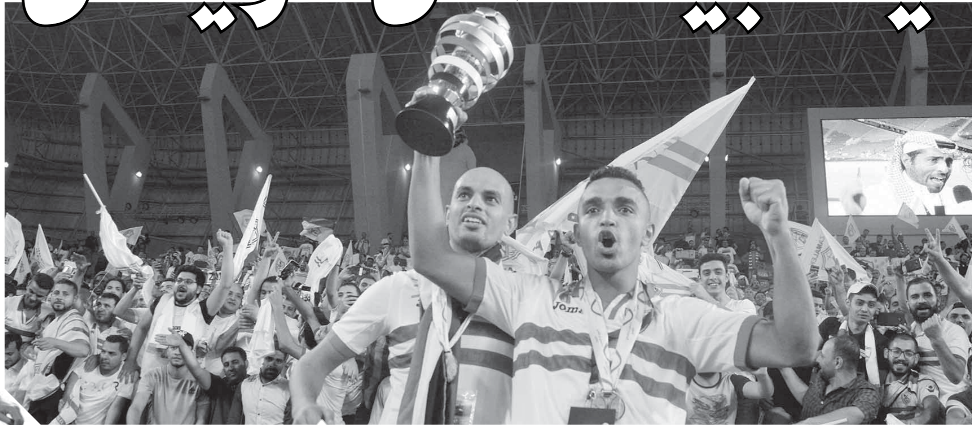
أوياما يرفع كأس السوبر