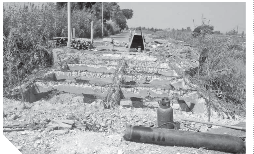
انهيار الكوبري يهدد حياة الأهالي