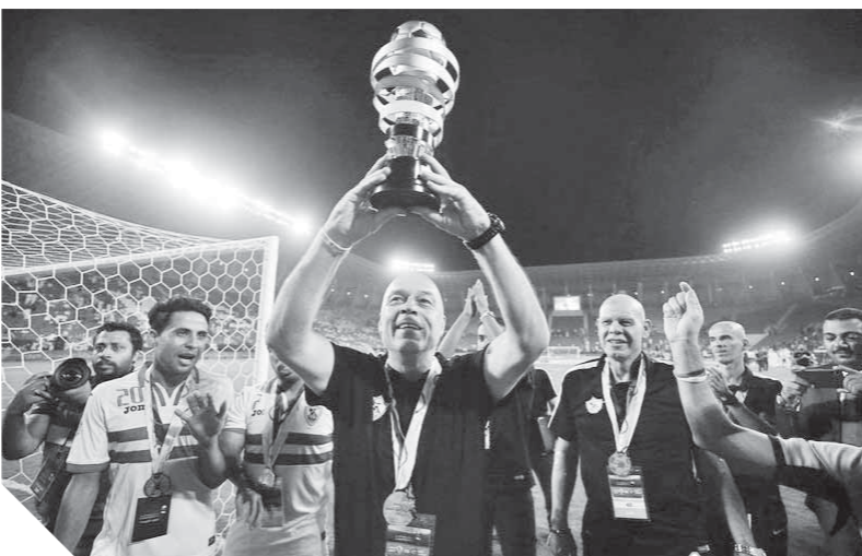
جروس يرفع كأس السوبر فرحاً بالفوز