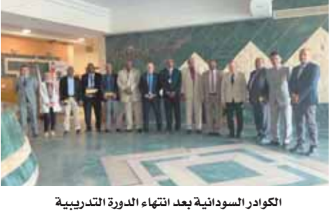
الكوادر السودانية بعد انتهاء الدورة التدريبية

كتب- أمانى سلامة: في إطار توجيهات وزير الطيران الطيار محمد منار أكد كابتن إيهاب محيي رئيس مجلس إدارة الشركة الوطنية لخدمات الملاحة الجوية والعضو المنتدب على بدء التعاون المصري ودول الجوار، حيث انتهت دورة تدريبية للكوادر السودانية على أنظمة المراقبة الجوية والتنسيق المدني العسكري بحضور المحقق العسكري لسيارة السودان لفعاليات الاحتفالية الختامية للمهمة الجوية التي أعقبها تسليم الشهادات للدارسين ويجدر الإشارة إلى أنه تم توقيع الاتفاق على عقد دورات تخصصية خلال الفتره الزمنية المقبلة بالشركة الوطنية لخدمات الملاحة الجوية.