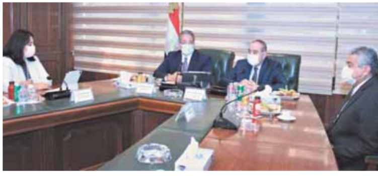
وزير الطيران والسياحة والتائبان خلال مناقشة حركة السياحة والطيران الداخلي

الجوية والسياحة لخدمة جميع شرائح المجتمع كما أكد وزير الطيران نائب وزير الطيران لاستيعاب الساخنين خاصة في ظل زيادة الحركة الجوية في الفترة الحالية، مع الاستمرار في منح تخفيضات وتحفيز شركات الطيران على رفع الهبوط والإيواء وعلى الخدمات الأرضية المقدمة وذلك تشجيعاً لحركة السياحة الوافدة إلى المدن السياحية المصرية. وخلال الاجتماع وجه الدكتور خالد المنانى وزير السياحة والآثار والشكر لوزير الطيران المدني متمماً على التعاون المستمر والتناغم الواضح بين وزارتي السياحة والآثار والطيران المدني لدعم خطط الدولة في تنشيط حركة السياحة والسفر وإطلاق المبادرات المشتركة التي تساهم في تحفيز حركة السياحة الدولية والداخلية خاصة في ظل الظروف الراهنة التي يشهدها القطاعين نتيجة لتدابعات أزمة فيروس كورونا على مرافقنا لاستيعاب الساخنين خاصة في ظل زيادة الحركة الجوية في الفترة الحالية، مع الاستمرار في منح تخفيضات وتحفيز شركات الطيران على رفع الهبوط والإيواء وعلى الخدمات الأرضية المقدمة وذلك تشجيعاً لحركة السياحة الوافدة إلى المدن السياحية المصرية. وخلال الاجتماع وجه الدكتور خالد المنانى وزير السياحة والآثار والشكر لوزير الطيران المدني متمماً على التعاون المستمر والتناغم الواضح بين وزارتي السياحة والآثار والطيران المدني لدعم خطط الدولة في تنشيط حركة السياحة والسفر وإطلاق المبادرات المشتركة التي تساهم في تحفيز حركة السياحة الدولية والداخلية خاصة في ظل الظروف الراهنة التي يشهدها القطاعين نتيجة لتدابعات أزمة فيروس كورونا.