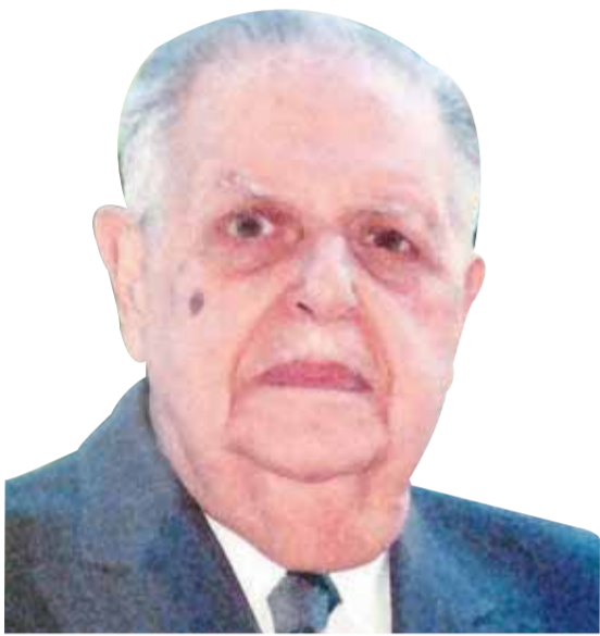
فؤاد سراج الدين