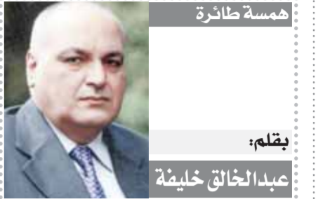
بقلم: عبد الخالق خليفة