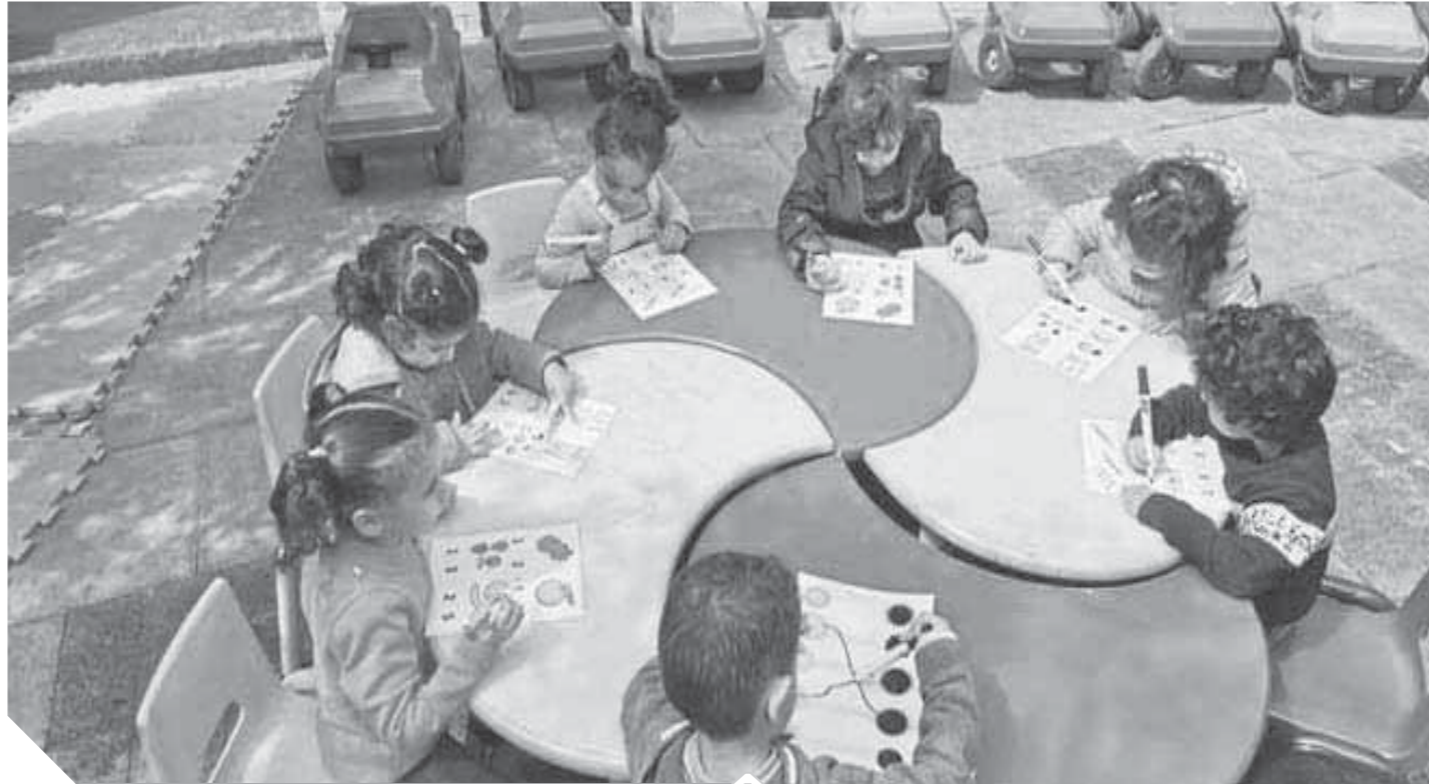
مطالب بعودة الحضانات في زمن الكورونا