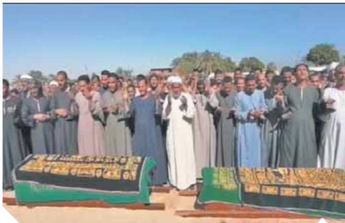
صلاة الجنازة على شهيدى الغربية فى مسقط رأسهما بنجع حمادى