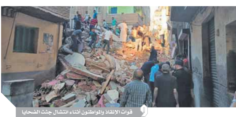
قوات الإنقاذ والوطنيون أثناء انتشال جثث الضحايا

لكل ضحية من أفراد الأسرة وألف جنيه له كل مصاب، ووجه المحافظ وكالة وزارة التضامن بعمل حصر بالمصابين والمتوفين والخسائر المادية، قامت لجنة الإغاثة بالتضامن الاجتماعي بعمل حصر بالأسر المتضررة بالمنزل المجاورة للعقار المنكوب وعددها ٧ أسر. انتقل فريق من أعضاء النيابة العامة لمسرح الحادث للمعانة وجرى مناظرة جسامين الضحايا واطلعت النيابة على ملف العقار وقرارات الترخيص والترميم، كما جرى حصر المتضررين وسؤال الشهود عن الواقعة وقررت النيابة تشكيل لجنة من جهاز التفتيش الفني على أعمال البناء التابع لوزارة الإسكان بهدف فحص العقار للوقوف على أسباب انهياره.