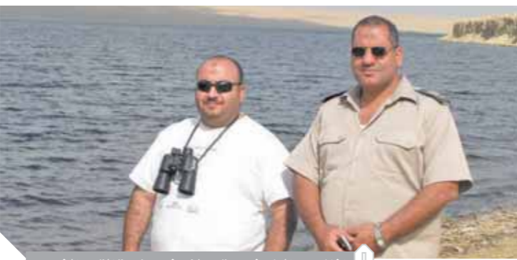
اشان من الباحثين يتجولان فى جزيرة القرن الذهبى

الفترة غير المسموح بها. كما أن الجزيرة مدرجة على قوائم اتفاقية «رامسار»، كموقع هام للطيور، ويتم من خلالها دراسة حركة وتطور الطيور، إضافة إلى كونها من المناطق الجيولوجية المهمة التي تزرد وجود الحيتان في بحر «القديم» والجزيرة كما يقول الدكتور نبيل حنظل الخبير السياحي بالفيوم كانت مقصداً للملك فاروق، كاستراحة ومكان لممارسة رياضة صيد الطيور المهاجرة، والغزلان البرية في إجازاته الشتوية، ويوجد بقايا جدران من الطوب اللبن للاستراحة الملكية فى الجزيرة، وأضاف، أنه جرت محاولات لاستغلال الجزيرة سياحياً منذ الثمانينات، إلا أنها لم تزل النور، كانت إحداهما مقدمة من بنك أمريكي، تعتمد على الحفاظ على طوغرافية الجزيرة، وتستخدم السيارات الكهربية الصغيرة للتنقلات، مع إنشاء فندق بيئى على الساحل الجنوبى الشرقى، ونشر مجموعة من الشاليهات حول شواطئها لكل منها طابعها على أن تكون من مقدمتها مركز للزوار، ومركز لاستقبال، ومتحف طبيعى، وبحرى، ومطار هليكوبتر فى المنتصف، ومرسى للطائرات البرمائية واليخوت..