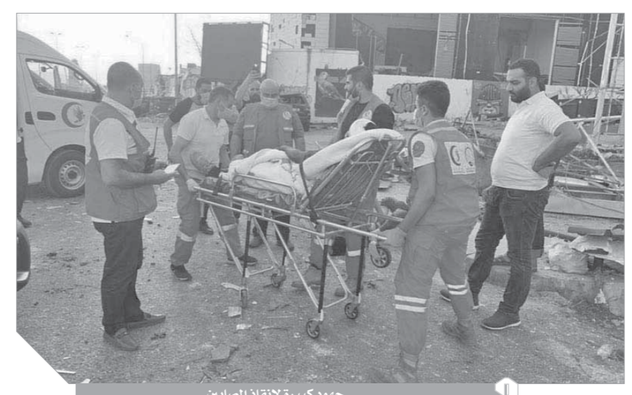
جهود كبيرة لإفاد المصابين

وأن يمن على المصابين بالشفاء العاجل، وأن يحفظ لبنان من كل مكروه». وأكدت الوزارة «وقوف المملكة التام وتضامنها مع الشعب اللبناني الشقيق».