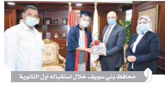
محافظ بنى سويف خلال استقباله أول الثانوية