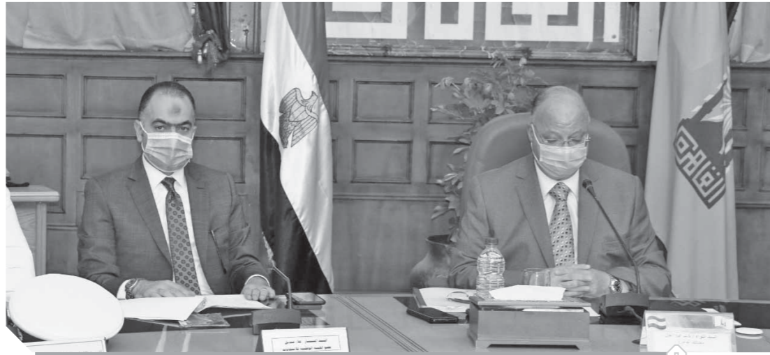
اللواء خالد عبدالعال محافظ القاهرة والى جواره المستشار علاء قنديل عضو الهيئة الوطنية للانتخابات