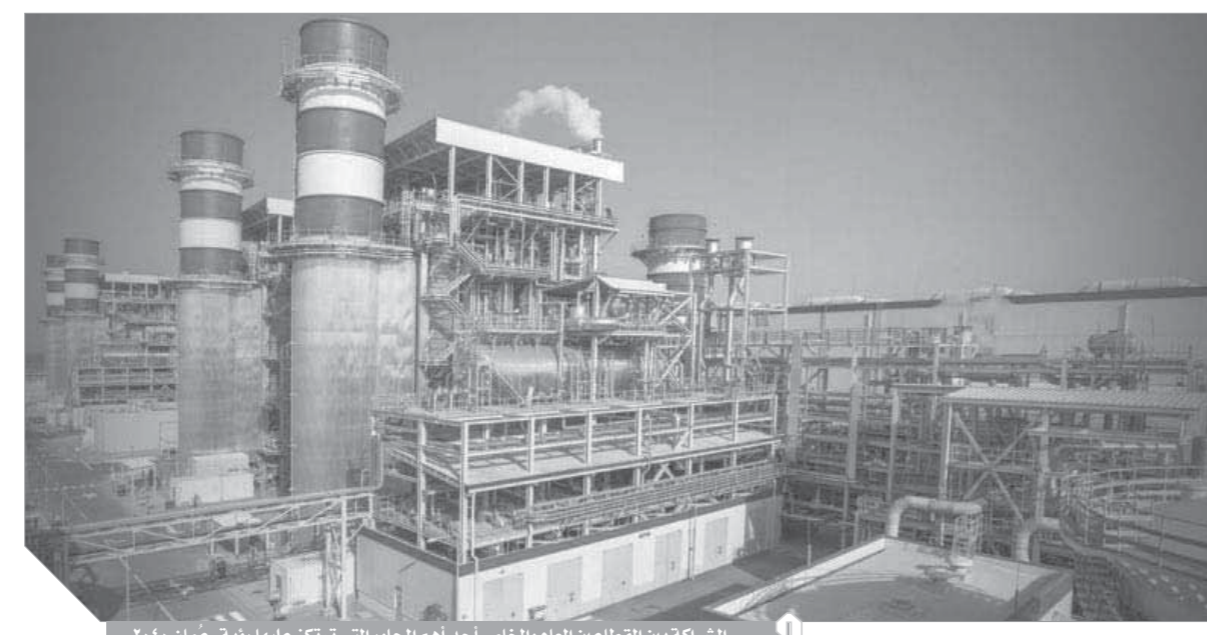
الشراكة بين القطاعين العام والخاص أحد المحاور التي تركز عليها رؤية عمان ٢٠٤٠.

إلى حوالي ٢,٥ مليار ريال عماني (٦,٥ مليار دولار) مع نهاية الخطة الخمسية التاسعة العام الجاري، فيما تقوم الهيئة العامة للتخصيص والشراكة بالسلطنة بدراسة مبادرات عديدة لمشروعات الشراكة تمهيداً لطرحها على القطاع الخاص.. وهذه المشروعات التشاركية تؤكد اهتمام الحكومة بالعمل مع القطاع الخاص، وتقنها الكاملة بقدرة هذا القطاع على الأخذ بزمام المبادرة لقيادة جهود التنويع الاقتصادي لتحقيق الزيادة في النمو الاقتصادي، وتعزيز القدرة التنافسية للاقتصاد العُماني.