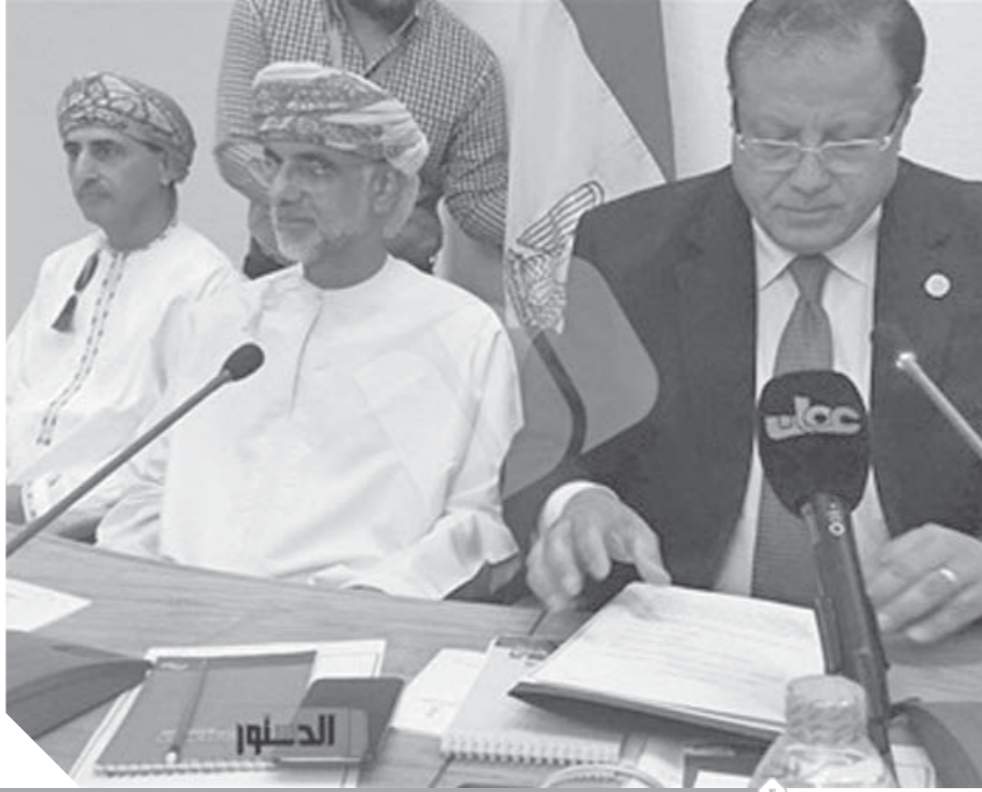
مشاهد من الفعالية المصرية العمالية التي شهدتها السفارة المصرية بالقاهرة على يد أحمد العيساني سفير سلطنة عمان وحضرها لثيف كبير ضم نخبة من قيادات الثقافة في البلدين ومن المثقفين والادباء والمفكرين والباحثين

يتواصل في سلطنة عمان إقبال كبير ومتزايد من جانب مجموعات كبيرة من المبدعين والمثقفين في جميع الدول الخليجية والعربية على الترشح لجائزة السلطان قابوس للثقافة والفنون والآداب - ٢٠١٩ التي تخصص هذا العام للمبدعين العرب في مجالات ثلاثة: «علم الاجتماع، والطرب العربي، وأدب الرحلات». وقد تم الإعلان عن آخر موعد لتلقي الترشيحات للدورة الحالية وهو يوم ١٥ من شهر أغسطس المقبل.