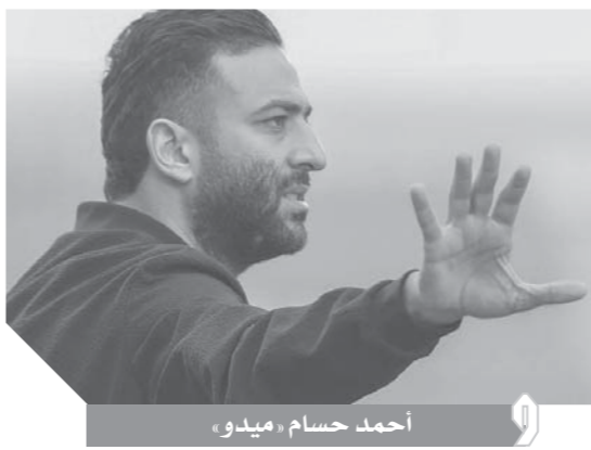
أحمد حسام ميدو.

والسادس بجدول الدوري. واستقرت إدارة النادي على بداية من يوم ١٨ يونية الجارى بعد تعيين المدير الفنى الجديد.