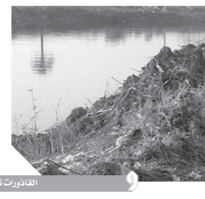
القاذورات تغطي مصرف بحر البقر

الأبدى تجاه ذلك وتناست رش المصرف بالمبيدات الحشرية التي تمنع انتشار الحشرات وقتلها من منبعها الحقيقي، مثلما كانت تفعل الحكومات السابقة من حين إلى آخر. هذا ويعانى أهالي مركز قافوس بمحافظة الشرقية من مصرف بحر البقر.. وأبرز القرى التي تعاني قرى: «الطويلة، والصوالمج، ومنزل نعيم، وبنى صالح، والنمروط، والهيمصية، والجعفرية، والخطارة الصغرى، والخطارة الكبرى، ورياض خليفة، والعريفات، والمراحة والروضة، والكثير من العزب» هي مقربة من مصرف بحر البقر مصدر التلوث.