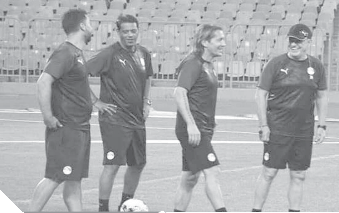
أجبرى مع جهازه المعاون خلال المران