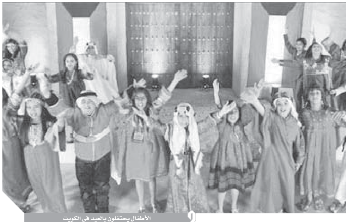
الأطفال يحتفلون بالعيد في الكويت

وكما فرض الصيام خلال شهر رمضان، فإنه قد حرم أثناء العيد، لذلك سيحتفل الجميع بتناول الولائم والمأدب.