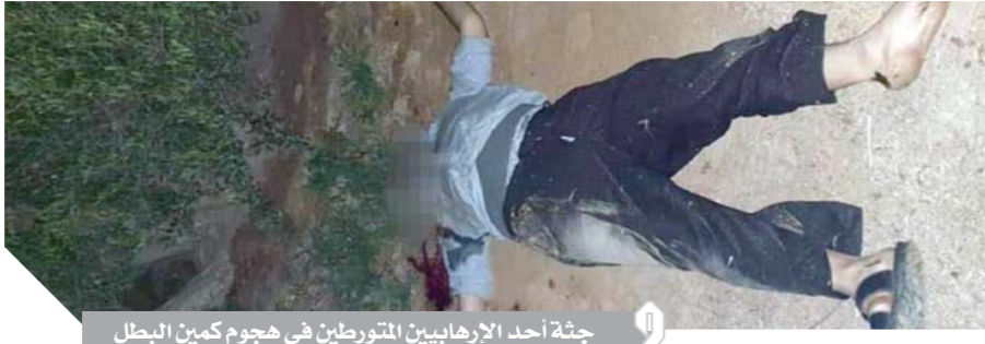
جثة أحد الإرهابيين المتورطين في هجوم كمين البطل

وأثناء محاصرتهم أطلقوا النيران بصورة مكثفة تجاه القوات، فتم التعامل معهم، مما أسفر عن مصرع ٨ عناصر عثر بحوزتهم على عدد «٥» بنادق آلية، عبوة متفجرة، ٢٠، حزام ناسف.. ويأتي ذلك استمراراً لجهود وزارة الداخلية في ملاحقة وتبع العناصر الإرهابية المتورطة في مهاجمة أحد الأكنة الأمنية بجنوب العريش فجر يوم ٥ يونيو الجاري. وتم اتخاذ الإجراءات القانونية اللازمة، وتولى نيابة أمن الدولة العليا التحقيق.