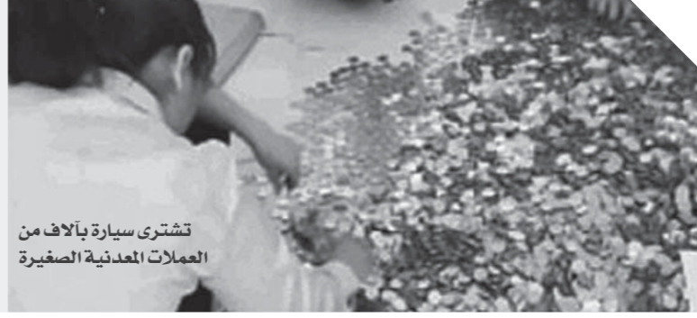
تشتري سيارة بألاف من العملات المعدنية الصغيرة

لو أنك صاحب معرض سيارات أو حتى تشتغل في المعرض موظف، ودخلت عليك ست مسنة، وطلبت منك ات وزملايك تساعدها في حمل كيساً كبيراً مليئاً بعملات معدنية فئات صغيرة، وأخبرتك بكل احترام وهدوء بأن الأكياس دي بها ثمن سيارة كانت تحلم بشراحتها طول العمر، ماذا سيكون رد فعلك، هذا ما فعلته تماماً سيدة صينية، وتسببت في حالة من الدهشة والإتباك، عندما دخلت