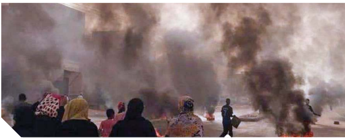
محاولات التفاوض مستمرة رغم معارضة قوى المعارضة

نقاش هادئ في القاهرة. ودعا «حجازي» الأمين العام للجامعة الدول العربية أحمد أبو الغيط إلى الانتقال إلى الخرطوم والالتقاء بطرفي المعادلة حتى يمكن للجامعة أن تستضيف حواراً بناءً في القاهرة تحت رعاية عربية، بما يقود إلى انفراجة في الموقف وتحديد مسار لخريطة طريق لحل الأزمة.