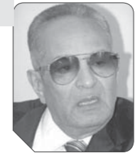
بهاء الدين أبوشقة