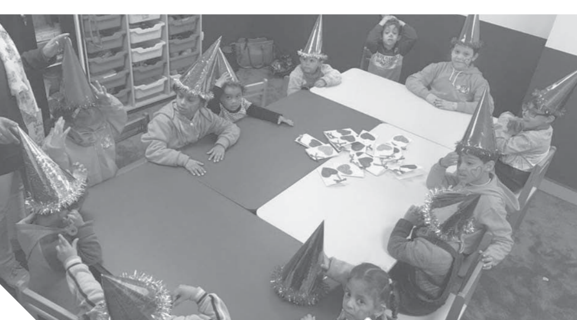
أطفال داخل مراكز للتأهيل على التخاطب

ونوهت بأنها تعاملت مع العديد من ذوي الاحتياجات الخاصة «الصم والبكم»، وتعرفت على أكثر المشاكل التي تواجههم من أجل تقاديبها أثناء تربيته لابنتها، مشيرة إلى أن أصعب شيء يمكن أن يتعرض له الصم والبكم، هو التعامل مع الموظفين والسئولين في المؤسسات الحكومية، حيث يصعب فهمهم، فضلاً عن أن الموظف لا يستطيع التعامل معهم ويتجاهلهم لعدم فهم حديثه، وسردت أحد المواقف التي تعرض لها