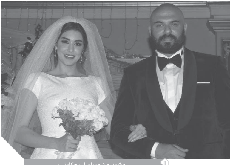
مشهد من مسلسل «حكاييتي»

رغم عدم مساهماتي لأي فيلم لأننا كنا في «البرومو» للأفلام أننا دخلنا مرحلة الإنتاج الضخم والموضوعات الجادة والشيء هذا ما كنا نتمناه لكن على مستوى الضموم تنتظر المشاهد والتمثيل في أي نجاح يعود للجمهور من المقام الأول. ونتمنى أن تتناح السينما والدراما كقوة ناعمة لصالح الوطن والمواطن ليتناح معها الجمهور ويشعر بدورها الغائب منذ فترة!