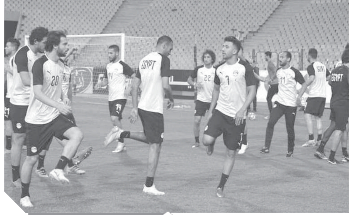
جانب من تدريبات المنتخب الوطنى