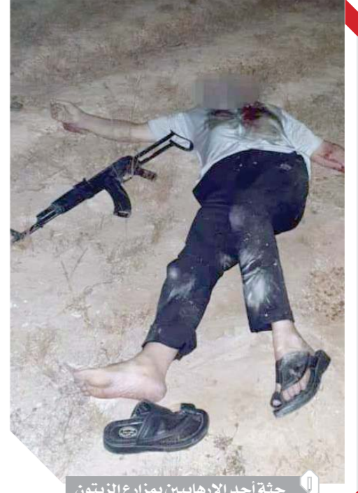
جثة أحد الإرهابيين بمزارع الزيتون

أعلنت وزارة الداخلية، أمس الجمعة، القضاء على ٨ عناصر إرهابية من المتورطين في الهجوم على كمين البطل بالعريش، أمس الأول أثناء اختيائهم داخل إحدى مزارع الزيتون بالطهير الصحراوي بمنطقة العيون بجنوب العريش. وقالت الداخلية، في بيان لها، «توافرت معلومات حول اختباء مجموعة من العناصر الإرهابية داخل مزرعة زيتون بالطهير الصحراوي بمنطقة العيون جنوب العريش».