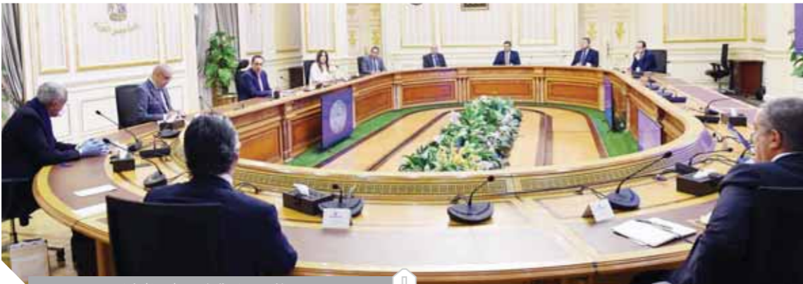
جانب من اجتماع مجلس الوزراء

التى تلجأ لها المنظمة، مشدد على التزام المنظمة بضمان تقاسم الأدوية واللقاحات، بمجرد تطويرها، على نحو عادل مع جميع البلدان والشعوب. وشدد في بيان له، على ان المعركة ضد الفيروس أصبحت أكثر مع ظهور الفيروس في بلدان مثل سوريا وليبيا واليمن، والتي تعاني من النزاع، بجانب نظم صحية ضعيفة. وقال انه في اليمن، توجد أسوأ كارثة إنسانية في العالم، حيث يعتمد أكثر من ١٢ مليون شخص شهرياً على المساعدات الغذائية، ويحتاج ٢,٥ مليون طفل دون الخامسة إلى الدعم الغذائي، ويحتاج ٨,٨ مليون شخص إلى الرعاية الصحية، مما يجعلهم أكثر عرضة للإصابة بالأمراض المعدية، مثل مرض كوفيد-١٩، بسبب ضعف جهاز المناعة.