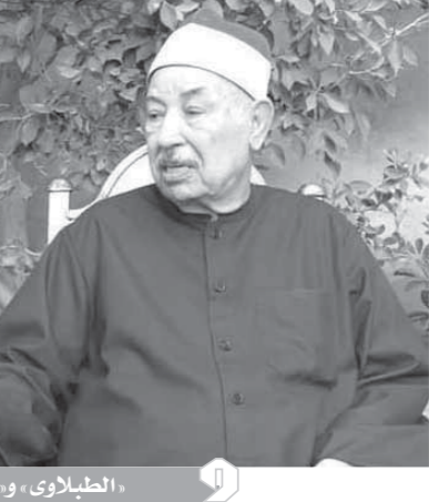
«الطيبلاوى»، والطاروطى، عمان فى عالم التلاوة