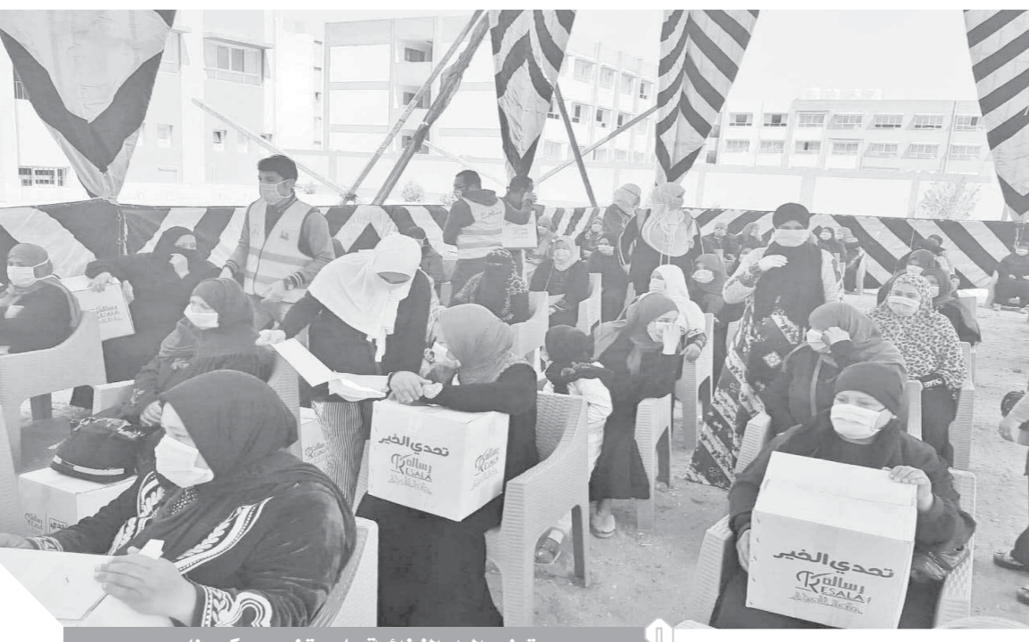
توزيع المواد الغذائية على متضرري «كورونا»

وفي محاولة لتخفيف العبء عن كاهل محدودي الدخل، طرحت وزارة التموين هذا العام كرتونة رمضان بأسعار تتراوح من ٨٠ إلى ٨٠٠ جنيهات، وتضم جميع السلع الأساسية من السكر والارز، الأرز، المكرونة والسمن، والثاني بالمجمعات الاستهلاكية هذا فضلاً عن السيارات المتقلة التي تجوب المحافظات وما يقرب من ٣٥ ألف مفند تمويني وهم بقاوا التموين، وفروع مشروع جمعيتي والمجمعات الاستهلاكية، وتحتوي الكرتونة الصغيرة بسعر ٨٠ جنيه على كيلو سكر ولتر زيت خليط وكيلو أرز، وعلبة سمن زنة ٨٠٠ جرام، وعلبة صلصة زنة ٣٠٠ جرام، وعدد ٢ كيس مكرونة زنة الواحد ٥٠٠ جرام، وعلبة فول وعلبة ملح، أما كرتونة كيلو سكر ولتر زيت خليط وكيلو أرز، على مسلي صناعي زنة ٨٠٠ جرام، وعلبة صلصة زنة ٣٠٠ جرام وعدد ٢ كيس مكرونة زنة الواحد ٥٠٠ كيلو فول، وعلبة ملح، وهناك كرتونة الكرتونة وكيلو بلح و عدد باكو شاي زنة الواحد ٤٠ جرام، وكيس عدس زنة ٥٠٠ جرام، وتتنوعت أسعار كرتونة رمضان في السلاسل التجارية، والتي بدأت من ٥٠ جنيهًا للكرتونة، فهناك كرتونة الخير التي تحتوي على العديد من الأصناف، وذلك بسعر ٥٠٠ جنيه فقط، وتتكون من كيلو أرز، و٢ كيس مكرونة وزن ٣٥٠ جرام، وزجاجة زيت ٧٠٠ جرام، باكو شاي ٤٠ كيلو سكر و٢ كيس ملح، وهناك كرتونة التفوير كرتونة رمضان بسعر ٧٥٠ جنيه، وتحتوي على كيلو أرز، و٢ كيس مكرونة زنة ٣٥٠ جرام، كيلو سكر و٢ كيلو بلح، وزجاجة زيت خليط ٧٠٠ جرام، وعلبة سمن ٧٥٠ جرام، كيلو سكر، كيلو بلح، برطمان صلصة، ٥٠٠ جرام فول، وباكو شاي، برطمان ملح أما كرتونة البركة فيصل سعرها إلى ١٢٥٠ جنيه، وتحتوي على ٢ كيلو أرز، ٢ كيلو مكرونة، ٢ كيلو سكر، كيلو بلح، وزجاجة زيت ٧٠٠ جرام، وعلبة سمن ٣٥٠ جرام، ونصف كيلو عدس ونصف كيلو لوبيا، ونصف كيلو فول و٢ كيس ملح.