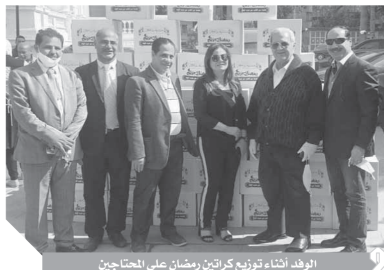
الوفد أثناء توزيع كراتين رمضان على المحتاجين

بعد توجيهات الرئيس عبدالفتاح السيسي بالاهتمام بالعمالة غير المنتظمة، والتي من الممكن أن تتضرر نتيجة إجراءات الحد من انتشار فيروس كورونا، قامت وزارة القوى العاملة بصرف ٥٠٠ جنيه لكل عامل كمكسبة لرفع العبه عن كاهلهم، ومنذ الإعلان عن تلك الإجراءات انطلقت العديد من المبادرات لمساندة المحتاجين والمتضررين من أزمة كورونا.