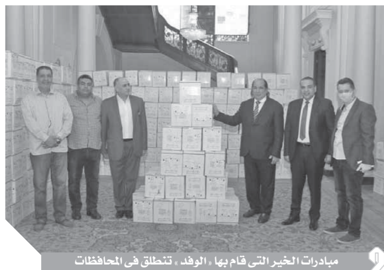
مبادرات الخير التي قام بها «الوفد» تتلطف في المحافظات