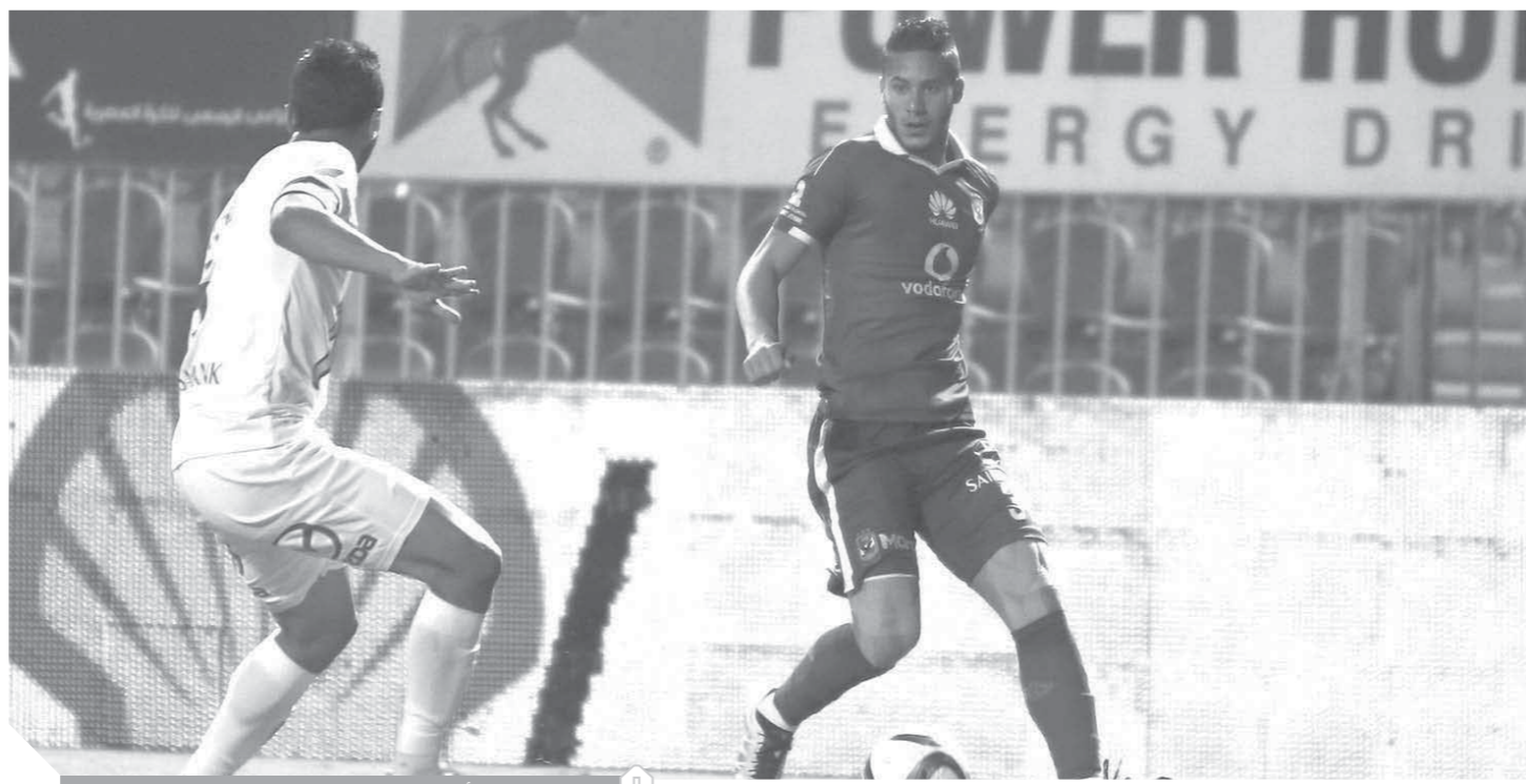
مهمة الأهلي صعبة في بقاء رمضان صبحي