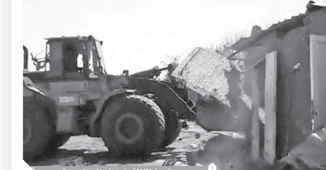
جانب من الزلازل على أرضي المدن الجديدة