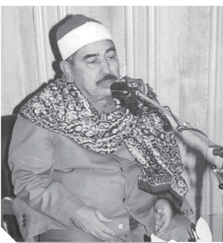
«الطيبلاوى»، آخر جيل عملاقة التلاوة