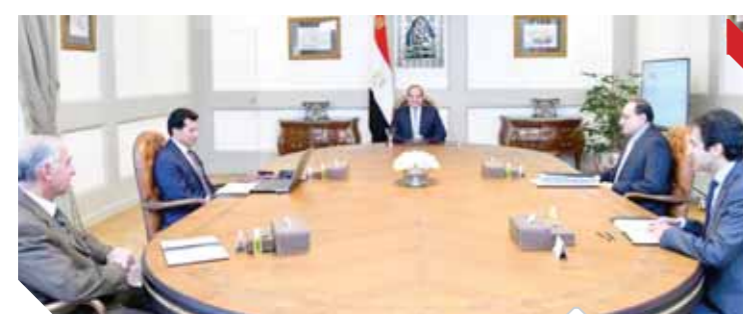
الرئيس السيسى خلال اجتماعه مع وزير الشباب