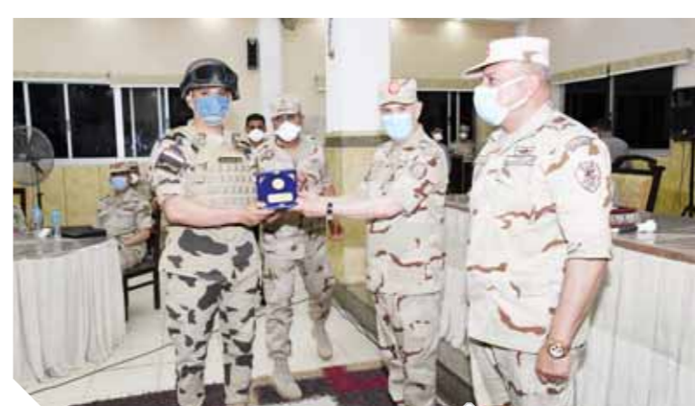
رئيس الأركان مع مقاتلي مكافحة الإرهاب

وأدار حواراً مع القادة والضباط وضباط الصف والجنود استمع فيه لأرائهم واستفساراتهم وناقشهم في كل ما يدور بأذهانهم في مختلف المجالات لتوحيد المفاهيم تجاه مختلف الموضوعات والقضايا في ظل قيام القوات المسلحة في معاونة أجهزة الدولة لمجابهة انتشار فيروس كورونا، كما قام بتكريم عدد من المتميزين من تدير لأدائهم لمهامهم بشان وإخلاص خلال الفترة الماضية.