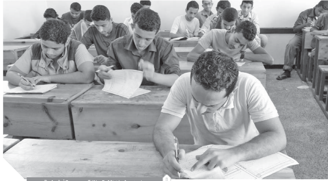
إحدى لجان الامتحانات ... صورة أرشيفية