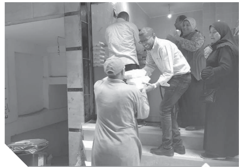
توزيع الشنط على الفقراء والمحتاجين