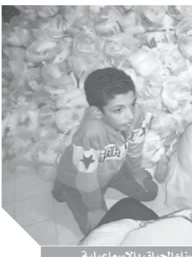
أطفال الخير بجمعية صناع الحياة، بالإسماعيلية