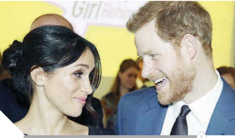
الأمير هاري وزوجته