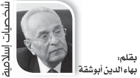
بقلم: بهاء الدين أبوشقة