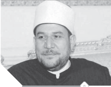
د. مختار جمعة