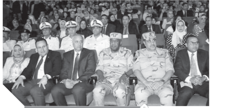
قيادات قوات الدفاع الشعبى أثناء الندوة

دفع عجلة التنمية وتقديم الدعم لقطاعات الإزهاق الأثم، موضحين بأرواحهم فى مواجهة سبيل الدفاع عن الوطن. والقى قائد قوات الدفاع الشعبى والعسكرى محاضرة عن الأعمال القتالية البطولية للقوات المسلحة فى القضاء على الإزهاق، كذلك دور القوات المسلحة فى