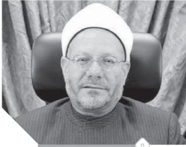
د. شوقي علام