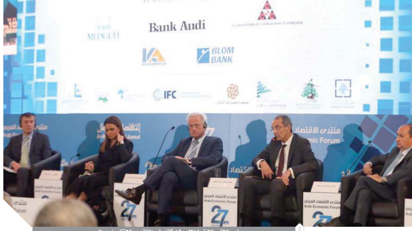
وزير الاتصالات خلال مشاركته في المنتدى الاقتصادي العربي