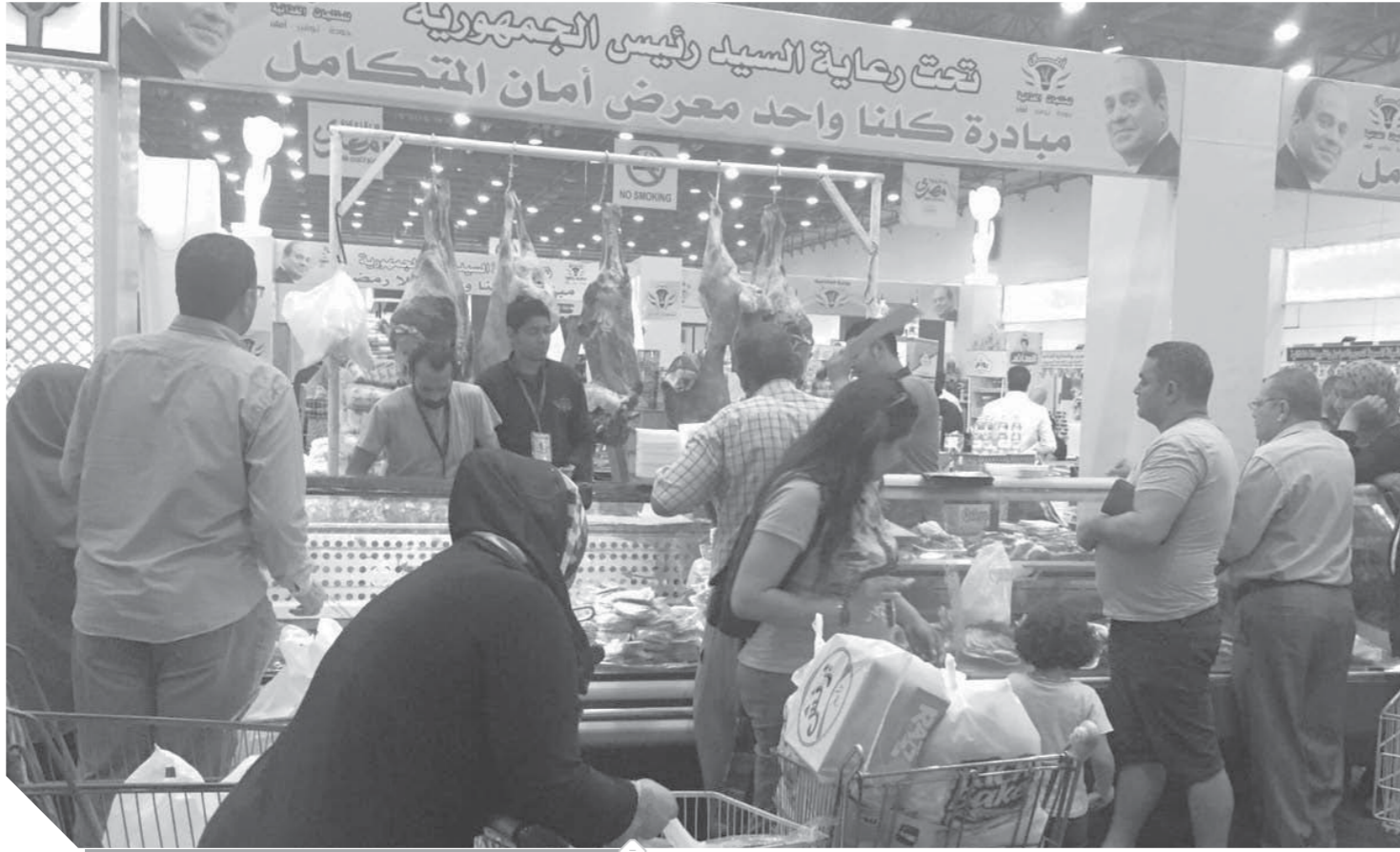
إقبال كبير على شراء سمن رمضان

رمضان شهر الخير والعطاء.. فكل صور التكافل تتجلى خلال الأيام المباركة التي تكتسب في مصر طابعا خاصا جدا، لتنشط مجموعات تخصص وقتها وجهدها ومالها لمساعدة كل محتاج، فضلا عن المبادرات الفردية. وتعتبر شنطة رمضان، أحد أهم صور التكافل في رمضان، ورغم أن الإعداد لها يسبق الشهر الكريم بأسابيع.. إلا أنها تستمر طوال الشهر حتى يكون الخير موصولاً.. الجديد في شنطة رمضان هذا العام أنها وجدت دعماً غير مسبوق، خاصة من الشباب وحتى الأطفال، أفكار جديدة أيضاً تتغلغل على شكل المساعدة المباشرة المعتادة وأكياس السكر والأرز وعلب الزيت والسمن، فهناك اللحوم والدجاج والحلوى، وقبل كل ذلك هناك الحرص على دوام العطاء اليومي، فلا يقتصر التوزيع في مستهل شهر رمضان فقط بل يشكل يوماً وحتى العيد، وبعض المجموعات الخيرية تحرص على وضع خطة لدوام هذا العمل التكافلي حتى بعد رمضان، صفحات الفيس بوك أصبحت شريكا أساسيا في فعل الخير عن طريق تشجيع الداعمين والمشاركين وتوصيل كل المحتاجين في كل أنحاء مصر.