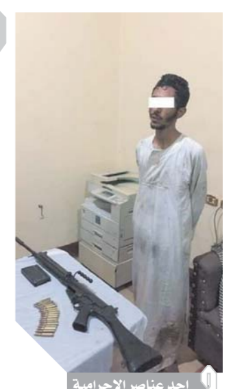
أحد عناصر الإجرامية

كتب - محمد عبدالفتاح: فى إطار جهود الأجهزة الأمنية المتواصلة لرصد وضبط أحد العناصر الإجرامية شديدة الخطورة (سبق اتهامه فى ٢٤ قضية «قتل، سرور فى قتل، خطف، مقاومة سلطات، سلاح، مخدرات، ومطلوب ضبطه وإحضاره فى ٤ قضايا «سرور فى قتل، مخدرات، إطلاق أعيرة نارية» مقيم بقرية الحسينات دائرة مركز أبوتشت).. سبق قيامه بإطلاق أعيرة نارية بصورة عشوائية بقرية الحسينات محل سكنه بدائرة مركز أبوتشت بغرض استعراض القوة.. وقيامه فى وقت لاحق بالتشاجر مع آخر «محدد» نتج عنها إصابة ربهى منزل ومزارع بأعيرة نارية حال تدخلهم لنفض المشاجرة، تم وضع خطة بحث بمشاركة قطاع الأمن العام وإدارة البحث الجنائى بقنا لاستهداف العنصر المذكور وضبطه.. حيث وردت معلومات تفيد باختبائه وأربعة عناصر إجرامية آخرين شديدي الخطورة بالمنطقة الزراعية بزمام قرية الحسينات دائرة المركز..