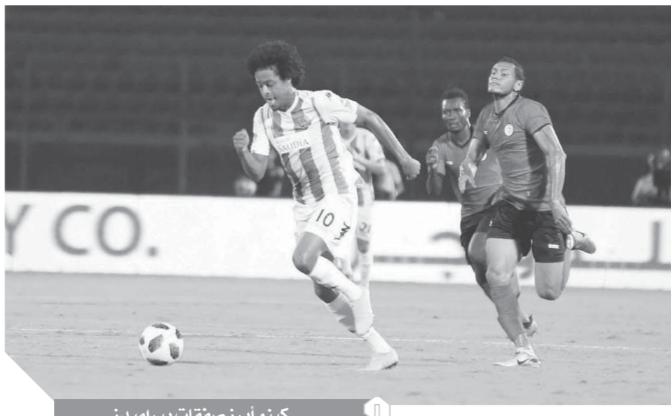
كينو أبرز صفقات بيراميدز

فالرئيس يواجه الناس بالحقيقة حتى لو كانت مرة.. ولم يتردد أثناء الاحتفال بعيد العمال بالحديث عن الشركات والهيئات الخاسرة كالتفيل العام.. وقالها بكل صراحة لماذا فشل النقل العام بينما نجحت شركة أوبر؟! فالرئيس عبدالفتاح السيسى خاطب العمال فى عيدهم بكل صراحة، وكشف عن فشل بعض القطاعات، لعدم الجدية وسوء الإدارة، مؤكداً أن كلنا مع بعض السبب فى الفشل والنجاح. ومن أهم ما ذكره الرئيس هو ضرورة تغيير ثقافة التعليم وتجهيز الأبناء لمطالب سوق العمل.. وذلك القضية فى غاية الأهمية، لأن التوسع فى الكليات النظرية يؤدي لتخريج ملايين من البشر غير مؤهلين لسوق العمل.. وكنت قد كتبت فى مقالى السابق عن الشركات الخاسرة.. وأهمية التعليم الفنى.. أى قبل خطاب الرئيس بيوم واحد.. فاحسنت أن أفكارى على نهج وخطى الرئيس.