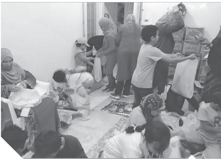
جمعية صناع الحياة يجهزون شنط رمضان للمحتاجين