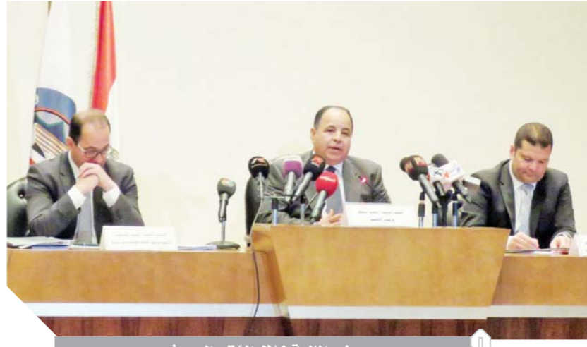
وزير المالية خلال المؤتمر الصحفي

٦,٣٥٪ مليار جنيه فائض أولي.. وتراجع العجز الكلي إلى ٤,٥٪ خلال ٩ أشهر