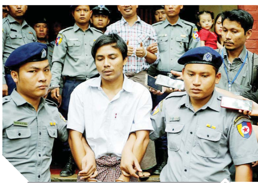
لحظة الإفراج عن صحفيي «رويترز»