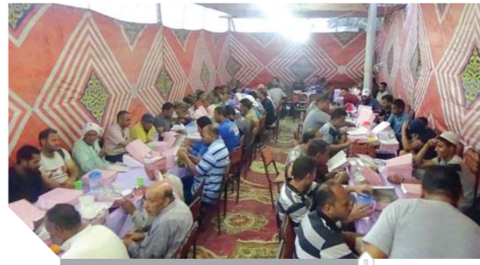
إحدى مواضع الرحمن التي تقيمها القوات المسلحة

والبحر الأحمر، كما أقامت المنطقة الشمالية العسكرية (٢١) مأدبة رمضان بمحافظات الإسكندرية والغربية والبحيرة وكفر الشيخ، وقامت المنطقة الجنوبية العسكرية بتنظيم (١٨) مأدبة رمضان بمحافظات أسبوط والبحر الأحمر وقنا وأسوان وسوهاج