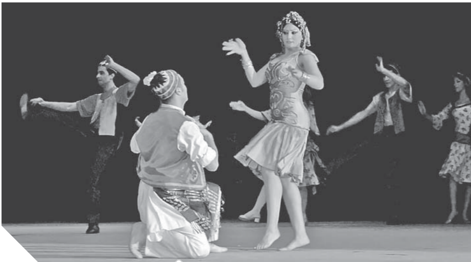
احتفالات الثقافة في رمضان

تحتفل بالثقافة في رمضان، وتزداد الأحداث سخونة مع تطور الأحداث، مع الحلقة الرابعة لسلسل السهام المارقة والذي يعرض على قناة النهار.. تواصل داغش جرائمها فيما يسمى بالدولة الإسلامية الإرهابية، حيث يواصل شريف سلامة أسلوبه المهج في قتل الأبرياء ضمن الأحداث، أما هاني عادل فينكشف جزء من شخصيته، فهي يدعي أنه إرهابي لكن مشاعره الطيبة تكشفه، بينما تذهب شيرى عادل إلى بيت وليد فواز والذي يحاول إقناعها بأنها أصبحت ملكاً ليميته وله الحق أن يعيش معها كزوجة، وهي الطريقة التي تكشف خلال الأحداث مساوئ التنظيم الإرهابي وما آل إليه.