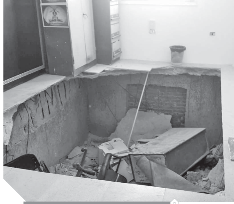
الجزء المنهار بمبنى مديرية الطرق