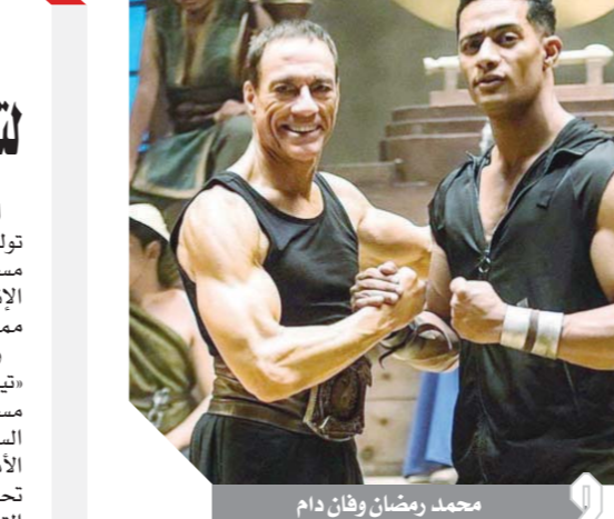
محمد رمضان وهانى دام

إطلاقاً من التزامها بتعزيز بيئة آمنة للإبداع والتعبير، أطلقت «تيك توك»، المنصة العالمية الرائدة لمقاطع الفيديو القصيرة على الهواتف المحمولة، مسابقة ضمن التطبيق لتزويد مستخدميها بنصائح متعلقة بالأمن على شبكة الإنترنت. وسيفوز المستخدمون الذين تكون جميع إجاباتهم صحيحة بجوائز مميزة من «تيك توك». وباعتبارها منصة تحتفل بكل ما هو جديد وتحضن التنوع، أصبحت «تيك توك» المنصة المفضلة للمستخدمين لعرض إبداعاتهم لما توفره من مساحة واسعة للمشاركة والإبداع والاكتشاف، التي أصبحت اليوم في غاية السهولة عبر الهاتف المحمول، وتحرض النصة على منح أعلى مستويات الأمان والراحة للمستخدمين، مما يدفعهم للعمل باستمرار على تحسين وتحديث السياسات والأدوات والموارد لدعم بيئة إيجابية وآمنة ضمن التطبيق. وستوفر مسابقة أمن الحساب على منصة «تيك توك» في أوروبا والشرق الأوسط وشمال أفريقيا، وآسيا، وتتضمن أسئلة تبرز بعضاً من أهم الأفكار حول أمن الحساب، بما يشمل: - تعيين كلمة مرور قوية عند إنشاء الحساب - عدم مشاركة معلومات الحساب مع أي شخص كان - الحذر من المواقع أو رسائل البريد الإلكتروني الغير للبرية، أو رسائل التصيد - تعزيز منصة «تيك توك» جهودها التعليمية هذه بإطلاق مبادرات وأدوات جديدة لدعم توفير بيئة آمنة وإيجابية ضمن التطبيق. وخلال العام الماضي، أطلقت المنصة مركز الأمان المكّرس لتقديم نصائح وموارد لمساعدة المستخدمين على الاطلاع على مجموعة من المواضيع وتعزيز تجربتهم على الإنترنت لتصبح أكثر أماناً.