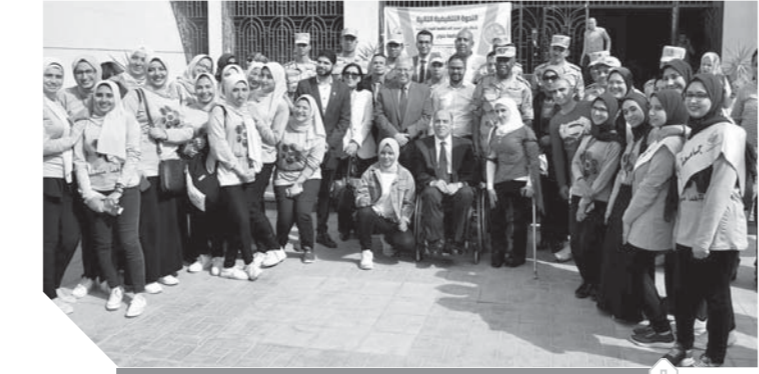
قيادات قوات الدفاع الشعبى مع ذوى الاحتياجات الخاصة