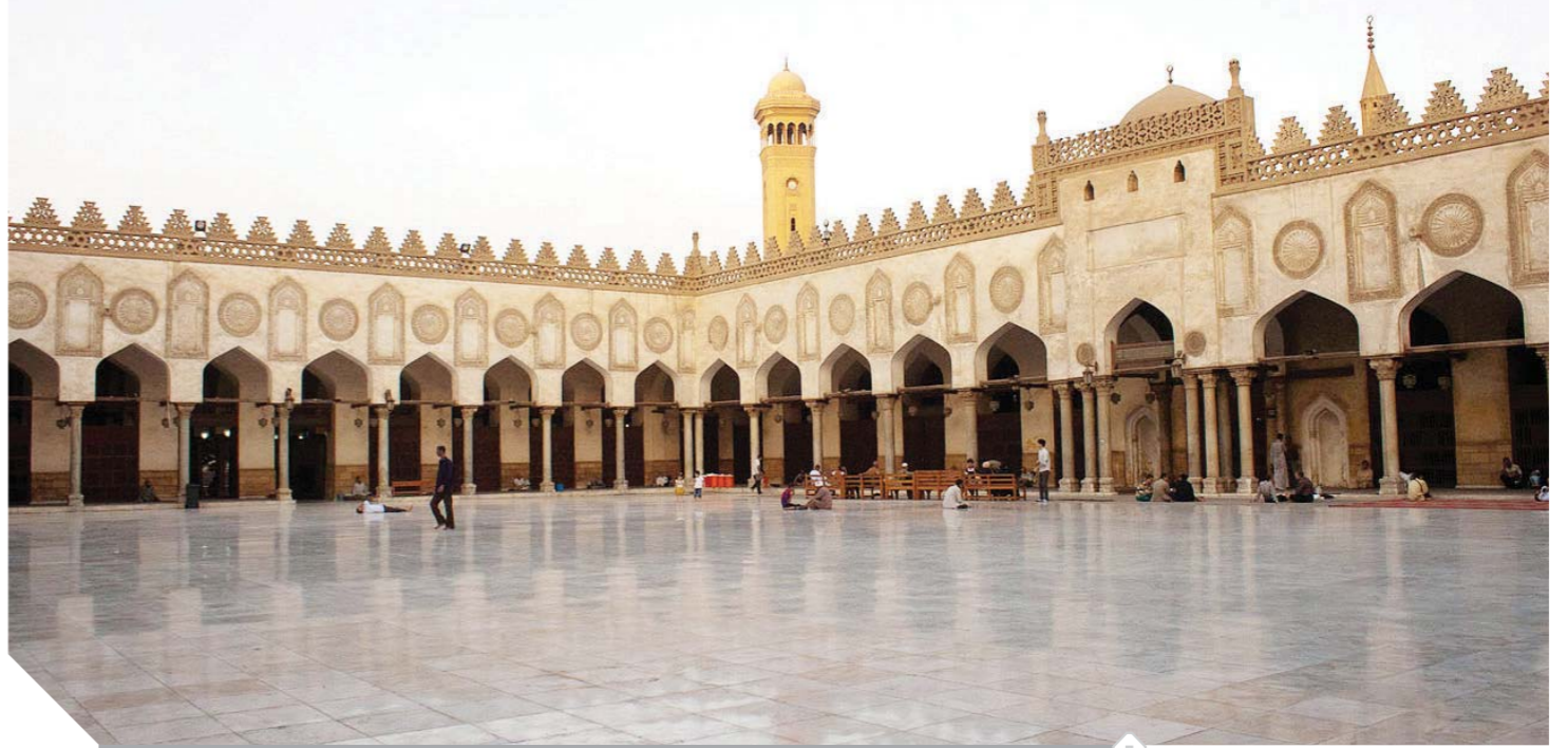
صحن الجامع الأزهر

ويفتح الجامع الأزهر أبوابه في يوم الاحتفالية أمام الجمهور وسوائل الإعلام من الساعة العاشرة صباحًا. جدير بالذكر أن المجلس الأعلى للأزهر قد وافق برئاسة فضيلة الإمام الأكبر الدكتور أحمد الطيب، شيخ الأزهر الشريف، على اعتبار مناسبة افتتاح الجامع الأزهر في السابع من رمضان عام ١٣١١ هـ مناسبة احتفالية كل عام.