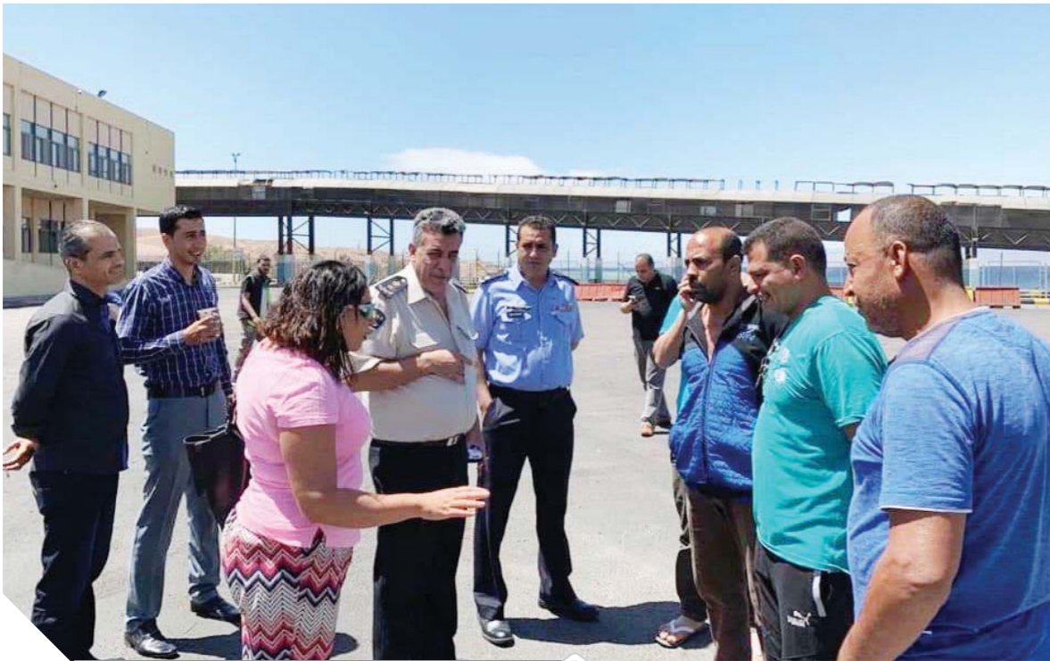
الوزير المفوض يلتقي ممثلي شركات الشحن