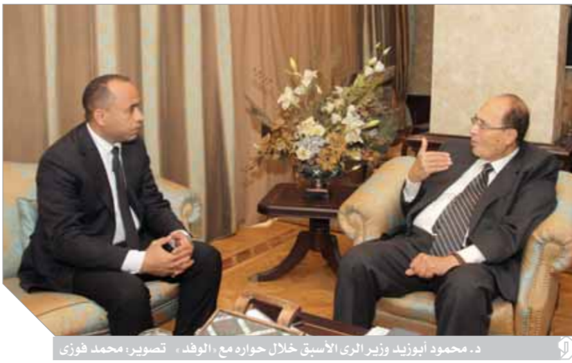
د. محمود أبو زيد وزير الري الأسبق خلال حوار مع «الوفد»

ما تقييمك لآداء الرئيس السيسي نحو أفريقيا وإدارته ملف سد النهضة وهل يمكن تدويل القضية؟ - بالطبع.. دور الرئيس «السيسي» قوى وفعال جدا، وغير الأمور تماما، وداعم بشكل كبير جدا، وكان وراء اتفاق المبادئ، وأعتقد أنه في كل مناسبة من المناسبات يشير إلى أهمية التوصل إلى اتفاق ملزم بالنسبة للتشغيل، والمعلم لسد النهضة، ونحن في المجلس العربي للمياه ومكمرصين تؤيد تماما آراء الرئيس «السيسي» وإهتمامه الشديد بهذه القضية، أما بالنسبة لتدويل القضية، ونحن نتحدث عن المفاوضات والمباحثات، هذه المفاوضات أخيرا طلب مساعدة أو مساندة الاتحاد الأفريقي وأيضا طلب تدخل أمريكا بالنسبة لتدويل القضية، ونحن نتحدث عن المفاوضات مثل البنك الدولي، فالخطوة التالية إذا فشلت كل هذه المفاوضات ألا ثم التدخلات الإقليمية سيتم اللجوء إلى المستوى الدولي، والمستوى الدولي معتقد جدا، لأنه بالنسبة لمحكمة العدل الدولية لابد من موافقة الطرفين