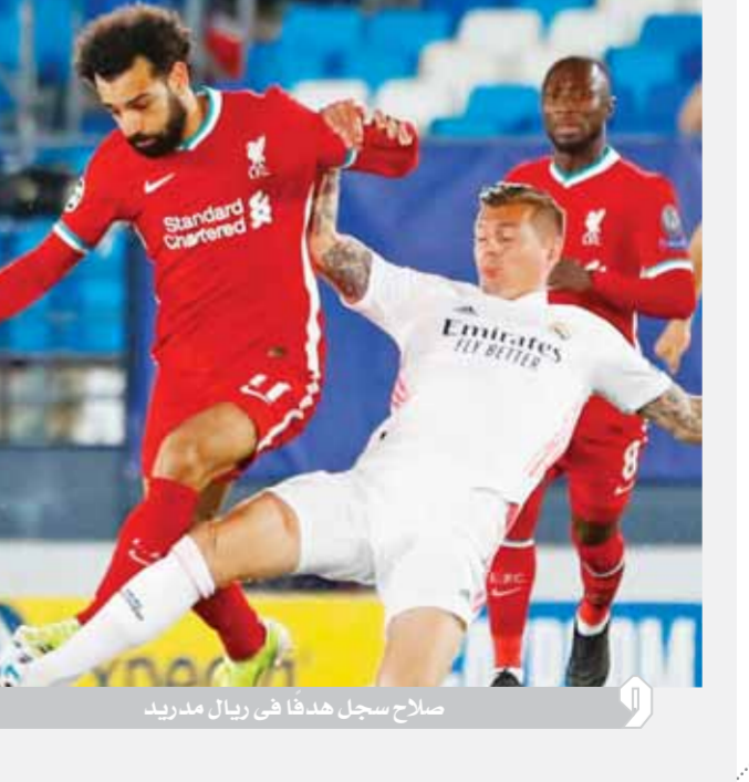
صلاح سجل هدفاً فى ريال مدريد

كتب - محمد اللاهونى: زادت معاناة فريق ليفربول الإنجليزي بهزيمته المريرة على يد مضيفه ريال مدريد الإسباني بنتيجة ٣-١ فى ذهاب ربع نهائى دورى أبطال أوروبا. وأصبح ليفربول مهدداً بالخروج من دورى الأبطال حال عدم توفقه بنتيجة ٢-٠ أو بفارق ٢ أهداف حال استقبال هدف فى شبابه خلال لقاء الإياب المقرر يوم الأربعاء المقبل فى أنفيلد... ويبدو أن الهدف الذى سجله النجم المصرى محمد صلاح لا يكفى لإرضاء جماهير الريدز التى صبت جام غضبها فى مواقع التواصل الاجتماعى بخلاف الانتقادات الحادة عبر وسائل الإعلام البريطانية لأداء كتيبة المدرب يورجن كلوب فى مباراة الريال... ورغم أن هدف صلاح فتح باب الأمل للليفربول وحفظ ماء وجه الريدز إلا أن المستوى الهزيل لحامل لقب الدورى الإنجليزي وخاصة فى خط الدفاع يفتح الباب أمام الخروج على يد الريال ويهدد الفريق بموسم صفرى بعدما ودع بطولتى كأس الرابطة وكأس الاتحاد بخلاف ابتعاده عن المنافسة على لقب الدورى الإنجليزي... وأصبح صلاح ثالث لاعب مصرى يسجل فى مباراة رسمية ضد ريال مدريد بعد أحمد حسام ميدو بقميص مرسيليا الفرنسى وإبراهيم حسن بقميص نيوشاتل السويسرى وخامس لاعب بشكل