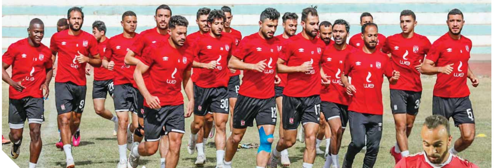
الأهلى يحتتم تدريباته استعداداً لمواجهة سيمبا