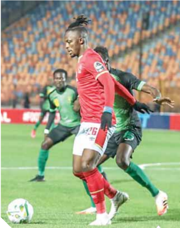
بواليا يواجه حملة انتقادات كثيرة بسبب إهدار الفرص