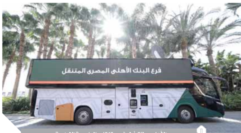
الأهلى يطلق أول فرع متنقل بالعاصمة الادارية

صحية في حيز محدود ومتنقل يشتمل على كافة المعدات واساليب الربط بأنظمة البنك لتقديم خدمة مصرفية بجودة عالية تحقق طموح عملاء البنك وتدعم الشمول المالي والوعي المصرفي عبر شرائح أكثر من المواطنين.