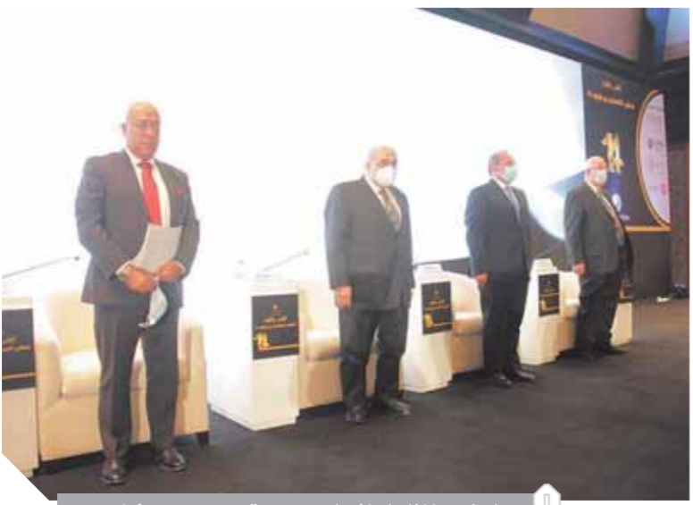
الحضور خلال السلام الجمهوري