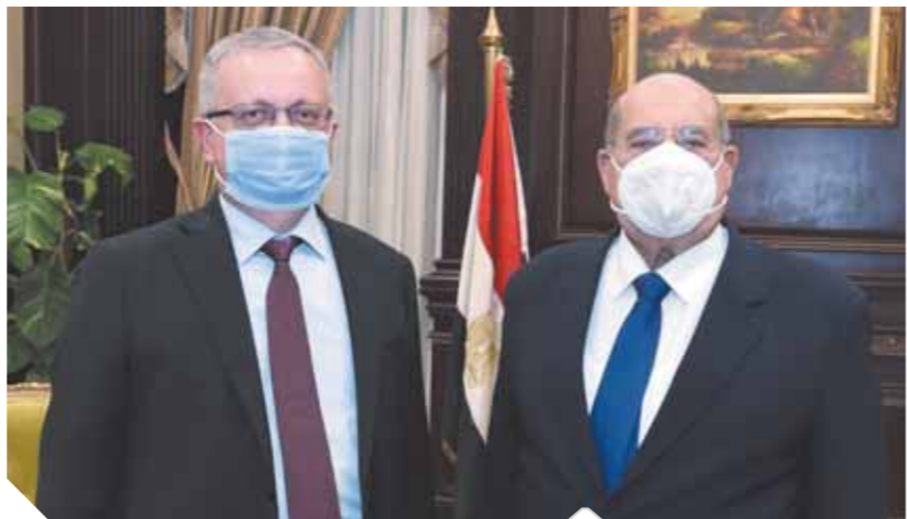
المستشار عبدالوهاب يستقبل سفير روسيا الاتحادية

الجديد، مؤكداً رغبة روسيا فى تطوير العلاقات الثنائية مع مصر فى كافة المجالات، خاصة فى ضوء علاقات الأخوة المتميزة بين الرئيس ورئيس