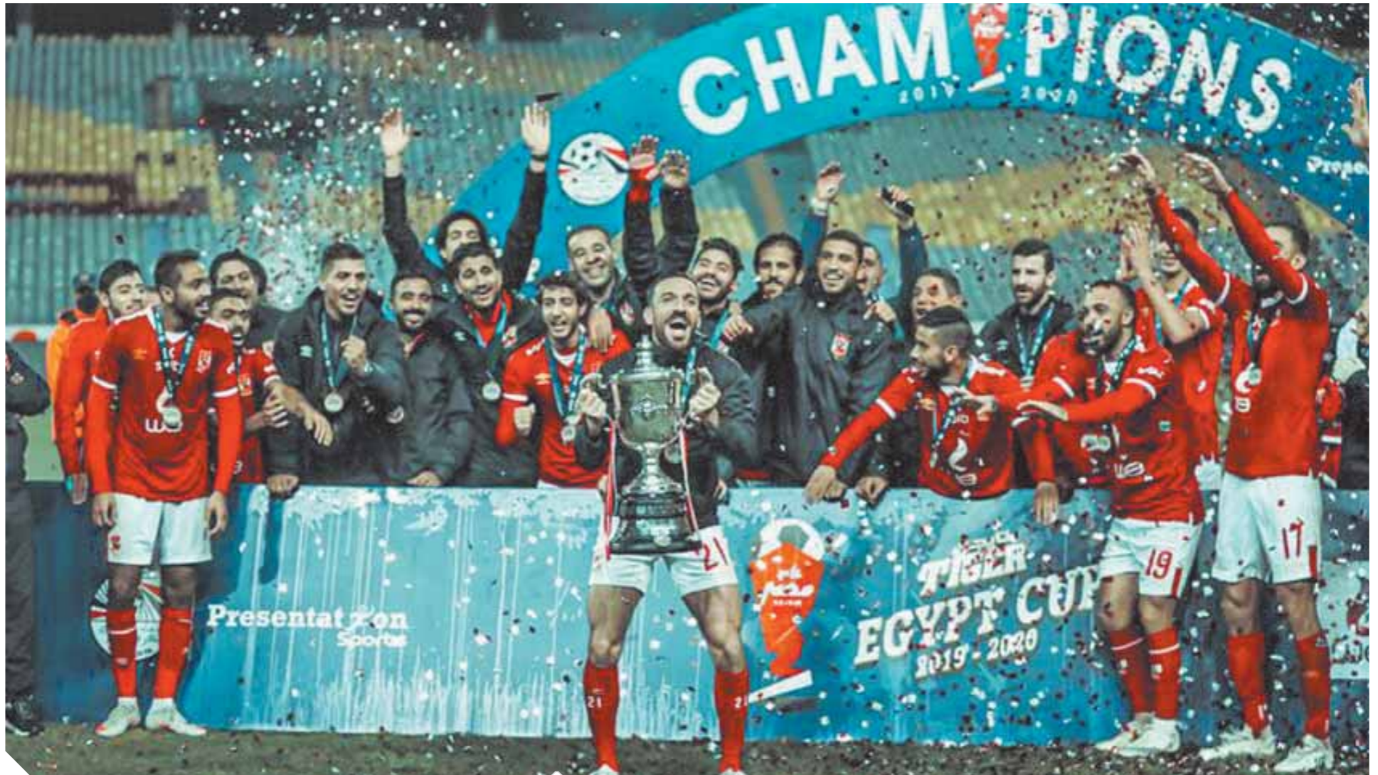
لاعبو الأهلي يحتفلون بالكأس والثلاثية