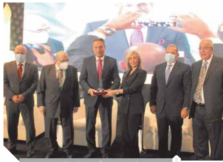
تكريم محمد الأترابي خلال المؤتمر

على مدى يومين، عقد المركز الإعلامي العربي، مؤتمر «الناس والبنوك» وهي الدورة ١٤، على الرغم من ظروف «كورونا»، افتتح المؤتمر الدكتور مصطفى الفقى رئيس المركز الإعلامي العربي، وهشام عكاشة رئيس المؤتمر ورئيس مجلس إدارة البنك الأهلي المصري، ويحيى أبو الفتوح مقرر المؤتمر ونائب رئيس البنك الأهلي وصبري غنيم العضو المنتدب المركز الإعلامي العربي، ووفاء الغزالي مدير المركز، وبحضور الدكتورة نبيلة مكرم وزيرة الهجرة، نيفين جامع وزيرة التجارة والصناعة، وقيادات البنوك المصرية. وكرم مؤتمر الناس والبنوك محمد الأترابي رئيس مجلس إدارة بنك مصر، ورئيس اتحاد بنوك مصر وذلك تقديراً لمجهوداته الكبيرة في دعم الجهاز المصرفي ودور بنك مصر في دعم الاقتصاد.