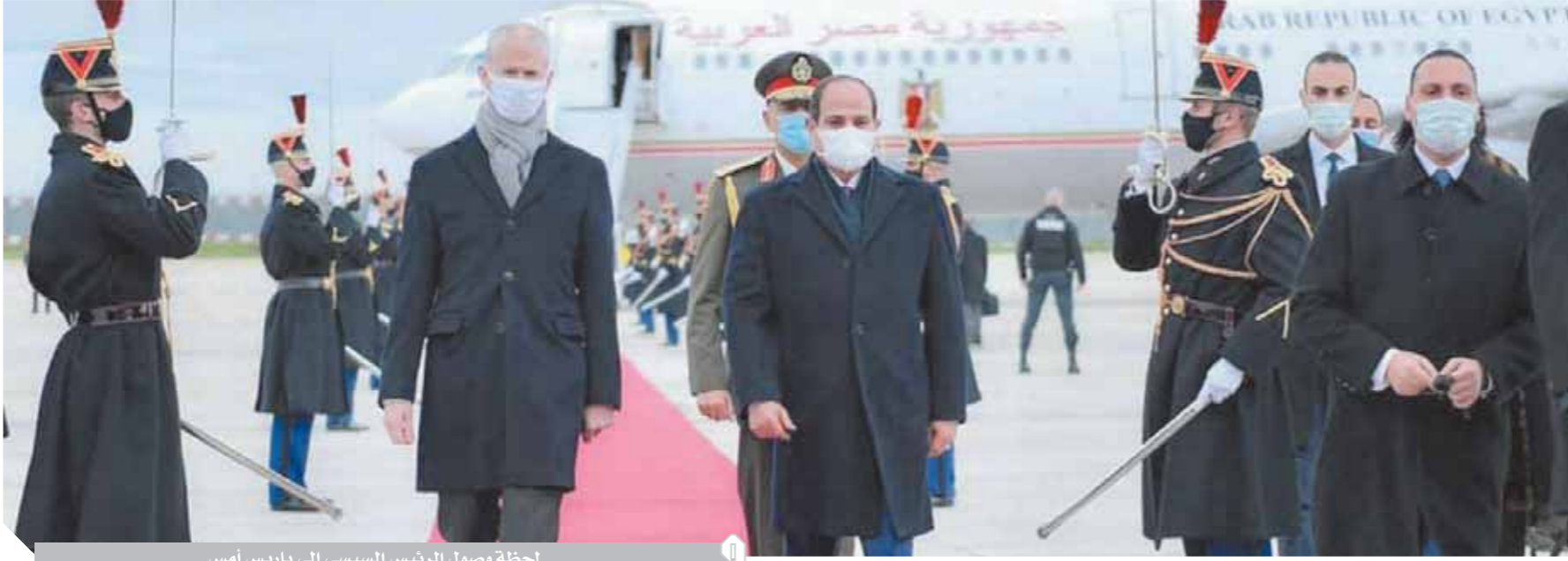
لحظة وصول الرئيس السيسي إلى باريس أمس