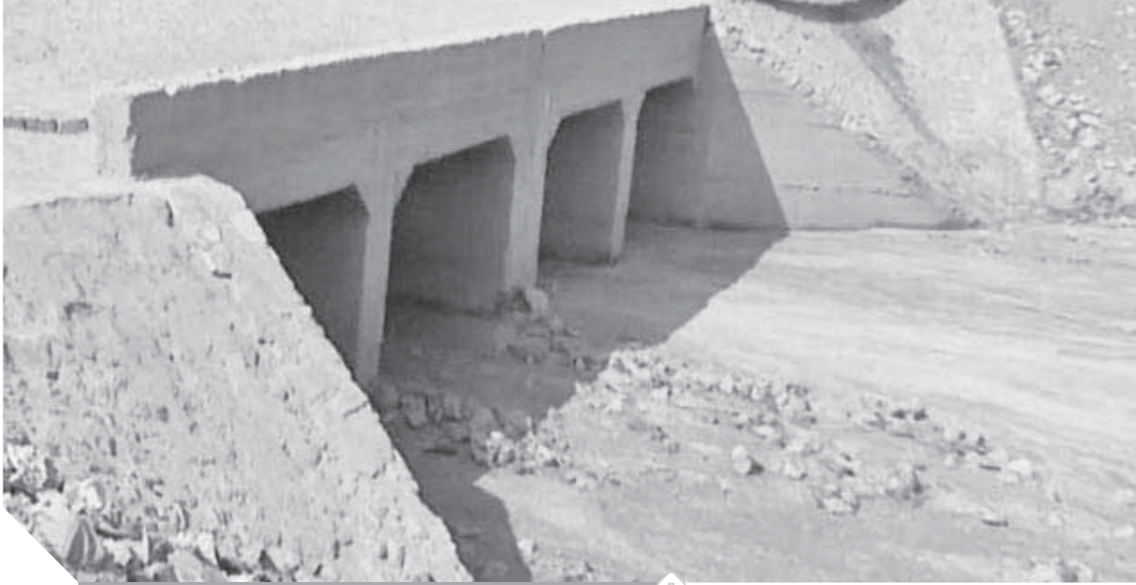
مخزّات السيول جاهزة لوسم الامطار

هذا بالإضافة إلى تشكيل لجان أزمات بكل الفروع على مستوى الشركة، واعداد احتياطات من الشبة بالمحطات الكبرى، وهي (محطة الصمادية بمغاغة، المحطة لبننا الجديدة، محطة كنوان بحطة عرب الزينة بحطة بنها بمغاى، محطة عرب الزينة بسماوط، محطة لبننا الجديدة، محطة كنوان جنوب المنية، محطة بنى أحمد، محطة المعصرة بملوى، المحطة البحرية والتقليبة بمدينة المنيا أرض سلطان).