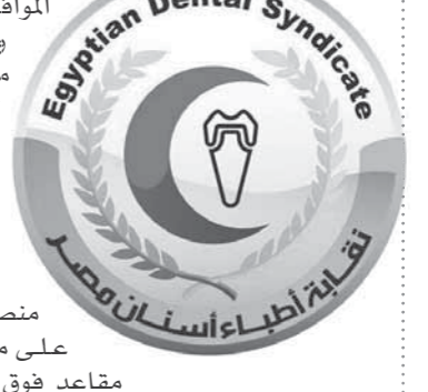
نقابة أطباء أسنان مصر

وتجرى الانتخابات على منصب النقيب وأعضاء المجلس على مستوى الجمهورية لعدد ٣ مقاعد فوق السن و٢ مقاعد تحت السن، وعلى مستوى المقاعد الشاغرة على مستوى المناطق ورؤساء النقابات الفرعية والمقاعد الشاغرة فوق وتحت ١٥ عاماً بالنقابات الفرعية طبقاً لقانون النقابة رقم ٤٦ لسنة ١٩٦٩ واللائحة الداخلية لنقابة أطباء الأسنان رقم ٢١١ لسنة ١٩٧٠.