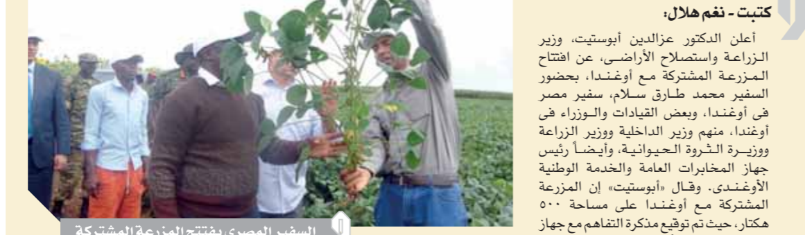
السفير المصرى يفتتح المزرعة المشتركة

فى هذا المجال. وأضاف «أبوستيت»، أنه سوف تتم أيضاً زراعة جميع أصناف الهجن ٢١ مزرعة مصرية فى إفريقيا خلال المرحلة المقبلة من أجل نقل الخبرة الزراعية المصرية للدول الإفريقية الشقيقة طبقاً لتوجهات القيادة السياسية.