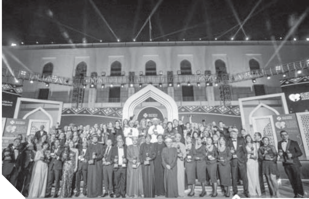
مشاركة رفيعة المستوى في الاحتفالية الدولية

الأشقاء العمانيون يحصدون ١٦ جائزة كبرى من بين ١٤٤ جائزة وزعت على ١٨٠ دولة