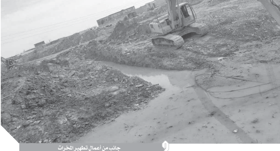
جانب من أعمال تطهير المخزّات