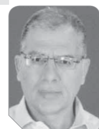
د. مصطفى محمود

أن من حتى أن أسأل، بعفتي حسن النية، ما هي الشروط التى وضعتها الأسقفية لاختيار رتبة مساعداً الأسقف، ولماذا تختاره من العلمانيين، ومن دون رجال الكهوت، ومن الذى يملك أن يضع اليد على رأسه ليطلب من أجله، ليسكب الروح القدس، ويعتبه هذه الرتبة، وليصبح له سلطات مباشرة هذه الخدمة، هل يتقدم المجمع المقدس بتعديل قوانين الكنيسة، ولوائحها، بحيث يكون مساعداً الأسقف أحد أعضاء المجمع، هل سيصدر قداسة البابا قراراً بإلزام كل مطران، وكل أسقف أن يعين مساعداً له من العلمانيين، وتضرب بذلك قوانين الكنيسة وتقاليدها!!