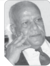
المستشار لييب حليم لييب

بدأ فصل الشتاء وتوقعت خبراء الأرصاد الجوية بهطول الأمطار على كل أنحاء المحافظات، وكانت وزارة التنمية المحلية قد أصدرت بياناً شددت على ضرورة متابعة كل المسؤولين في المحافظات بكل المحافظات على أعمال الصيانة والتطهير الخاصة بمخزّات السيول وتنفيذ سيناريوهات إدارة أزمة مبكرة لمتابعة الاستعدادات في حالة سقوط أمطار أو حدوث سيول واتخاذ كل الإجراءات وتوفير الاحتياجات اللازمة والتنسيق مع شركات مياه الشرب والصرف الصحي بالمحافظات للتأكد من تطهير شبكات الصرف الصحي ورفع كفاءة المعدات المعنية والتأكد من جاهزيتها ووضع جميع المعدات في حالة تأهل قصوى للتعامل مع أي أمطار غير متوقعة، ورصدت «الوقد» أعمال التطهير والصيانة للعديد من المخزّات في كل المحافظات وذلك استعداداً لمواجهة خطر السيول والأمطار.