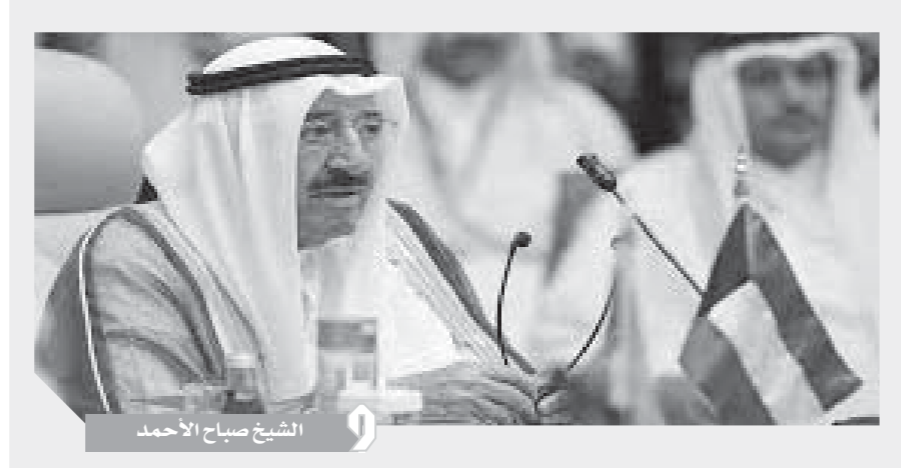
الشيخ صباح الأحمد

أعلن الأمين العام لمجلس التعاون الخليجي، عبداللطيف بن راشد الزياني، أن القمة المقبلة لدول المنظمة ستعقد في الرياض، الثلاثاء المقبل، متوقفاً أن تخرج بقرارات بناءة. وقال «الزياني»، في بيان صحفي، إن قادة دول مجلس التعاون لدول الخليج العربية، سيعقدون اجتماع الدورة الأربعين برئاسة العاهل السعودي، الملك سلمان بن عبدالعزيز آل سعود. وأضاف «الزياني» أن المجلس الوزاري سيعقد