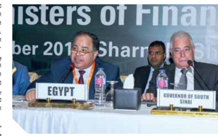
الجلسة الافتتاحية لاجتماع لجنة وزراء المالية الأفارقة «F١٥» بمدينة شرم الشيخ، إن الجهود الحثيثة المبذولة من

لجنة وزراء الاتحاد الإفريقي «F١٥»، التي بدأت عملها مع اللجنة الوزارية المعنية بتقييم الموازنة، قد توجت عملها بوضع معيار جديد لقياس موازنة الدول الإفريقية خلال الفترة (٢٠٢٠/٢٠٢٢)، يعتمد على القدرة على السداد والتضامن، وتقسام الأعباء بين الدول الأعضاء بصورة عادلة، فى إطار الفهم الواسع بأهمية مشاركة الأعباء الموازنية لتجنب المخاطر، وضمان تمويل الاتحاد بطريقة مستدامة ومنصفة وخاصة للمساهلة، مع مراعاة الحق الكامل للدول الأعضاء فى التصرف.