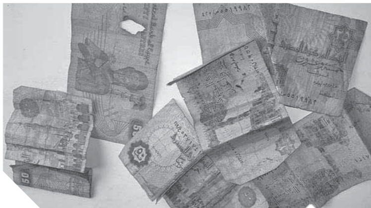
العملات الورقية المتراكمة تكلف الدولة ملايين الجنيهات

وأضاف الدكتور صلاح أن البيئة التكنولوجية في مصر ليست مهيأة تماماً ولا بد من تهيئتها حتى تتمكن من تعميم هذا النظام والاستفادة منه، موضحاً أن هذا قد يستغرق بعض الوقت حتى يتم تغيير هذه العادات، وتهيئة البيئة التكنولوجية، مؤكداً أن هذا التحول أمر لا بد منه لضبط إيقاع الاقتصاد المصري والقضاء على الفساد المتعلق بمعاملات المواطنين وموظفي الدولة.