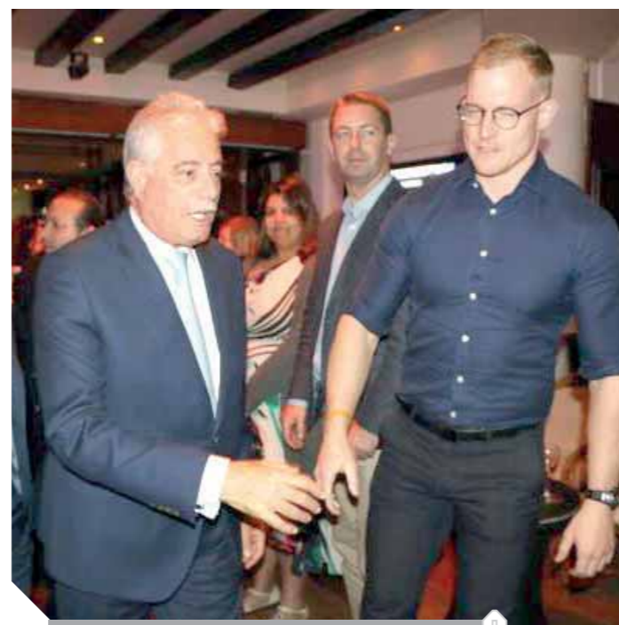
محافظ جنوب سيناء يستقبل وفد الشركات الإنجليزىة

الصوره كما لمسها فى كل الأماكن، وأكد استقباله لأول رحلة طيران مباشره قادم من إنجلترا هذا الشهر فى المطار، وطلابه بحضور وفد إعلامى إنجليزى على الطائرة ليرصد أجواء الاستقبال، ويقوم أيضاً بعمل جولة فى مدينة شرم الشيخ، وقام المحافظ بدعوة الوفد لمعاديه عشاء وقام بتقديم الشال الهدى للسيدات، وميدالية المحافظة لياقى أعضاء الوفد. وتأتى أهمية الزيارة فى هذا التوقيت لاسيما بعد قرار الحكومة البريطانية