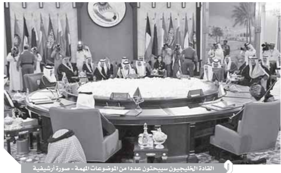
القادة الخليجيون سيبحثون عدداً من الموضوعات المهمة - صورة أرشيفية