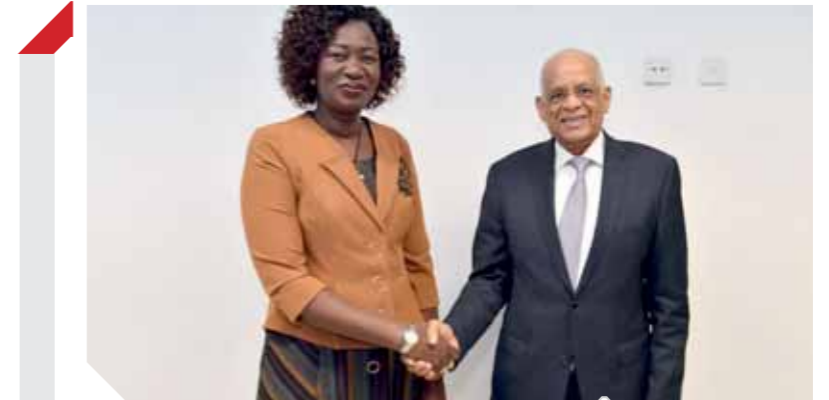
عبد العال، وزير الخارجية بجنوب السودان

سليمة، وتحقيق الاستدامة المالية للصندوق الاحتياطى للاتحاد الإفريقي. قال الوزير، فى كلمته، خلال