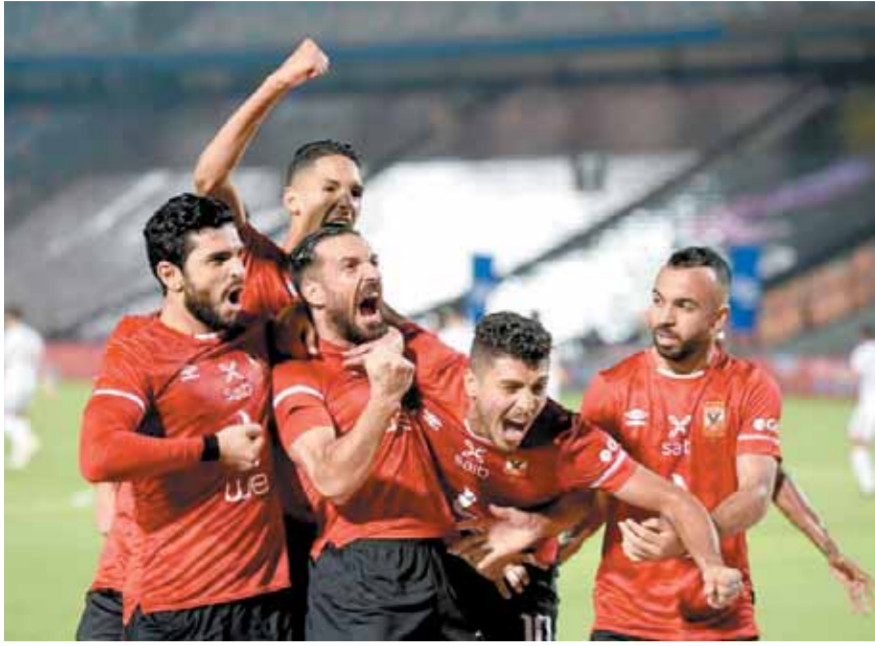
احتفالات لاعبي الأهلي بالفوز على الزمالك