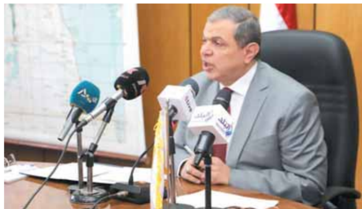
سغان في المؤتمر الصحفي

أعلن محمد سغان وزير القوى العاملة، أن الانتخابات النقابية العمالية ستتم في موعدها المحدد وفقاً للقانون في منتصف العام المقبل ٢٠٢٢، مؤكداً أنه لا يوجد أي نية لتأجيل مشدداً على أن الوزارة لا تتدخل في العمل النقابي، بل يقتصر دورها على التنظيم فقط، حيث إن ترك التنظيم الإداري دون تنظيم أو تحديث يعد عبئاً على الجهة الإدارية المشرفة عليه. وأشار الوزير في هذا الصدد إلى أن الوزارة أعطت مهلة حتى ١١ نوفمبر الجاري للانتخابات من إجراءات تحديث بيانات النقابات وللجان النقابية العمالية تمهيداً لإجراء الانتخابات النقابية العمالية. وأوضح وزير القوى العاملة أنه وفقاً للائحة يتم تحديث البيانات الخاصة بالتنظيم النقابي كل عام، مشيراً إلى أن عدد اللجان النقابية يبلغ ١٩٥٧ لجنة، بينما يبلغ عدد اللجان المهنية ٢٥٧ لجنة، منها إلى أن ٦٥٪ من النقابات واللجان العمالية انتهت من تحديث بياناتها استعداداً للانتخابات، حيث إن التغطية العامة للعاملين بالإسعاف قامت بتسجيل بياناتها بشكل كامل. جاء ذلك في المؤتمر الصحفي الذي عقده الوزير أمس مناقشة بعض الملفات المهمة، منها استعداد الوزارة لإجراء الانتخابات النقابية الدورية ٢٠٢٢-٢٠٢٦، والتمتع التدريجية التي تقدمها الوزارة للخريجين في مجال تكنولوجيا المعلومات والتحول الرقمي، فضلاً عن آخر مستجدات مشروع قانون العمل الجديد، والرئيس الإلكتروني مع ليبيا. وتناول الوزير آخر المستجدات فيما يتعلق