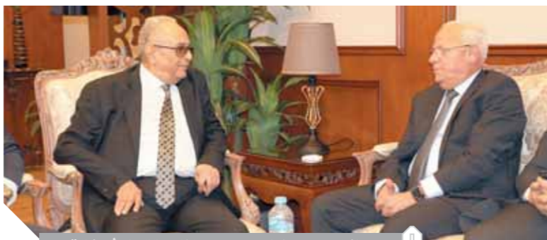
القضبان محافظ بورسعيد خلال استقباله أبوشقة

آن الأوان لعودة الوزير السياسي وتعيين نواب لرئيس الحكومة