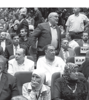
جماهير بورسعيد حرصت على حضور مؤتمر أبو شقة