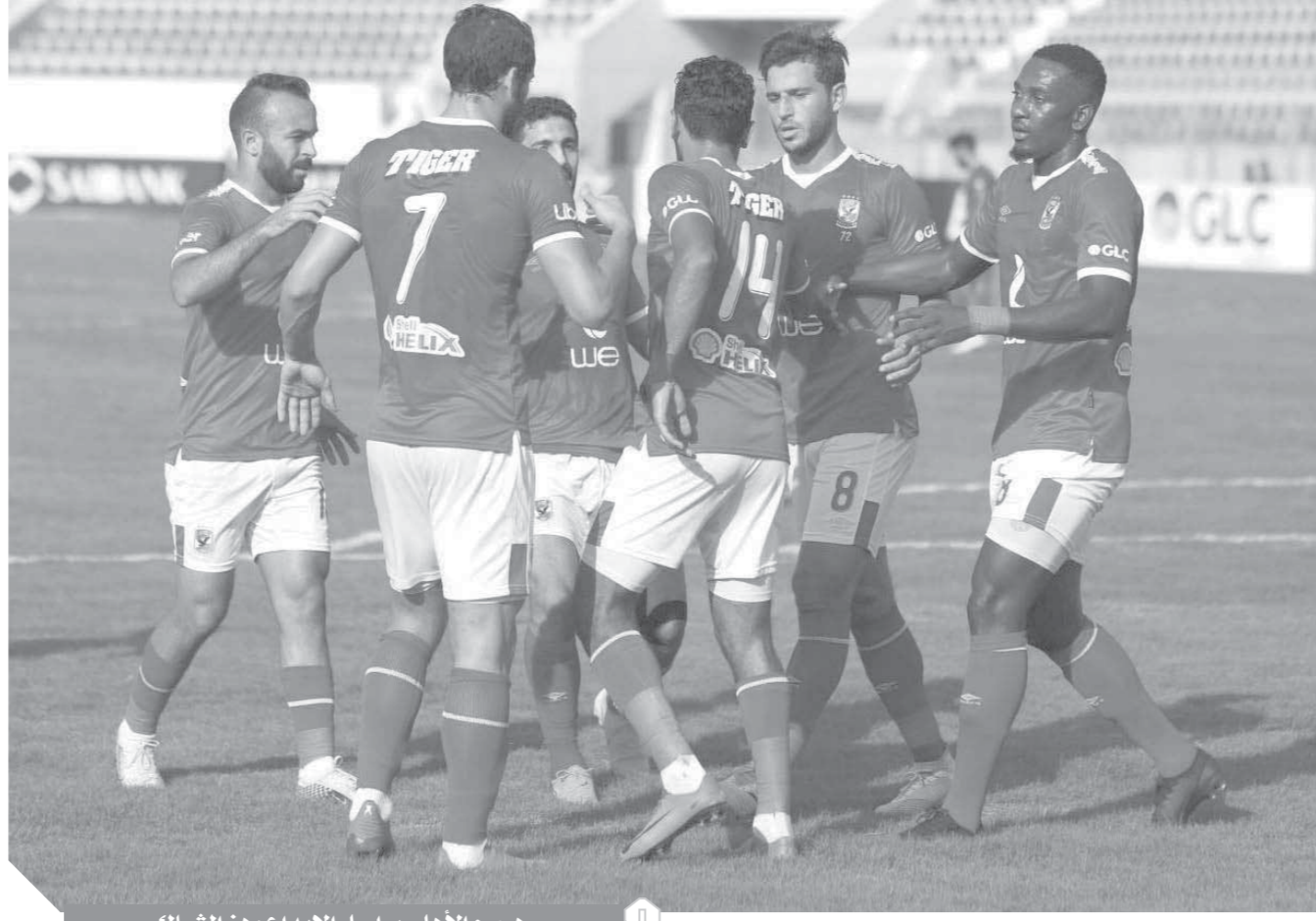
هجوم الأهلي يواصل الإبداع وهزّ الشباك

واصل فريق الأهلي الإبداع تحت قيادة المدرب السويسري رينيه فايلر بعدما حصد سادس انتصار على التوالي بجانب ثالث فوز بالدوري وحصد العلامة الكاملة قبل توقف الدوري بعد الانتصار الساحق على أسوان في عقر داره بنتيجة ٥-١ بالجولة الثالثة. وتغلب الأهلي على ظروف ارتفاع درجة الحرارة والإجهاد نتيجة ضيق الوقت بين لقاء أسوان والإنتاج الحربي وهو الأمر الذي أثلج صدور جماهير القلعة الحمراء التي باتت تنتظر كل مباراة للفريق للاستمتاع بما يقدمه الأهلي مع فايلر.