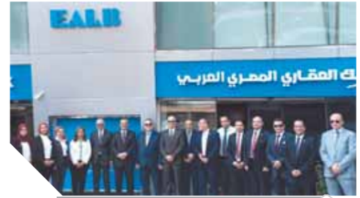
قيادات البنك خلال افتتاح الفرع

وقال محافظ البنك المركزي: إن المشروع يستهدف حماية العملاء والمنافسة، رفع الوعي والشفافية المصرفية لدى العملاء وتعزيز ثقة المتعاملين في الجهاز المصرفي، وتحسين نوعية وجودة الخدمات المصرفية، وتعزيز التنافسية بين البنوك بما يدعم نمو وكفاءة القطاع المصرفي، وزيادة الإقبال على استخدام الخدمات المصرفية،