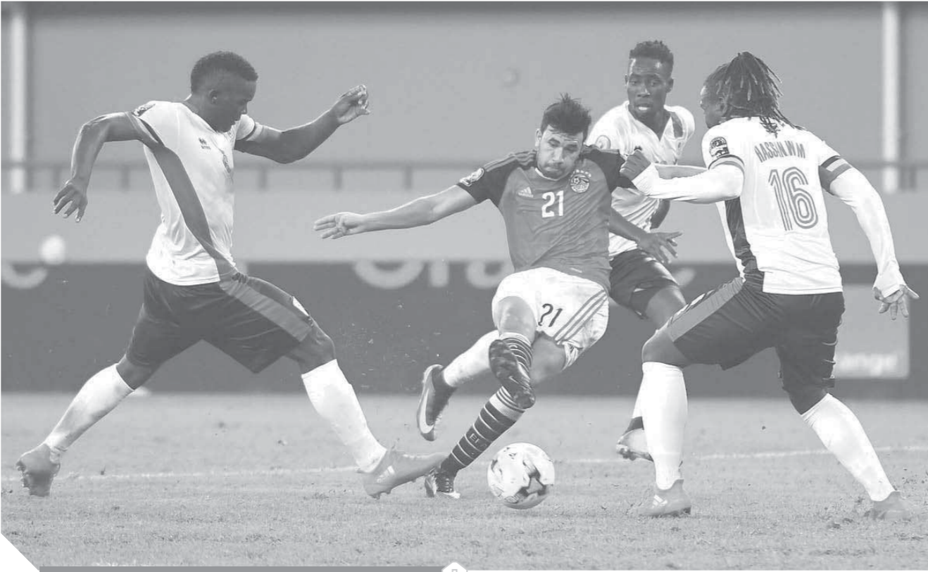
تريزيجييه يحتضن مكانه في المنتخب

على جانب آخر قرر المدير الفني منح الفريق راحة لمدة يومين بعد مباراة إف سي مصر التي أقيمت مساء أمس بملعب السلام، ويستأنف الفريق بعدها تدريباته استعداداً للقاء القمة، ووافق الجهاز الفني على سفر الثالثى حمدي النياز وفرجاني ساسي للانضمام إلى منتخب تونس.