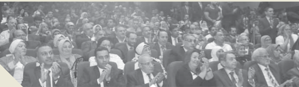
جاناب من حضور المؤتمر