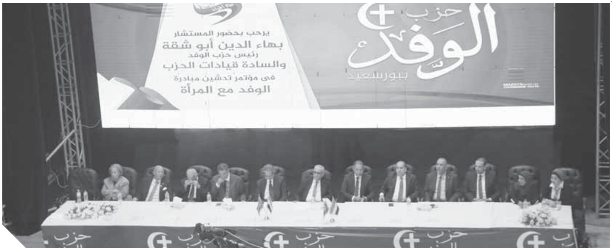
أبو شقة يتوسط المنصة في مؤتمر بورسعيد