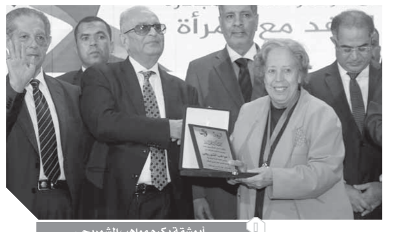
أبو شقة يكرم مواهب الشوربجى

كرم المستشار بهاء الدين أبو شقة، رئيس حزب الوفد، عدداً من القيادات النسائية من أبناء بيت الأمة. وعبر «أبو شقة» عن سعادته لتكريم هذه النماذج الرائدات من رموز الوفد، مشيداً إلى التاريخ المشرف للمرأة المصرية ومسيرة المرأة الوفدية المشرفة التى أثبتت جدارتها فى كافة المواقع التى تقلدها. ومن أبرز الوفديات التى تم تكريمهن مواهب الشوربجى ونهلة الألفى، كما كرم «أبو شقة» المناضلة البورسعيدية زينب الكفراوى.