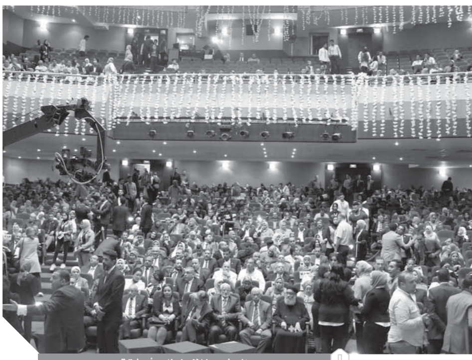
الحشود خلال خطاب أبوشقة.