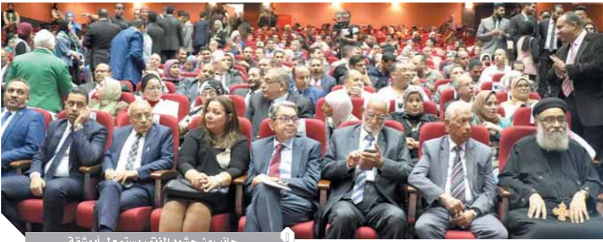
جانب من حشود المؤتمر يستمع لـ أبوشقة.