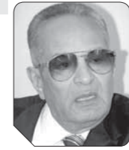
بهاء الدين أبو شققة