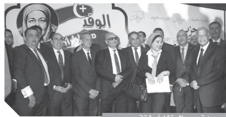
جماهير بورسعيد ترحب بالمستشار أبوشقة