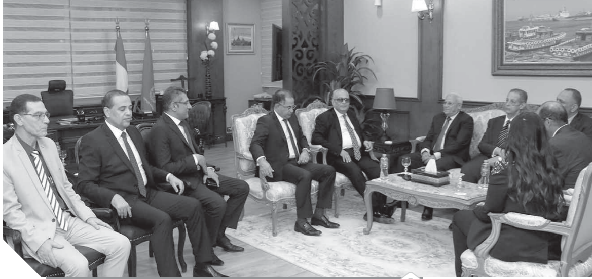
اللواء عادل الغضبان خلال استقباله أبو شقة وعدداً من أعضاء الهيئة العليا للحزب

الحديث عن القاهرة مزق ومرور في مواجهة أزماتها الحلية ومرافقها وثرواتها والتعامل مع مطالباتها واحتياجات سكانها... ولم تستغل الحكومة منذ نشأة نظام الحليات أن تنتبه إلى تعديل أسلوب التعامل مع العاصمة الضخمة المتضخمة وما تحمله من احتياجات لازمة وعاجلة وما تتطلبه من تطوير ونظر إلى المستقبل وما تحويه من كوز وإمكانات يتم هدرها جهلا وعمداً وتخاذلاً في خبطة مؤسفة للفشل والتجاهل وانتصاراً مذهباً للفساد والبطلجة!!! > جامع المحمودية الشهير الواقع في ميدان القلعة امام السلطان حسن وهو ثاني جامع عثمانى في مصر ويشبه السلطان حسن في تقسيمه الأقبية الضريبية مع الأيوان الرئيسي ولا يحمل من الملامح العثمانية إلا مئذنته الجميلة البديعة... ويقوم المسجد على أربعة أعمدة جرانيتية هائلة وقد حدث هبوط في أحدها أحدث خللاً في توزيع الحمل ما ترك فزعا بسقوط السقف فضلاً عن شروخ واضحة بالحوائط الرئيسية... أغلق الجامع البديع منذ ثلاثة أعوام ولا من سائل أو مجيب وأهالي القلعة والخليفة متضررون أشد الضرر... ولا نفهم كيف تترك ثروة الوطن هدراً حتى تزول وتختفي في كوارث الأهمال والتجاهل المتعمد، والأمر بالطبع سيظل حائراً بين الأثار والمحافظه والحى ومجلس رئاسة الوزراء في تحميل كل طرف للاخر المسئولية حتى نرى ثروتنا اثراً بعد عين.