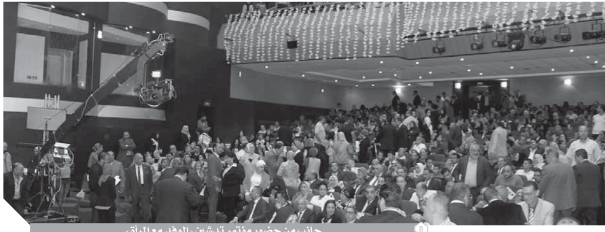
جانب من حضور مؤتمر تدشين الوفد مع المرأة