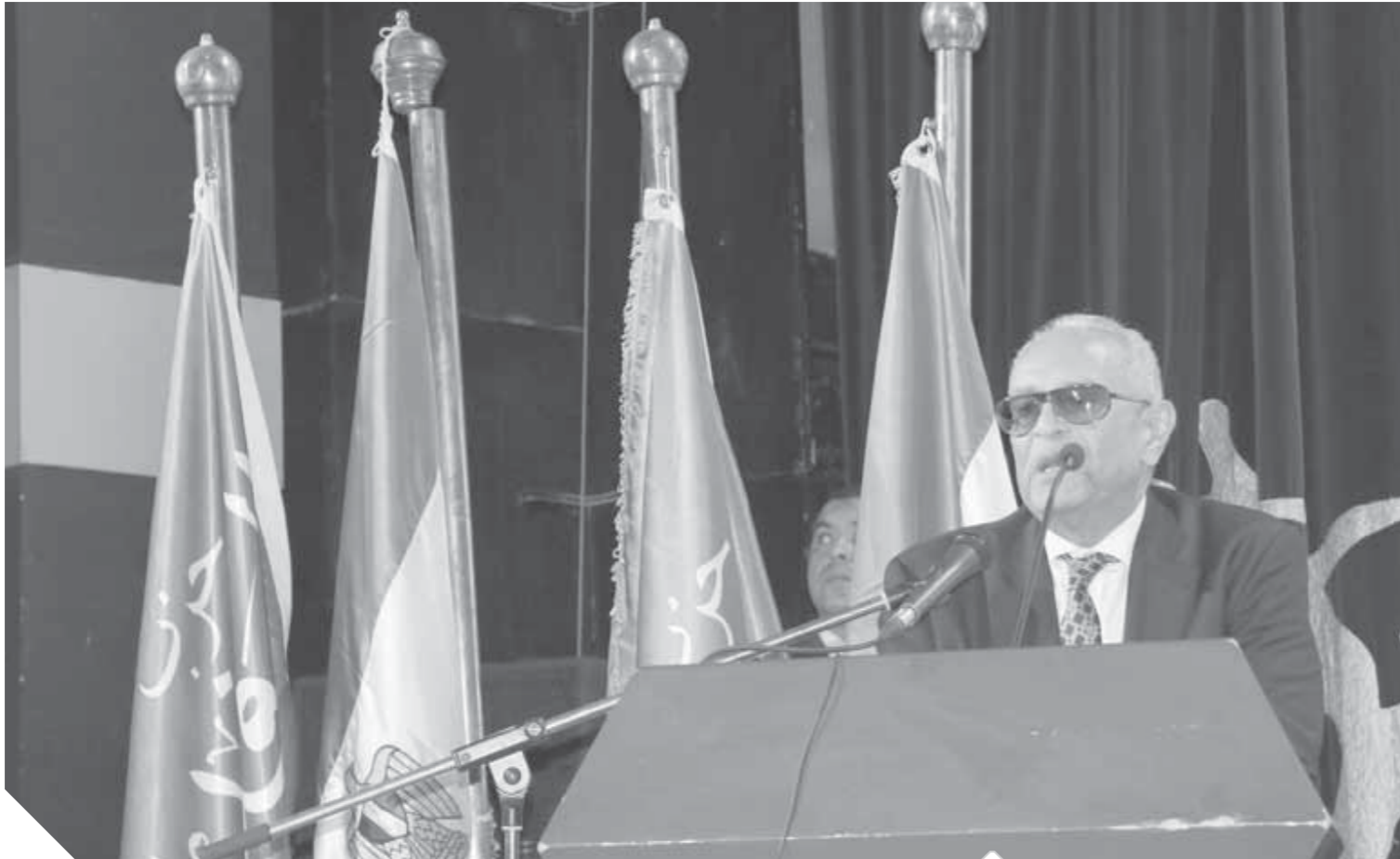
أبو شققة خلال إلقاء خطابه في بورسعيد

وجه المستشار بهاء الدين أبو شققة، رئيس حزب الوفد، رسالة شديدة الهجة للمتريصين بالدولة المصرية الذين يستخدمون حروب الجيل الرابع، قائلاً: «خستتم.. فان إرادة المصريين وصلابتهم هي الصخرة التي حطمت وستحطم عليها أي محاولات للنيل من الدولة المصرية ورئيسها والقوات المسلحة والشرطة الوطنية المصرية».