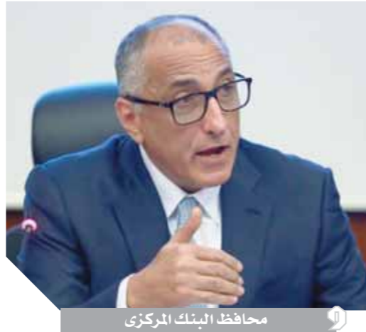
محافظ البنك المركزي