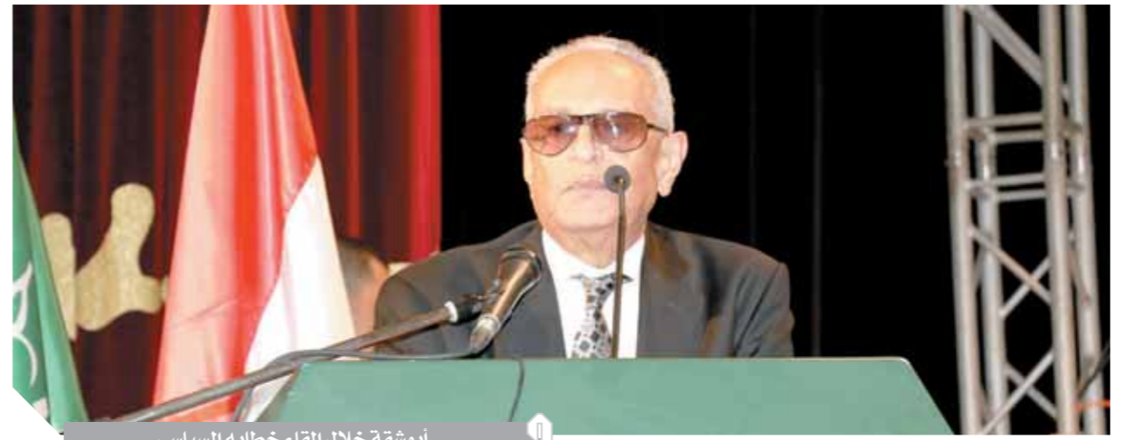
أبوشقة خلال إلقاء خطابه السياسي

بهاء الدين أبوشقة في تدشين مبادرة «الوفد مع المرأة» من بورسعيد: