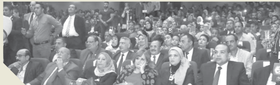
حضور كثيف في مؤتمر بورسعيد

إن الإرادة المصرية الصلبة تحلمت عليها هذه المخططات، لذلك نؤمن الدور الوطني لتقوات الشرطة المصرية، والتي كان لها الفضل وكان مستهدفاً يوم ٢٨ يناير ٢٠١١ ضرب الشرطة المصرية كخطوة أولى ثم يليها القوات المسلحة لتسقط مصر، لكن الشرطة استطاعت أن تتعافى وتعود لقوتها وأقوى من ذلك وذلك هي معجزة ليست مستغربة على إرادة المصريين التي تحمّل المعجزات وتجلى واضحة عندما تعرضت الدولة المصرية للخطر فتجد التلاحم الذي شاهدناه في ثورة ١٩١٩ والذي رأيناه في ٣٠ يونيو ورأينا فيه القوات المسلحة المصرية والشرطة الوطنية تقف إلى جوار الإرادة المصرية وتحمي مصر في الحدود والداخل وتتصدى بمعجزة للإرهاب الذي نيهت مصر والعالم وكانت مصر أول من سلب الأضواء وبته العالم لخطر الإرهاب الذي امتد إليهم وأحسوا أن خبرة المصريين السياسية كانت هي الأسبق واستطاعت أن