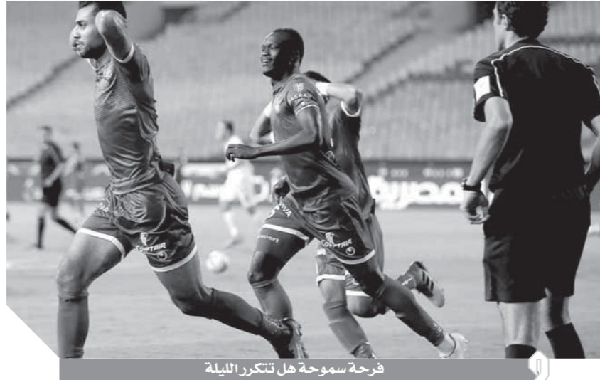
فرحة سموحة هل تتكرر الليلة