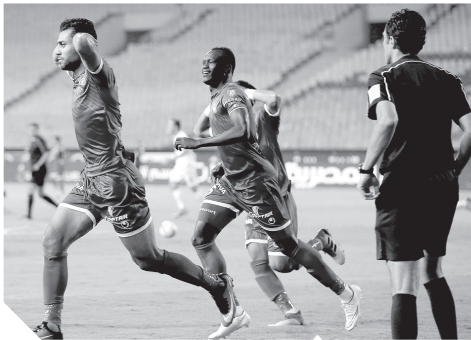
مواجهة قوية بين الزمالك والاتحاد في البطولة العربية

وكذلك مواجهة الوداد والنجم الساحلي، مؤكداً أن جميع الفرق التي وصلت إلى النهائي.