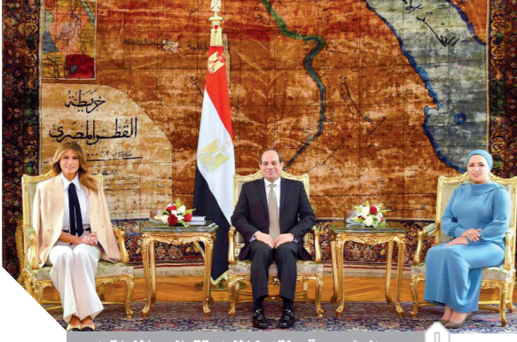
الرئيس وقرينته خلال استقبال ميلانيا ترامب

نجنا في تثبيت أركان الدولة وإعادة الثقة والهدوء والأمن