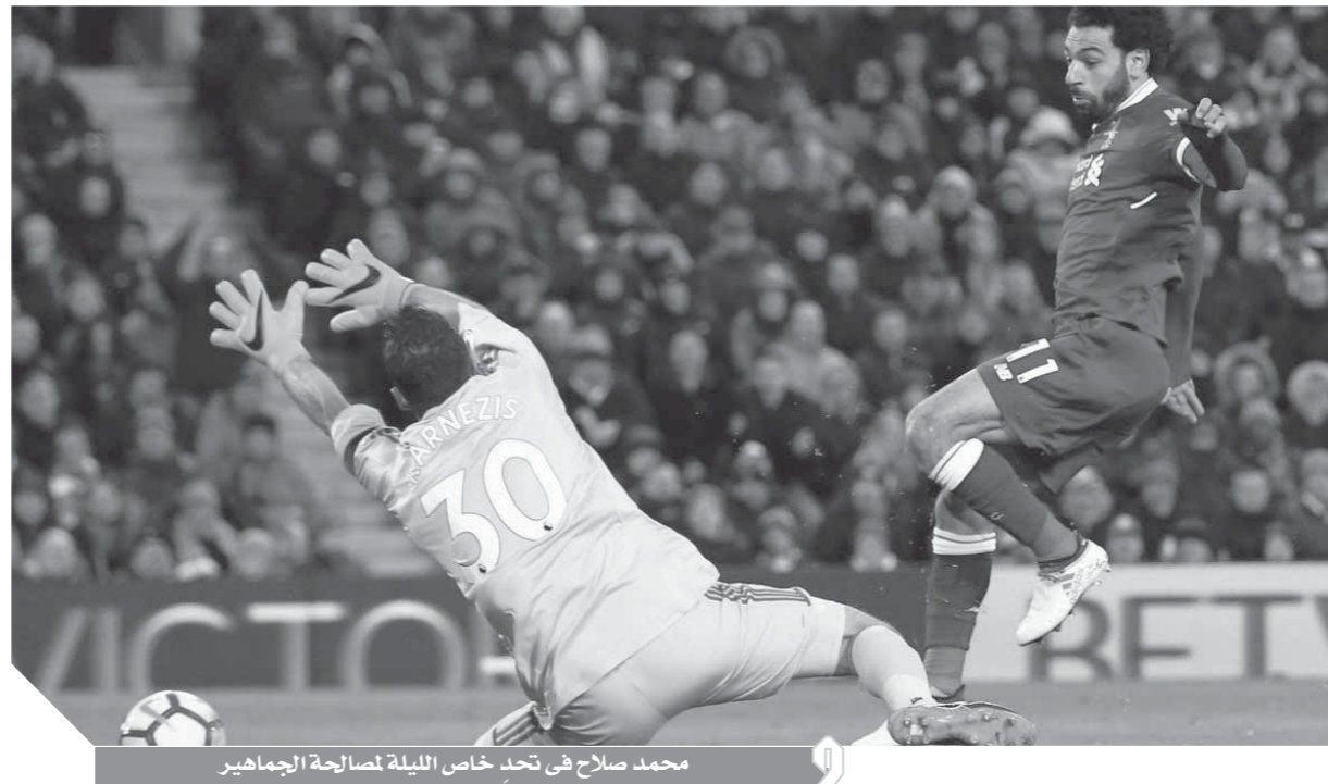
محمد صلاح فى تحد خاص لليلة لصاحبة الجماهير

وفى نفس الجولة، يخرج أرسنال الذى يعيش فترة جيدة سواء على المستوى المحلى أو بالدورى الأوروبي لمواجهة فولهام العائد للأضواء مؤخرا وذلك فى تمام الواحدة ظهرا، ولا يتوقع مشاركة المصرى محمد الننى فى اللقاء فى ظل تجاهل يوناي إيمرى له. كما يخرج العملاق الإنجليزي تشيلسى فى مهمة صعبة أمام ساوثهامبتون على ملعب الأخير فى تمام الثالثة والرابع، وأمله كبير فى أن يستغل سقوط أحد طرفي لقاء القمة ليحل محله.