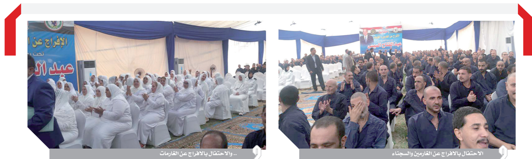
.. والاحتفال بالأفراج عن الغارمات