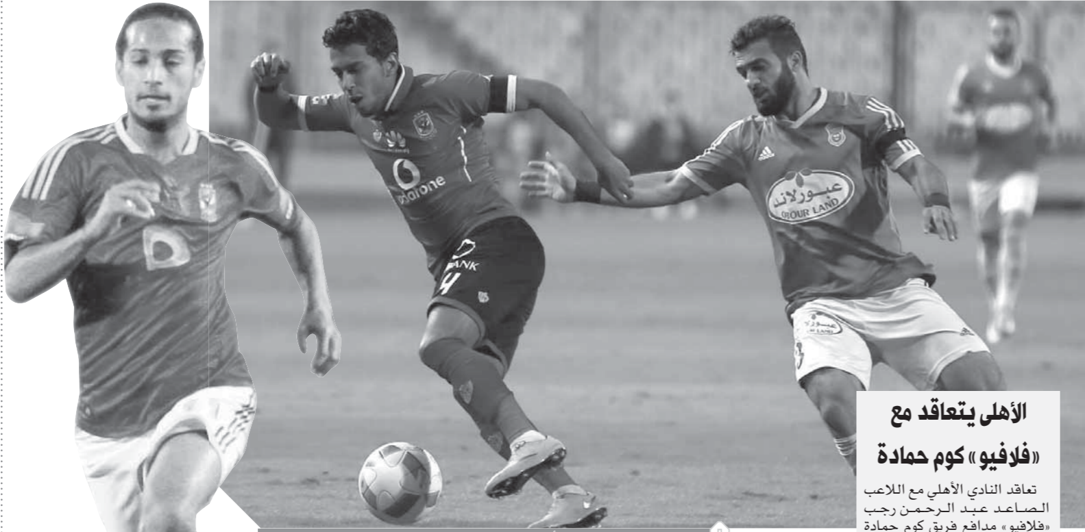
الأهلي يخشى صهوة الاتحاد