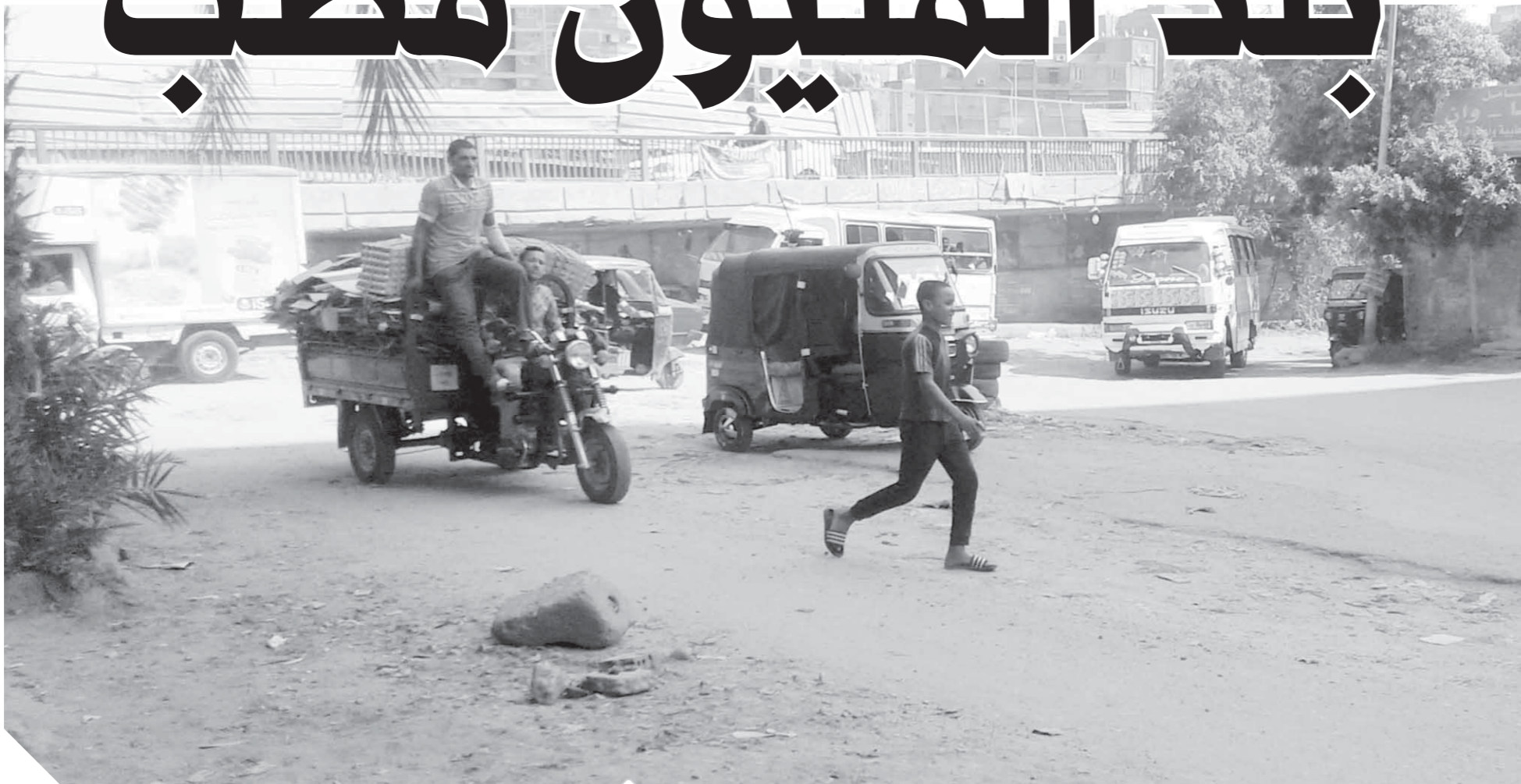
عشوائية المطبات وباء منتشر في شوارع مصر