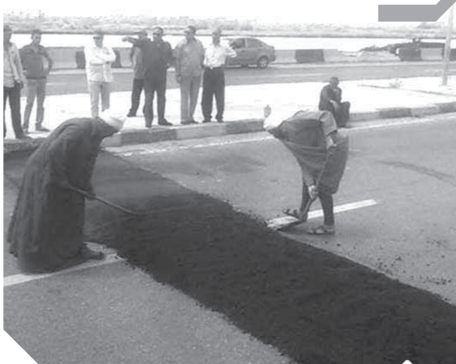
المطبات الصناعية غير المطابقة للمواصفات الفنية تسبب في العديد من الحوادث