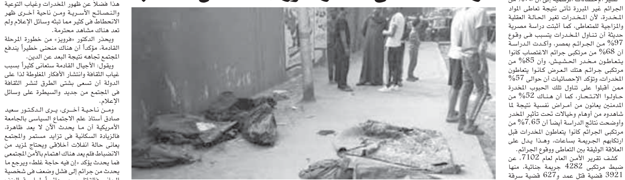
جريمة أطفال المرويطية أثارت جدلاً واسعاً

قتل وتعذيب وجحود الأبناء.. مشاهد قاسية زادت بشكل مثير مؤخراً.. أساليب قتل وحشية لم تكن نعتاد على سماعها.. آباء تجردوا من مشاعر الحنان والشفقة على أبنائهم وراحوا يزهقون أرواحهم ويسفكون دماءهم على آفقه سبب.. وأبناء انتزعت من قلوبهم الرحمة