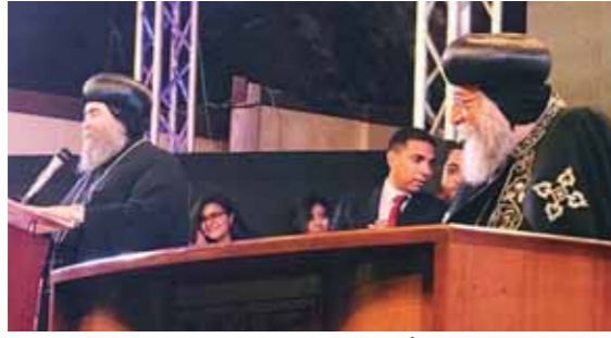
البابا تواضروس والأبنا يوانس أثناء احتفالية إيبارشية أسيوط