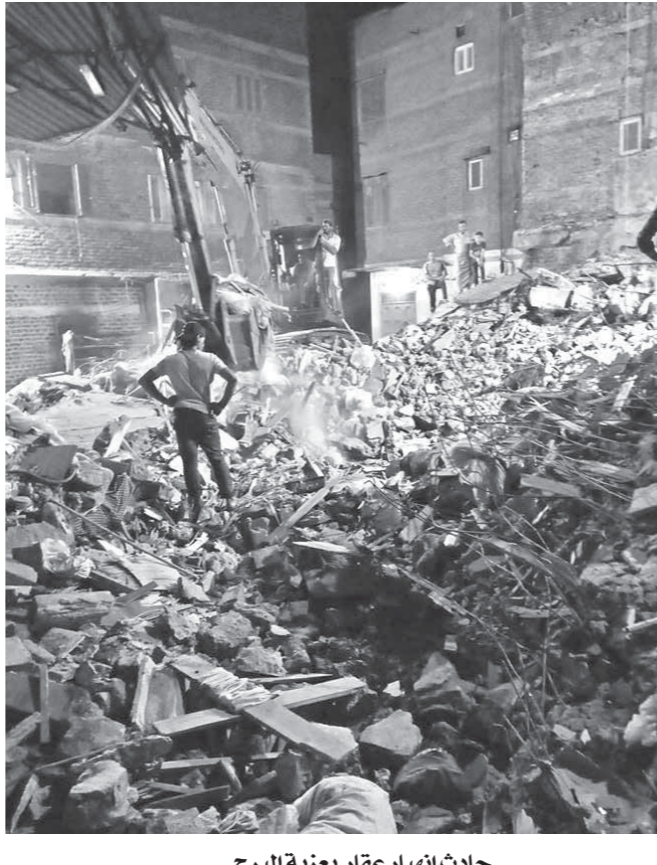
حادث انهيار عقار بعزبة البرج

عملت «الوفد» أن العقار صادر له قرار إزالة منذ عام 2016 ولم يتم تنفيذه بسبب طعن السكان على القرار. يذكر أن العقار مكون من 4 طوابق بمنطقة سوق السلمك بمدينة عزبة البرج وتمكن رجال المبناك من إخلاء المنطقة من بعض المبناك