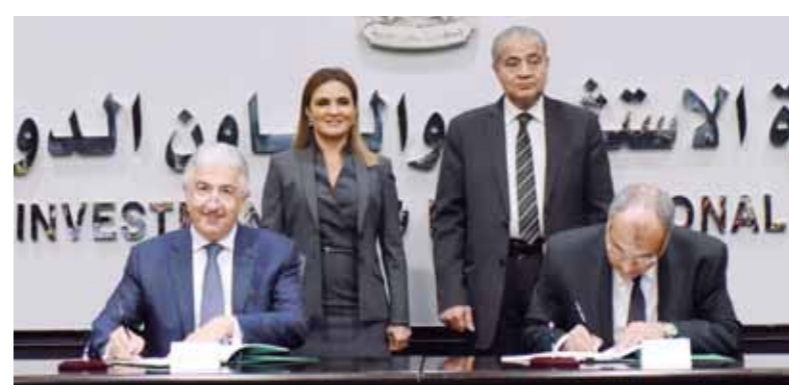
توقيع اتفاقية بين وزارة الاستثمار والمؤسسة الدولية الإسلامية

كانت تركز على البترول فقط، لكن وزارة الاستثمار والتعاون الدولي حرصت على التنسيق مع وزارة التموين لدعم السلع التموينية نظراً لدورها في توفير الأمن الغذائي. وأكد وزير التموين أن هذا الاتفاق يتيح فرصاً أكبر وتوفيراً للعملة الصعبة لوزارة التموين من أجل تقديم المزيد من السلع الأساسية للمواطنين، موضحاً أن هذا الاتفاق سيسهم في سد الفجوة الخاصة بالزيت والسكر وتأمين توفير سلع تموينية للمواطنين. وأكد المهندس هاني سنبلي، الرئيس التنفيذي للمؤسسة الدولية الإسلامية لتمويل التجارة، أن المؤسسة ستدعم مصر من أجل إحداث المزيد من التنمية وأن المؤسسة قامت بإبرام خمس اتفاقيات إطارية مع الحكومة المصرية بمبلغ قدره 2.9 مليار دولار أمريكي، مما يعد دليلاً على قوة علاقات الشراكة المستمرة.