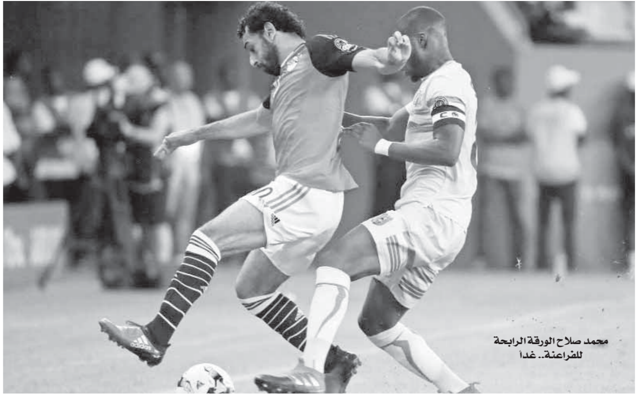
محمد صلاح الورقة الراحية للضراعة.. غدا

الأول الأربعاء بعد رحلة طيران شاقة استمرت لمدة ١٨ ساعة، حيث فشلت محاولاتهم للحضور إلى برج العرب بطائرة خاصة وانتقلوا من مطار النيجر إلى نيجيريا ومنها إلى القاهرة ثم إلى الإسكندرية. ولحق ببعثة منتخب ستة لاعبين محترفين وصولاً تبعاً في نفس اليوم مباشرة إلى مطار برج العرب، ويقود منتخب النيجر الإفراري فرانسوا زهوى البالغ من العمر ٥٧ عاماً وسبق له قيادة منتخب كوت ديفوار الأول خلال الفترة من 2010 وحتى 2012 بينما بدأ رحلته مع التدريب بنادي تولوز الفرنسي عام ١٩٩٩ تفوق فرانسوا زهوى مع منتخب كوت ديفوار، حيث قادته في 17 مباراة منها 6 مباريات في تصفيات أمم إفريقيا و٦ لقاءات في النهائيات عام 2012 بينما خاض ٥ مباريات ودية دولية، ولم يخسر سوى مباراة واحدة أمام زامبيا في نهائي أمم إفريقيا بكراتل الترجيح. لا يعتمد فرانسوا زهوى على طريقة لعب ثابتة حيث يلجأ للتبوع في طرق اللعب فتارة يلجأ للاعتماد على طريقة 3-3-4 وأحياناً أخرى يعتمد على 4-2-3-1 وخاض فرانسوا مع منتخب النيجر 12 مباراة منها 7 مباريات بتصفيات كأس أمم إفريقيا و3 مباريات بتصفيات كأس العالم، بالإضافة إلى وديتين دوليتين. ولعب منتخب النيجر قبل مواجهة مصر ثلاث مباريات ودية وتمكن من الفوز خارج ملعبه على موريتانيا بهدفين للناشي وتعادل أمام إفريقيا الوسطى بثلاثة لقاءات التجريبية خلال يوميه الماضى على أوغندا بهدفين مقابل هدف.