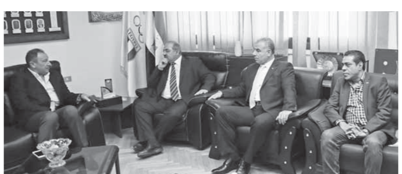
الخطيب في زيارته للجنة الأولمبية