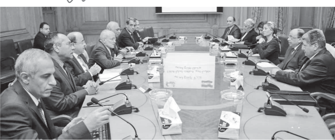
اجتماع وزراء البيئة والإنتاج الحربي والتنمية المحلية لبحث تدوير المخلفات