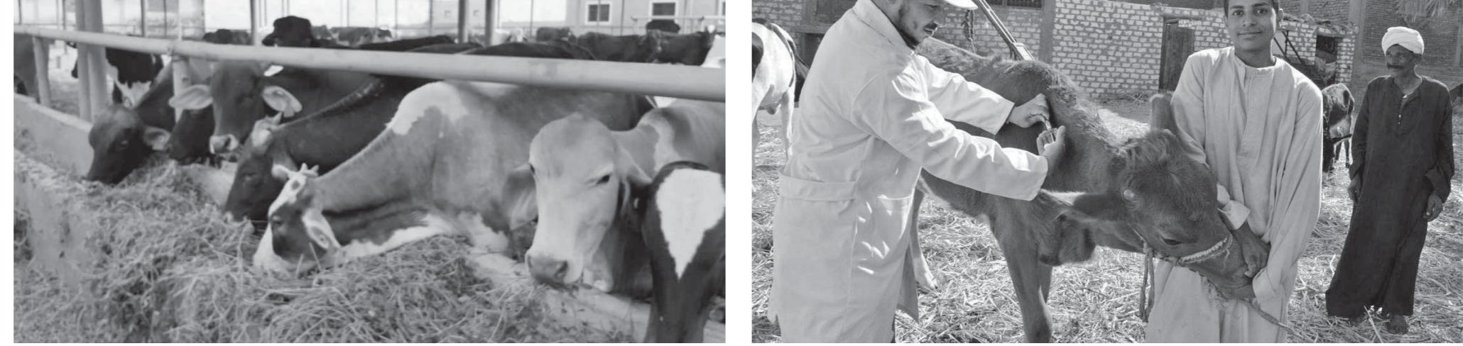
متابعات مستمرة من الوحدات البيطرية لتحصين الماشية