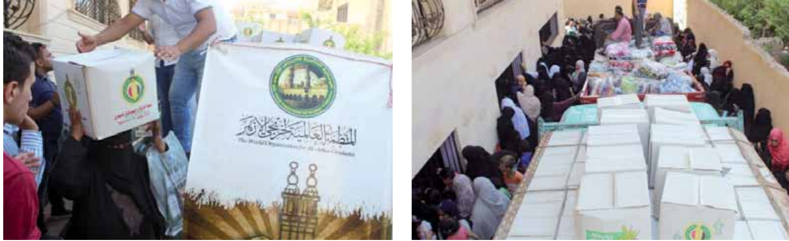
مساعدات إنسانية لأهالي رفح والشيخ زايد

والشيخ زايد، ناقشوا خلالها العديد من القضايا المعاصرة، بهدف تنقيح الشباب وتوعيتهم بمخاطر الأفكار الإرهابية التي تبثها الجماعات المتطرفة، وما تمثله من خطر على الأوطان والجماعات. ويشارك في القافلة، التي يستمر عملها لمدة أسبوع، المنظمة العالمية لخريجي الأزهر ومجمع البحوث الإسلامية وبيت الزكاة والصدقات المصري، بالتعاون مع وزارة الشباب