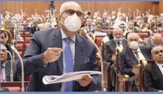
أبو شقة يتحدث في جلسة الشيوخ، أمس