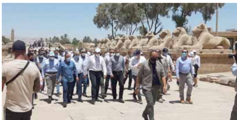
رئيس الوزراء خلال تفقده أعمال ترميم «طريق الكباش» بالأقصر

«مدبولى» يأمر بتوفير الميزانية المطلوبة لتطوير «طريق الكباش» تحويل الأقصر إلى أكبر متحف مفتوح فى العالم