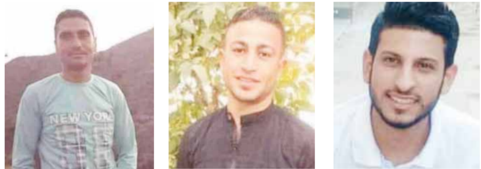
ضحايا حادث حريق قبرص