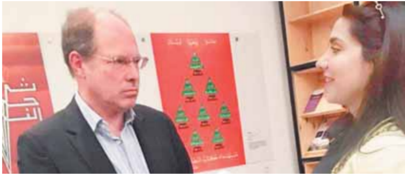
بلان يتحدث لـ الوفد

المصري يثق في نفسه جداً لدرجة أنه لا يرى الحقائق الصعبة التي تحيط به وفي بعض الأحيان هذه مميزة، وتنعكس هذه الثقة على مستقبل البلد، فمناصري مصر عريق مستمد من الحضارة الفرعونية، وبالتأكيد مستقبلها مثل ماضيها سيكون عظيماً، وأنا أثق في الشعب المصري أنه سيصنع مستقبلاً مهيراً. ● خلال إقامتك بمصر تعايشت مع شعبها ولست مميزاته ومشكلاته.. حدثنا عن حياتك خلال هذه الفترة.. وما رأيك في الشعب المصري؟ - من يتعرف على الشعب المصري يجب التكثير من عاداته والعلاقات معه، وأكثر شيء مؤثر هي إبتسامته الشعب المصري وطيّبه، والمصري مفتوح بشكل عام، والفرنسيون متفهمون ذلك، فلا يشعر المواطن الفرنسي الذي يزور مصر لأول مرة بالغربة، والمصريون يتفهمون ذلك جيداً لكل من يتعرف عليهم. ● استقرت في مصر لمدة ٤ سنوات خلال عملي كباحث اقتصادي بالمركز الفرنسي للأبحاث العلمية.. كيف ترى أوضاع مصر الاقتصادية؟ - ألفت كتاباً عن اقتصاد مصر منذ عشرين عاماً، فالدولة المصرية تمتلك مقومات اقتصادية كبيرة يجب أن نستغلها بشكل أفضل وأسرع، ونستثمر في البحر الأحمر وقناة السويس، ولتسترد مصر الريادة مرة أخرى عليها أن تستغل مواردها البشرية، وعلى المصريين أن يخرجوا من الوادي، وحالياً هذه العقيدة بدأت تتحقق بالزحف تجاه الصحراء من خلال إنشاء المدن الجديدة.