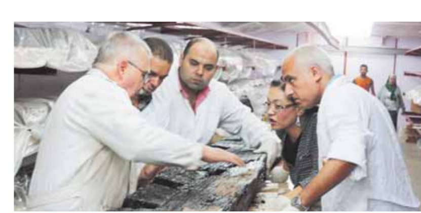
البعثة المصرية أثناء فحص الآثار المكتشفة

مشروع المتحف المصري الكبير منذ عام ٢٠٠٦، حين قدمت الجايكا الدعم المالي من خلال فريقين ميسرين للمساعدة الإنمائية الرسمية في بناء المتحف بناءً على طلب من الحكومة المصرية. ومنذ عام ٢٠٠٨، قدمت الجايكا تعاوناً ودعمًا فنياً من خلال المشروع المصري الياباني المشترك لترميم وتوثيق ونقل ٧٢ قطعة أثرية، من بينها عدد من القطع الخاصة بالملك توت عنخ آمون، من المتحف المصري بالتحرير إلى المتحف المصري الكبير، وذلك من خلال التعاون المشترك بين الخبراء اليابانيين، حيث شارك حوالي ٩٠ خبيراً يابانياً في هذا المشروع، كما تم توفير عدد من الأجهزة الفنية ذات التقنية العالية ضمن المشروع مثل الميكروسكوب الرقمي وجهاز محمول للتصوير بالأشعة السينية ورافعة شوكية كهربائية لحمل الآثار الثقيلة بأمان. وقد أعرب السفير نوكي مساكى سفير اليابان بالقاهرة، عن فخره بمشاركة الجايكا في الحفاظ على كنوز الآثار المصرية للأجيال القادمة من خلال مشروع المتحف المصري الكبير.