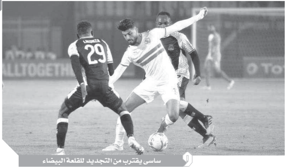
ساسى يقترب من التجديد للقلعة البيضاء