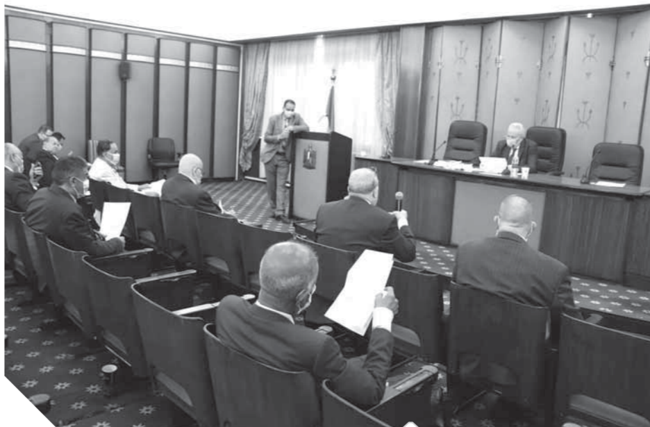
جانب من اجتماع اللجنة التشريعية

مجلس النواب اقترح إعادة المادة الثانية من مشروع قانون مكافحة الغش فى الامتحانات إلى اللجنة التشريعية لدراستها بالتنسيق مع الحكومة، مشيراً إلى أهمية «المحمول» فى اطمئنان الأسر على أبنائهم أثناء ذهابهم إلى لجان الامتحان لأنه الوسيلة الوحيدة للتواصل ومنع تكديس أولياء الأمور أمام اللجان.