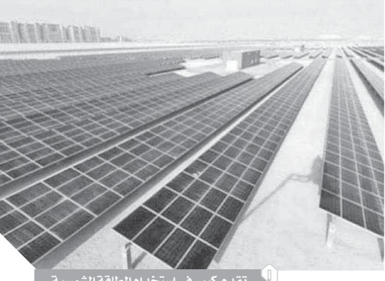
تقدم كبير في استخدام الطاقة الشمسية