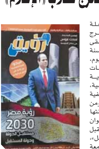
الدولى الشهير أحمد حسام