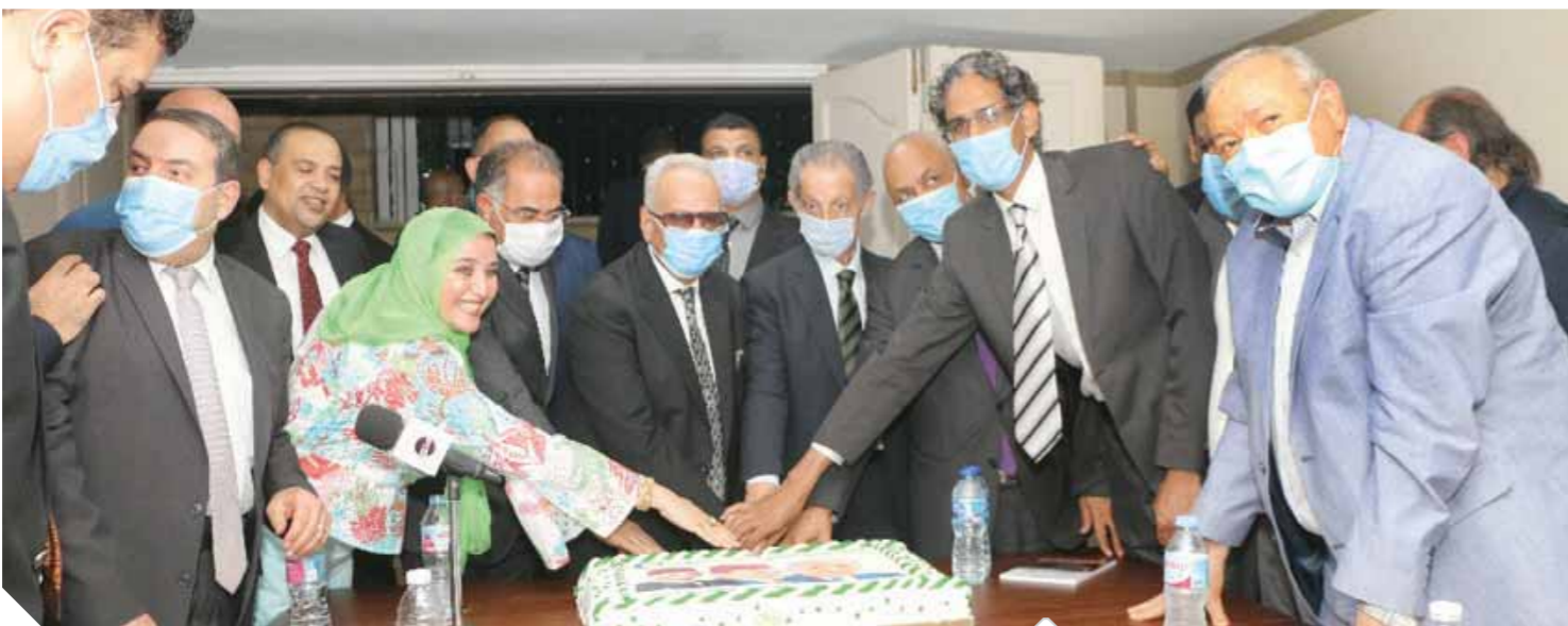
أبوشقة يحتفل مع قيادات الوفد بافتتاح المقر الجديد للحزب بـ٦ أكتوبر

الوفد عمود الخيمة لأي نظام ديمقراطي في مصر نحتاج إلى برلمان توافقي تمثل فيه كل القوى الوطنية