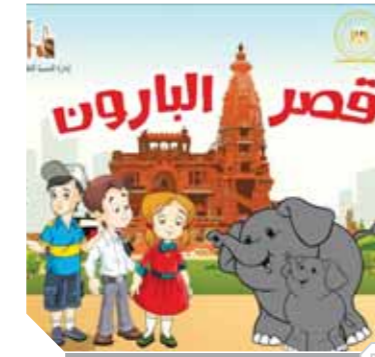
كتيب قصر البارون

بالتعاون مع فريق عمل قصر البارون ومركز أبحاث الدراسات، وقد تمت مراعاة الاحتياطات اللازمة للحفظ على صحة وسلامة الأطفال من خلال التثبيت عليهم بارتداء الكمامات وتقليل الأعداد والحفاظ على المساحة الآمنة أثناء الجولة الإرشادية.