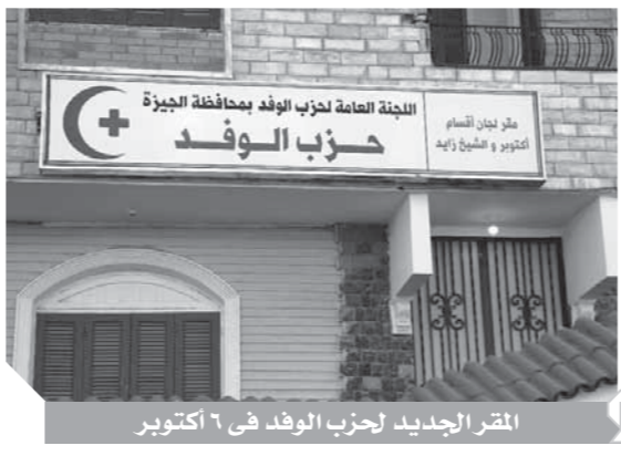
المقر الجديد لحزب الوفد فى ٦ أكتوبر