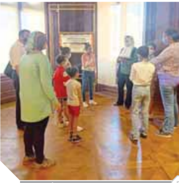
جانب من البرنامج التعليمي للأطفال