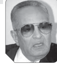
بهاء الدين أبوشقة