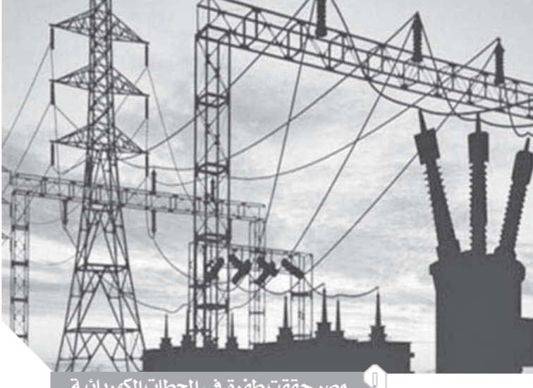
مصر حققت طفرة في المحطات الكهربائية