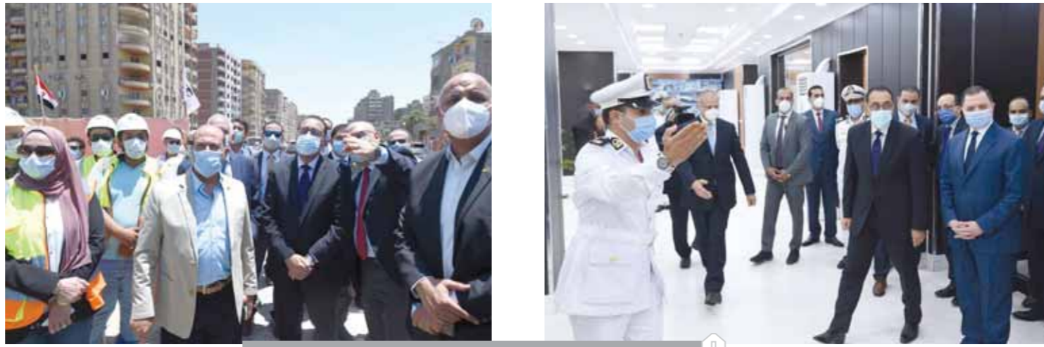
مدبولي خلال جولته في بعض المشروعات

وأشار رئيس الوزراء بتنفيذ المشروع، ووجه الشكر للجهات المنفذة على جودة التشطيب، مؤكداً أن هذا المشروع يقع في منطقة ميمية، ومؤكداً سرعة الانتهاء من التنفيذ. من جانبه، أشار وزير الإسكان إلى أن هذا المشروع سيتم بالجماعات بسكن بديل بضوابط محددة لسكان المناطق العشوائية التي يتم تطويرها بمحافظة الجيزة، ومنها أهالي منطقة سن العجوز، كما أطلع رئيس