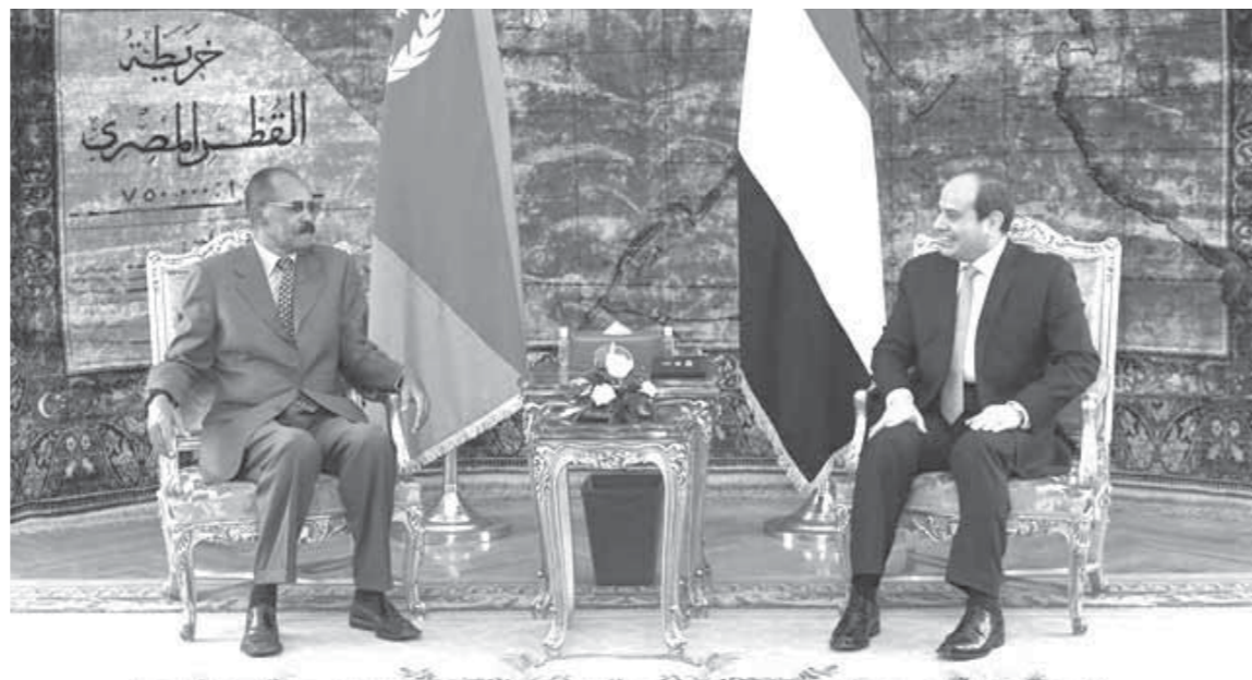
السيسي خلال استقباله رئيس إريتريا